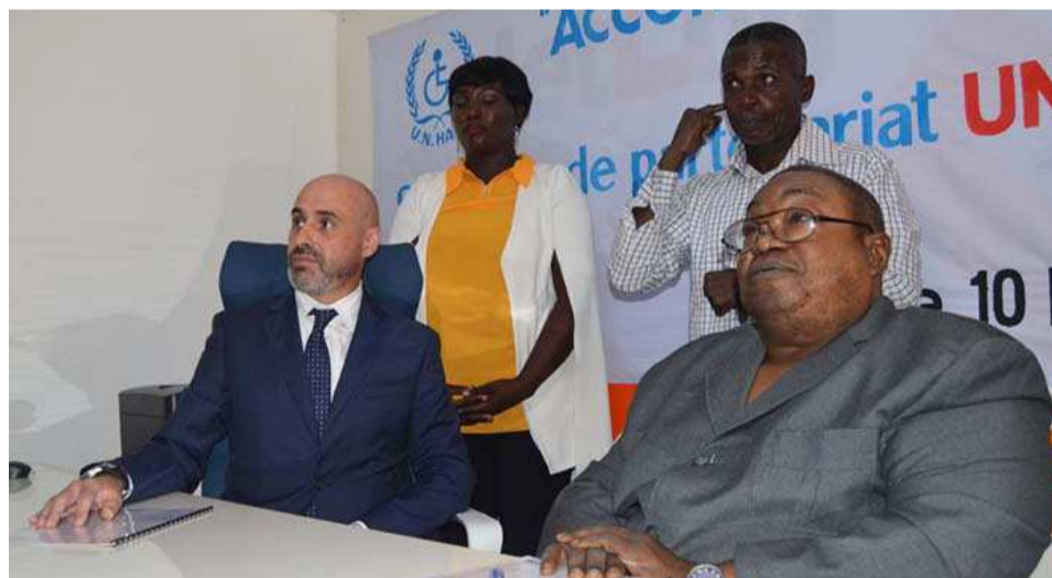
Les représentants des deux structures après la signature de l'accord

La signature de l'accord de partenariat entre le Réseau des chambres des experts européens (Rceedao), département de l'Afrique de l'ouest, et l'Union nationale des associations des personnes handicapées du Congo (Unhaco) a eu lieu le 10 mai, à Brazzaville.