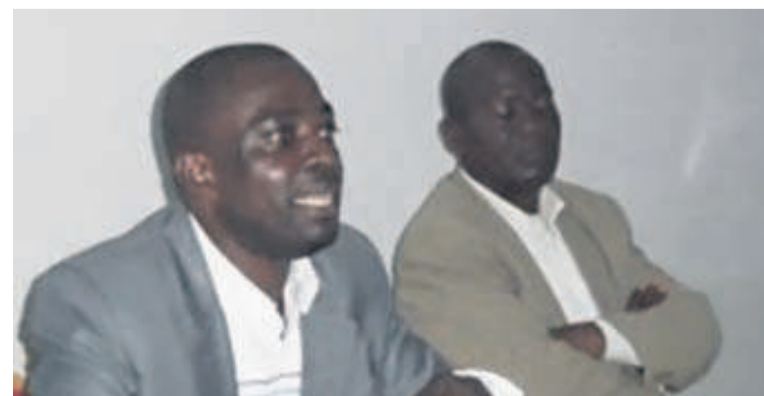
Prince Arnie Matoko présentant son ouvrage