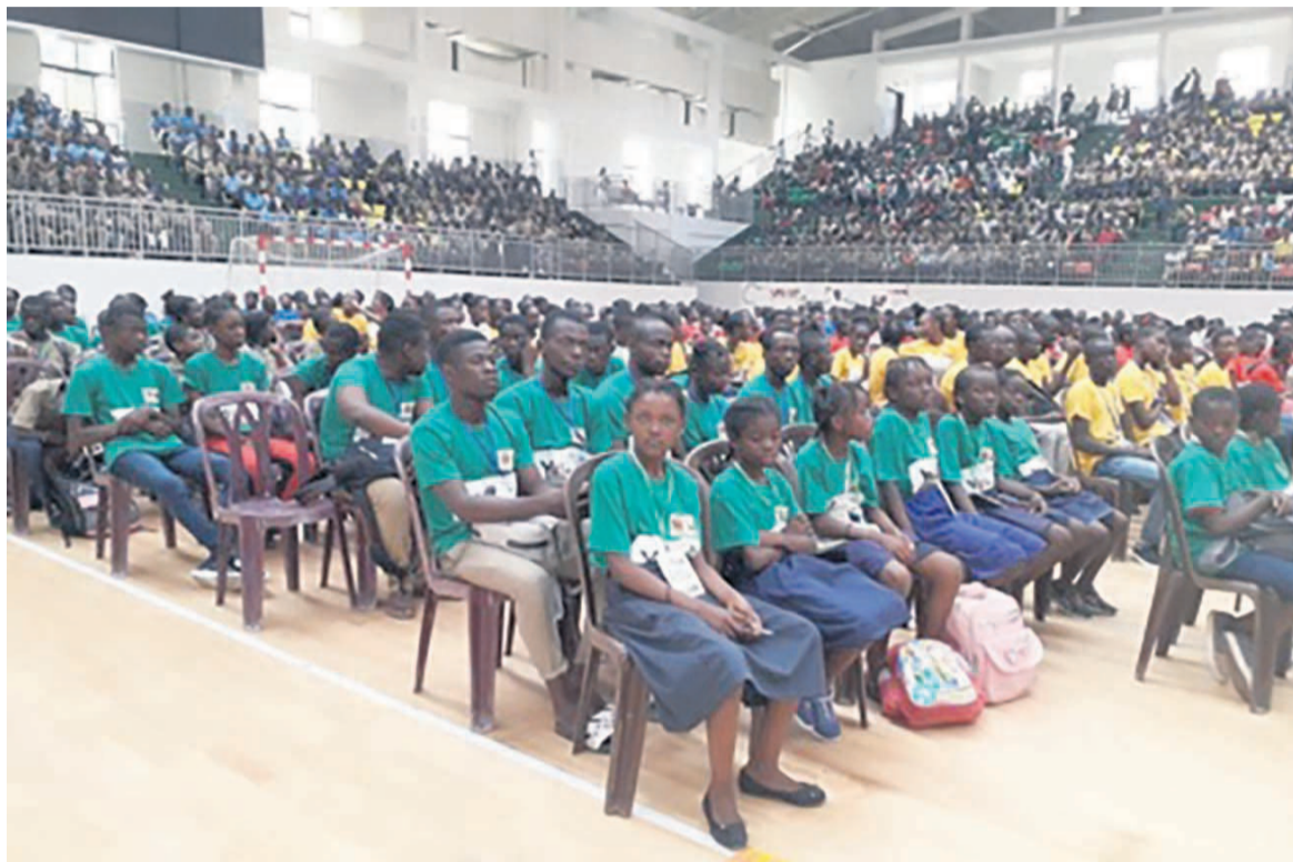
Les élèves attendant le coup d'envoi de la compétition inter-écoles

Le ministre de l'Enseignement primaire, secondaire et de l'alphabétisation, donnant le coup d'envoi du challenge, a souligné que l'initiative intègre la vision du gouvernement d'amener les enfants à apprendre en toute circonstance et à tous âges. « Le challenge inter-écoles Yekola permet une meilleure acquisition et fixation des connaissances et des acquis scolaires », a indiqué Anatole Collinet Makosso. La compétition intellectuelle est un moyen pour les élèves de combler leurs lacunes, a-t-il poursuivi.