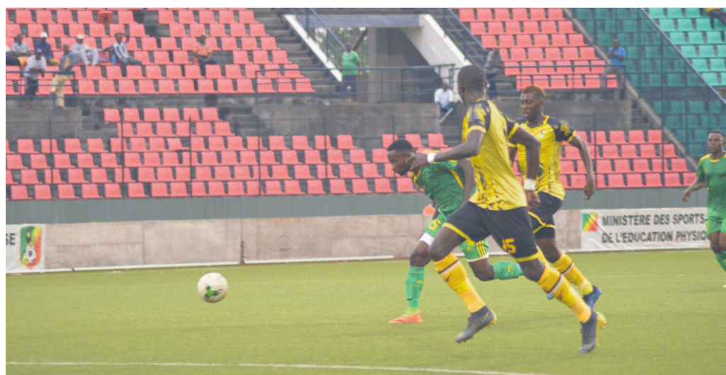
Etoile du Congo et Diables noirs se livrent à un duel à distance