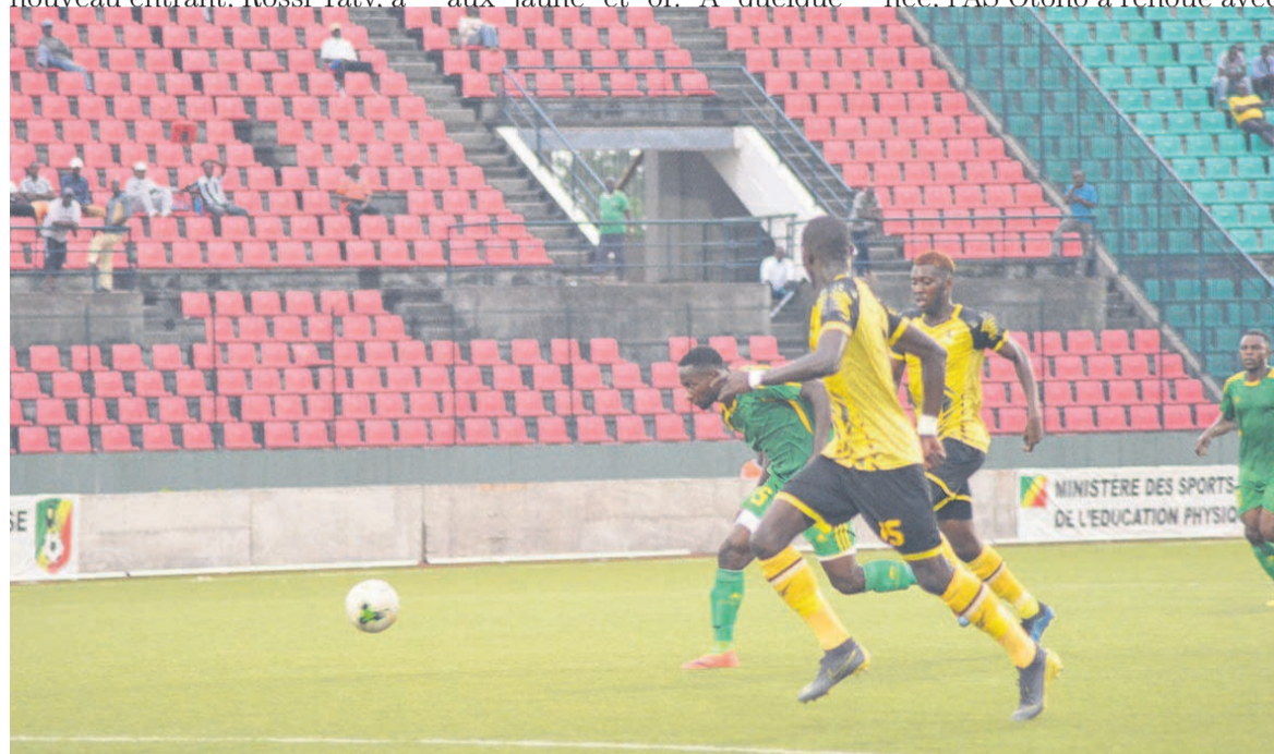
Etoile du Congo et Diabes noirs se livrent à un duel à distance