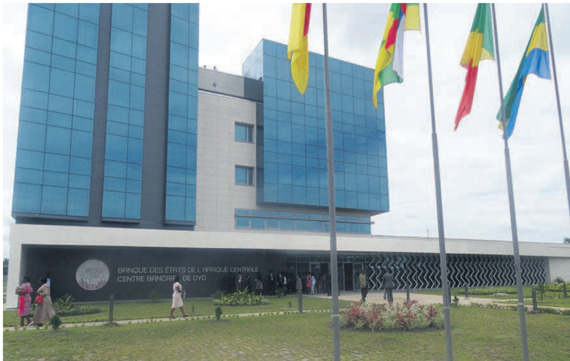
La façade principale du siège de l'agence de la Beac à Oyo

En plus, la façade principale associe, dans un élan vertical, deux volumes de verres qui forment un cristal émergent d'un bloc de pierres. « Cette métaphore géologique confère la singularité et l'amplitude de l'édifice en définissant une esthétique à la fois résolument contemporaine et en même temps capable d'imposer l'image et la stature d'une institu-