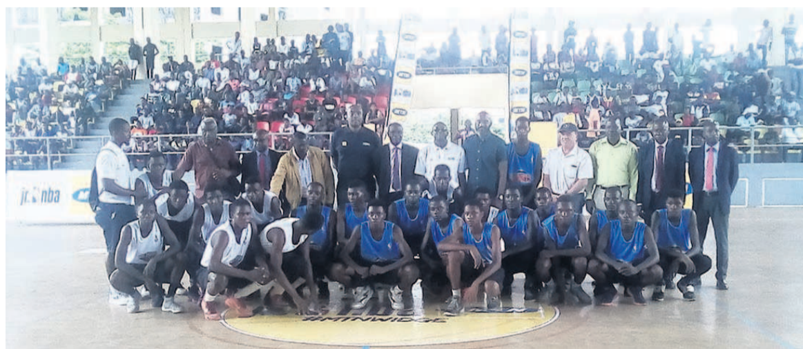
Photo de famille des athlètes avec les organisateurs

L'équipe de Camara-Laye, jouant sous le label des Pelicans, a battu celle du lycée de la Révolution 29 à 6, le 11 mai, lors du lancement de la compétition. Celle-ci réunit trente établissements scolaires jusqu'en août prochain.