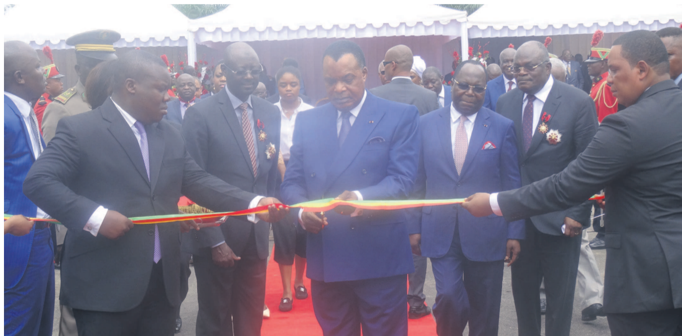
La coupure du ruban symbolique par le président Denis Sassou N'Guesso, le 13 mai à Oyo