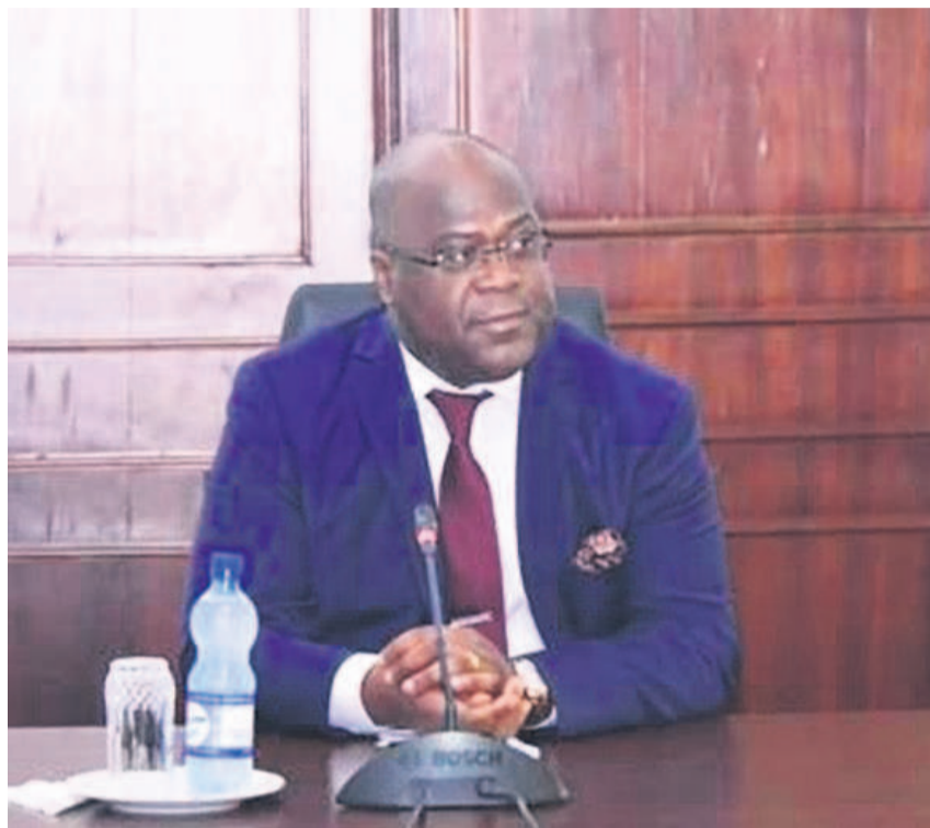
Le président de la République, Félix Tshisekedi