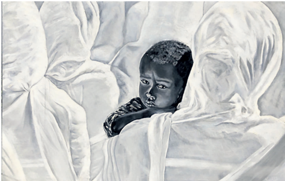
Une œuvre picturale de l'artiste

« Ma deuxième exposition était la plus importante à mes yeux car c'était pour moi ma vraie première exposition. J'ai exposé le travail de ces cinq dernières années. Elle s'est déroulée au Double Tree by Hilton, du 25 février au 16 mars 2019 »