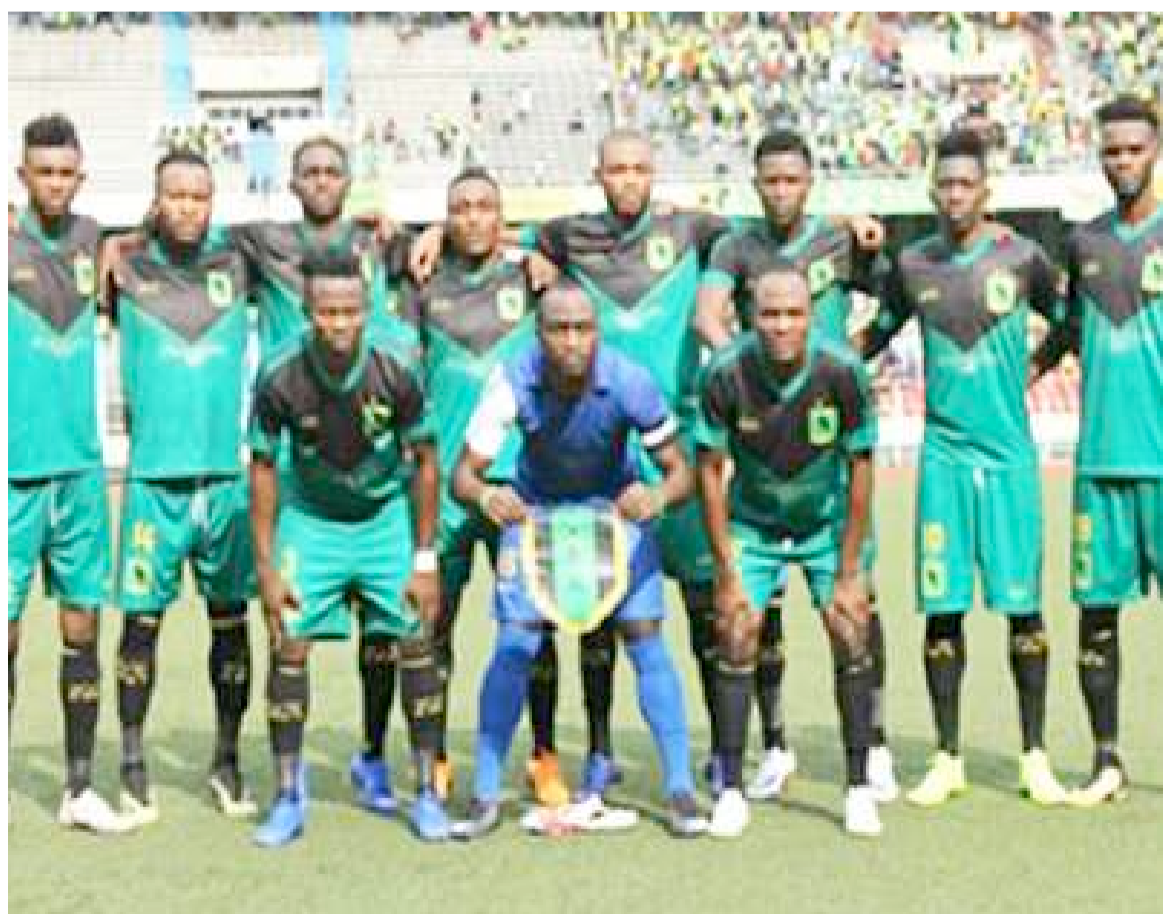
V.Club de Kinshasa