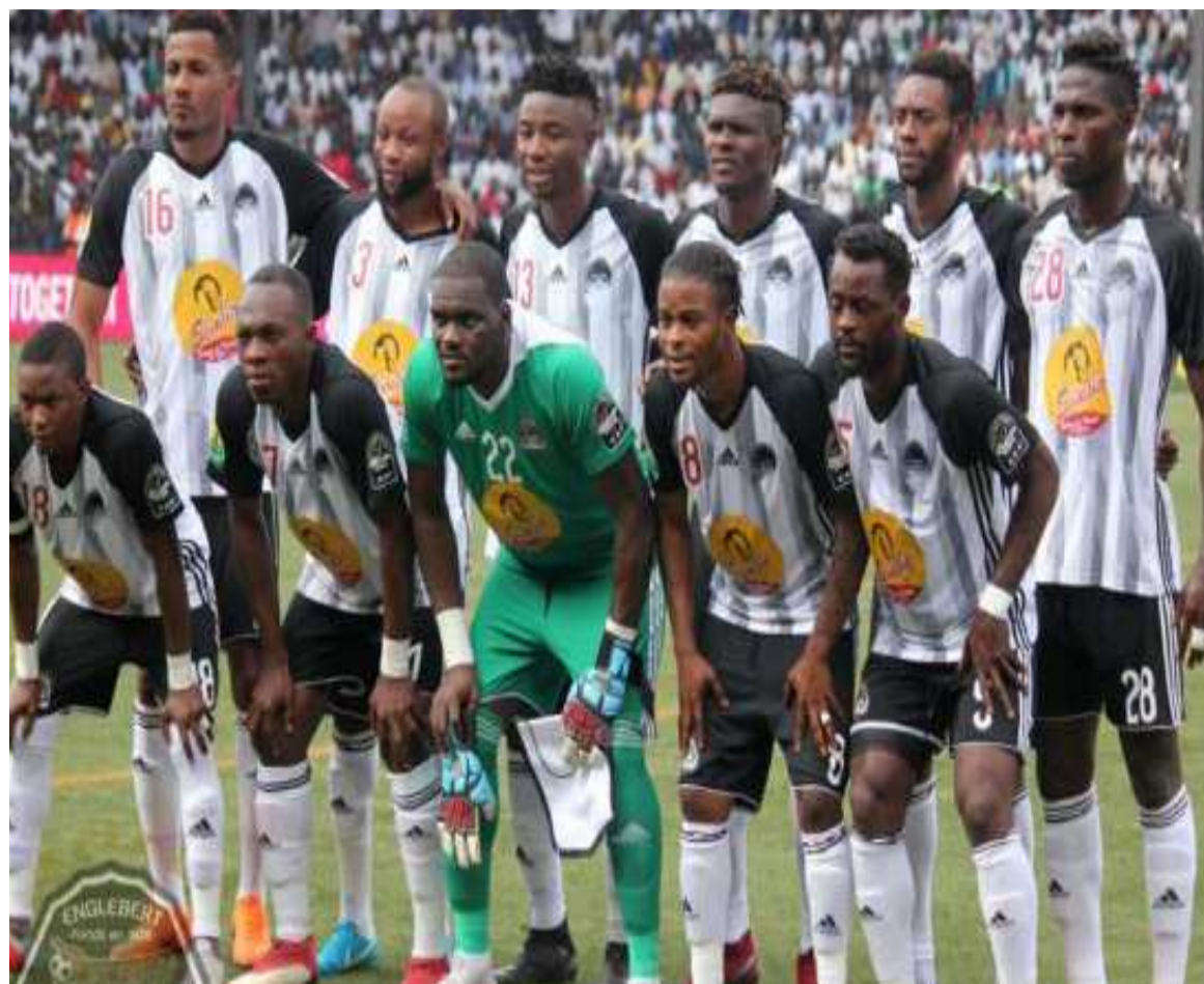
TP Mazembe, champion du Congo 2019