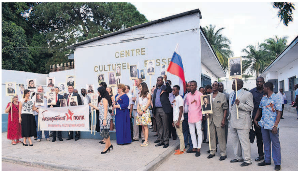
Les participants à l'événement devant l'espace Youri. A. Gagarine

Plusieurs personnes ont pris part aux activités de cette journée de la marche annuelle du « régiment immortel », au CCR. Une minute de silence a été observée à la mémoire de tous ceux qui sont morts dans les champs de bataille. Les invités ont tous reçu le ruban de Saint-Georges, l'un des principaux symboles de la Victoire et de remerciement aux anciens