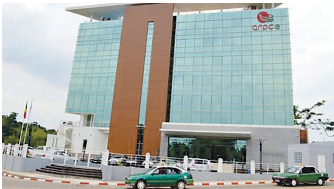
Le siège de l'Arpce à Brazzaville

Parmi les bons élèves en termes de tarifs les plus abordables, l'on note le Soudan (1,2 dollar), le Nigeria (2,74 dollars), le Rwanda (2,8 dollars), le Burundi (3,3 dollars) ou encore le Cameroun et le Niger (tous les deux à 3,48 dollars). Le Congo vient avec 4,45 dollars, pas très loin de la belle affiche et mieux que la République démocratique du Congo alignée à la quarante-deuxième place, avec 12,58 dollars le GB, soit un