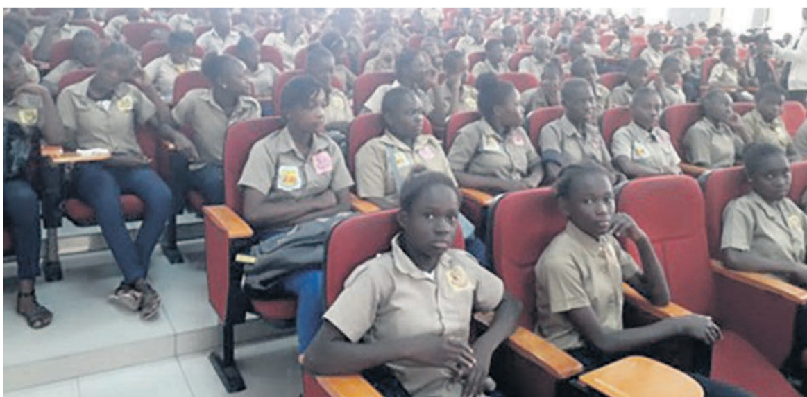
Les élèves lors du lancement du programme « Yali kids »