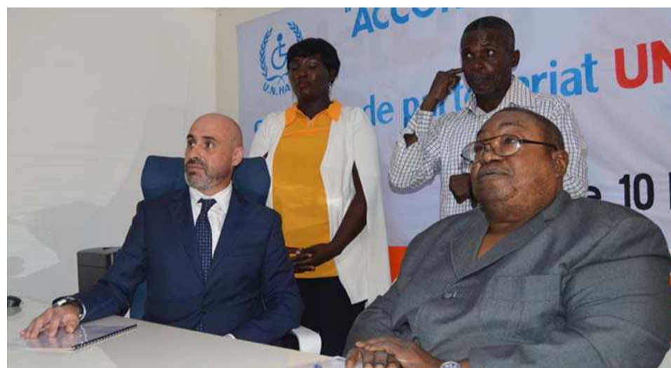
Les représentants des deux structures après la signature de l'accord

La signature de l'accord de partenariat entre le Réseau des chambres des experts européens (Rceedao), département de l'Afrique de l'ouest, et l'Union nationale des associations des personnes handicapées du Congo (Unhaco) a eu lieu le 10 mai, à Brazzaville.