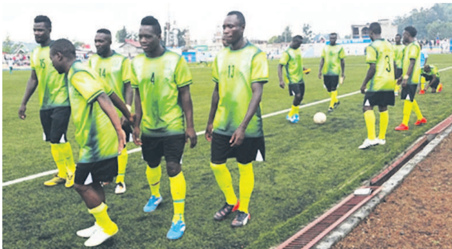
Qualifiée en phase finale, AS Nyuki défendra son titre de vainqueur de la Coupe du Congo de football

Dans la zone de développement ouest basée à Kinshasa, tout se jouera lors de la troisième journée. Dans le groupe A, l'AC