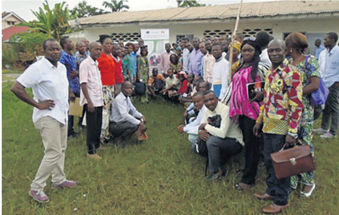
Photo de famille après le focus