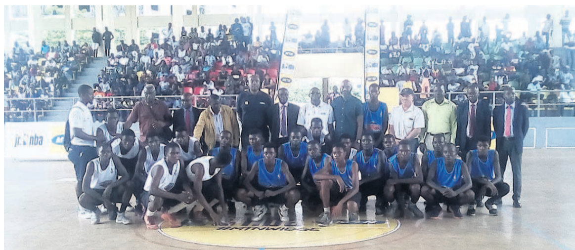
Photo de famille des athlètes avec les organisateurs

L'équipe de Camara-Laye, jouant sous le label des Pelicans, a battu celle du lycée de la Révolution 29 à 6, le 11 mai, lors du lancement de la compétition. Celle-ci réunit trente établissements scolaires jusqu'en août prochain.