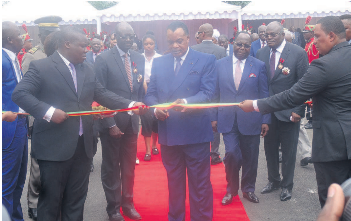
Coupe du ruban symbolique par le président de la République

En plus, la façade principale associe, dans un élan vertical, deux volumes de verres qui forment un cristal émergent d'un bloc de pierres. « Cette métaphore géologique confère la singularité et l'amplitude de l'édifice en définissant une esthétique à la fois résolument contemporaine et en même temps capable d'imposer l'image et la stature d'une institu-