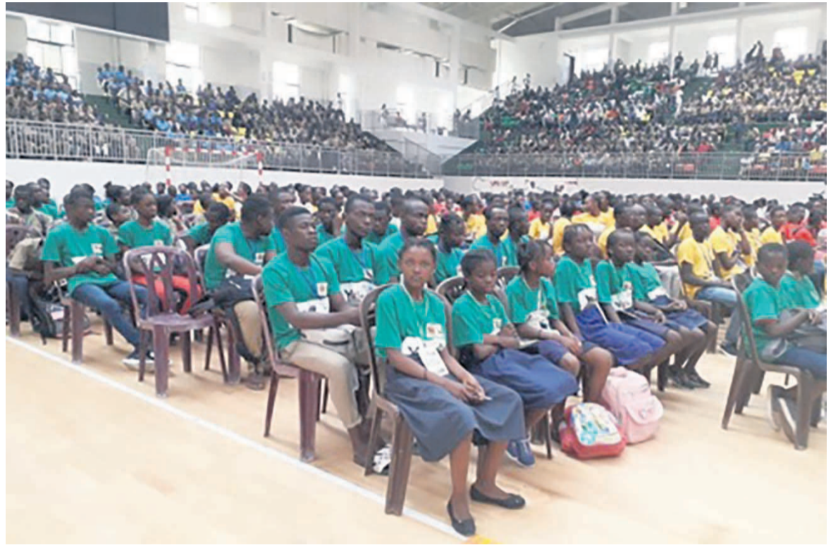
Les élèves attendant le coup d'envoi de la compétition inter-écoles

Le ministre de l'Enseignement primaire, secondaire et de l'alphabétisation, donnant le coup d'envoi du challenge, a souligné que l'initiative intègre la vision du gouvernement d'amener les enfants à apprendre en toute circonstance et à tous âges. « Le challenge inter-écoles Yekola permet une meilleure acquisition et fixation des connaissances et des acquis scolaires », a indiqué Anatole Collinet Makosso. La compétition intellectuelle est un moyen pour les élèves de combler leurs lacunes, a-t-il poursuivi.