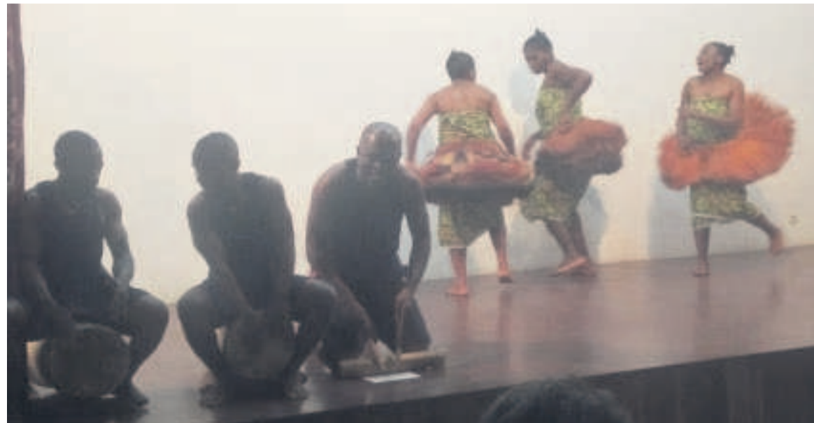
Le groupe Ndimba sur scène

Le groupe a fait son entrée sur scène par la chanson « Ambanda », exprimant le mariage polygame. A travers cette chanson, les femmes