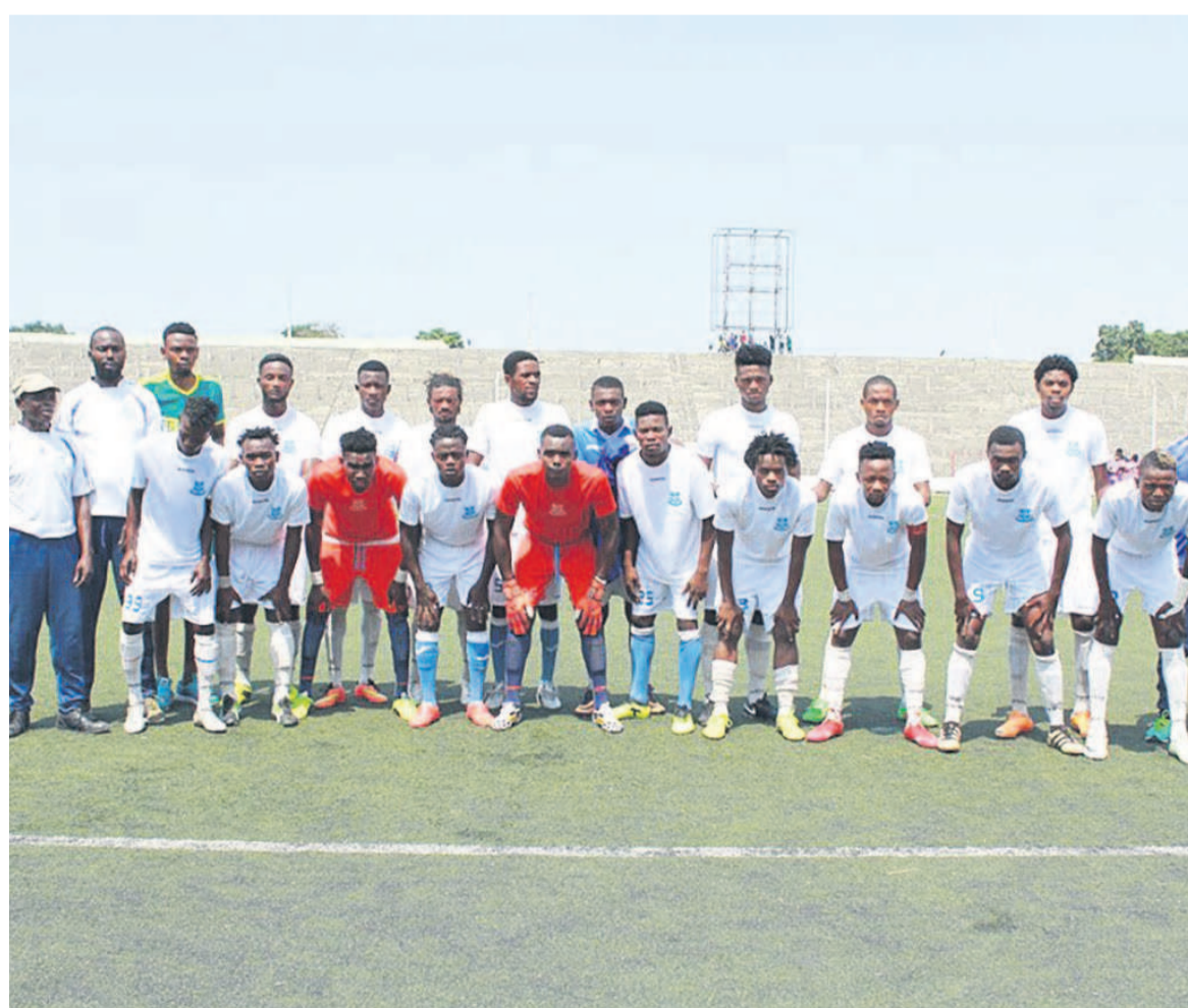
Real de Kinshasa qualifié pour la phase finale de la 55e Coupe du Congo de football

Real de Kinshasa est le cinquième club qualifié en