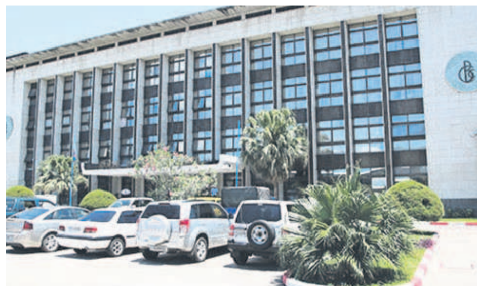
Le siège de la Banque centrale du Congo