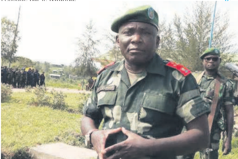
Le général Gabriel Amisi en avant-plan