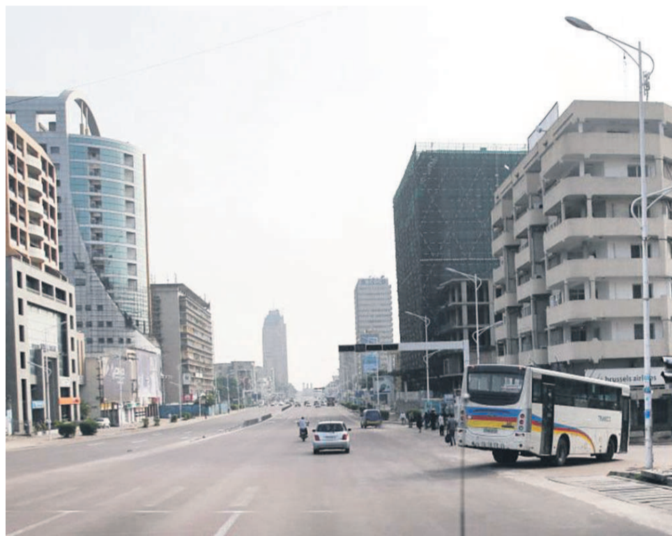
Le centre-ville de Kinshasa