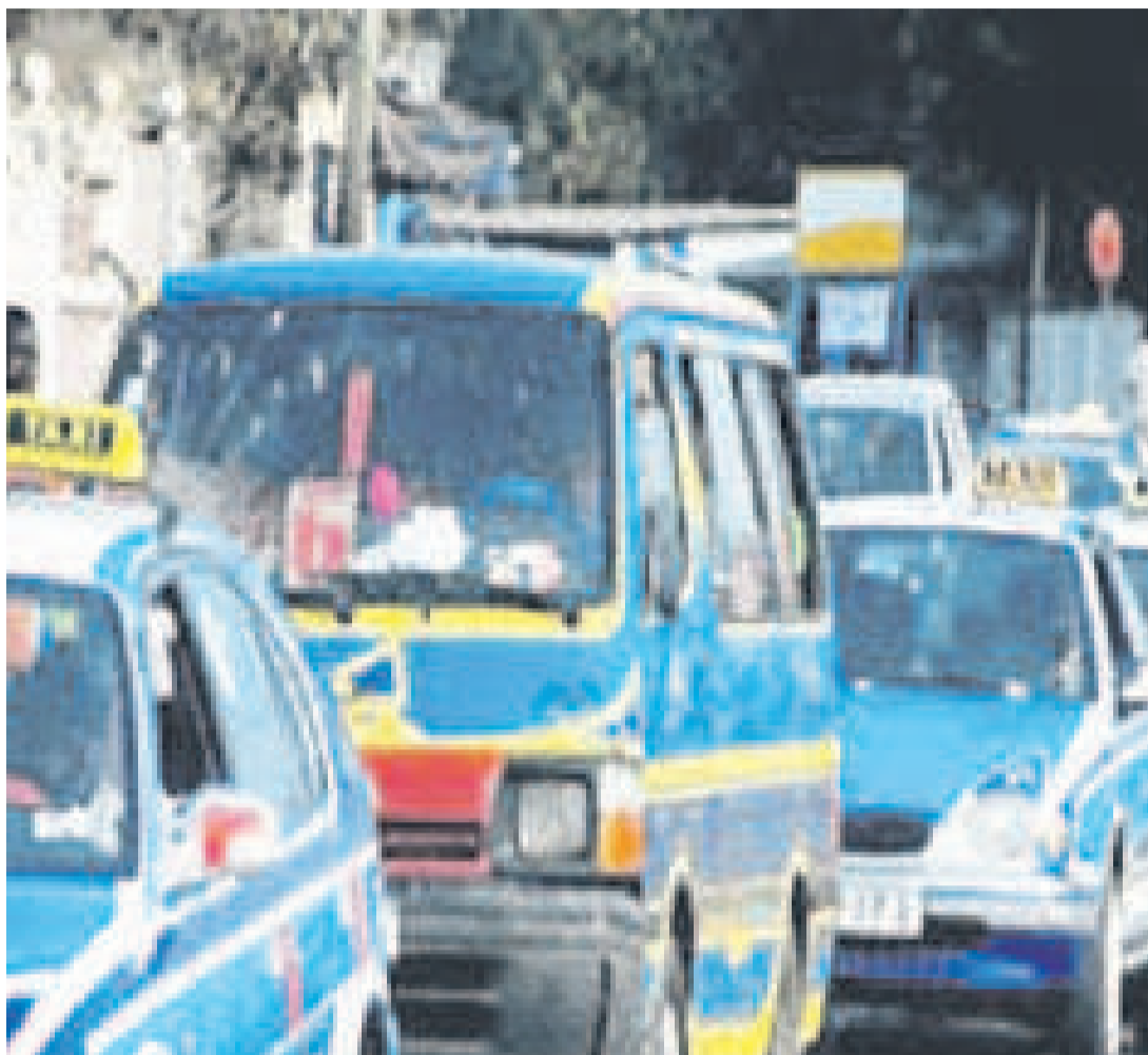
Des véhicules de transport

D'après les autorités, cette taxe, suspendue il y a plusieurs années, revient pour des raisons de