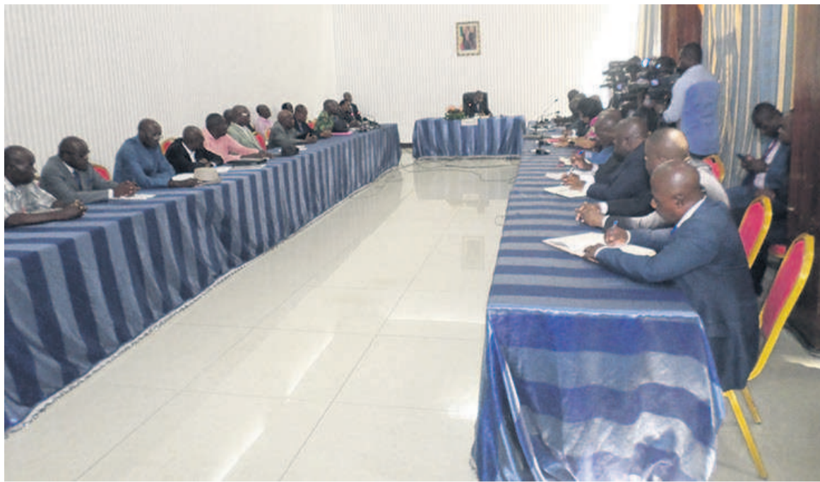
Les deux parties lors de la rencontre

La délégation a cependant salué les efforts du gouvernement antérieur qui était parvenu à arrimer le traitement des pensions à celui des salaires. « Chaque fois qu'on virait les