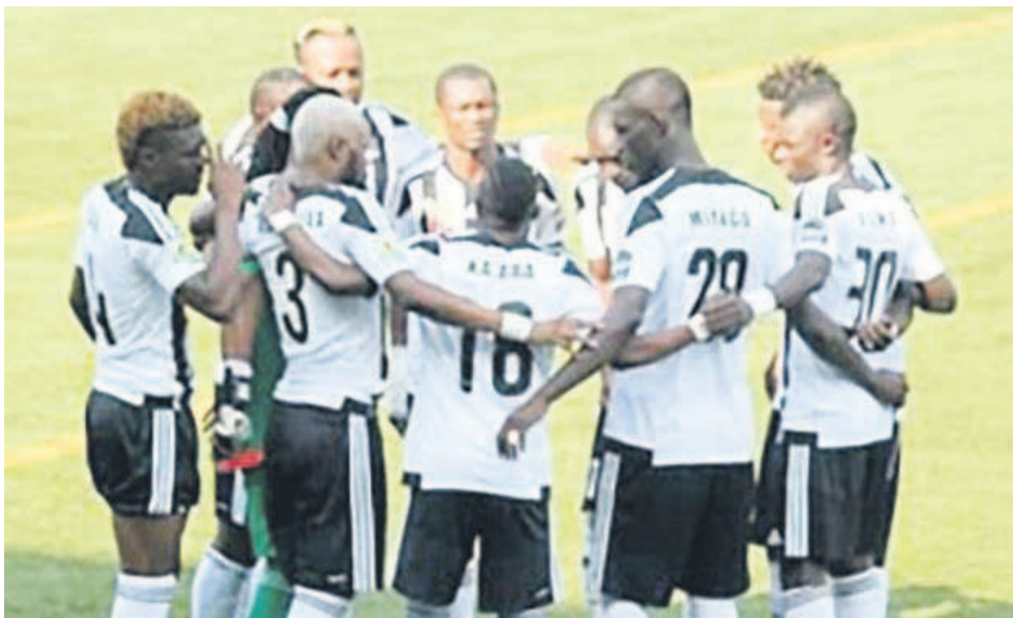
Le TP Mazembe de Lubumbashi

Quant aux joueurs de Maniema Union, ils demeurent à la troisième place du classement provisoire avec cinquante-sept points, juste derrière les Immaculés du Daring Club Motema Pembe (DCMP), qui comptent soixante points. Les deux équipes qui se disputent la troisième place qualificative pour la Coupe de la Confédération ont encore chacune un match à livrer pour achever leur saison