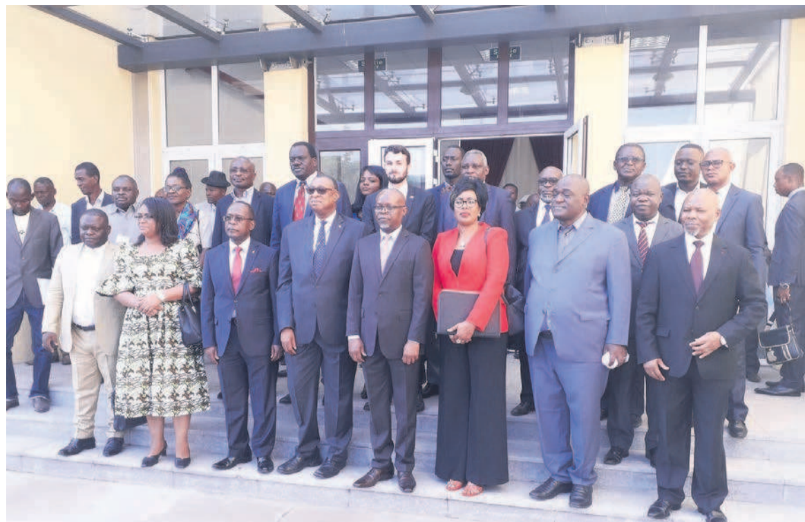
La photo de famille des participants à l'atelier après la cérémonie d'ouverture

Selon le directeur de cabinet du ministre de la Recherche scientifique et de l'innovation