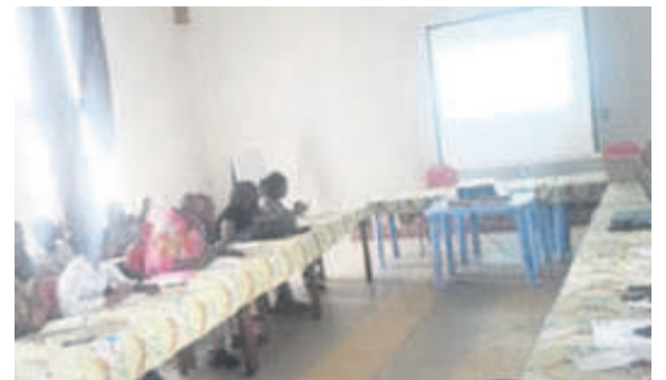
Une vue des participants à la matinée d'information

L'épidémie de chikungunya, a dit le Pr Justin Masumu, a commencé dans la zone de santé de Mont Ngafula I et II. Elle a été signalée aussi dans les communes de Gombe et Selembao. Actuellement, la maladie s'est déclarée à Matabi, au Kongo central.