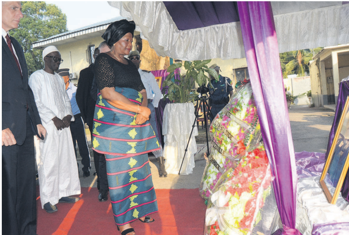
La doyenne du corps diplomatique déposant la gerbe de fleurs

L'illustre disparu, a-t-il poursuivi, avait également engagé, sous la supervision de l'ambassade, un circuit