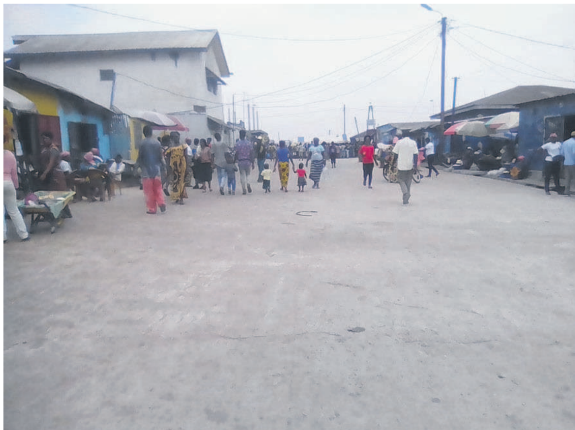
Vue de la gare routière