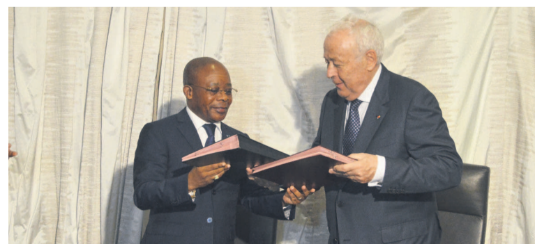
L'accord de partenariat entre le Congo et la Fondation Mériex signé

Le Congo, à travers le ministère de la Recherche scientifique, et les laboratoires Mériex ont conclu un partenariat visant, d'une part, la mise en place d'un système de surveillance de maladies infectieuses et, d'autre part, le renforcement des capa-