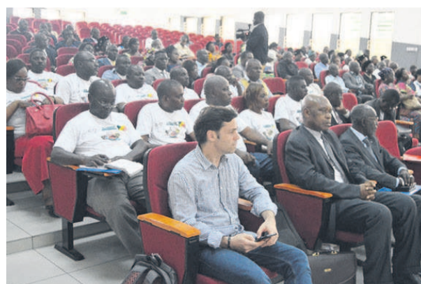
Les enseignants en atelier de microsciences

élèves des écoles primaires et secondaires ainsi qu'aux étudiants la possibilité d'effectuer des travaux pratiques en relation avec leurs disciplines de prédilection dont la physique, la chimie et la biologie.