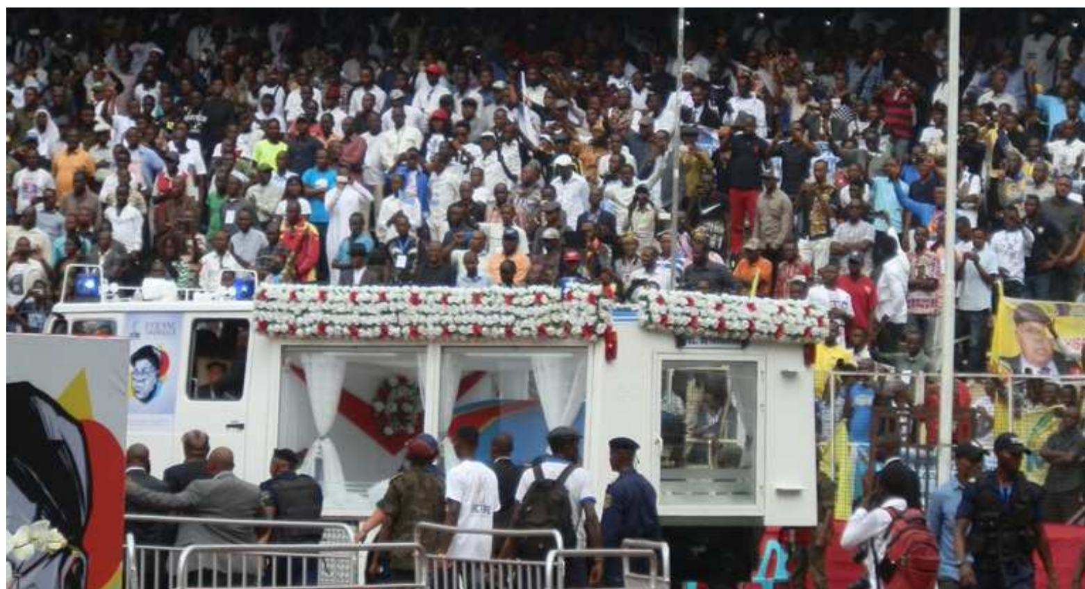
L'entrée du cortège funèbre au stade des Martyrs/Adiac