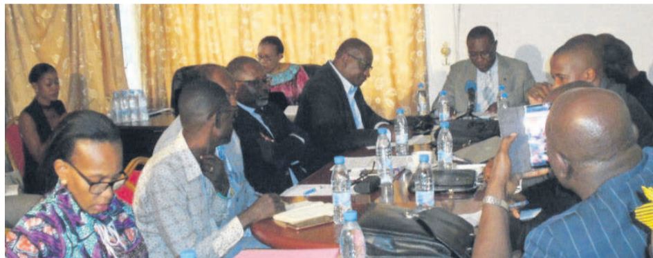
Les participants à l'atelier

La structure a organisé, le 29 mai à Brazzaville, un atelier sur l'élaboration de la stratégie de mobilisation des ressources, dans le but de vulgariser auprès des partenaires son plan d'action budgétisé.