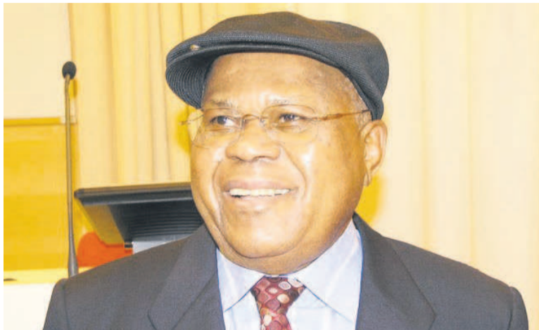
Etienne Tshisekedi entré au panthéon de l'histoire congolaise

L'ordonnance y afférent a été signé, le 31 mai à Kinshasa, par le chef de l'Etat, Félix-Antoine Tshisekedi Tshilombo.