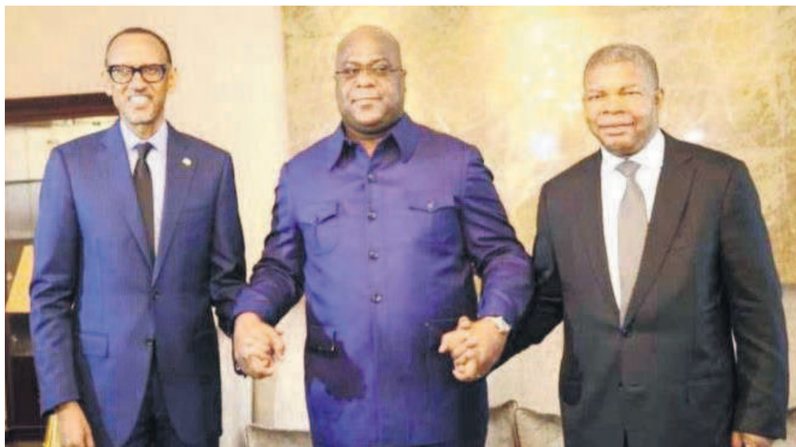
Paul Kagame, Félix Tshisekedi et João Lourenço

Une réunion tripartite ayant rassemblé autour de Félix Tshisekedi, ses homologues angolais, João Lourenço, et rwandais, Paul Kagame, s'est tenue le 31 mai. Attendus dans le cadre des funérailles de celui qu'on appelle le « père de la démocratie congolaise », en l'occurrence Etienne Tshisekedi, João Lourenço et Paul Kagame ont été reçus, d'abord en bilatéral, puis en tripartite par leur hôte du jour, Félix Tshisekedi. L'occasion a été belle pour les trois chefs d'Etat de passer en revue les problèmes qui minent leur sous-région et d'esquisser quelques pistes de solution. À en croire le communiqué ayant sanctionné cette rencontre, il en découle que les questions sécuritaires étaient au menu des échanges avec, à la clé, l'engagement pris de lutter efficacement contre les groupes armés qui écument la région. Tout en formulant le vœu de voir l'axe RDC-Angola-Rwanda