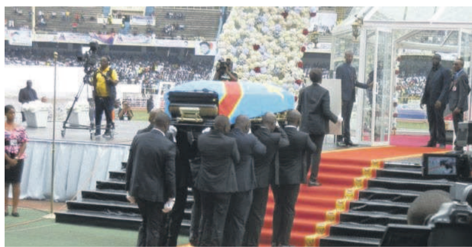
Arrivée de la dépouille au stade des Martyrs