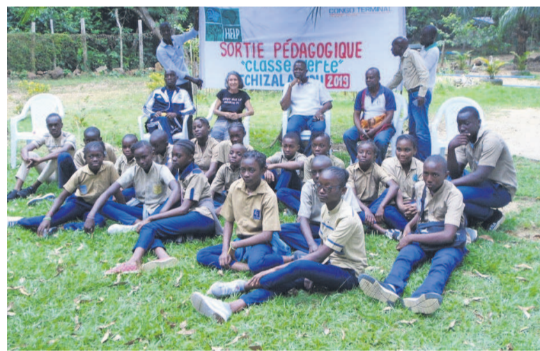
Les enfants posant avec les initiateurs du projet

Ainsi, les élèves de l'école privée Louis-Gregory, Kipolo-Fonkoma, Les Petits fils de Saint Joseph et ceux du collège Mâ Loango sont allés à la décou-