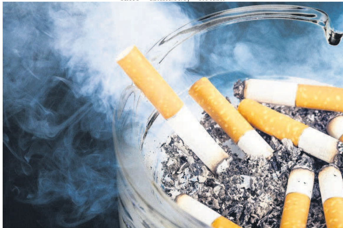
La consommation du tabac nuit à la santé

Rappelons qu'en 2017, le tabac a tué plus de trois millions de fumeurs et de personnes exposées à la fumée des autres à cause de maladies respiratoires, notamment un million et demi de décès dus à des affections respiratoires chroniques; un million deux cent mille décès imputables au cancer de la trachée, des bronches et du poumon. Plus de soixante mille enfants sont décédés des suites d'infections des voies respiratoires inférieures causées par le tabagisme passif.