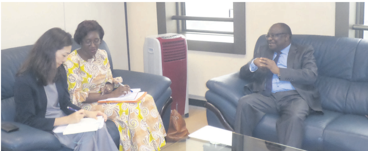
Euloge Landry Kolélas s'entretenant avec la représentante résidente de la Banque mondiale