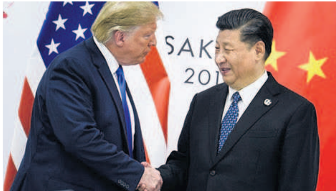
Les présidents Donald Trump et Xi Jinping

La partie américaine a annoncé qu'elle n'imposera pas de nouveaux droits de douane sur les exportations chinoises. Les négocia-