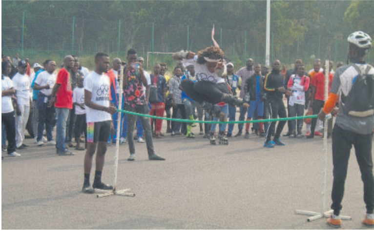
Le roller sport

La célébration de l'événement au Congo a permis au Comité national olympique et sportif congolais (Cnosc) de mettre en valeur des deux disciplines sportives, en les associant pour la première fois aux autres bien connues.