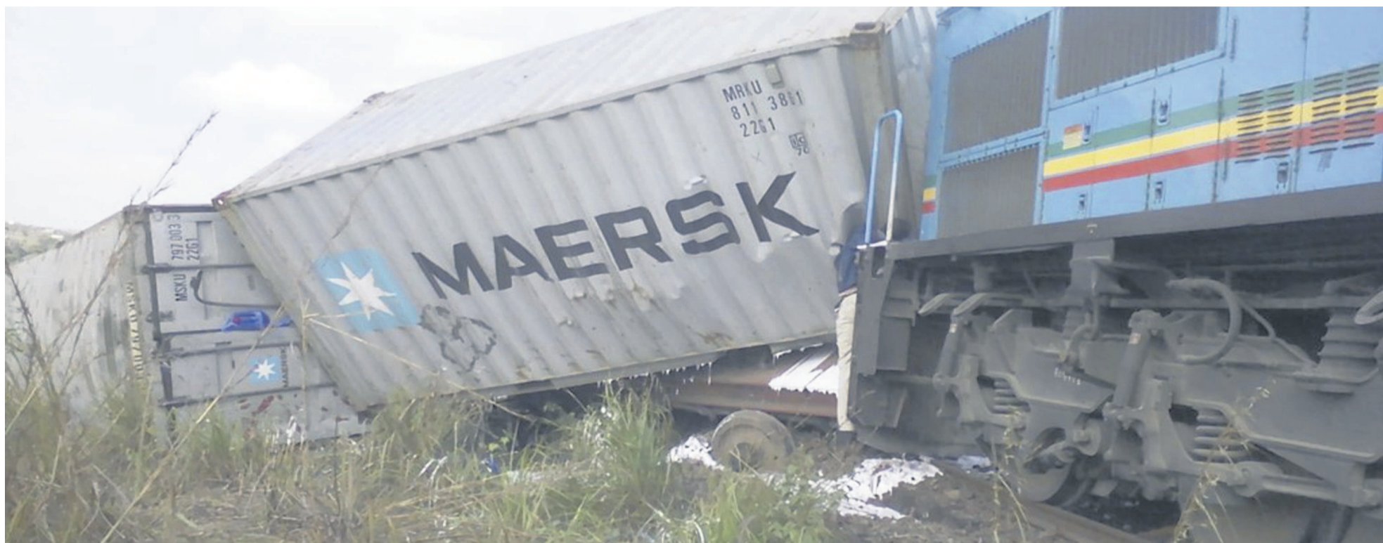
Une vue des conteneurs projetés

Deux trains marchandises sont entrés en collision, le 30 juin aux environs de 23 h, à Ngondji, localité située à 18 km de Pointe-Noire. L'accident qui serait dû à une défaillance du système de freinage d'une locomotive a occasionné la mort de treize personnes, fait vingt-cinq blessés dont cinq graves, ainsi que d'importants dégâts matériels. Page 15