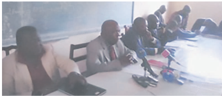
La délibération des résultats

La direction des examens et concours techniques (Dec-T) a délibéré les résultats du premier tour, le 1 er juillet à Brazzaville.