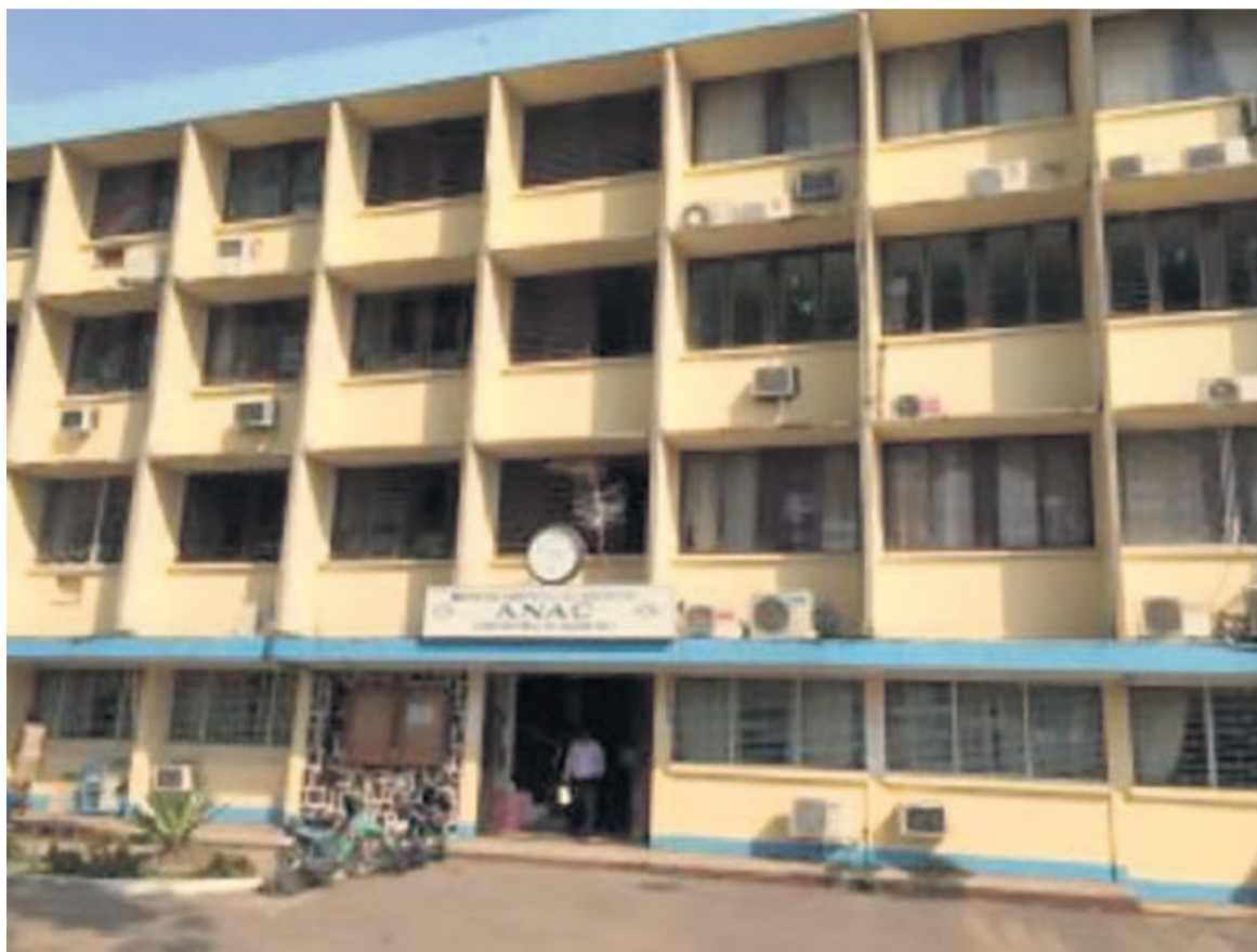
Façade principale de la direction générale de l'Anac au Congo/DR

« Cette mission a validé les processus de certification des compagnies aériennes et n'a identifié aucune préoccupation significative de sécurité », ont relevé les experts.