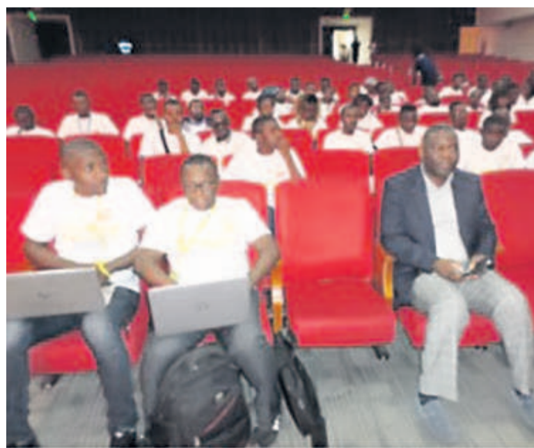
Les participants à la rencontre

À l'occasion de sa troisième Convention Merchant Momo, organisée le 29 juin à Brazzaville, la société de téléphonie mobile MTN a demandé à ses abonnés de ne pas considérer les appels anonymes leur annonçant les éventuels gains qu'ils auraient gagnés.