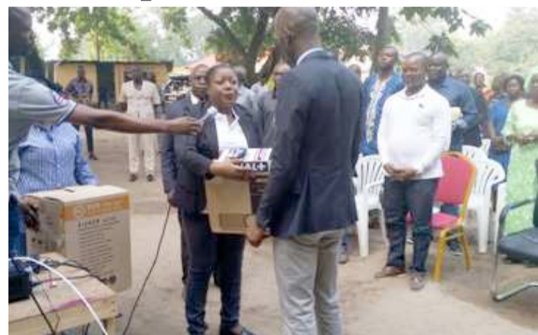
La cérémonie de remise du matériel au campus 1 «La forêt»

Le don offert le 30 juin par la ministre de la Jeunesse et de l'éducation civique, Destinée Hermella Doukaga, permettra aux bénéficiaires de suivre la suite de la Coupe d'Afrique des nations Egypte 2019 dans une ambiance footballistique.