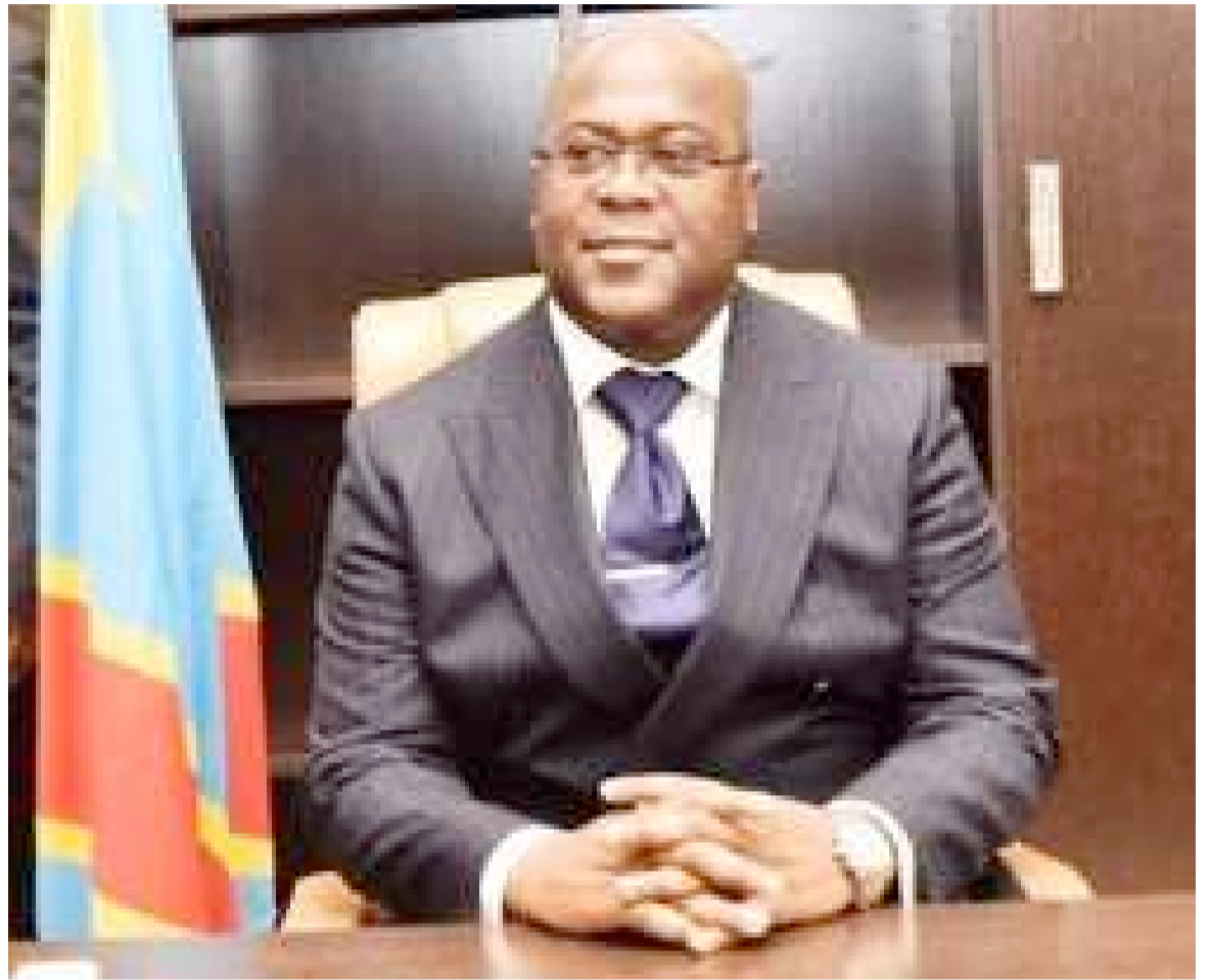
Félix-Antoine Tshisekedi Tshilombo

En outre, saisissant l'opportunité, Félix Tshisekedi a réitéré son engagement en faveur du rétablissement de la paix partout où elle est menacée à travers le pays, en faisant de la sécurité sa priorité. Après les opérations militaires en cours en Ituri, le chef de l'Etat a an-