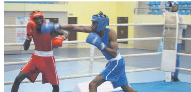
L'un des combats marquant l'ouverture du championnat.

La Ligue départementale de la discipline a lancé, le 10 juillet au gymnase Nicole-Oba à Talangaï, ses championnats après ceux qu'elle a organisés l'année dernière, au gymnase Henri-Elendé.