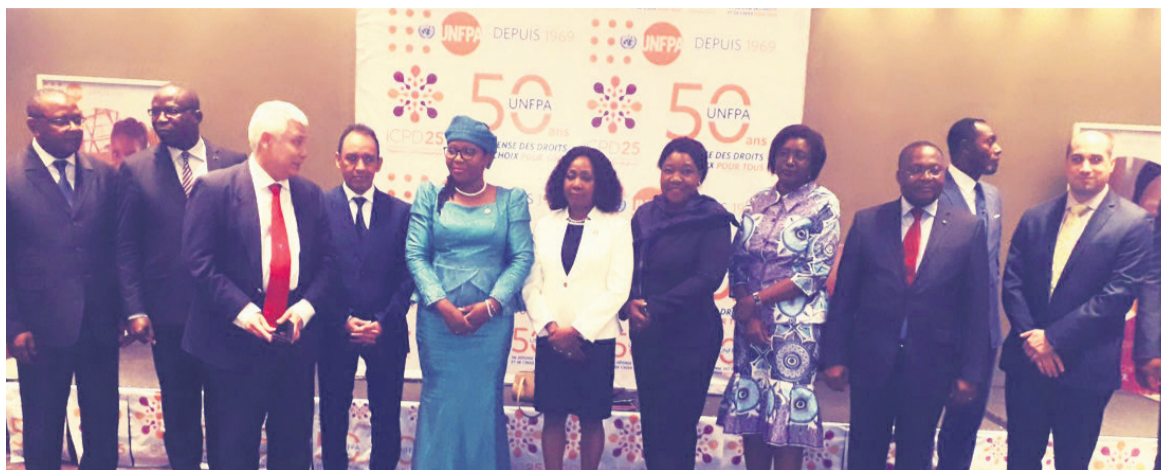
La ministre de la Santé et les partenaires du système des Nations unies

La Journée mondiale de la population a coïncidé avec les cinquante ans d'existence du Fonds des Nations unies pour la population (Fnuap) ainsi que les vingt-cinq ans de la Conférence internationale sur la population et le développement (CIPD), célébrés le 11 juillet de chaque année. A Brazzaville, la commémoration a été marquée, entre autres, par la présentation du rapport sur l'état de la population 2019. Le document souligne que les programmes ont été mis en place pour améliorer les conditions de vie de la popu-