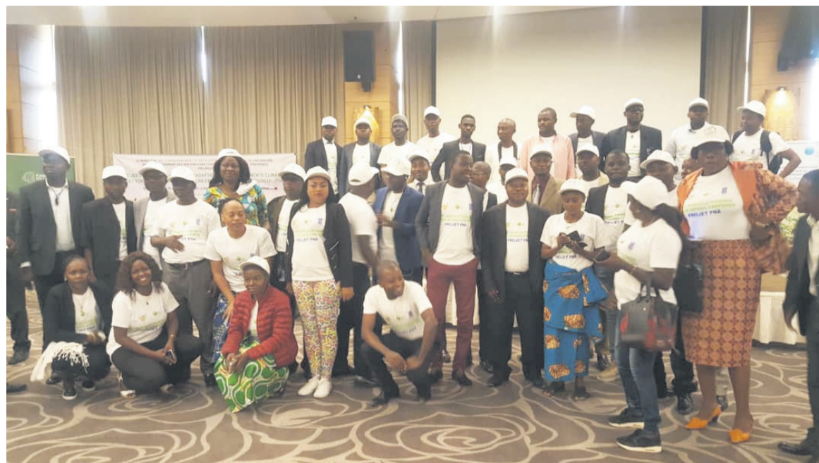
La photo d famille à la clôture de l'atelier

Au cours des travaux, les participants ont tous reconnu que les changements cli-