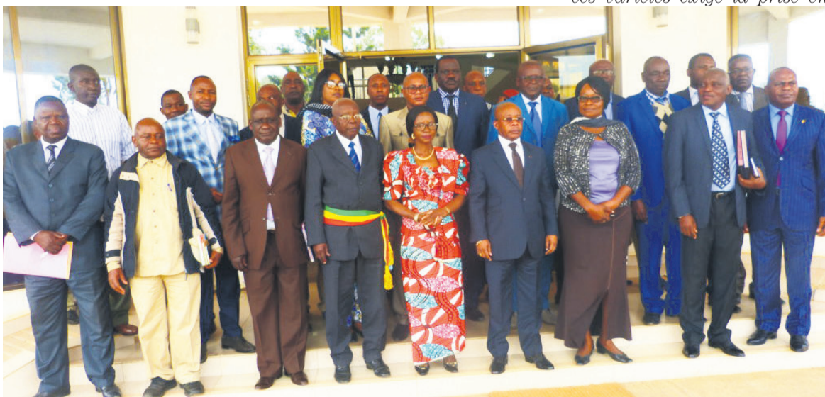
Le ministre de la Recherche scientifique avec les autorités locales et les producteurs de manioc