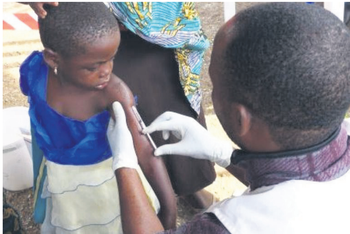
La vaccination contre la rougeole

Qu'il s'agisse de la rougeole, d'Ebola ou des conditions de vie dans un camp de déplacés, les enfants courent un risque grave. Nous devons faire tout ce qui est en notre pouvoir pour les protéger », a-t-il assuré.