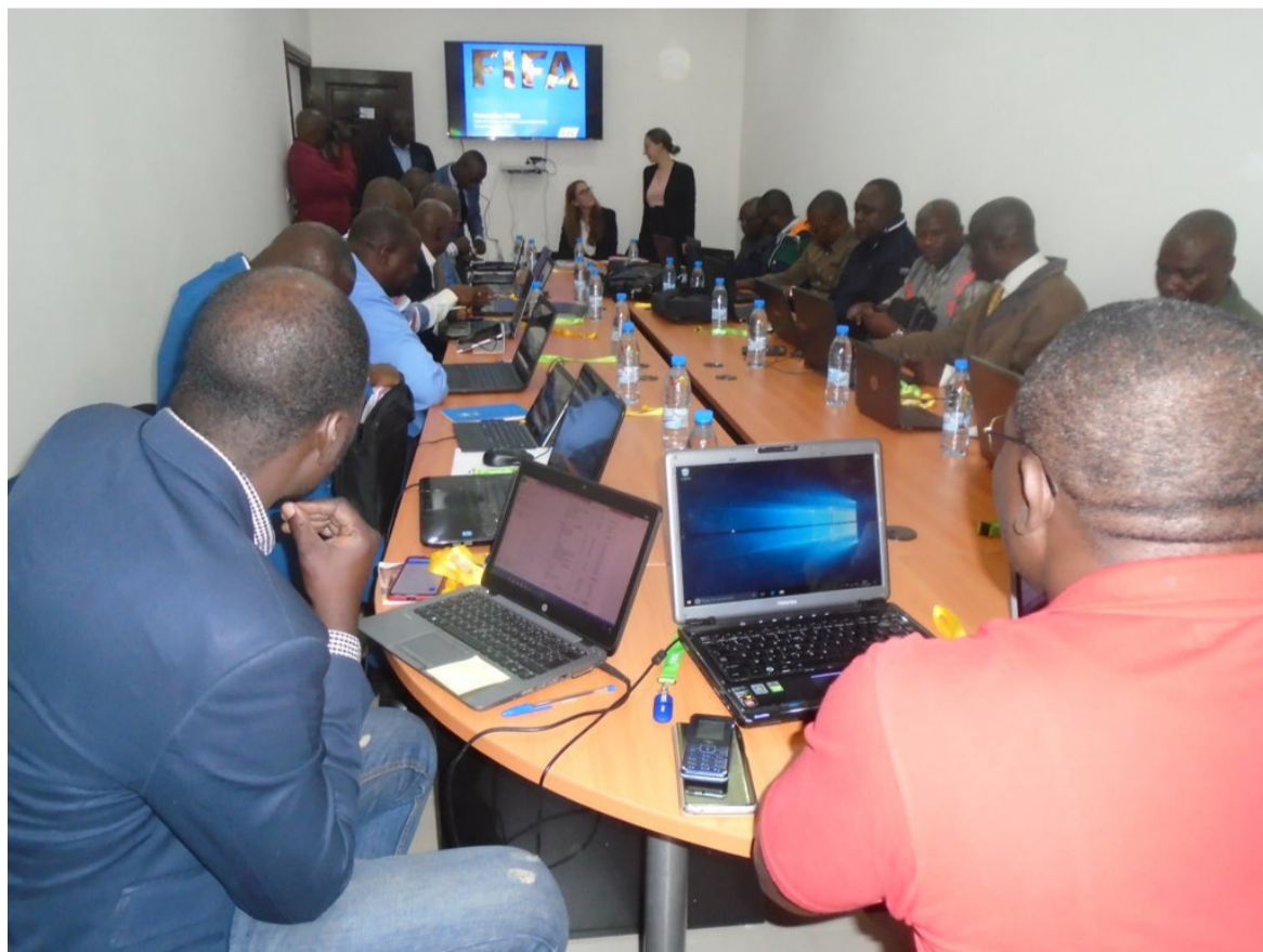
Les secrétaires généraux des clubs suivant la formation DTMS/Adiac

La formation permet aux secrétaires généraux des clubs de la Ligue 1 de maîtriser le système