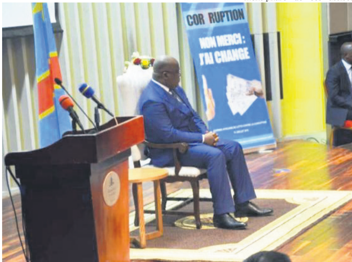
Félix Tshisekedi à la première édition de la Journée africaine de lutte contre la corruption