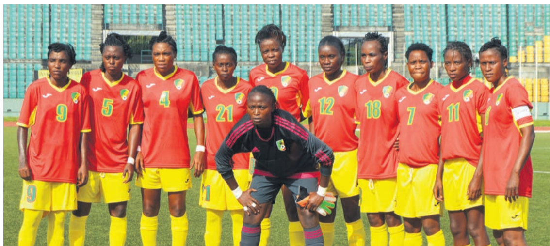
Les Diables rouges dames