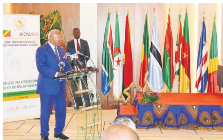
Le président de l'Assemblée nationale, Isidore Mvouba

Le président de l'Assemblée nationale, Isidore Mvouba, a invité le 11 juillet les décideurs politiques, les parlementaires, les ONG et les institutions financières à unir leurs efforts pour éradiquer le sida en Afrique. « La riposte consécutée au VIH /sida nécessite une mobilisation de ressources financières importantes : 26,2 milliards de dollars US en 2020, et 22,3 milliards en 2030 », a-t-il déclaré, à l'ouverture du sommet panafricain de haut niveau sur le financement du sida et de la santé. Page 6