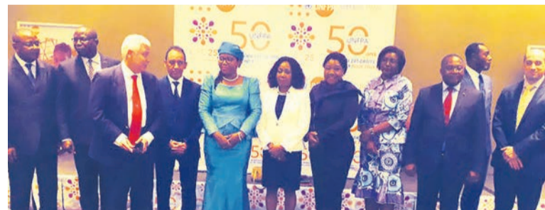
La ministre de la santé posant avec les partenaires au développement

Le rapport mondial sur la population 2019, présenté le 11 juillet à Brazzaville, souligne l'insuffisance des programmes de lutte contre la pauvreté, tout en appelant à l'accélération de l'amélioration des conditions sanitaires, ainsi que du bien-être social. Le document a été lancé en partenariat avec le Fonds des Nations unies pour la population.