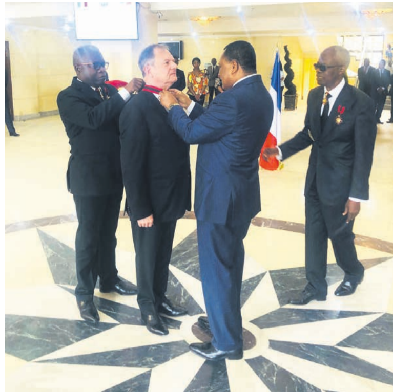
Le ministre des Affaires étrangères décorant l'ambassadeur de France