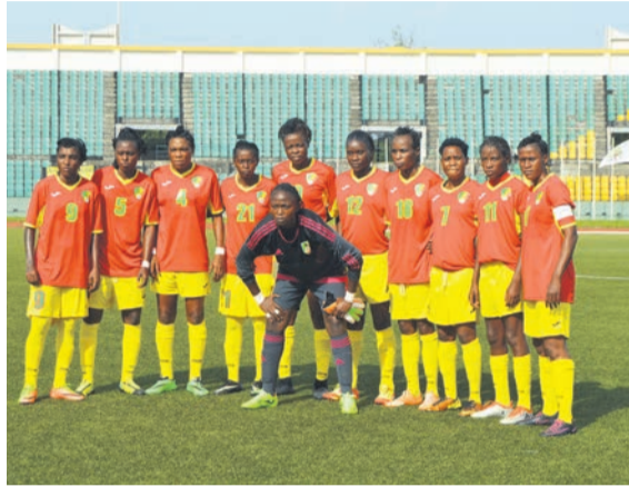
Les Diables rouges dames/Adiac

Notons que la Coupe d'Afrique des nations (CAN) féminine regroupe huit sélections