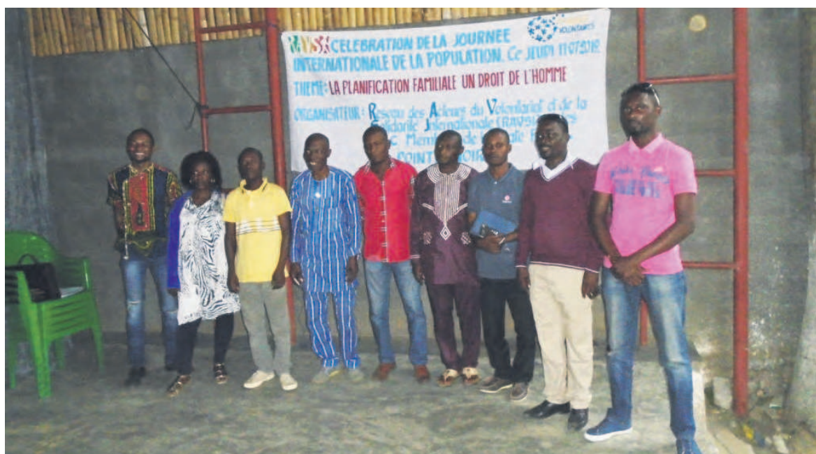
La photo de famille des membres de Ravsi

Et l'orateur d'ajouter : « La planification familiale est un atout non négligeable pour enrayer l'accroissement anarchique d'une population. Pendant que l'urbanisation galope, il faut impérativement procéder à la promotion de la planification familiale qui est un droit de l'homme, un droit pour la vie. Ainsi, lorsque la planification familiale est observée, la