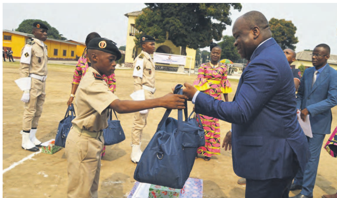
Le DG de la SNPC congratulant un meilleur élève de l'année de FCFA.

Il a, en effet, été au centre de la conception et la réalisation de la stèle des AET. Y compris le monu-