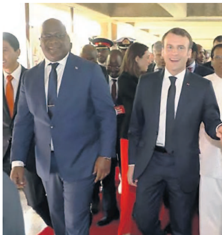
Emmanuel Macron et Félix Tshisekedi à Nairobi