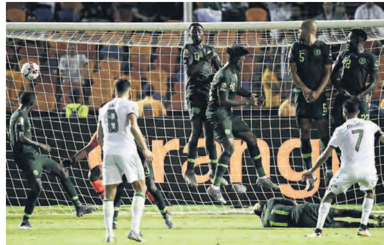
Le coup-franc libérateur de Mahrez face au Nigeria envoie l'Algérie en finale de la CAN

Tombeurs du Nigeria dans les ultimes secondes, les Fennecs d'Algérie rejoignent le Sénégal. Les deux meilleures équipes du tournoi en découdront le 19 juillet.