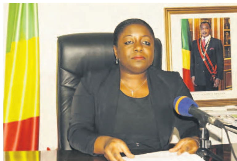
La ministre de la jeunesse et de l'éducation civique prononçant son message