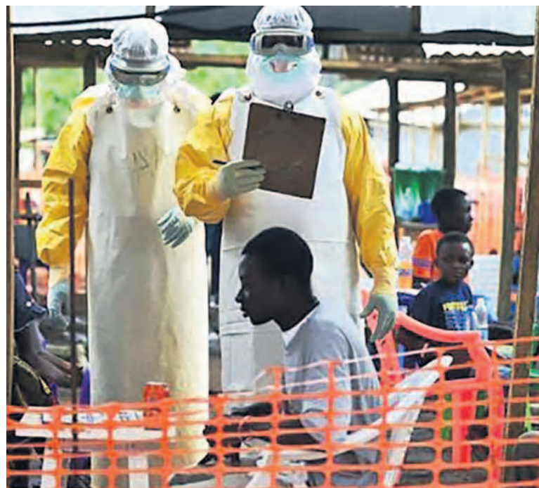
Prise en charge des malades atteints de la fièvre hémorragique à virus Ebola

qu'il était positif à Ebola. En raison de la rapidité avec laquelle le patient a été identifié et isolé, ainsi que l'identification de tous les passagers du bus en provenance de Butembo, le risque de propagation dans le reste de la ville de Goma reste faible, a rassuré le ministère de la Santé tout en appelant la population au calme. Page 3