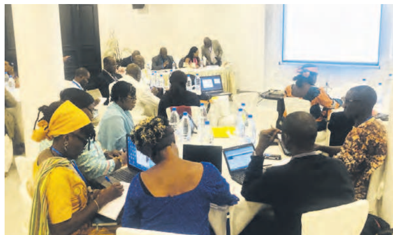
Les participants lors des travaux en atelier

Le projet régional GIZ d'appui à la Comifac, quant à lui, se focalisera sur les activités visant le