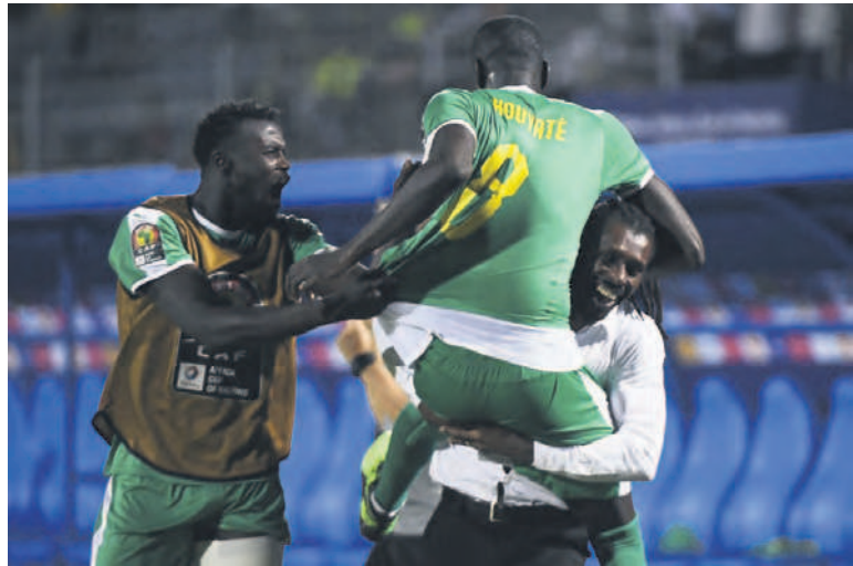
Aliou Cissé célèbre la qualification du Sénégal avec son capitaine, Kouyaté

le Sénégal parvient en finale de la Coupe d'Afrique des nations. Malheureux lors de la séance de tirs au but, Aliou Cissé va pouvoir tenter de gagner comme sélectionneur le trophée qu'il n'avait pu gagner comme joueur. Et qui se refuse au Sénégal depuis 32 éditions.