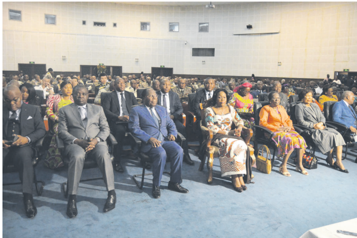
La Première dame et les membres du gouvernement lors de la commémoration