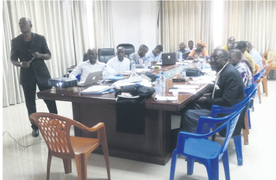
Les participants à la formation

teurs des structures de l'Etat et de la société civile », a déclaré, le président du Mojecra, en spécifiant