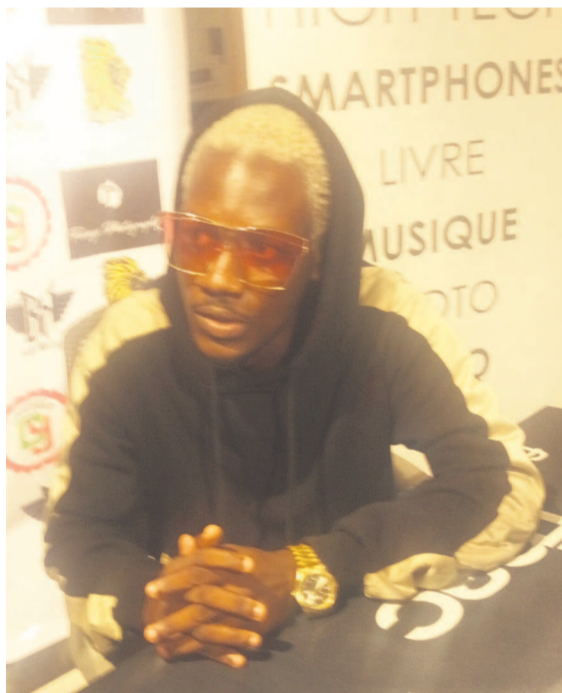
Le rappeur congolais Big Tyger

Pourquoi « Black Viking – Le voyage » ? L'ar-