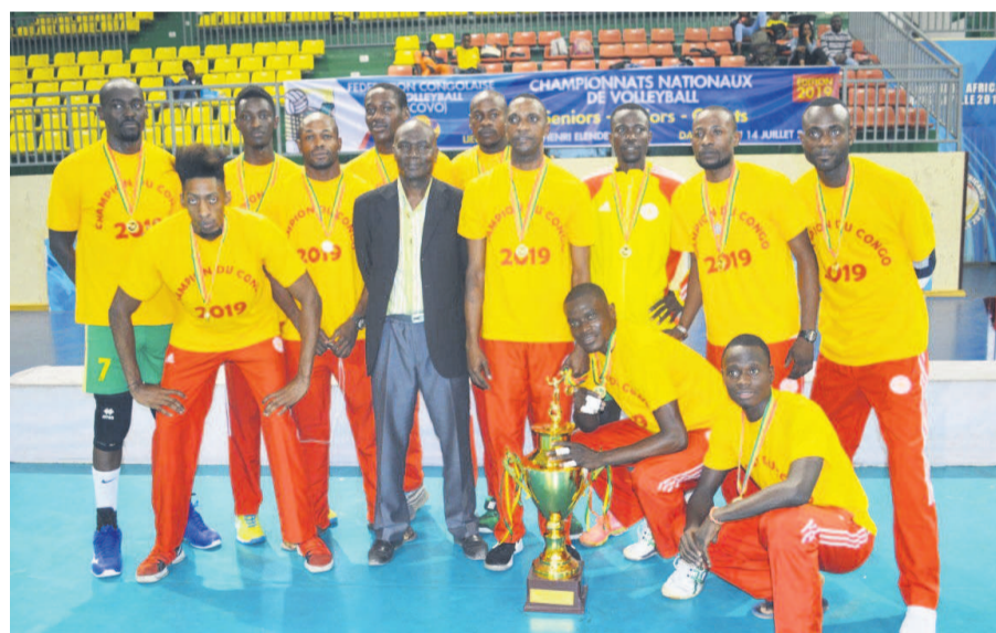
La formation d'Interclub/Adiac

Les deux équipes ont ainsi reçu chacune des médailles puis un trophée. « Nous sommes heureux de soulever pour la deuxième fois consécutive