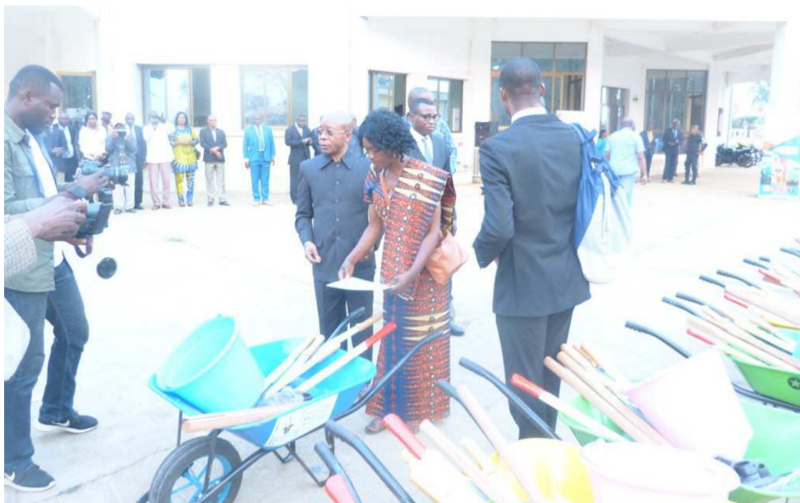
Le ministre de la Recherche scientifique remettant du matériel aux producteurs de manioc

Par ailleurs, il a été recommandé à l'endroit du gouvernement d'organiser périodiquement des formations et leur extension à d'autres départements du pays, de financer la suite de la formation par la mise en place des champs écoles dans chaque