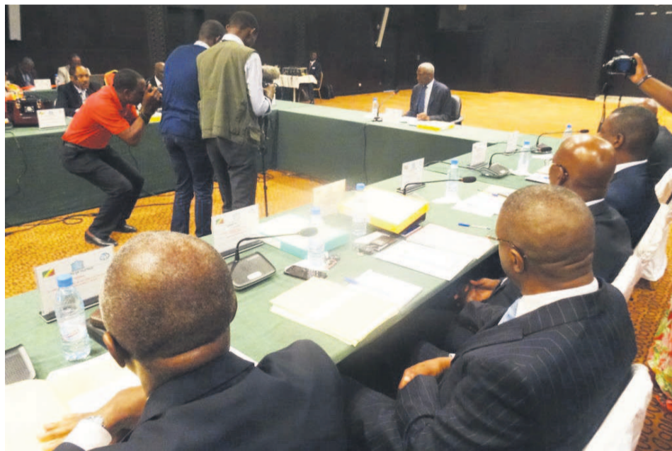
Les participants lors des travaux de la session de ses administrateurs.

Son installation a été évoquée, le 15 juillet, à Brazzaville, au cours de la deuxième session ordinaire du comité de pilotage du Prisp, un projet cofinancé par le gouvernement congolais et le groupe de la Banque mondiale. Ce nouveau dispositif est censé éradiquer les tracasseries liées au paiement des impôts au Congo et d'établir une certaine « confiance entre l'administration fiscale et les contribuables ». D'après les experts proches du dossier, le futur logiciel est un excellent moyen qui contribuera à lutter contre la fraude et les entraves au contrôle de l'information financière contenue dans les états financiers et qui sont de nature à éroder l'assiette fiscale. L'E-tax permet au fisc de recevoir en temps réel les états financiers de ses clients et d'échanger avec eux.