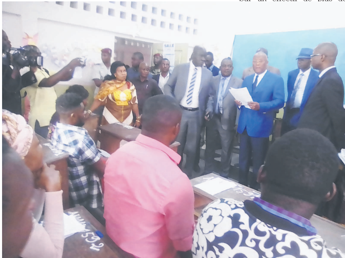
Le ministre de tutelle lançant les épreuves