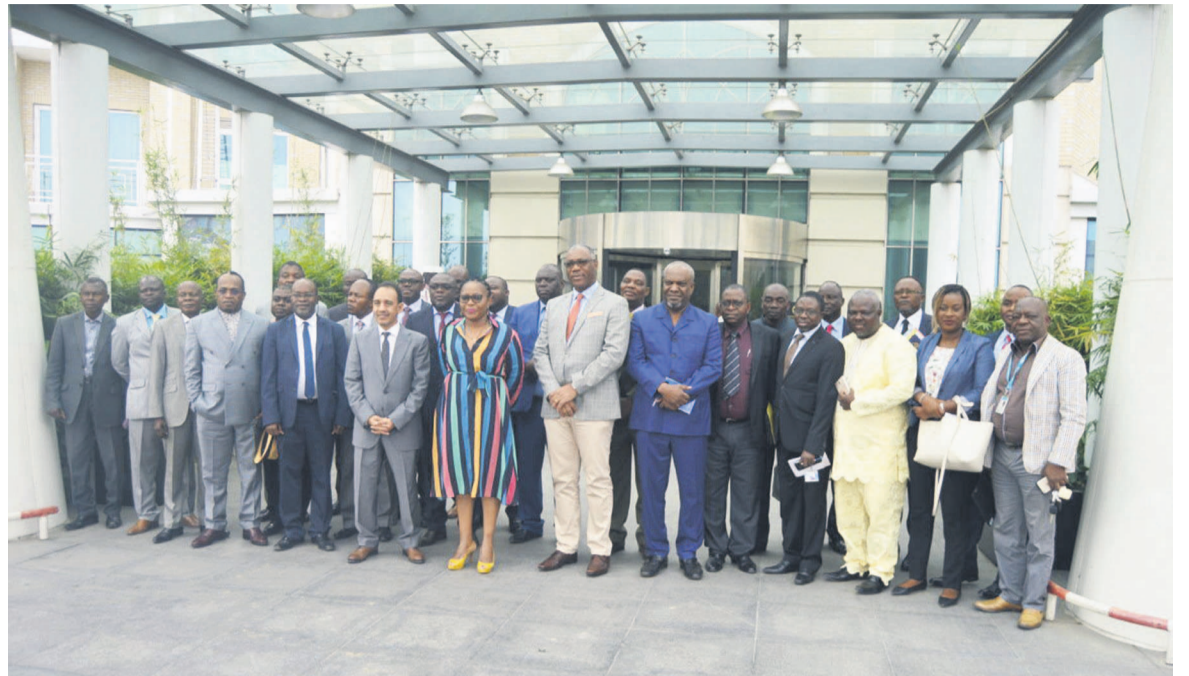
La ministre de la Santé et les participants à l'atelier

Cet atelier permettra donc le renforcement des capacités des participants sur l'utilisation d'AccessMod, l'élaboration d'une carte sanitaire des soins obstétricaux néonataux par département, et d'une feuille de route pour la coordination du projet jusqu'au démarrage de la phase pilote. Selon le représentant du Fnuap au Congo, Mohamed Lemine Salem Ould Moujtaba, des partenariats innovants doivent être expérimentés pour plus d'efficacité dans l'exécution du pro-