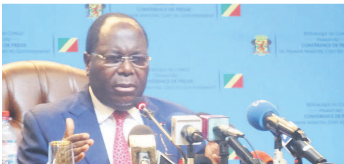
Le Premier ministre Clément Mouamba

servira en priorité à régler les questions liées au secteur social (santé, éducation, etc.). « L'accord n'est pas une panacée », a déclaré le chef du gouvernement, invitant les Congolais à s'impliquer dans la mise en œuvre des mesures contenues dans le programme avec l'institution de Bretton Woods. Page 3