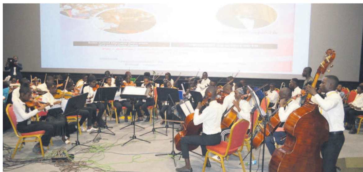
Les enfants de l'orchestre symphonique en plein concert