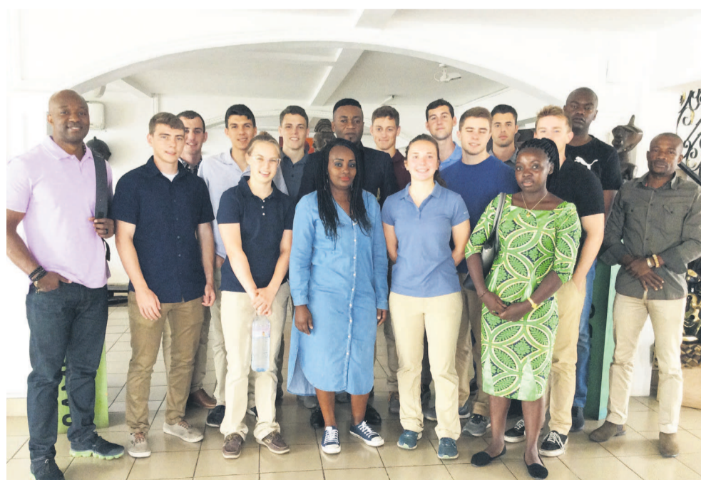
La visite du 3 e groupe des officiers cadets de l'Académie américaine au Musée galerie du Bassin du Congo, effectuée le jeudi 18 juillet 2019.