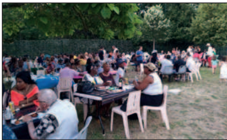
La Guinguette Africaine de Suresnes 2019 une vue partielle de l'aire de festivités

Ce samedi 20 juillet, les sonorités et les saveurs seront celles de la Bouenza, un événement offert gratuitement au public. De 16 h à 22 h, les participants vivront des moments intitulés « Au fil des couleurs de la culture de la Bouenza ». Son contenu a été concocté par les organisateurs au service du « mieux vivre ensemble », une manière de combattre le repli sur soi et l'égoïsme durant la période estivale. Sur fond sonore de la musique de Dana, le public vivra en interactivité la présentation des spécialités culinaires de chaque tribu. Ainsi, par exemple, selon les spécialités, chacun proposera une dégustation de ses plats. Les Kuni, mbalapinda-mbouata ; les Kamba, le nkasa ; les Dondo et Soundi, les haricots-buki enfin les Bembe et les Mikengue, le ngouba mu minkimbou et l'incontournable ngoulou mu mako. Entre deux dégustations, les associations disposeront d'un temps de passage à la tribune