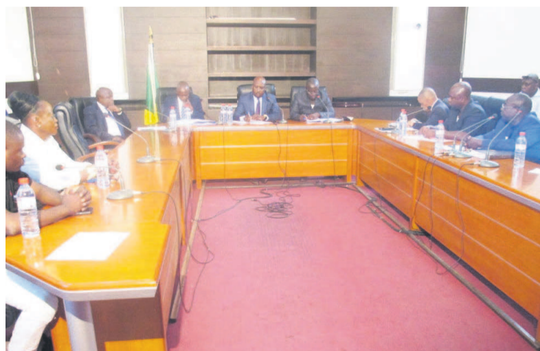
Les participants à la cérémonie d'ouverture des plis contenant les offres