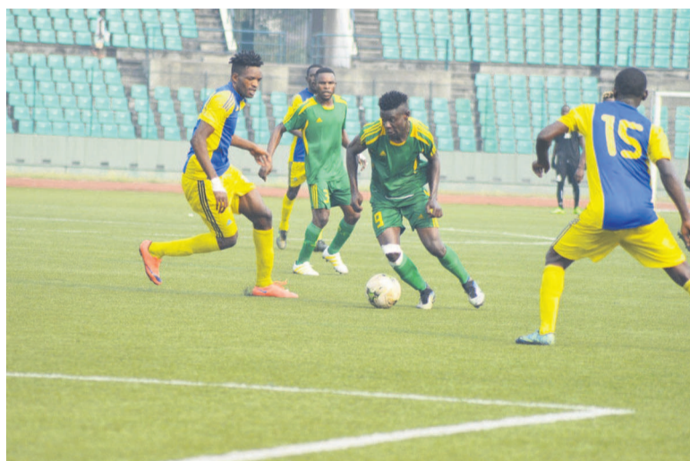
Une séquence du match JST contre Etoile du Congo