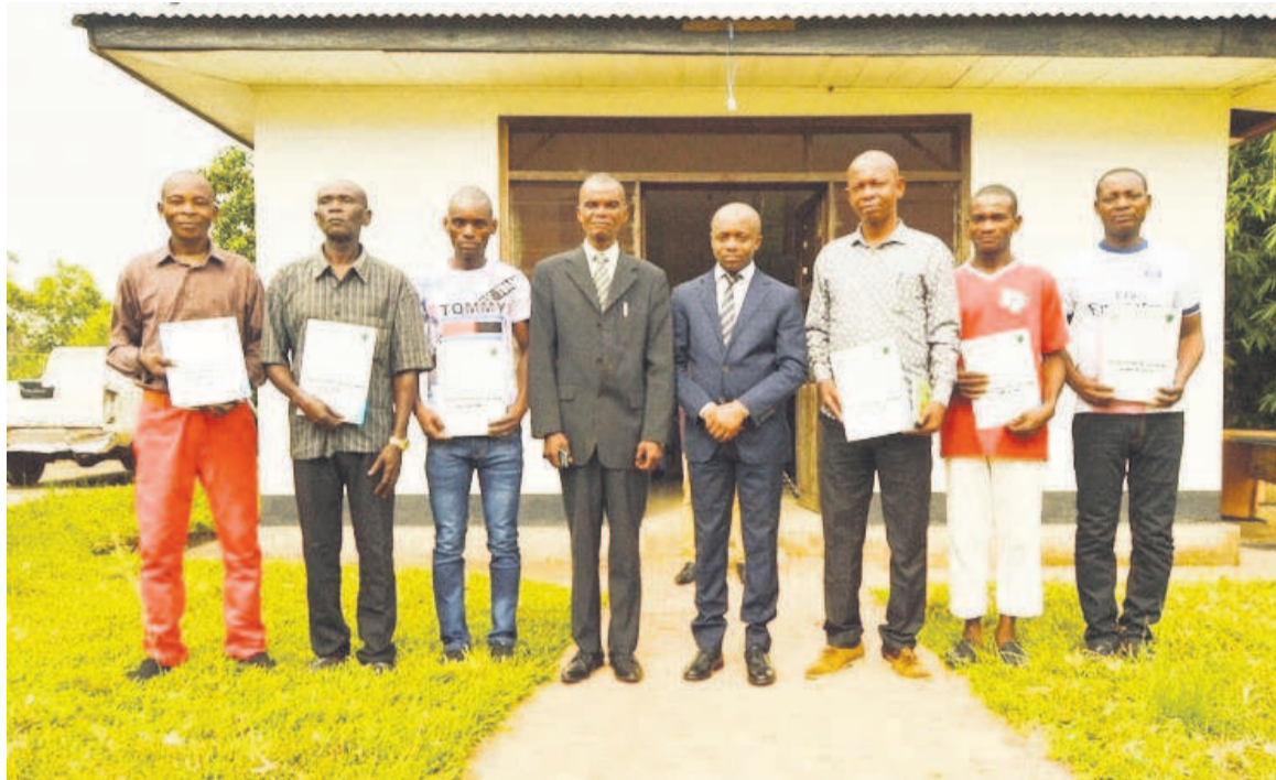
Des représentants des communautés entourant le vice-gouverneur de Mai-Ndombe/WWF-RDC

Les concessions des six communautés du groupement