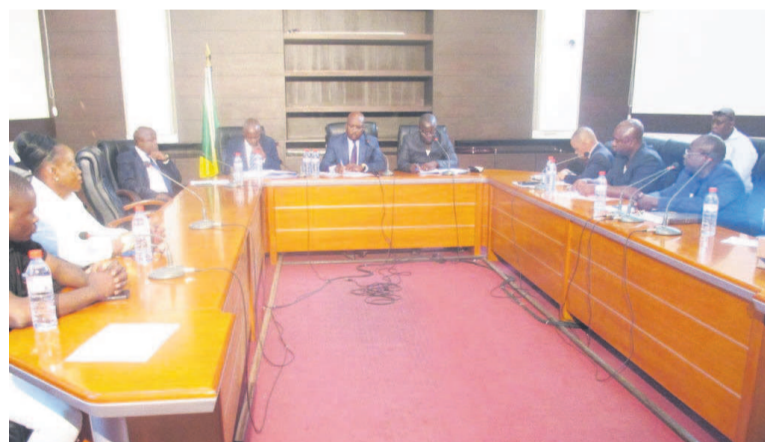
Les participants à la cérémonie d'ouverture des plis contenant les offres

département de la Lékoumou bénéficiera de quatre projets, deux projets en faveur du département du Pool. Les départements des Plateaux, du Niari et de la Bouenza ne sont pas en reste.