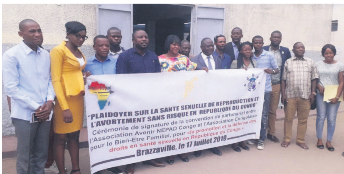
Les membres de l'AcbeF et de Nepad Congo, après la signature du partenariat.

Les deux structures ont signé, le 17 juillet à Brazzaville, une convention de partenariat pour plaider en faveur de la santé sexuelle de reproduction et l'avortement sans risque au Congo.