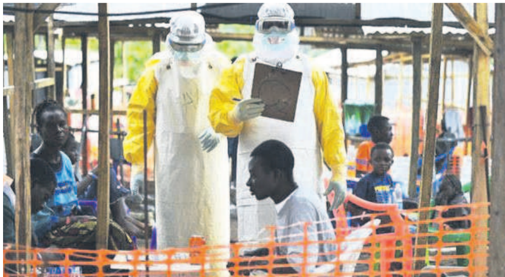
Prise en charge des malades atteints de la fièvre hémorragique à virus d'Ebola

Depuis la déclaration officielle de la dixième épidémie d'Ebola, le gouvernement britannique figure parmi des partenaires qui appuient la RDC à mettre fin à cette maladie. Il apporte son soutien par le biais de l'OMS. Il a déjà pris en charge le vaccin, la surveillance et la construction des centres de traitement en réponse à l'épidémie, le dépistage au niveau des frontières