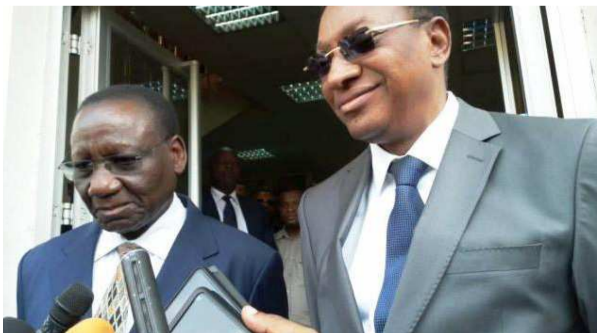
Ilunga Ilunkamba et Bruno Tshibala

cune des deux composantes refuse de perdre la face. Fort de sa majorité dans les deux chambres du Parlement et dans les Assemblées provinciales, le camp Kabila tient à imposer sa marque dans ces tractations en revendiquant l'essentiel des postes ministériels. Bien plus, à en croire des indiscretions, l'autorité morale du FCC tient à positionner ses hommes de main dans le prochain exécutif national alors que Félix Tshisekedi voudrait composer avec des hommes nouveaux incarnant un certain profil de changement. Une différence d'approche qui, actuellement, plombe le processus de la formation du gouvernement. L'on est bien dans une impasse politique dont le dénouement risque de prendre beaucoup de temps si l'on s'en tient aux positions diamétralement opposées soutenues de part et d'autre. D'autres sources allèguent que le président Félix Tshisekedi voudrait qu'on lui propose trois noms pour chaque poste. « Le président de la République a retourné au FCC et au Cach