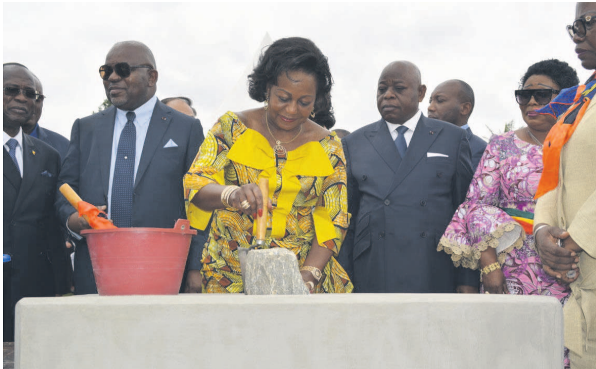
Antoinette Sassou N'Guesso posant la première pierre; -La maquette du centre

formation des enseignants s'inscrit dans le cadre du Projet d'appui à l'amélioration du système éducatif, en partenariat avec le gouvernement et la Banque mondiale. Pour requalifier et redorer ce collège de sa vocation d'école de formation portée par la première dame, présidente de la Fondation Congo assistance, le bureau d'études Cristal international a reçu la mission de maîtrise d'œuvre de l'aménagement du site.