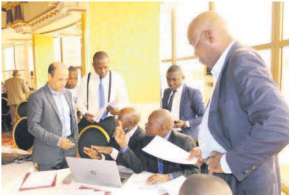
Des experts du ministère de l'Aménagement du territoire et des firmes impliqués dans la réforme

Cet atelier intervient un mois après celui sur la restitution des missions de consultation des acteurs et de collecte des données menées à travers toute l'étendue du territoire national par les équipes du ministère de l'Aménagement du territoire et Rénovation de la ville et les experts des firmes tunisiennes Ideconsult et Studi recrutées par le Pnud pour élaborer les différents outils de l'aménagement du territoire, à savoir la PNAT, la loi-cadre sur l'aménagement du territoire, le schéma national de l'aménagement du territoire et les guides méthodologiques pour l'élaboration des plans provinciaux et locaux de l'aménagement du territoire. Notons que ces missions qui s'étaient tenues dans le cadre du processus de la réforme de l'aménagement