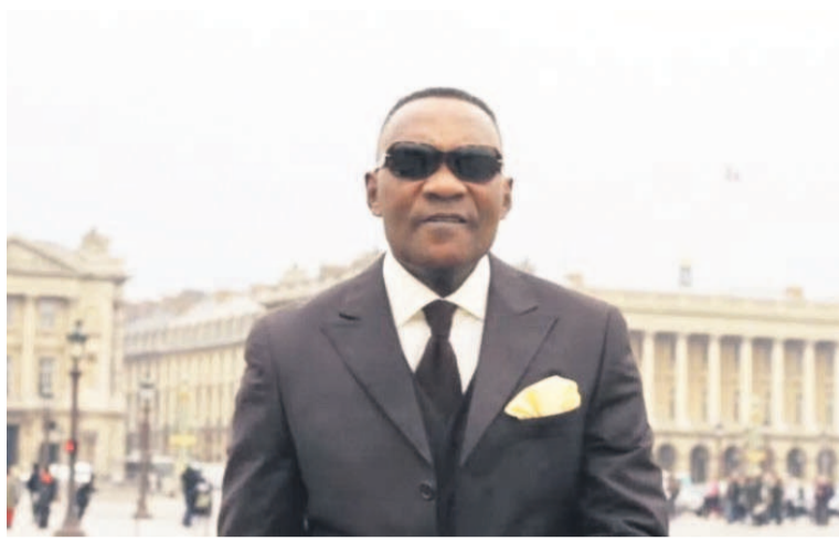
Capture d'écran sur le clip Ainsi va la vie de Fernand Mabala

Les premiers témoignages à l'égard de cet artiste ont tapissé les murs des mélo-