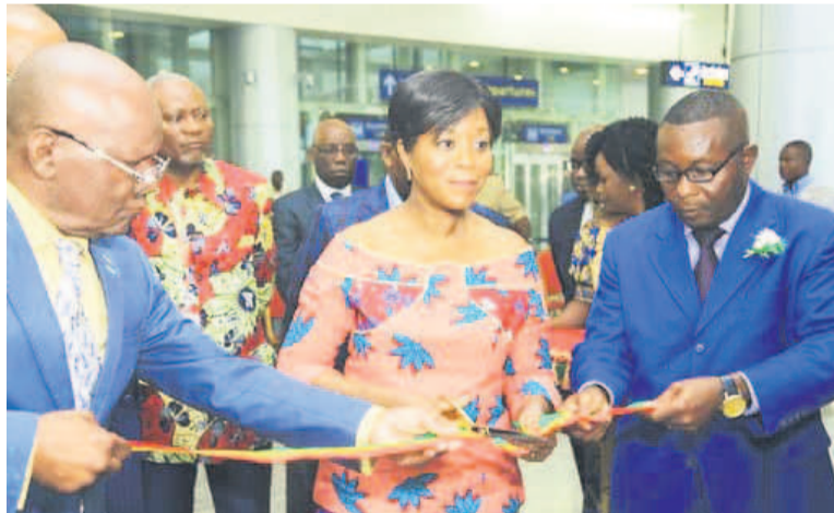
La ministre du Tourisme et de l'environnement coupant le ruban symbolique

Construit en accord avec les normes OACI et les exigences de