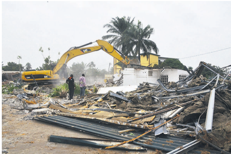
Démolition de l'immeuble Kanoa