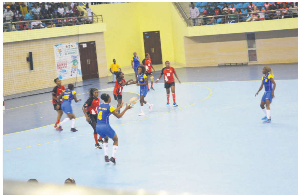
Match Cara-Abo Sport