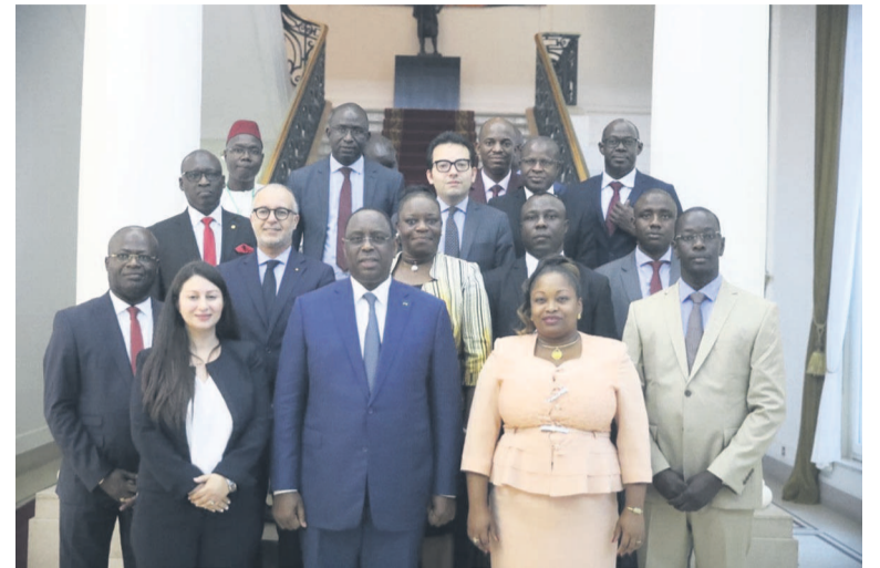
La photo de famille

Dans la capitale sénégalaise, les délégations des énarques ont visité tour à tour, le monument