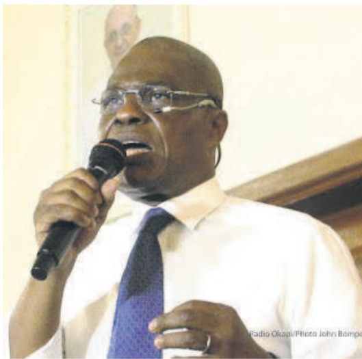
Martin Fayulu lors d'un meeting

Devant une foule de ses partisans en liesse le dimanche 4 août au Camp Luka, Martin Fayulu, rentré de Lubumbashi où il a pris part à une réunion du présidium de Lamuka, est revenu sur son sempiternel crédo de vérité des urnes.