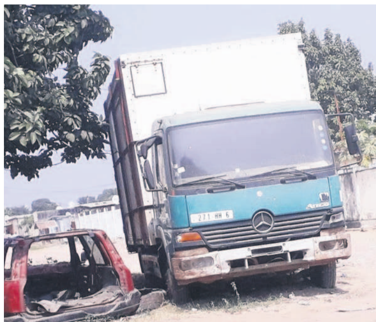
Les épaves des véhicules abandonnées sur la voie publique

La mairie de Baongo, deuxième arrondissement de Brazzaville, avait lancé une opération visant à débarrasser les espaces publics des épaves de véhicules. « Heurtée à un problème de moyens financiers, l'initiative n'a pas abouti », selon les sources concordantes. Plusieurs tentatives portant dans ce sens ont échoué. En dehors de l'absence des moyens financiers, il y a également le manque d'espaces devant recevoir ces carcasses. Une partie de la corniche qui donne accès au fleuve Congo pourrait être