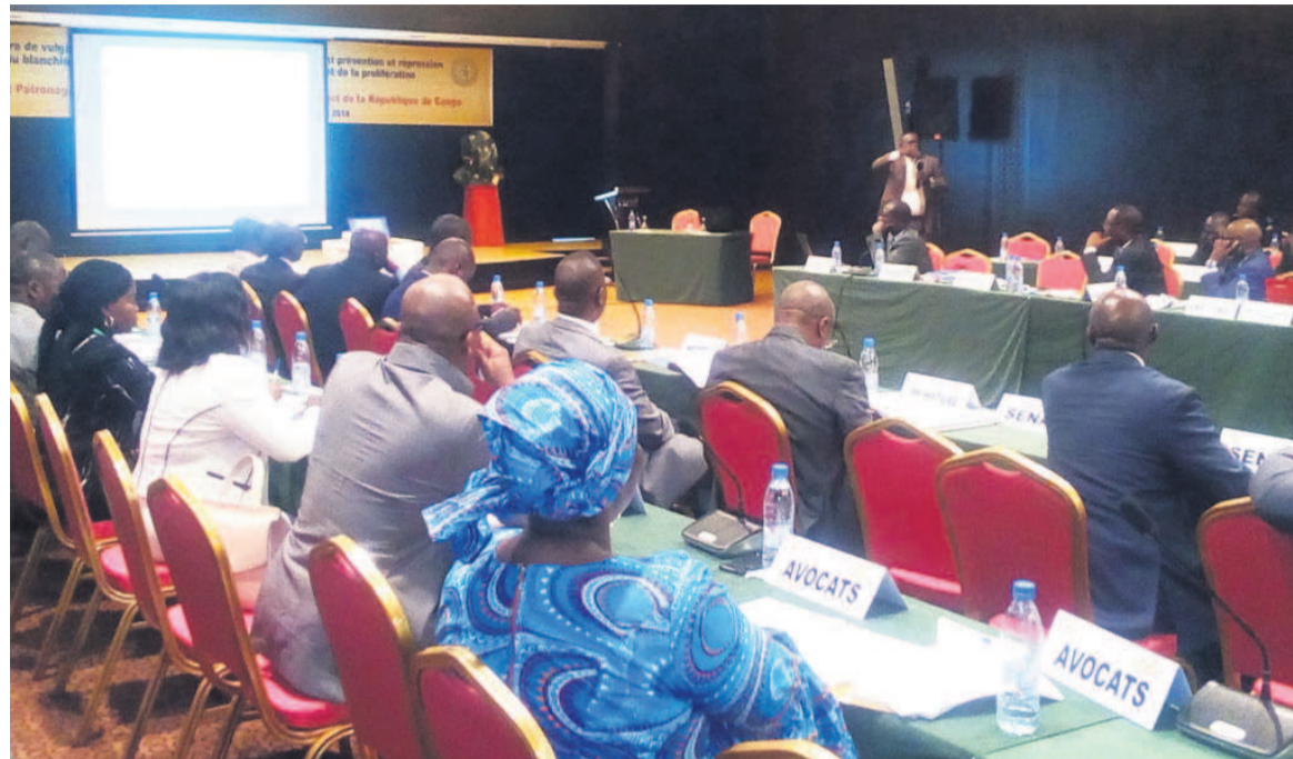
Les participants au cours des travaux

cela, souligné la nécessité d'insérer dans leur liste des assujettis les sociétés de téléphonie mobile exerçant le paiement mobile ; de solliciter une forte implication des autorités politiques et judi-