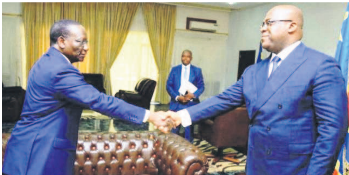
Ernest Ilunkamba reçu par le Chef de l'État, Félix Tshisekedi.

Côté Cach, c'est Tryphon Kinkiey Mulumba, un de ses cadres, qui a créé dernièrement la sensation en réclamant quelques portefeuilles en reconnaissance