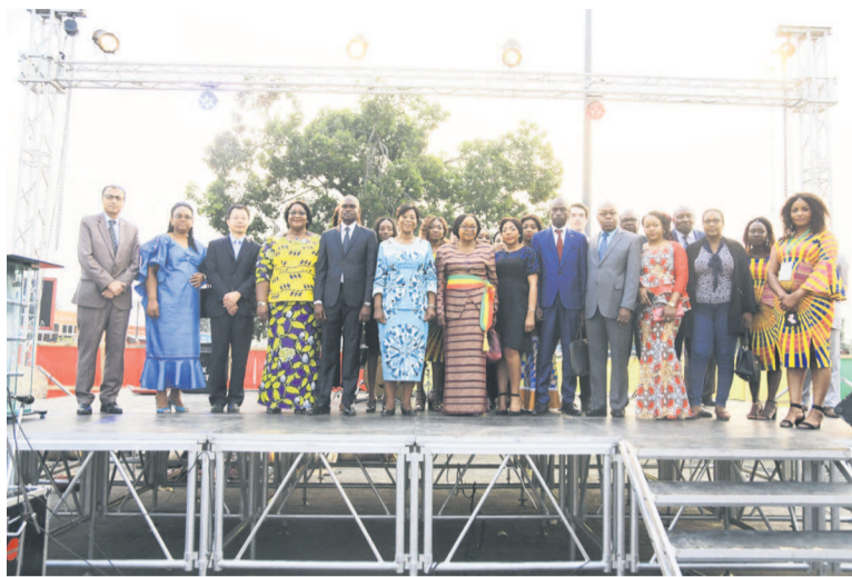
Les officiels posant à l'issue de la cérémonie de lancement de la deuxième édition

La seconde édition du festival d'images de Brazzaville (Festim Brazza) a été lancée par la ministre du Tourisme et de l'Environnement, Arlette Soudan-Nonault, marraine de l'édition, à l'esplanade du Centre national de radio et de télévision (CNRTV) à Nkombo, dans le neuvième arrondissement de la ville capitale, Djiri.