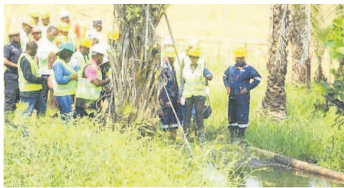
La rivière Matali polluée

La ministre du Tourisme et de l'Environnement, Arlette Soudan Nonault, vient d'effectuer une visite à la Pointe Indienne, au cours de laquelle elle a lancé un appel aux responsables de la société African oil gaz corporation de préserver ce site pétrolier, situé dans le département du Kouilou, contre la pollution.