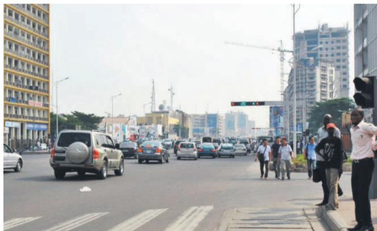
Le centre-ville de Kinshasa

Le cercle du Groupe des pays africains dotés des économies les plus compétitives de la région s'élargit au fur et à mesure de la publication des rapports internationaux comme le Doing business de la Banque mondiale.