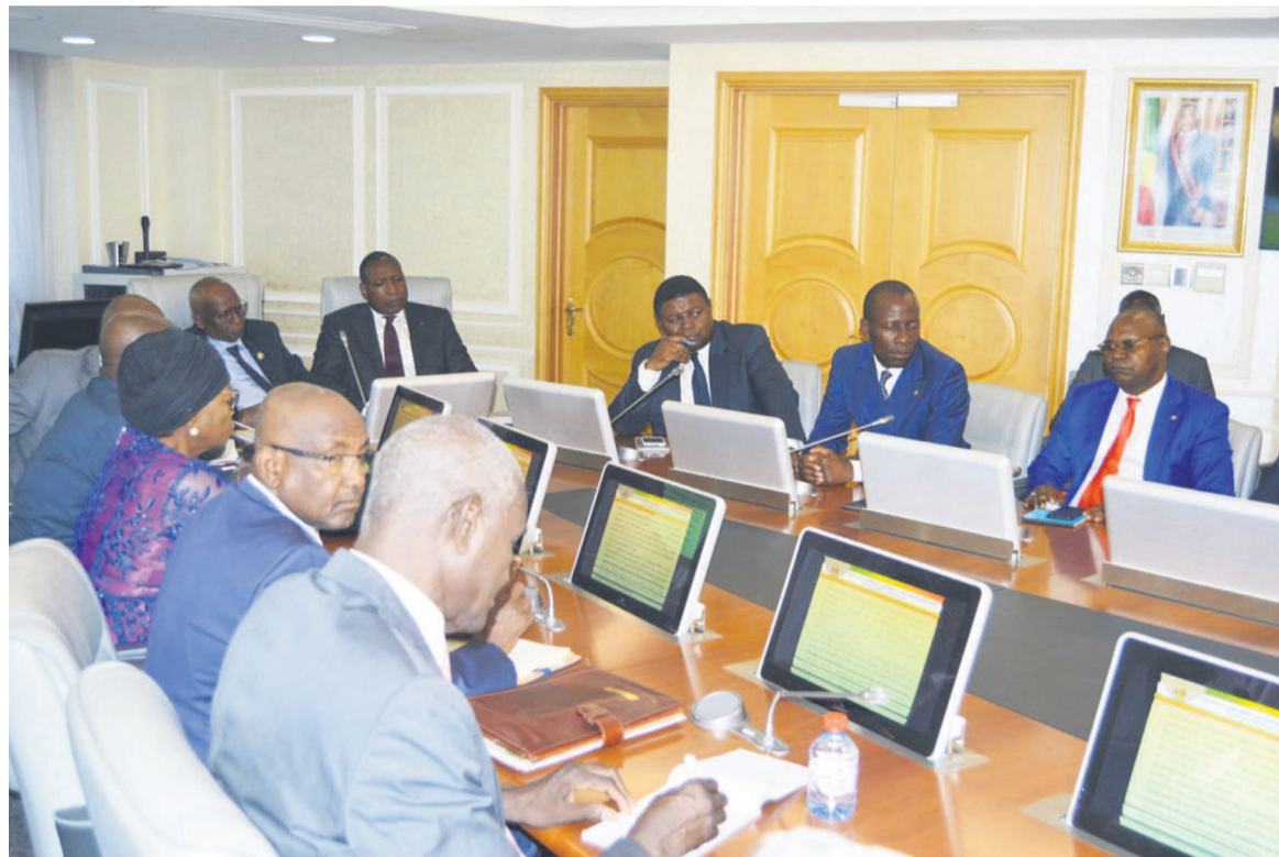
Les parlementaires tchadiens et congolais avec les experts des grands travaux

En séjour de travail au Congo, les députés membres de la commission Finances de l'Assemblée nationale du Tchad ont échangé avec les experts du ministère de l'Aménagement, de l'équipement du territoire et des Grands travaux, le 5 août à Brazzaville. Ils se sont fait une idée des infrastructures construites dans le pays pour son développement dans divers secteurs sociaux, entre autres, la santé, l'éducation, les transports, le sport, l'énergie. Les projets des routes d'intégration sous-régionale ont également été à l'ordre du jour.