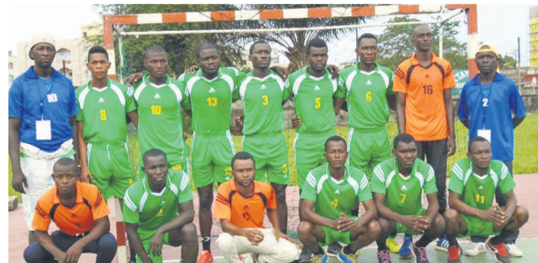
L'équipe de CTAHB/Adiac

égal de vingt et un buts partout. La Ligue a été sauvée le lendemain par l'exploit de ces deux représentants en juniors hommes, à savoir NHA Sport