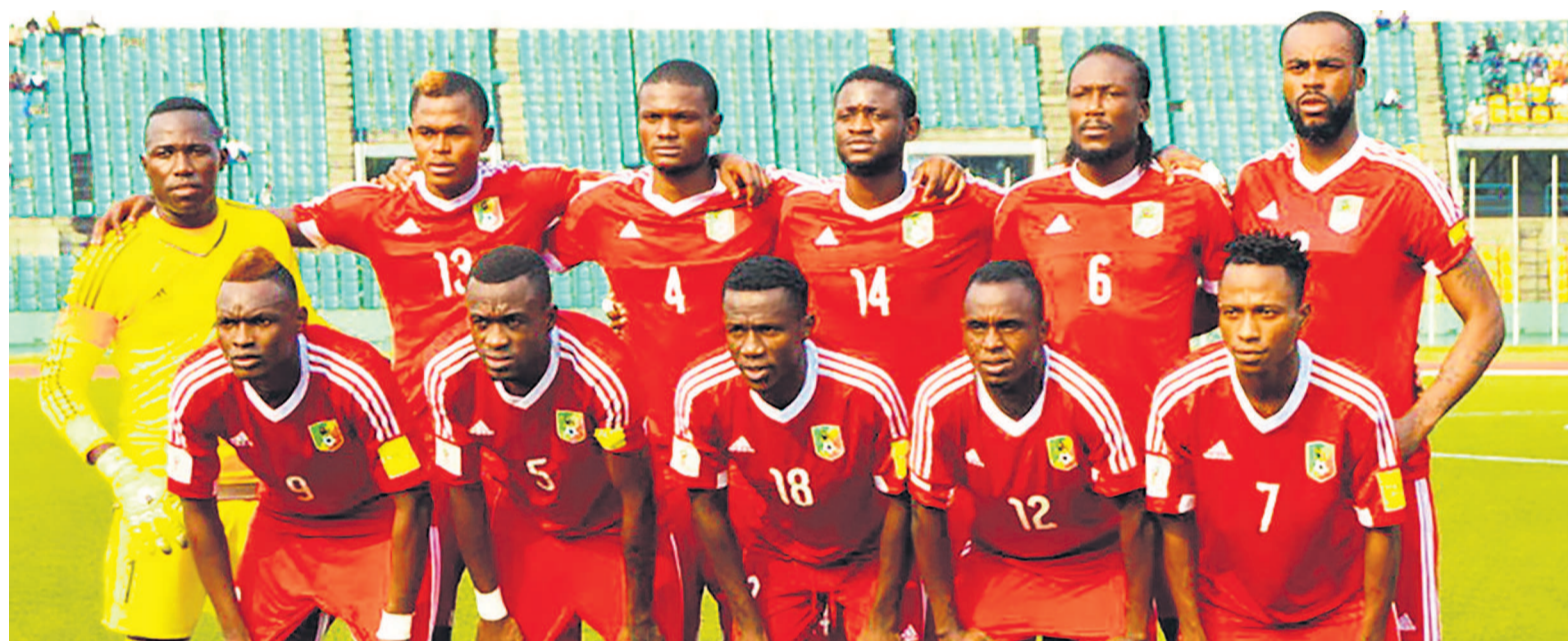
Une sélection des Diables rouges locaux