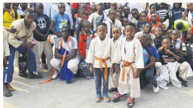
Une vue des athlètes

Dans le cadre des trente ans de la pratique de cet art martial au Congo, l'association congolaise de close, reconnaissante du travail abattu par les pratiquants, a récompensé les personnes ayant contribué à la promotion des vertus de cette discipline sportive.