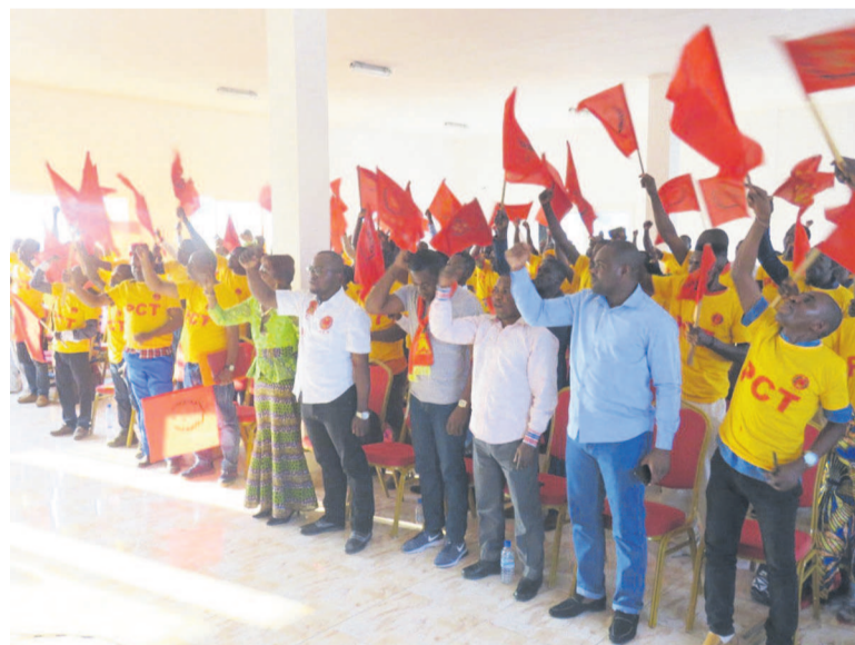
Des participants à l'assemblée générale

Poursuivant son propos, l'orateur a indiqué que, de juillet 2018 à mai 2019, le secrétariat fédéral du PCT Pointe-Noire s'est attelé à compléter les organes intermédiaires et de bases du parti dans le département de Pointe-Noire et à élire les nouveaux responsables au niveau des noyaux, cellules et