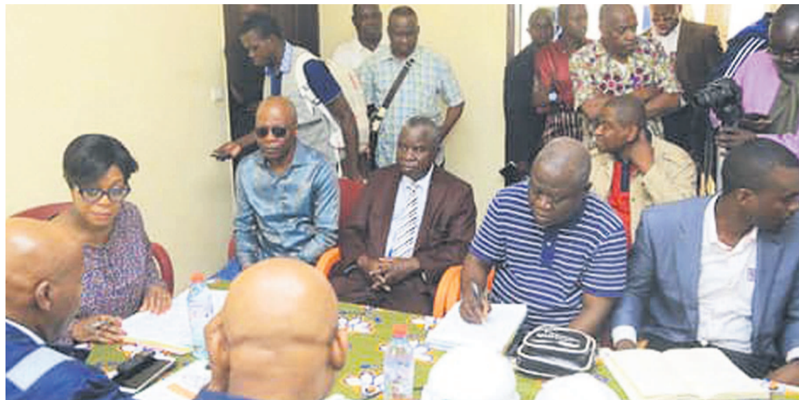
La séance de travail entre la ministre et les responsables de l'AOGC

La ministre a invité les responsables de la société AOGC, en ce qui concerne l'environnement, à ne pas faire une navigation à vue, ce qui est très délicat. En effet, dans le cadre de la normalisation de la gestion environnementale qu'il faut allier avec les questions de développement durable, elle a rappelé aux responsables de cette société la loi 1991 du 23 avril 1991 qui définit les conditions de la protection de l'environnement au Congo. Contexte dans lequel, elle exécute la politique en la matière conformément au décret 2017 du 10 octobre 2017 qui fixe les attri-