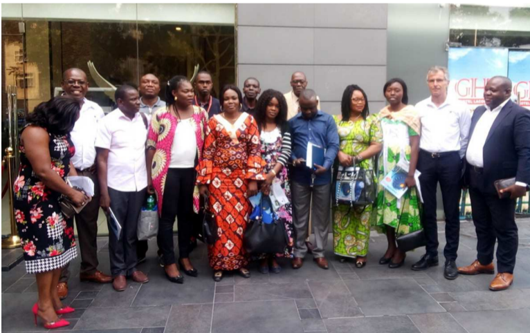
Les dirigeants Dangoté cement posant avec les journalistes

« Le bilan est globalement positif malgré la crise et la concurrence(...) Notre usine est située dans une zone où se trouvent le meilleur calcaire et argile du Congo. Nous avons des équipements de technologie avancée, no-