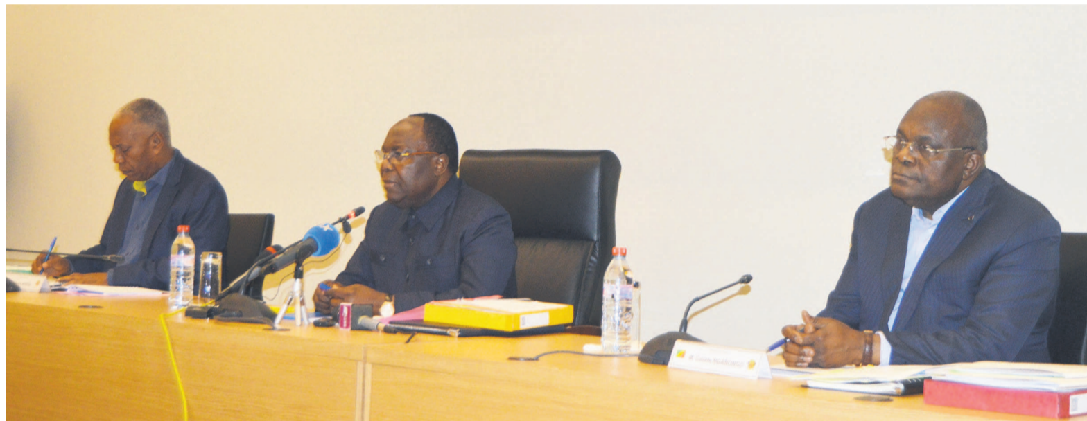
Le Premier ministre, Clément Mouamba, entouré de Firmin Ayessa et Calixte Nganongo

Cette revue portera sur l'évaluation des performances du Congo dans la mise en œuvre des huit mesures retenues sur quarante-huit pour ce contrôle semestriel. Page 4