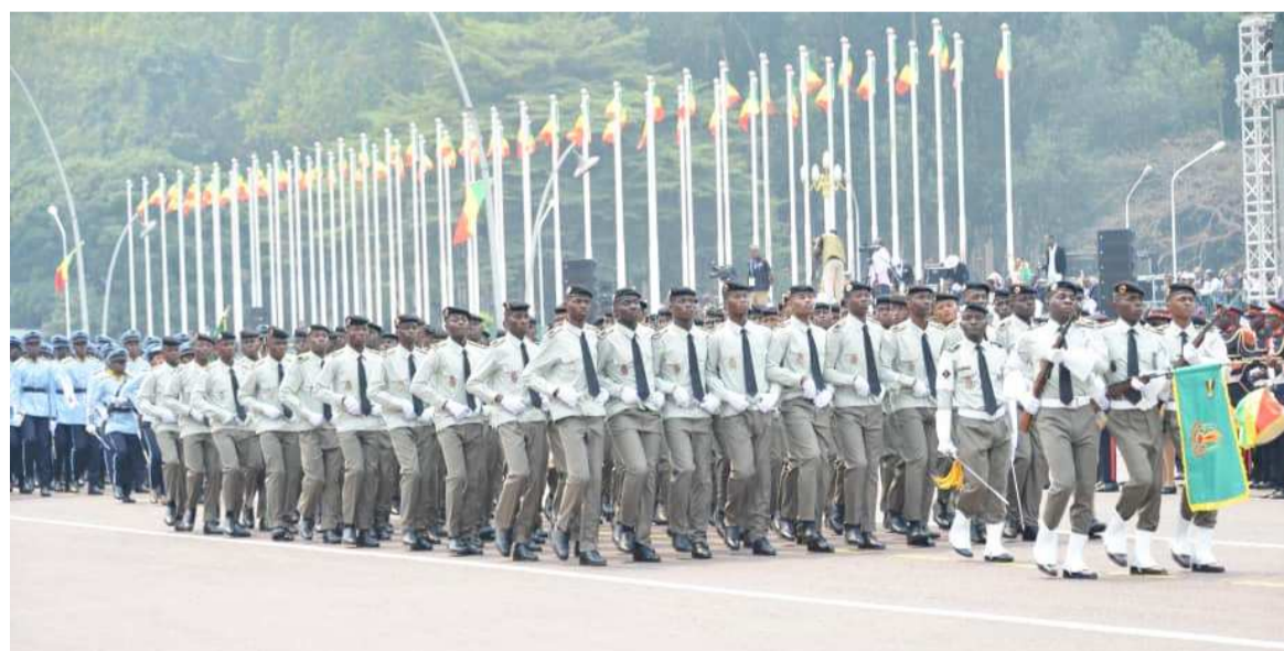
Le passage des troupes du commandement des écoles

Aussitôt, s'en est suivi le passage du drapeau national, des éléments du bataillon d'honneur, du régiment d'apparat ainsi que des troupes de l'Ecole militaire préparatoire général