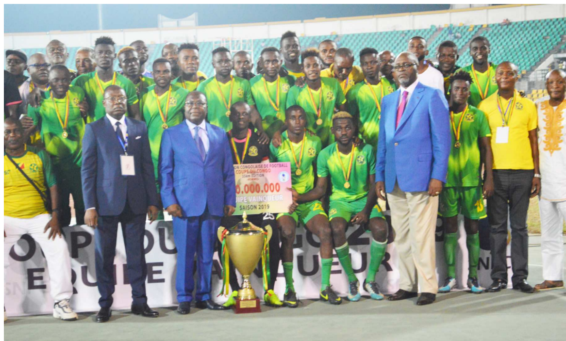
L'Etoile du Congo retrouve le sommet treize ans après Adiac