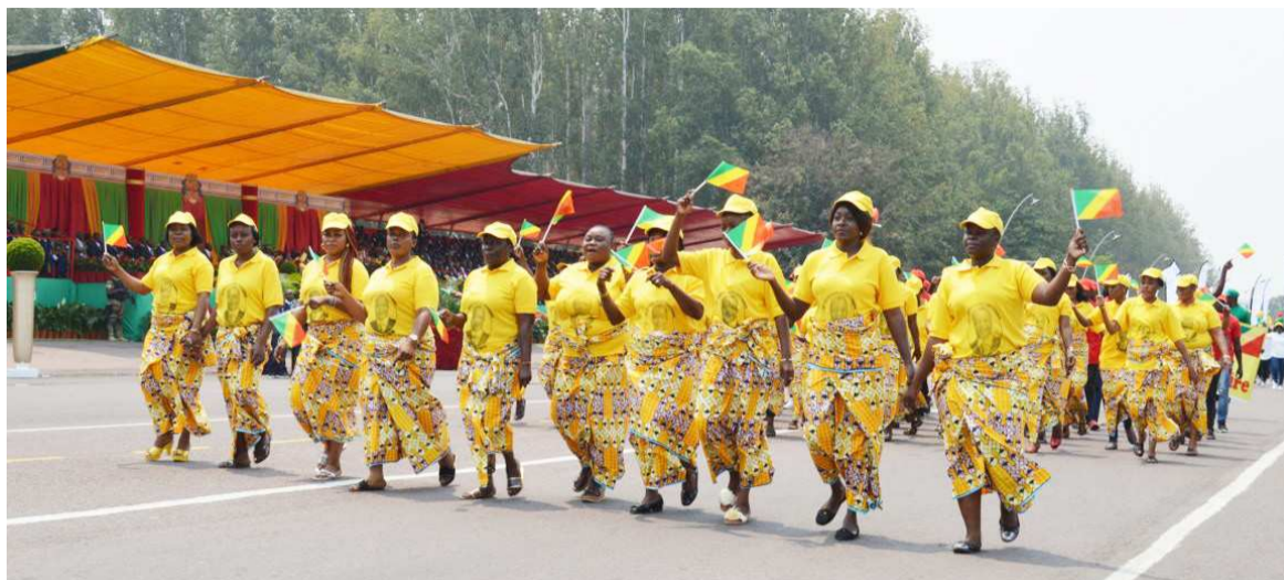
Un carré de femmes

Reconnu comme centre commercial de la ville de Brazzaville, le troisième arrondissement, Poto-Poto, pense que le commerce