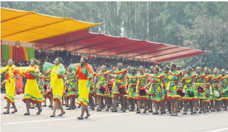
Le carré des jeunes filles en vert-jaune-rouge

Les partis politiques, les associations, les confessions religieuses et autres organisations ont mis en valeur les couleurs vert-jaune-rouge pour traduire leur fierté d'être des citoyens congolais. Des sapeurs qui ont fait de l'élégance un art de vivre ont également défilé en exhibant des chaussures de marque et costumes colorés, parfois aux couleurs panafricaines (vert, jaune, rouge). Peu importe si ces sapeurs congolais se sont ruinés en cette période de crise économique. Qu'ils empruntent ou collectent de l'argent pour s'acheter des costumes, leurs problèmes financiers ont été cachés sous les vêtements coûteux qu'ils