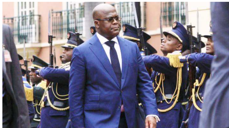
Félix Tshisekedi à son arrivée à Dar-es-Salaam en Tanzanie

En proie à une insécurité persistante causée par les groupes armés d'origine interne et externe, la partie est de la RDC requiert, pour sa pacification, l'implication de la sous-région compte tenu du spectre de la déstabilisation qui plane sur les États de cette partie du continent. Une approche défendue par Félix Tshisekedi lors du 39e sommet de la Sadc.