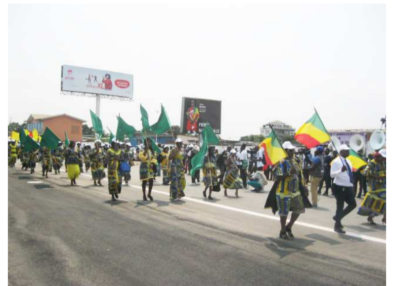
Le défilé civil

À Pointe-Noire, le défilé du 15 août s'est déroulé sur le boulevard Jacques-Opangault, dans le deuxième arrondissement Mvoumvou.