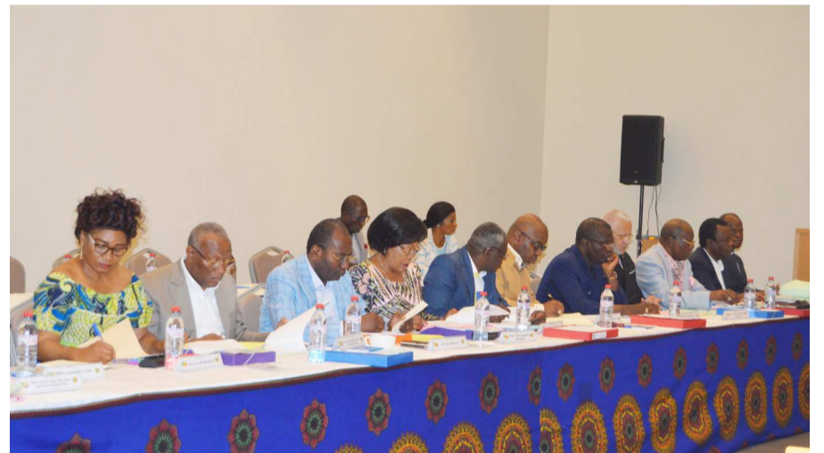
Une vue des membres du gouvernement

À la fin de la réunion, le ministre des Finances et du budget, Calixte Nganongo, a indiqué à la presse qu'à la première revue du décembre, le FMI a choisi huit mesures sur lesquelles il va axer son évaluation. Etant donné que l'accord s'étend sur trois ans, a-t-il précisé, l'examen semestriel se fera de manière à ce qu'à chaque