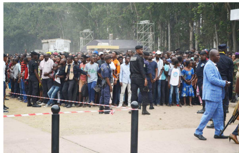
La police devant une foule enthousiaste

Pendant ce temps, un autre gamin de dix ans se plaint d'avoir perdu une de ses sandales. Essoufflé, il choisit de se retirer, et trouve immédiatement un autre endroit plus aisé. « J'attends la fin du défilé pour chercher ma sandale », explique-t-il. « Nous sommes ici depuis six heures pour mettre de l'ordre, et pour éviter que