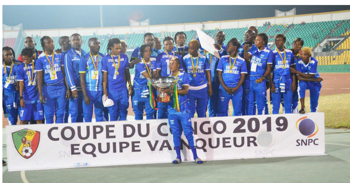
Les joueuses d'Epah Ngamba après leur victoire