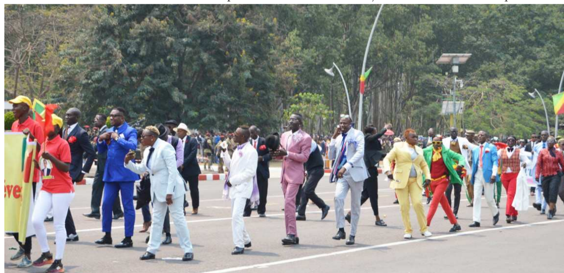
La parade des sapeurs

est l'un des maillons essentiels de la relance et de la diversifica-