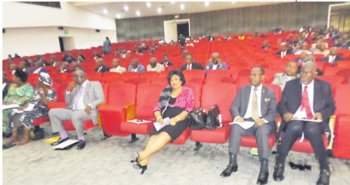
Les sénateurs au cours de l'adoption des projets de loi

ment intéressée au projet de loi fixant les missions, l'organisation et le fonctionnement de la police nationale. L'adoption de cette loi