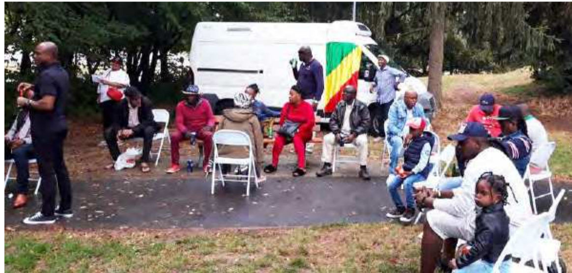
Des Congolais à Blois

pas que Paris comme ville de résidence des Congolais ».