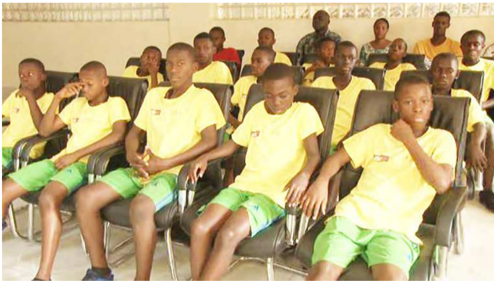
Les jeunes du centre de préformation

L'équipe U-14 du centre de préformation a quitté Brazzaville, le 17 août, pour participer en Italie au tournoi international de San Pellegrino.