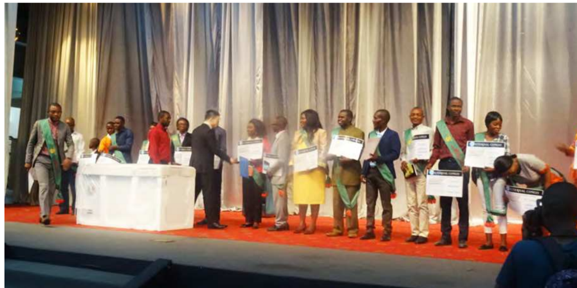
Remise des prix à quelques lauréats