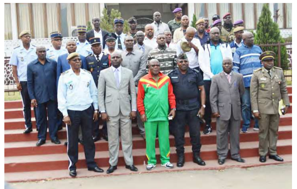
Les membres de l'Actp

Le nouveau président a invité tous les membres du bureau et tous les pratiquants de cet art martial à contribuer au rayonnement du taekwondo au sein de la force publique et les structures paramilitaires. « Je vous remercie pour la confiance faite à ma modeste personnalité ainsi qu'à tous les membres du bureau. J'invite chacun d'entre nous à se mettre au travail afin que le taekwondo gagne ses