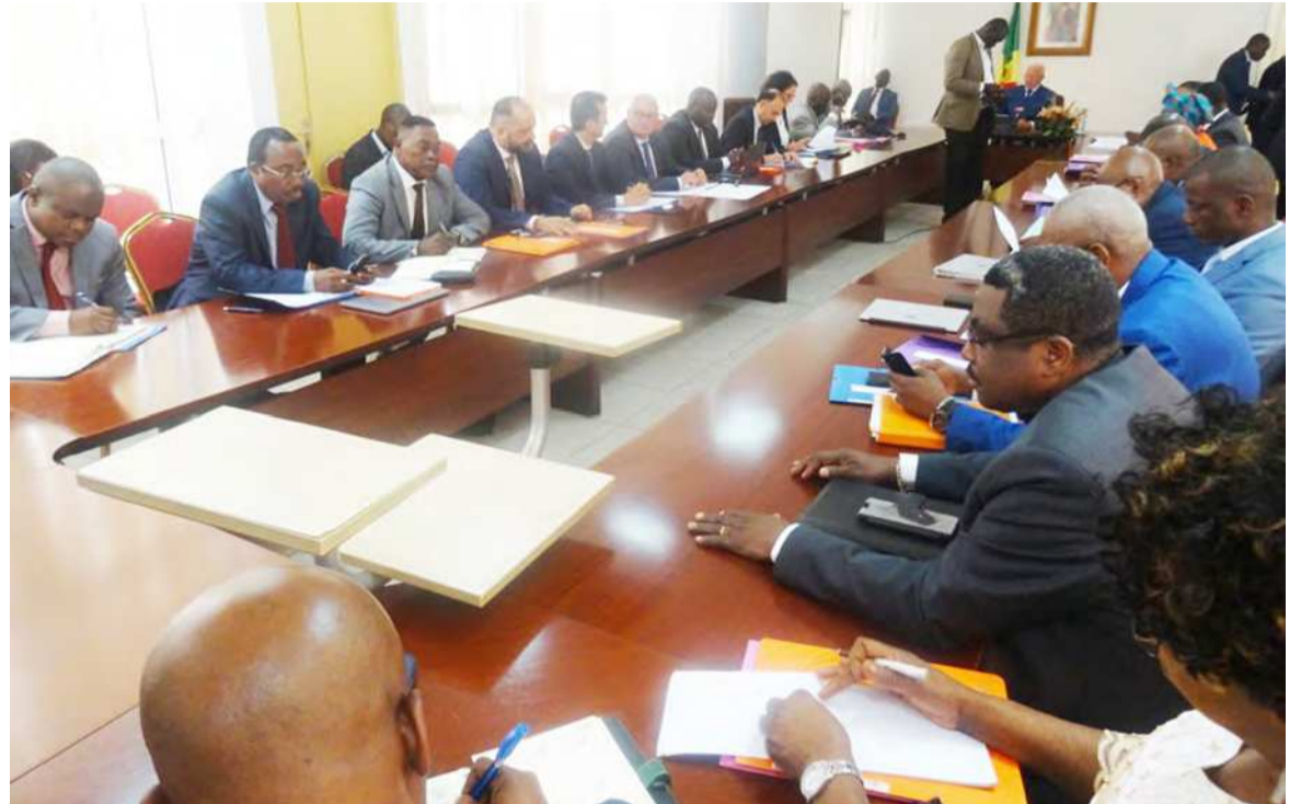
Les participants à l'ouverture des travaux

tion des prix à la pompe, en fonction de la conjoncture et des réalités locales. Quant à la proposition des prix, la dernière réglementation remonte à 2008. D'après la tutelle, la relance des activités de cette structure est l'une des demandes du Fonds monétaire international (FMI). « J'attends des membres du comité l'accomplissement rigoureux des missions qui leur sont assignées