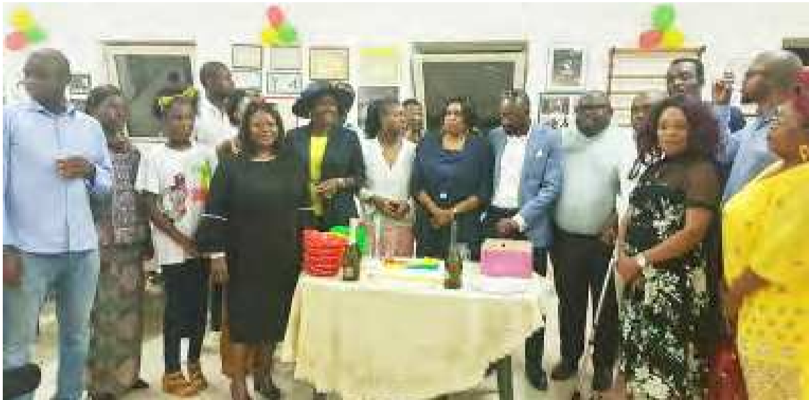
Des Congolais de l'Italie

À l'occasion de la Fête nationale, le 15 août dernier, une série d'activités destinées au grand public ont eu lieu dans différents lieux de résidence des Congolais de l'étranger, leur permettant de participer à un moment festif patriotique