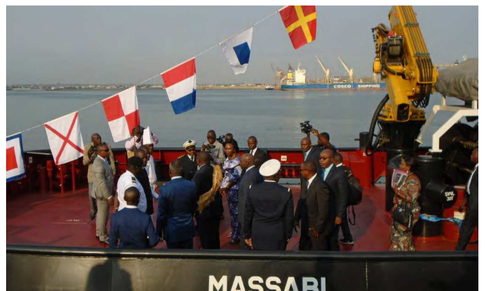
les officiels à bord du remorqueur Massabi

Après le rituel traditionnel et symbolique de consécration du remorqueur, la visite guidée à quai par le commandant du port et en mer sur le bassin portuaire de madame l'épouse du 1er ministre, des membres du gouvernement et des différentes autorités a mis fin à la cérémonie de baptême du remorqueur Massabi.