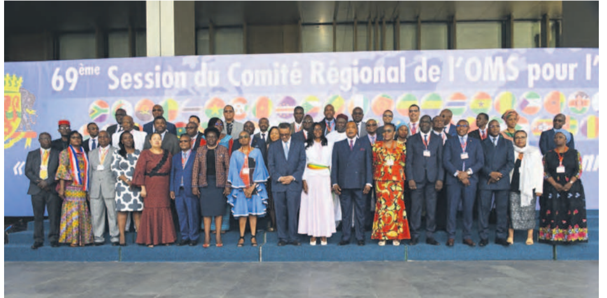
Le président Denis Sassou N'Guesso et les participants à la 69ème session du comité régional de l'OMS-Afrique

Devant le représentant de l'OMS, Tedros Adhanom Ghebreyesus, la représentante de l'OMS-Afrique, Dr Moeti Matshidiso, et les ministres de la Santé des quarante pays représentés, Denis Sassou N'Guesso a évoqué l'urgence d'une réponse stratégique globale afin de lever les obstacles qui entravent l'élargissement de la couverture sanitaire universelle dans le continent. « J'exhorte les Etats africains à prendre part à la réunion de haut niveau sur cette problématique prévue le 23 septembre 2019 à New York, en marge de la 74e session de l'Assemblée générale de l'Organisation des Nations unies », a déclaré le président de la République. Pour sa part, la représentante