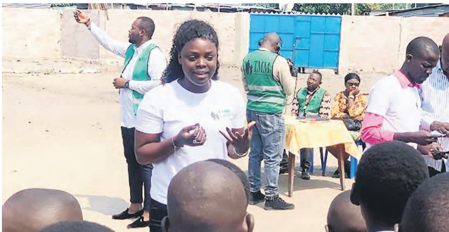
L'ASBL TMM encadrant les enfants des policiers et militaires