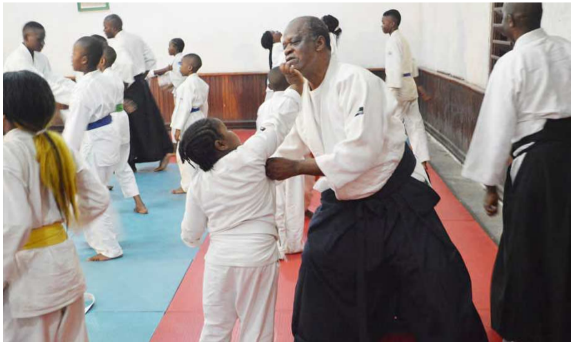
Démonstration d'une technique lors du lancement d'Aïki-vacances

Très heureux de découvrir ce sport de combat, certains apprenants estiment que l'Aïkido change leur façon d'agir et ils invitent à cet effet les enfants de moins de dix-sept