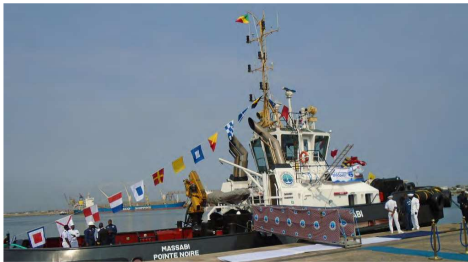
Une vue du remorqueur Massabi

Le baptême du remorqueur Massabi a respecté la vieille tradition en matière de lancement des activités des navires dans les ports du Congo. Après le rituel d'usage fait par les notables de la Cour royale,