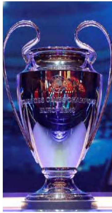
Trophée de la ligue des champions UEFA

Bayern Munich (Allemagne) Tottenham (Angleterre) Olympiakos (Grèce) Etoile Rouge de Belgrade (Serbie)