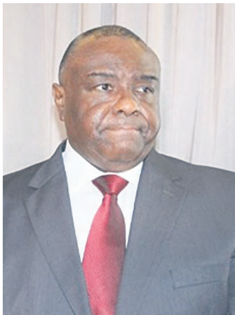
Jean-Pierre Bemba

Dans son ordonnance du 28 août 2019 portant sur l'ordre du jour de cette audience qu'elle va tenir le 4 septembre, la chambre d'appel