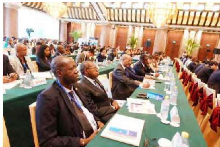
Les participants au forum

Parmi les problèmes énumérés figurent l'amélioration des infrastructures, le renforcement des capacités, la favorisation des transferts de technologie, la formation dans différents domaines. L'Afrique doit également s'assurer de sa technicité et de sa capacité à défendre aux mieux ses intérêts. Elle doit aussi mettre l'accent sur les investissements structurants, afin d'améliorer la capacité d'offre et faire de telle sorte que les économies