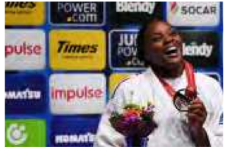
Madeleine Malonga

La Française de 25 ans, originaire du Congo-Brazzaville, a remporté la médaille d'or, le 30 août, à Tokyo, au Japon, lors de la finale, dans la catégorie des moins de 78 kg.