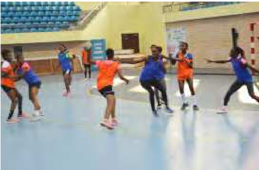
La sélection des Diables rouges en plein entraînement

Le staff dirigé par Adolph Lembessi a focalisé son travail sur les techniques individuelles. « Ce sont des enfants que nous avons détectés lors des championnats national