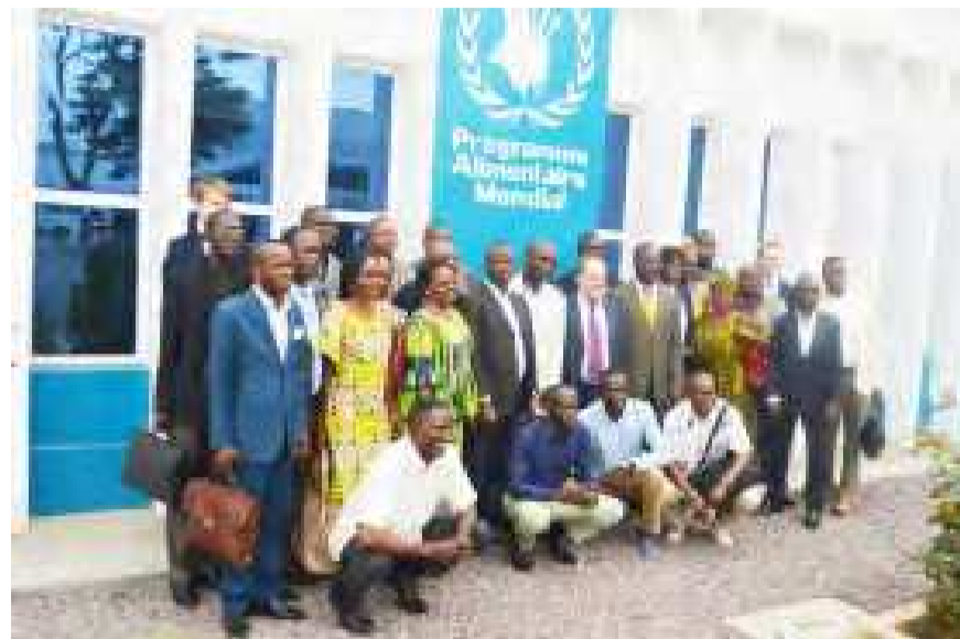
Les acteurs impliqués dans l'analyse pour la sécurité alimentaire

Zone 1, forêt dense nord : cacao, banane, fruitiers, manioc ; zone 2, forêt dense inondée : pêche, banane, manioc ; zone 3, savane arbustive ouest : bovins, pisciculture, igname, manioc ; zone 4, savane herbeuse