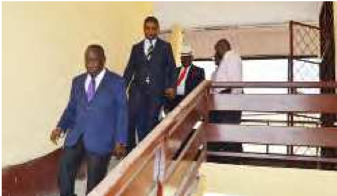
Le préfet et ses hôtes visitant le nouveau bâtiment qui servira à sécuriser et assurer la conservation du patrimoine archivistique de Pointe-Noire

en mettant à la disposition de la direction départementale du patrimoine et des archives, un nouveau bâtiment qui servira à sécuriser et assurer, dans les conditions optimales, la conservation du patrimoine archivistique. Il convient toutefois de noter que les archives coloniales et postcoloniales de la ville océane sont conservées dans un espace inadapté qui les expose du jour au jour à la dégradation. En 2017, une mission conjointe des archives nationales et l'université de Genève, financée par