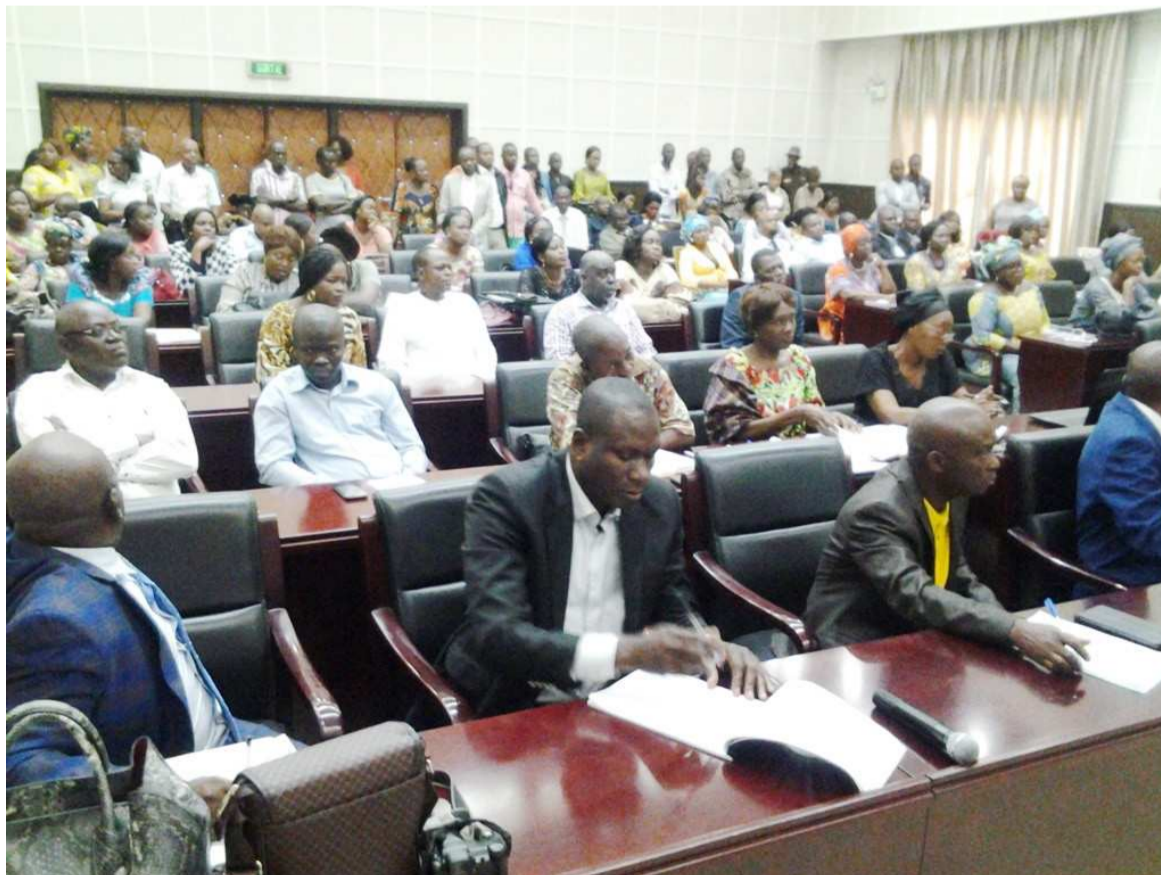
Une vue des participants à la réunion

Décliné en trois piliers, ce plan stratégique s'appuie sur la transformation de la gouvernance de la direction générale du travail via l'introduction de la planification stratégique, important outil de gouvernance à tous les niveaux de manière à créer une synergie entre toutes les directions. « On nous a toujours re-