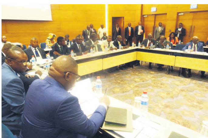
Les participants aux travaux

Un atelier se tient du 4 au 5 septembre à Brazzaville sur la validation d'un nouveau plan de réformes du système de gestion des finances publiques. Les participants planchent sur une étude diagnostique effectuée par un cabinet d'experts sur le mécanisme de gestion des fonds publics. La réforme envisagée obéit aux dispositions de la Communauté économique des Etats de l'Afrique centrale. Elle vise, entre autres, à accroître l'efficacité dans la gestion publique, à améliorer la transparence et les habitudes de travail des acteurs de la chaîne des dépenses et des recettes de l'Etat. Page 3