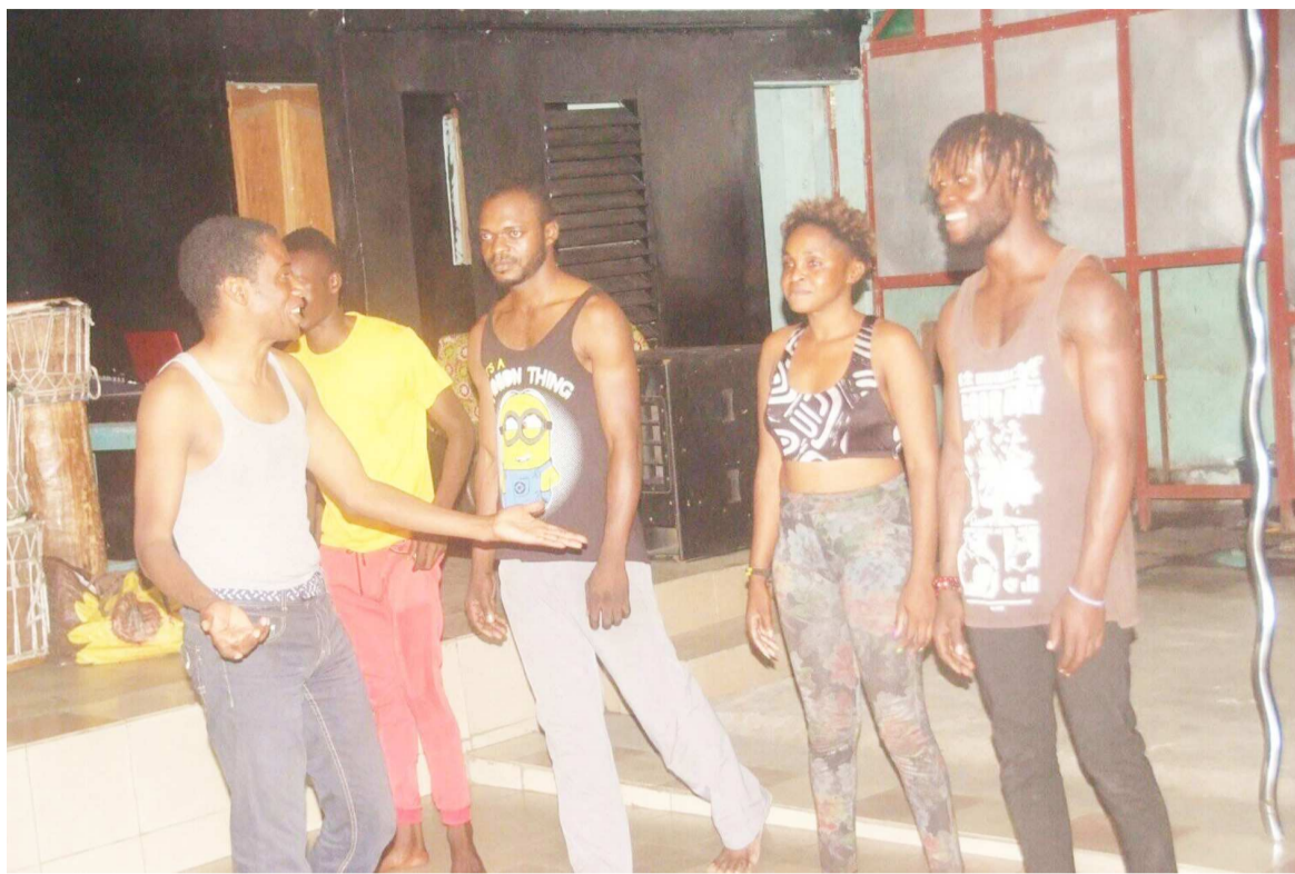
Des danseurs en formation à Pointe-Noire