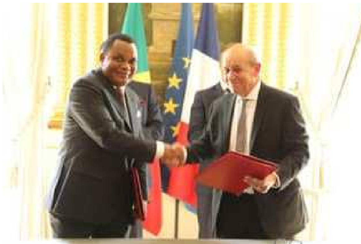
Jean-Claude Gakosso et Jean-Yves Le Drian le 3 septembre à l'Élysée

Reçu en audience par le président Denis Sassou N'Guesso peu avant la rencontre, mardi, du chef de l'Etat congolais avec son homologue français, Emmanuel Macron, à l'Élysée, le ministre français des Affaires étrangères, Jean Yves Le Drian, n'avait pas souhaité répondre à la presse congolaise malgré l'insistance de celle-ci.