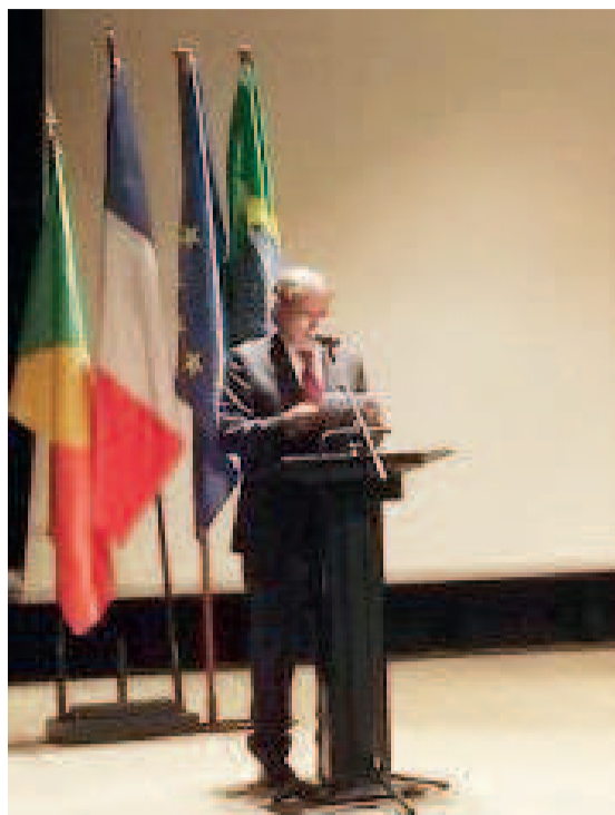
L'ambassadeur du Brésil prononçant son speech avant l'ouverture du festival