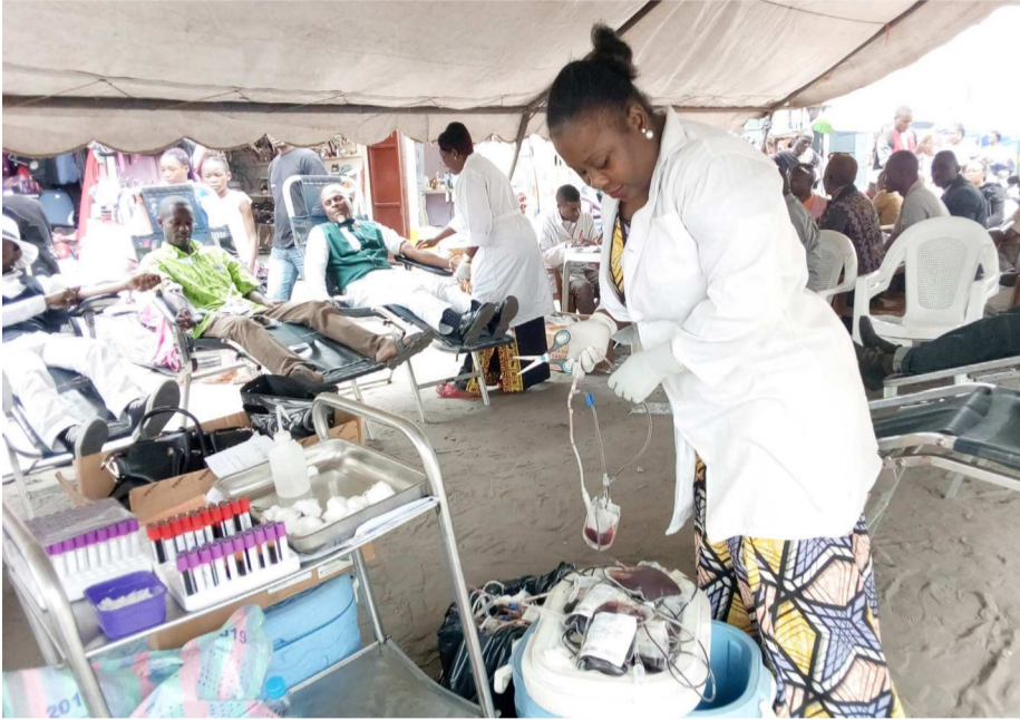
Les agents du CNTS en pleine activité

Les agents du Centre national de transfusion sanguine (CNTS) ont pu récolter, après deux jours d'une opération menée à Ouenzé, le cinquième arrondissement de la capitale, cent-soixante-douze poches de sang.