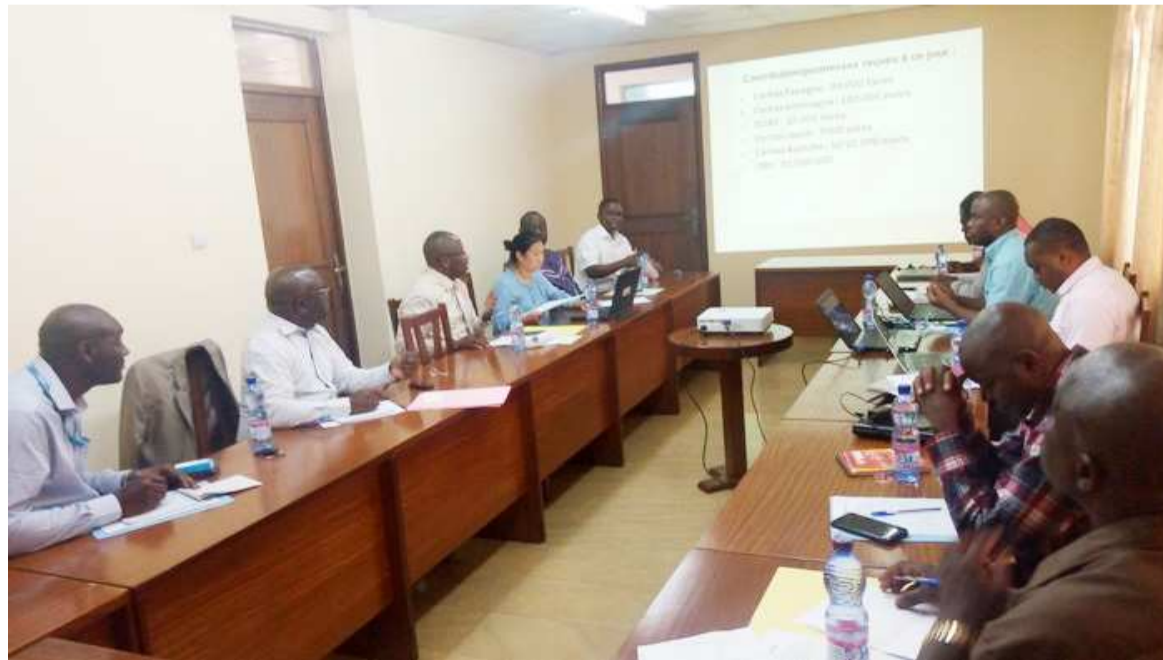
Les participants au Country forum de Caritas

Ils ont souligné, par ailleurs, la nécessité d'améliorer la visibilité de cette contribution du réseau Caritas. Un photographe mandaté par la Caritas Internationalis est annoncé dans ce sens pour réaliser des reportages sur le travail du réseau Caritas dans les zones affectées par Ebo-