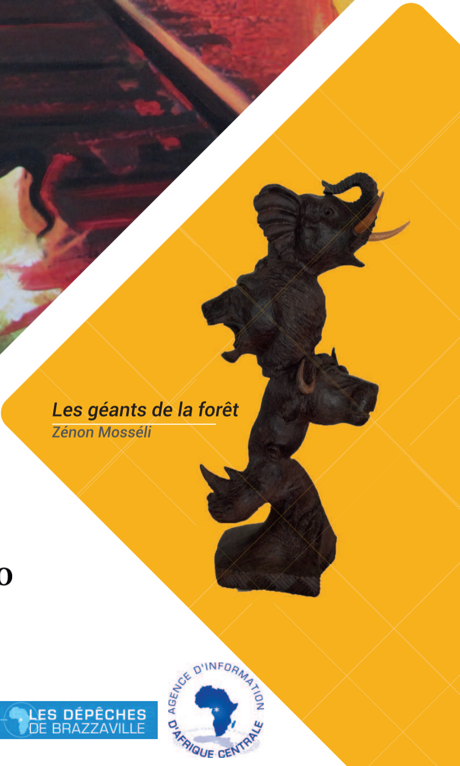
Les géants de la forêt Zénon Mosséli