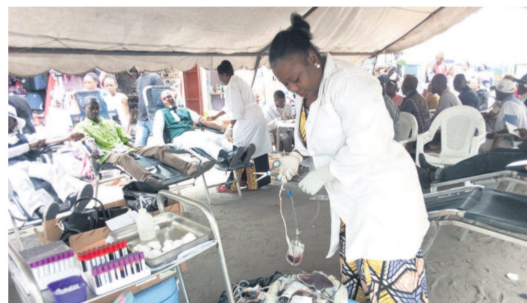
Les agents de CNTS lors de la collecte

Une opération de don de sang organisée par le Centre national de transfusion sanguine a permis de collecter, en deux jours, 172 poches de sang auprès des donateurs volontaires à Ouenzé, dans le cinquième arrondissement de Brazzaville.