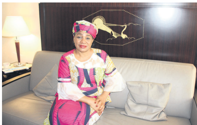
La ministre de l'Economie forestière, Rosalie Matondo

Après la déclaration conjointe sur l'Initiative pour les forêts d'Afrique centrale, en septembre 2017 à New-York, le gouvernement a signé, le 3 septembre 2019 à Paris, la lettre d'intention pour le financement du plan d'investissement de la stratégie Redd+ de la République du Congo. Dans une interview aux Dépêches de Brazzaville, la ministre de l'Economie forestière, Rosalie Matondo, explique le processus de négociation mené par son pays en vue de maintenir un taux de déforestation bas tout en diversifiant son économie. Page 5