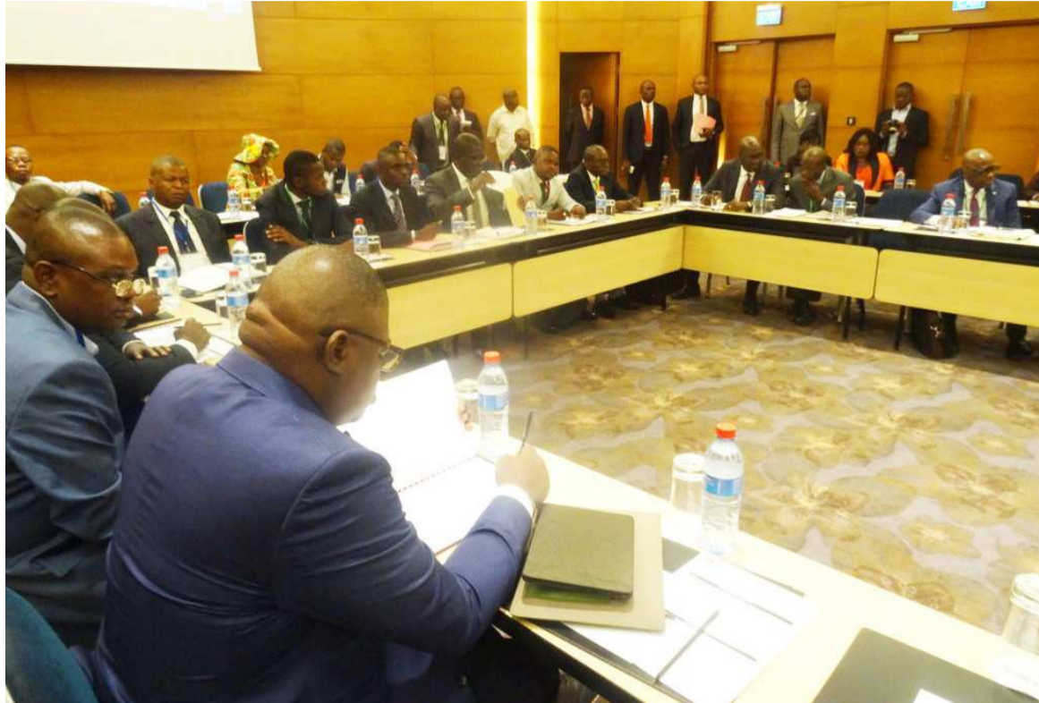
Les participants aux travaux

Celle-ci a voulu s'étendre à d'autres acteurs de la chaîne de gestion des dépenses et recettes, grâce à un appui du projet de réformes intégrées du secteur public.