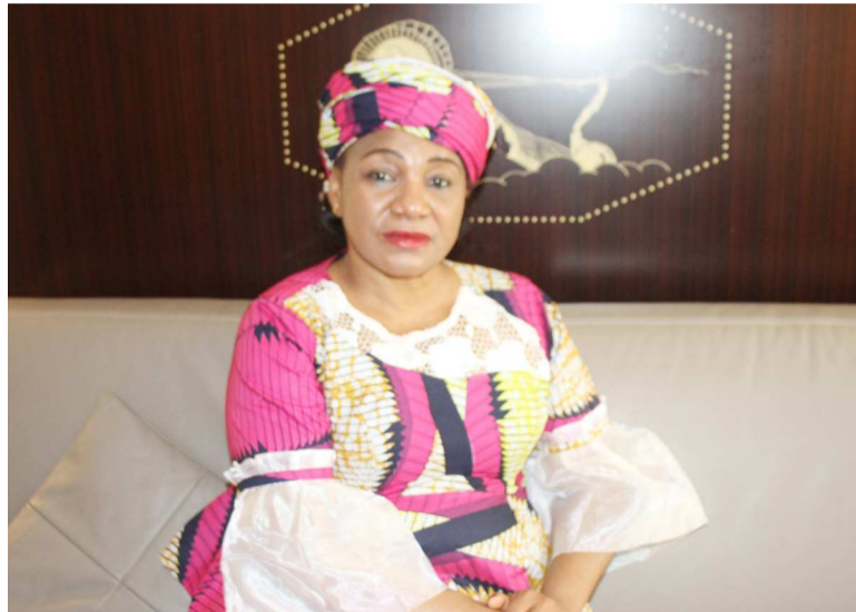
La ministre congolaise de l'Économie forestière, Rosalie Matondo

Après la déclaration conjointe sur l'Initiative pour les forêts d'Afrique centrale, en septembre 2017 à New-York, le gouvernement a signé, le 3 septembre 2019 à Paris, la lettre d'intention pour le financement du plan d'investissement de la stratégie Redd+ de la République du Congo. Dans une interview aux Dépêches de Brazzaville, la ministre de l'Economie forestière, Rosalie Matondo, explique le processus de négociation mené par son pays en vue de maintenir un taux de déforestation bas tout en diversifiant son économie.