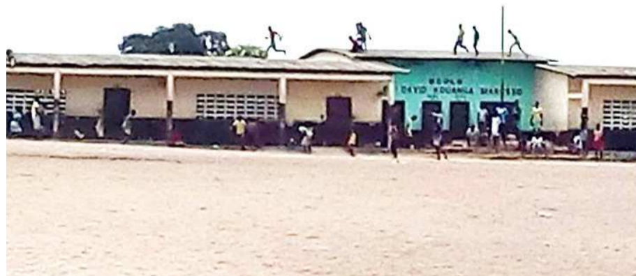
Les enfants jouant sur les toits de l'école primaire David-Kouanga-Makosso

Chaque année en période de fermeture des classes, la plupart des parents envoient leurs enfants en colonie de vacances pour leur permettre de faire de nouvelles rencontres, de s'évader et de découvrir de nouveaux horizons. Malheureusement, certains d'entre eux n'ont pas cette chance d'aller passer les vacances ailleurs et traînent dans les quartiers à longueur de journée car peu d'activités leur sont proposées. Face à cela, ils ont transformé les