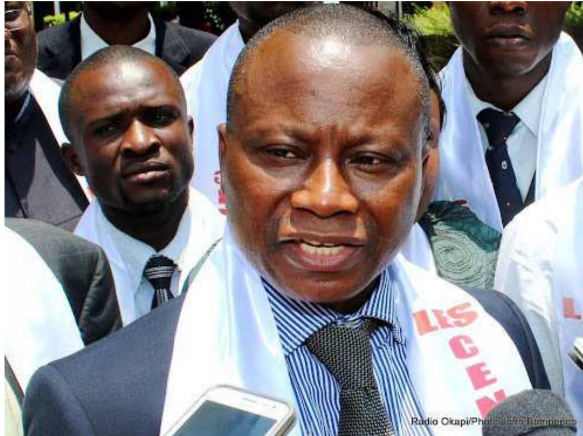
Le député national et cadre de Lamuka, Chérubin Okende