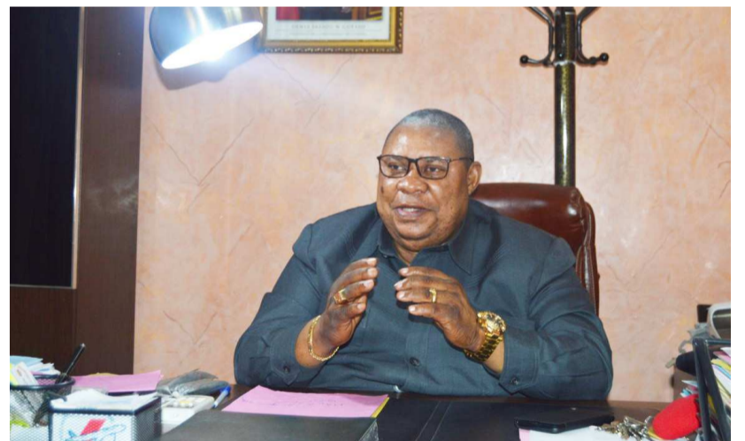
Le directeur de la répression des fraudes commerciales expliquant les opérations de contrôle

Les contrôles routiniers ont amené la direction de la répression des fraudes commerciales à mettre la main sur des cartons de poulets avariés dans quelques chambres froides de la capitale. Ces produits alimentaires ont été déclarés impropres à la consommation du fait