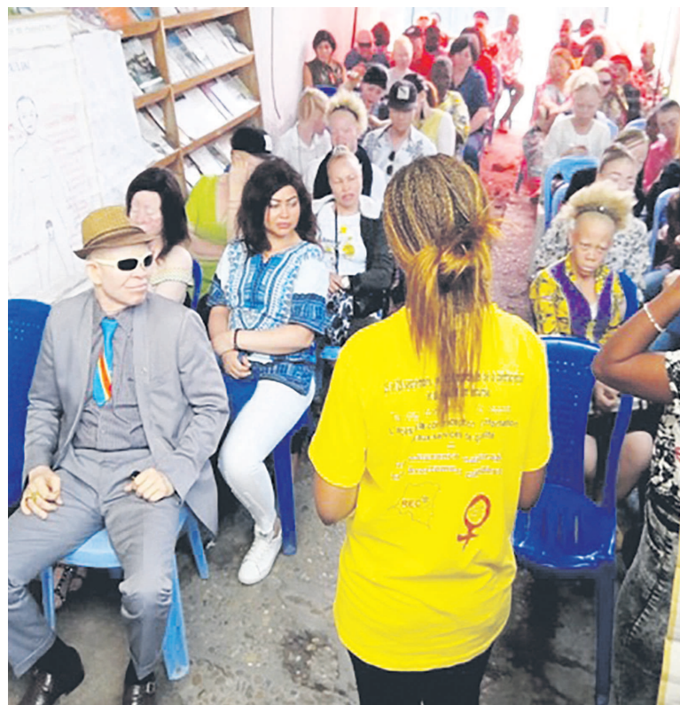
Une vue de la salle lors de la matinée d'échange

Sans langue de bois, les deux intervenantes ont insisté sur l'utilisation des préservatifs, la prise des pilules, la