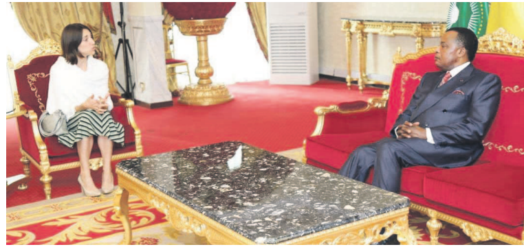
Denis Sassou N'Gusso et Isabelle Grippa lors de l'audience

lantique, le port autonome de Pointe-Noire est aussi l'axe par lequel sa vocation de pays de transit au cœur de l'Afrique centrale fait de lui l'un des maillons essentiels de la circulation des personnes et des biens au