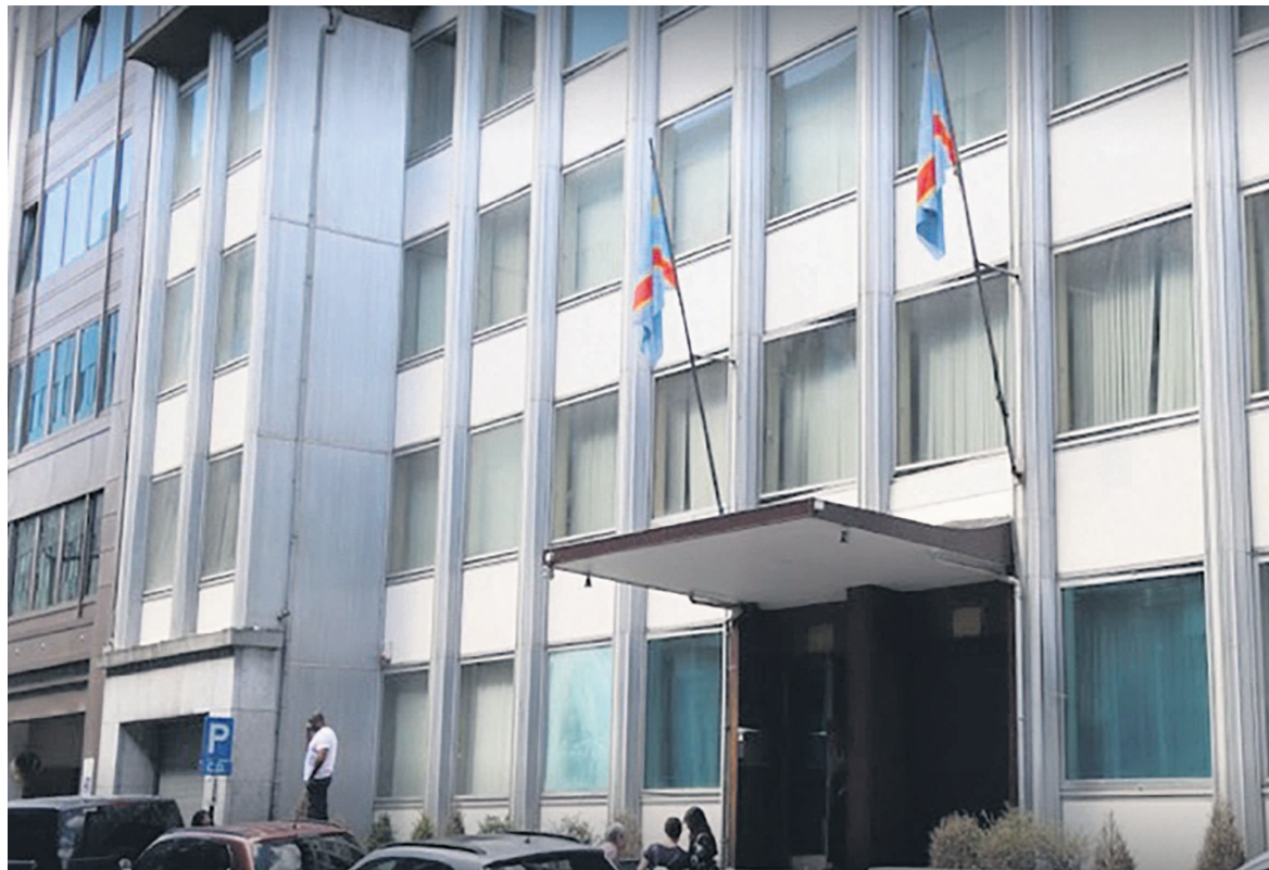
Une vue du bâtiment abritant l'ambassade de la RDC en Belgique

Dans un communiqué publié le 11 octobre, la représentation diplomatique du pays au royaume de Belgique a déclaré avoir chargé ses avocats de déposer plainte pour des actes de brigandage dont elle a fait l'objet, le 5 octobre.