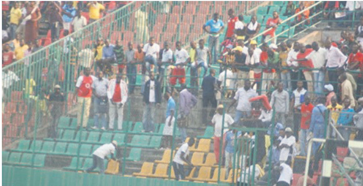
Une vue des supporters en furie au stade Alphonse-Massamba-Débat/Adiac

« Au cours de cette réunion, il s'agira d'insister sur la nécessité pour les responsables de la sécurité nationale d'accroître l'importance de la planification de la sécurité et des phases d'exécution de tous les matchs de leur domaine, d'obtenir un engagement ferme de toutes les associations membres quant à l'amélioration des normes de sécurité et de sûreté dans leurs juridictions respectives. Il sera également question d'établir un réseau efficace et une coopération entre les agents de la sécurité nationale »