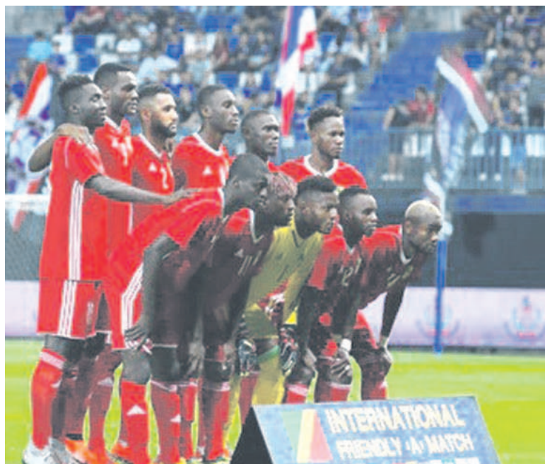
Le onze de départ congolais lors du match face à la Thaïlande à Bangkok