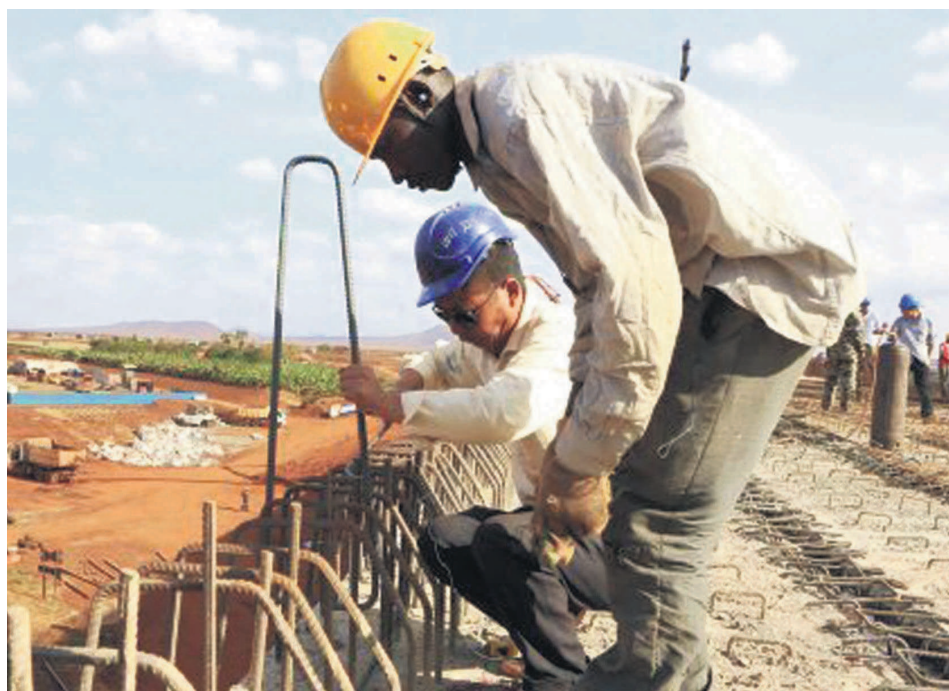
Un chantier piloté par des ingénieurs kinois à Kinshasa