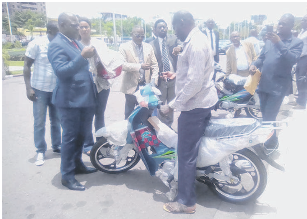
Le premier adjoint au maire de Brazzaville encourageant l'équipe des contrôleurs

« Il s'agit pour les agents municipaux relevant de la direction de l'Environnement d'occuper le terrain. Il faut la rigueur. Il y a des comportements à ne plus tolérer car les Brazzavillois doivent comprendre qu'on ne doit pas jeter la saleté dans la rue mais plutôt dans les bacs à ordures. Cette mission permettra à la mairie de renflouer les caisses de la recette municipale »