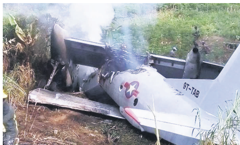
Un crash d'avion sur le ciel congolais