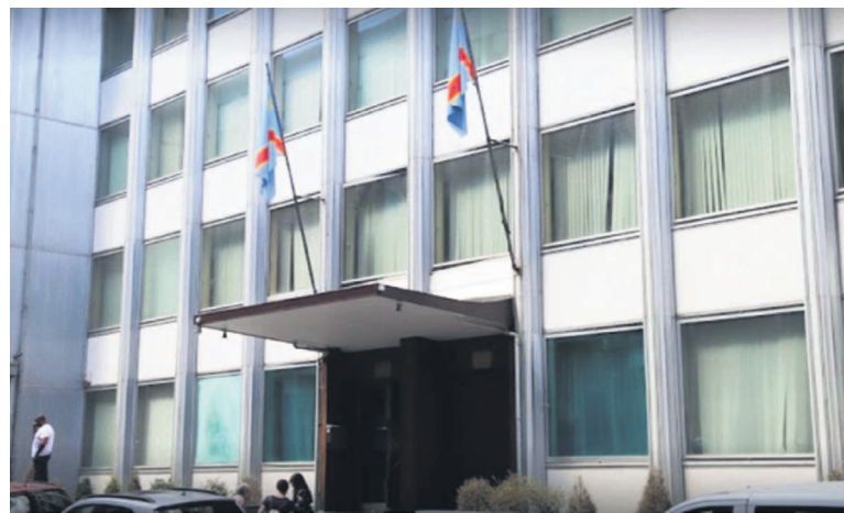
Une vue du bâtiment abritant l'ambassade de la RDC en Belgique

Dans son communiqué du 11 octobre, la représentation de la RDC au royaume de Belgique a déclaré avoir chargé ses avocats de déposer plainte pour des actes de vandalisme dont elle a fait l'objet le 5 octobre. L'ambassade indique que des individus, dont certains ont été « formellement identifiés », se sont adonnés à des actes de