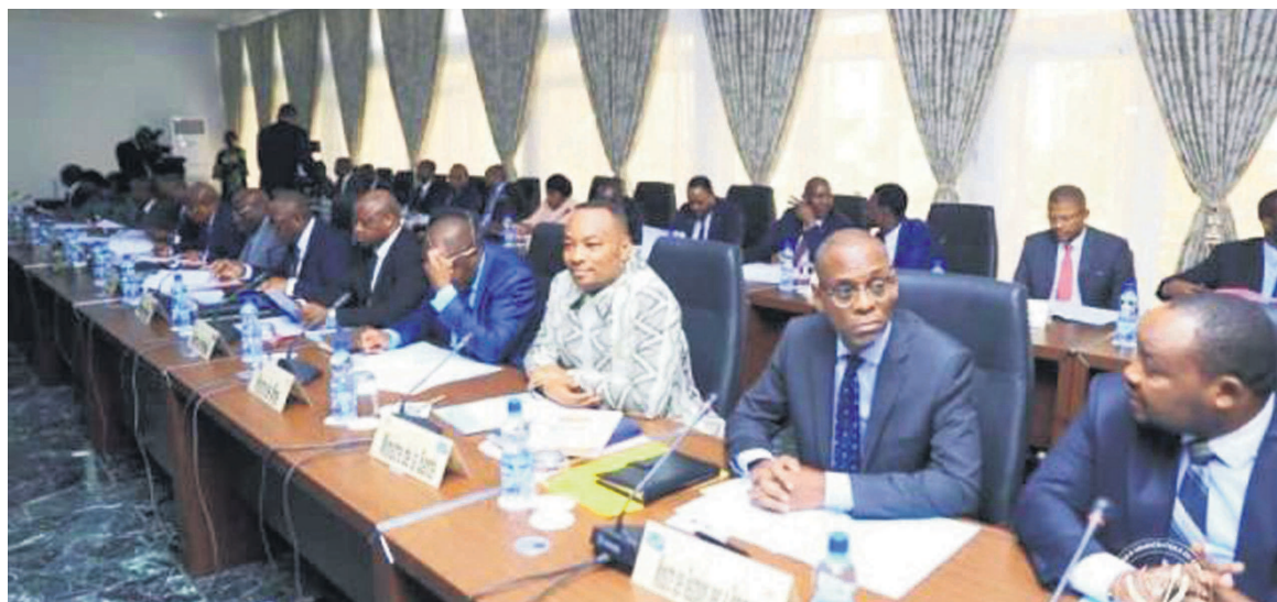
Des membres du gouvernement en conseil des ministres

La RDC vient d'augmenter son budget annuel avec des prévisions atteignant dix milliards de dollars américains pour 2020. C'est ce qui ressort du Conseil des ministres qu'a présidé Félix Tshisekedi, le 11 octobre. Parallèlement à cette option,