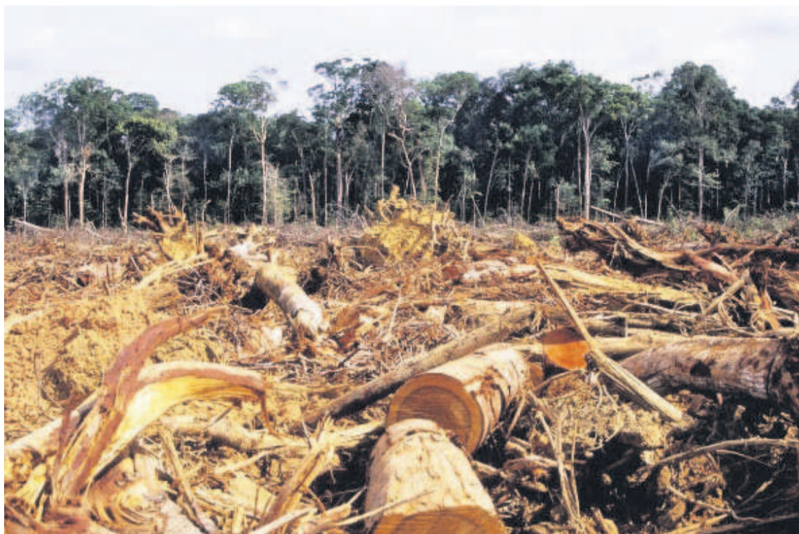
La lutte contre la déforestation, un enjeu majeur

jourd'hui déplacé, il faut donc le régler maintenant », a-t-il indiqué.