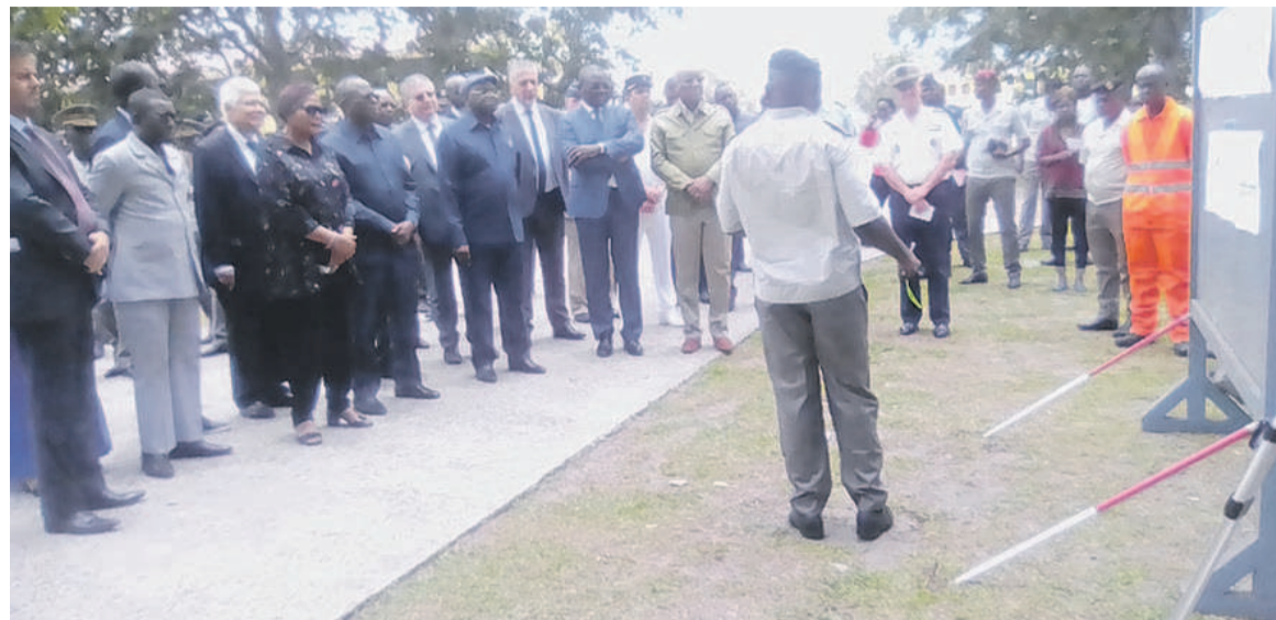
Les officiels suivant les explications d'un dirigeant de l'établissement Adiac

En dix années d'existence, l'établissement compte plus de seize stages actuellement. Il a créé et mis en place un cours de perfectionnement des officiers subalternes. « L'école est et demeure une école nationale à vocation régionale qui rayonne au cœur de l'Afrique, rayonnement nourri par les nombreux témoignages que nous recevons de nos anciens stagiaires internationaux engagés dans les opérations de soutien à la paix des Nations unies ou œuvrant inlassablement pour le développement de leurs