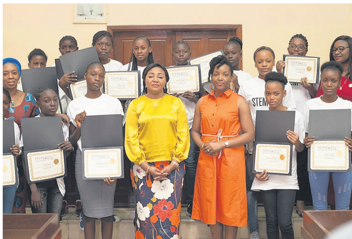
Lancement de Stem DRC initiative, en présence de Denise Nyakeru Tshisekedi

Les bourses d'études de l'année 2019 seront remises au courant de ce mois d'octobre. Les lauréats, sur une base concurrentielle, explique-t-on, recevront six cents dollars américains pour les frais de scolarité, les syllabus et le transport. Les bourses sont renouvelables pendant la durée des études des lauréats, pourvu que ceux-ci postulent chaque année tout en maintenant les critères d'excellence. Sur les cinquante-trois bourses, vingt sont prises en charge par la Fondation Denise Nyakeru-Tshisekedi, la fondation de la première dame de la République démocratique du Congo (RDC). « J'ai la conviction qu'orienter les filles aux Stem contribuera à la valorisation de l'élite féminine de demain », a fait savoir Denise Nyakeru Tshisekedi sur Twitter. Pour sa part, la Pre Sandrine Mubenga, fondatrice de Stem DRC initiative, a fait savoir au Courrier de Kinshasa qu'elle était heureuse des résultats et de la qualité des lauréats et lauréates de cette année. « Cette seconde édition montre qu'il y a un engouement plus certain pour les Stem en RDC au