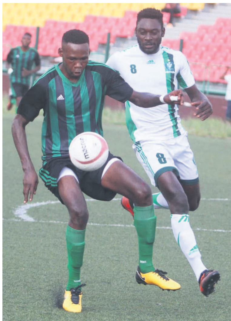
Une séquence du match V Club Mokanda-AC Léopards