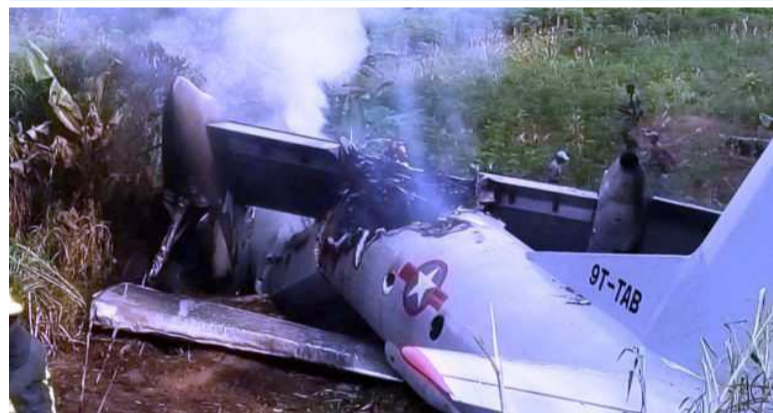
Les débris de l'Antonov 72