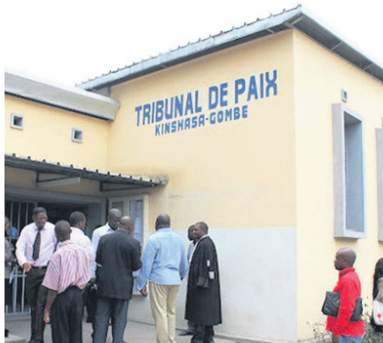
Le tribunal de paix à Kinshasa