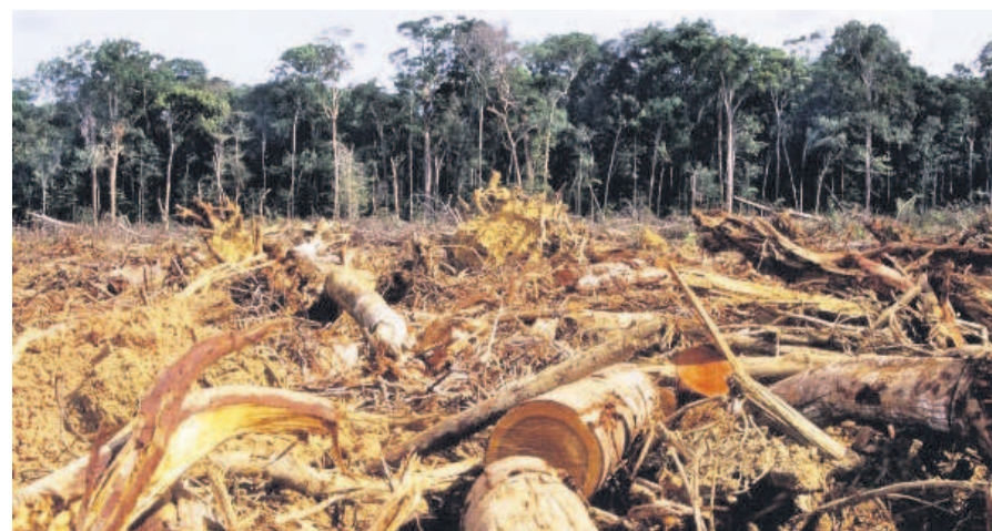
La lutte contre la déforestation, un enjeu majeur