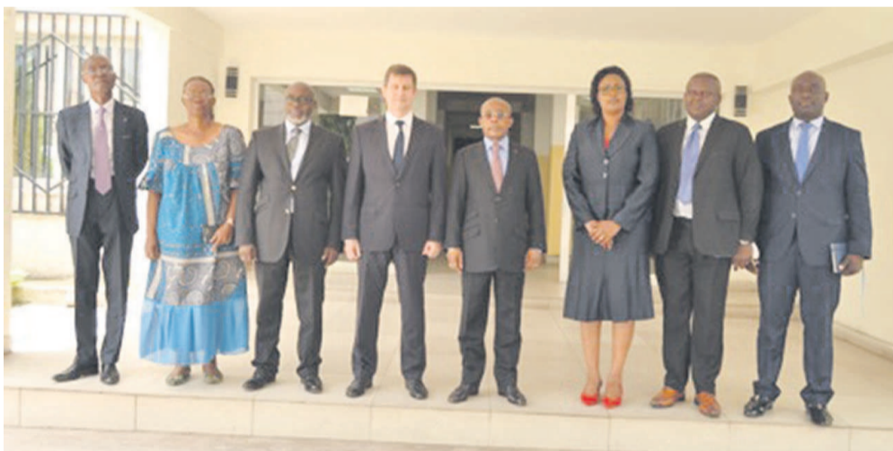
La photo de famille entre le ministre, l'ambassadeur et les collaborateurs

Le ministre de tutelle, Martin Parfait Coussoud-Mavoungou, et le nouvel ambassadeur de Russie, Guéorguy Tchepik, ont échangé sur les axes de coopération visant à raffermir les liens entre les deux pays en la matière.