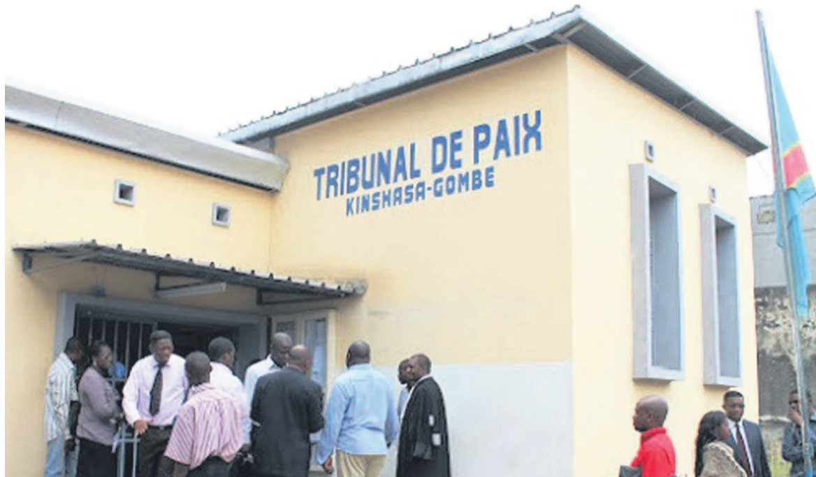
Le tribunal de paix à Kinshasa

Dans sa mercuriale du 15 octobre à l'occasion du retour des vacances des hommes en toge, le procureur général près la Cour de cassation a reconnu que les votes des gouverneurs et sénateurs ont été entachés d'irrégularités.