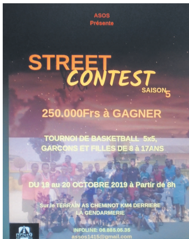
L'affiche de Street contest 5

Initialement prévue du 23 au 24 novembre, l'activité qu'organise l'Association sportive et des œuvres sociales (Asos) va finalement réunir la jeunesse pontégrine au terrain de l'AS cheminots, du 19 au 20 octobre, à Pointe-Noire.