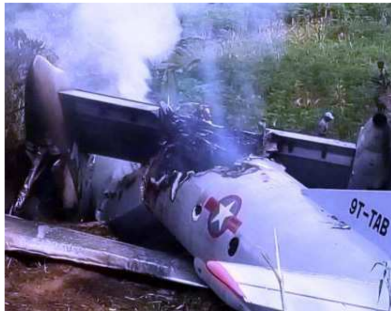
Les débris de l'Antonov 72

Pour rappel, l'Antonov 72 assurant la logistique présidentielle avait disparu, le 10 octobre, entre Goma et Kinshasa, avec à son bord huit personnes, d'après un communiqué de l'Autorité de l'aviation civile. Entre la thèse du sabotage privilégiée dans certaines officines politiques et celle de surcharge couplée aux mauvaises conditions météorologiques, seuls les résultats des investigations menées sur le terrain permettront de se faire une idée exacte des causes réelles de ce crash qui