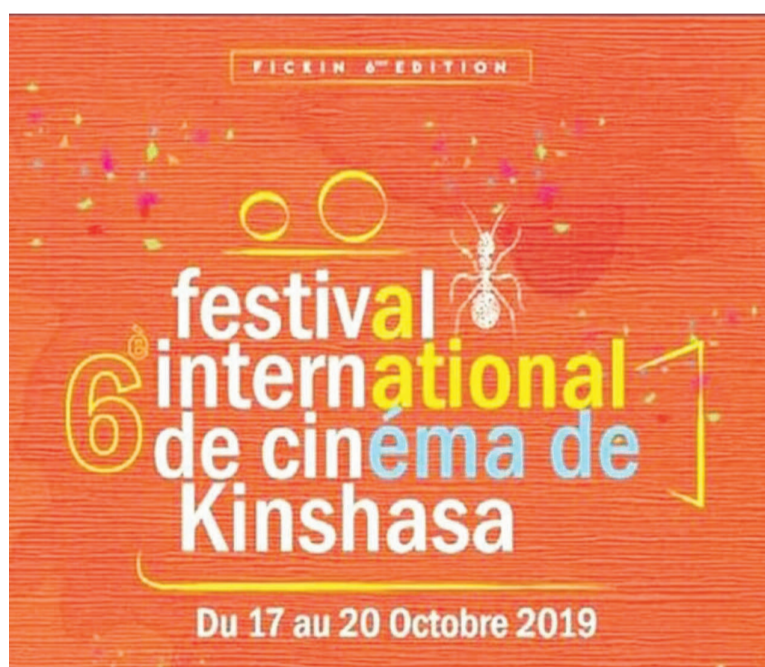
L'affiche de la sixième édition du Festival international de cinéma de Kinshasa