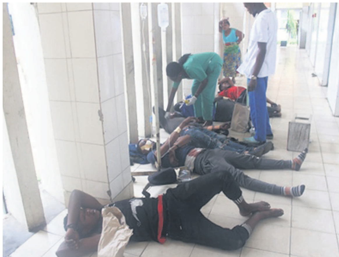
Une vue des accidentés de Mengo à leur arrivée à l'hôpital général de Loandjili

C'est dans un véhicule 4x4 en provenance de Dolisie que se trouvaient les nouveaux accidentés. Deux passagers sont décédés sur le lieu de l'accident. Ce cas tragique est le deuxième qui a été enregistré sur la Route nationale n°1 (RN1) au niveau du département du Kouilou en l'espace de trois jours seulement. Il intervient après celui qui a eu lieu dans la nuit du 12 au 13 octobre à «Les Saras». En effet, deux morts ont aussi été dénombrés ainsi que quinze blessés. Les passagers se trouvaient dans un véhicule à 10 roues en provenance de Londela-Kaye, localité située dans le département du Niari. Jusqu'à ce jour, certains blessés se trouvent encore à l'hôpital général de Loandjili, particulièrement au service de chirurgie générale qui