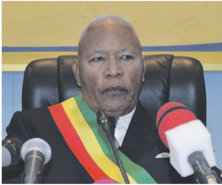
Le président de l'Assemblée nationale Isidore Mvouba

La mauvaise gouvernance étant considérée comme la porte ouverte à toutes les injustices humaines, les élus y compris doivent travailler d'arrache-pied en empruntant le chemin du développement économique. Tout ceci en veillant à la transparence dans la gestion des finances publiques, en luttant tant bien que mal, avec les moyens à leur disposition, contre la corrup-