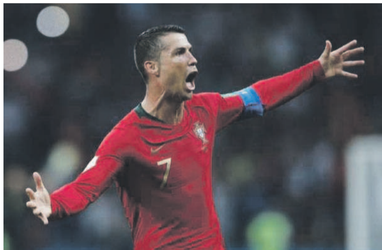
Cristiano Ronaldo heureux de ses sept cents buts

Le quintuple Ballon d'Or a atteint le 14 octobre, contre l'Ukraine en éliminatoires de l'Euro 2020, la barre des sept cents buts dans sa carrière.