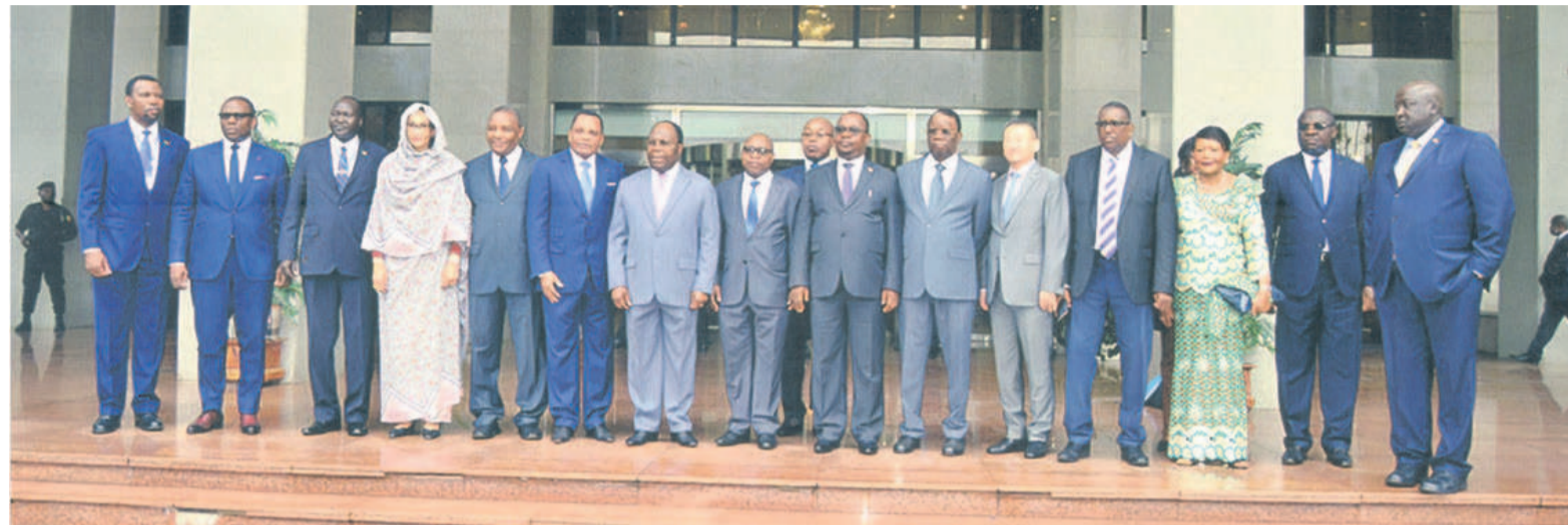
Photo de famille des participants

Les délégués ont, par ailleurs, demandé aux Etats-Unis d'accélérer le retrait du Soudan de la liste des Etats commanditaires du terrorisme, qui selon l'orga-