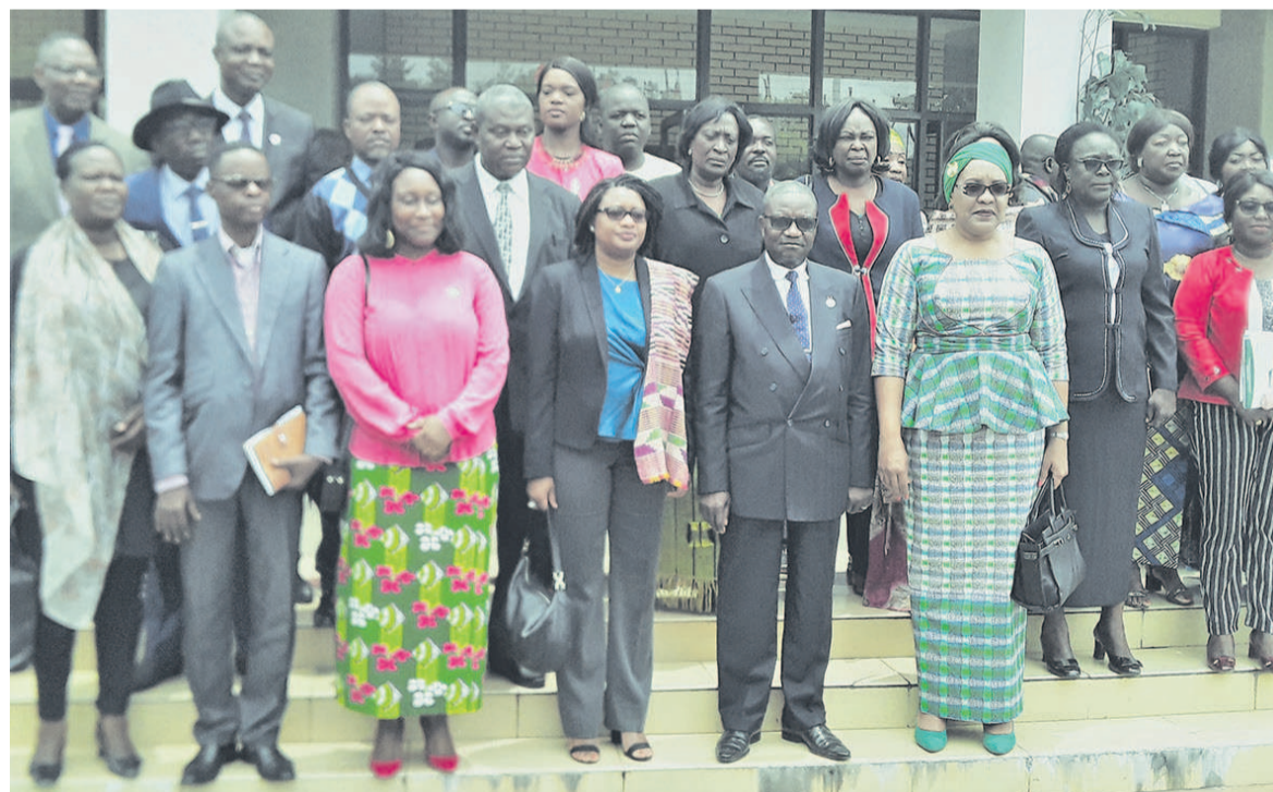
Photo de famille

A l'endroit des pouvoirs publics, elles demandent de les inciter à disposer d'un compte bancaire, créer les structures d'incubation, mettre en place un programme sur l'autonomisation des femmes, avoir un fonds de garantie pour soutenir les femmes entrepreneures, créer un dispositif spécifique à la maison de la promotion de