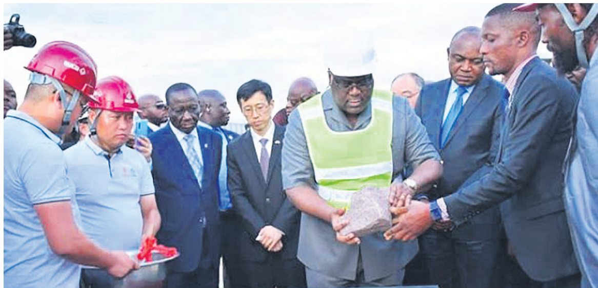
Pose de la première pierre par le chef de l'Etat, Félix Tshisekedi

Le président de la République a donné le coup d'envoi, le 16 octobre, de la construction du centre culturel de Kinshasa, sur le site de la Place du cinquantenaire, situé en face du Palais du peuple, dans la commune de Kasa-Vubu.