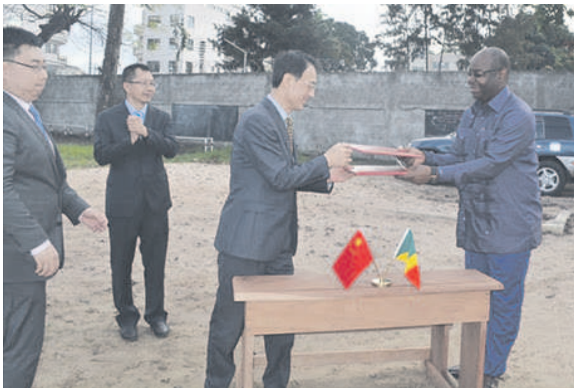
Echange de document entre l'ambassade de Chine et la Fondation Congo-Assistance

l'action de la première dame, à travers la fondation qu'elle dirige. Les aides de la part de la Chine sont multiformes dans les domaines de la santé, l'éducation, la formation »,