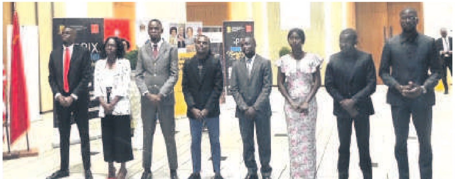
Les huit lauréats du Prix de l'innovation numérique 2019

L'édition inaugurale de cette année, associée au programme Seeds for the future 2019 de la société Huawei, avec l'appui des sociétés soucieuses du développement du numérique comme Airtel Congo, a révélé au final huit candidats et des projets jugés créatifs. Présentés officiellement, ces projets bénéficieront d'un accompagnement stratégique grâce à une formation offerte dans le cadre de Seeds for the future en Chine, en novembre. Dédié aux jeunes de 18 à 29 ans, ayant un intérêt manifeste dans le domaine des TIC et porteurs de projets novateurs dans le domaine du numérique, le prix, a souligné le ministre de tutelle, Léon Juste Ibombo, est « inscrit dans le plan d'action de la stratégie nationale du développement de l'économie numérique qui est la traduction du projet de société du président de la République,