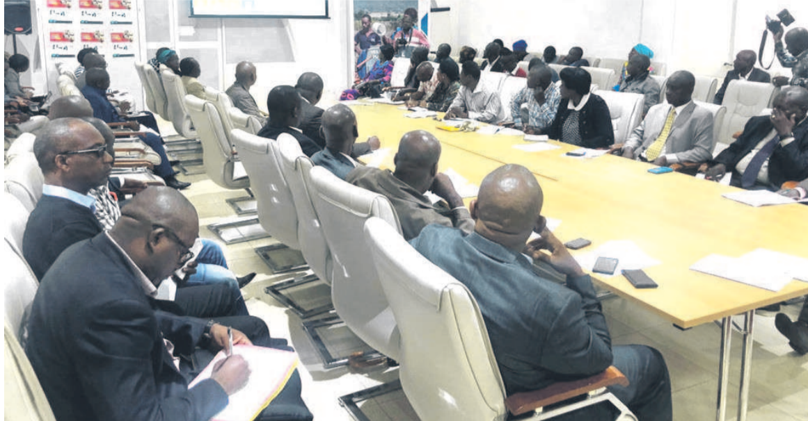
Les participants au cours de l'atelier

Ladite plate-forme sera, en effet, un espace d'échange, de dialogue et de recherche de solutions au système alimentaire urbain en vue d'orienter, avec réalisme, les actions et les synergies de la direction de l'agriculture et de l'alimentation urbaine. Elle aidera également la nouvelle direction de l'alimentation et de l'agricultu-