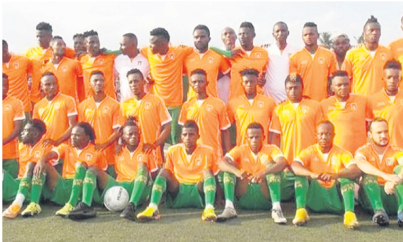
Renaissance du Congo

Cette défaite des Renais intervient après une belle série de trois victoires consécutives. Avec cette déconfiture, le club orange de la capitale demeure à la 6e position au classement provisoire avec douze points en six matchs. Pour sa part, le FC Simba de