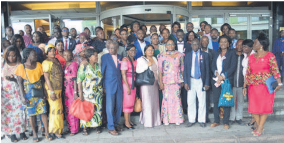
Les participants après la conférence-débat

Le ministère de la Santé, de la population, de la promotion de la femme et de l'intégration de la femme au développement a organisé, le 15 octobre à Brazzaville, une conférence-débat qui a permis aux acteurs des organisations non gouvernementales (ONG) de découvrir les causes, évolutions et manifestations de la maladie.