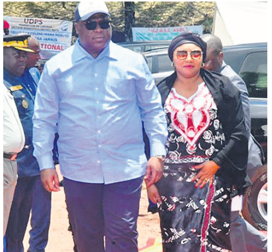
Le couple présidentiel à son arrivée sur le lieu de l'événement