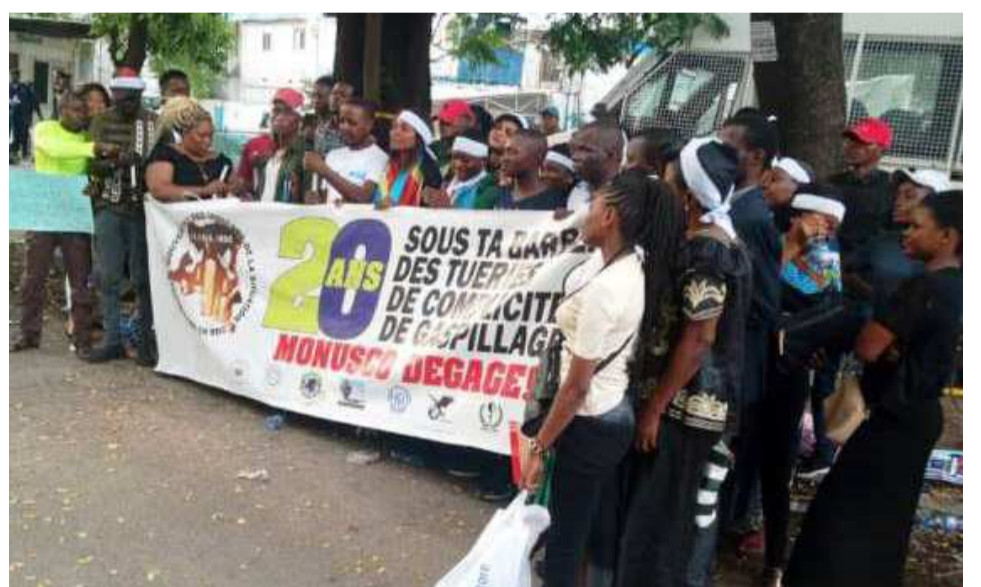
Le sit-in du Mouvement des indignés

L'organisation qui se dit animée par le souci de voir se réaliser les actions déjà nobles du président de la République l'invite à mettre au centre de ses préoccupations la détresse des victimes de toutes les atrocités commises dans la partie est du pays, en instaurant une justice réparatrice et une reconnaissance au travers l'érection des mémoriaux à tous les endroits profanés.