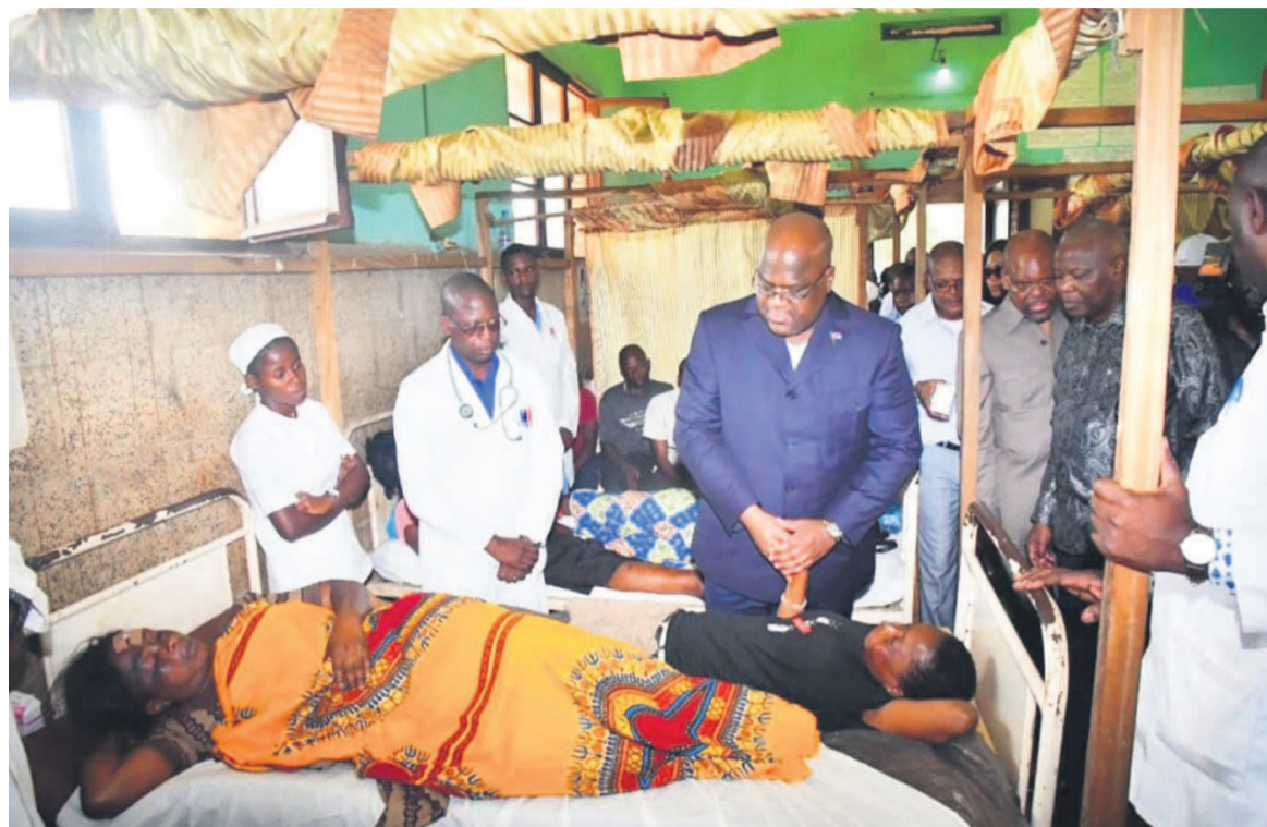
Le président Felix Tshisekedi au chevet des blessés de l'accident de Mbanza Ngungu

Le chef de l'Etat a instruit le ministre de la Solidarité nationale de prendre en charge les blessés et de réserver un enterrement digne aux personnes décédées, après une concertation avec le gouvernement provincial du Kongo central.