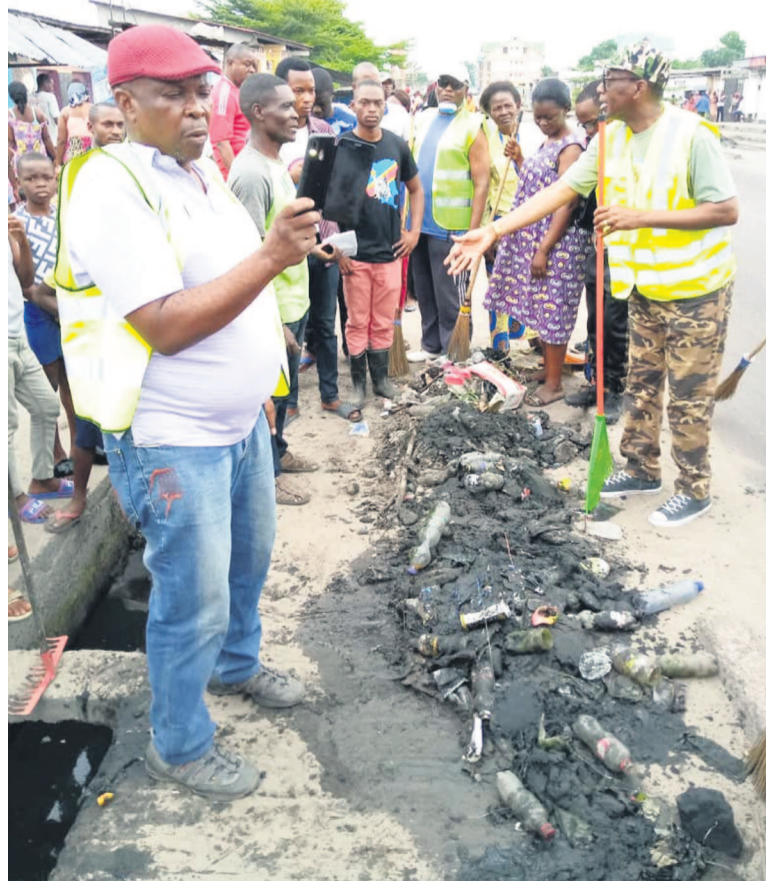
Le bourgmestre, sur le terrain, lors du lancement de « Kin bopeto » à Matete

doit être de mise, avec nos Matete. Il a également pré-