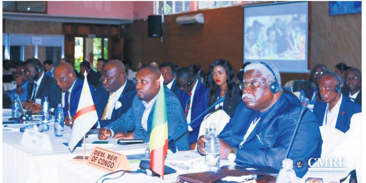
Des participants à la réunion

« Le gouvernement de la RDC, conscient du risque de la propagation de cette épidémie à travers ses voi-