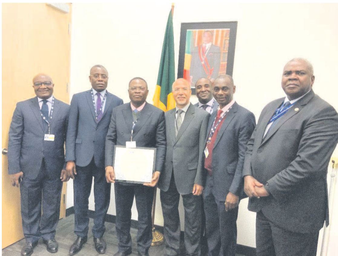
Les délégations du Congo et de l'OACI lors de la mission de validation

compléter et renforcer le mécanisme de résolution des pro-