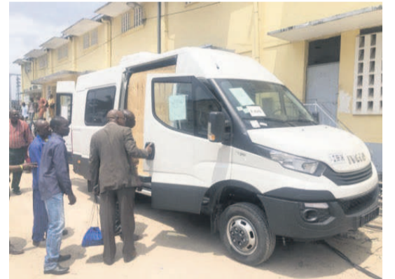
Le véhicule réceptionné par la société E2C

Le nouveau véhicule permettra de détecter, localiser les défauts de câbles souterrains en moyenne tension (MT) ou basse tension (BT) avant d'assurer une quelconque maintenance. Pour ce faire, les agents de la société Energie électrique du Congo (E2C) bénéficieront,