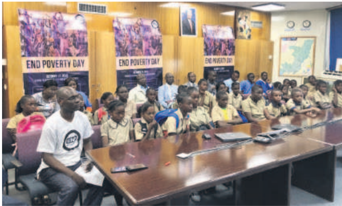
Des élèves participant à la vidéo-conférence de la BM

La nouvelle stratégie proposée par la Banque mondiale (BM) entend perfectionner la scolarisation chez les enfants âgés de 10 ans.