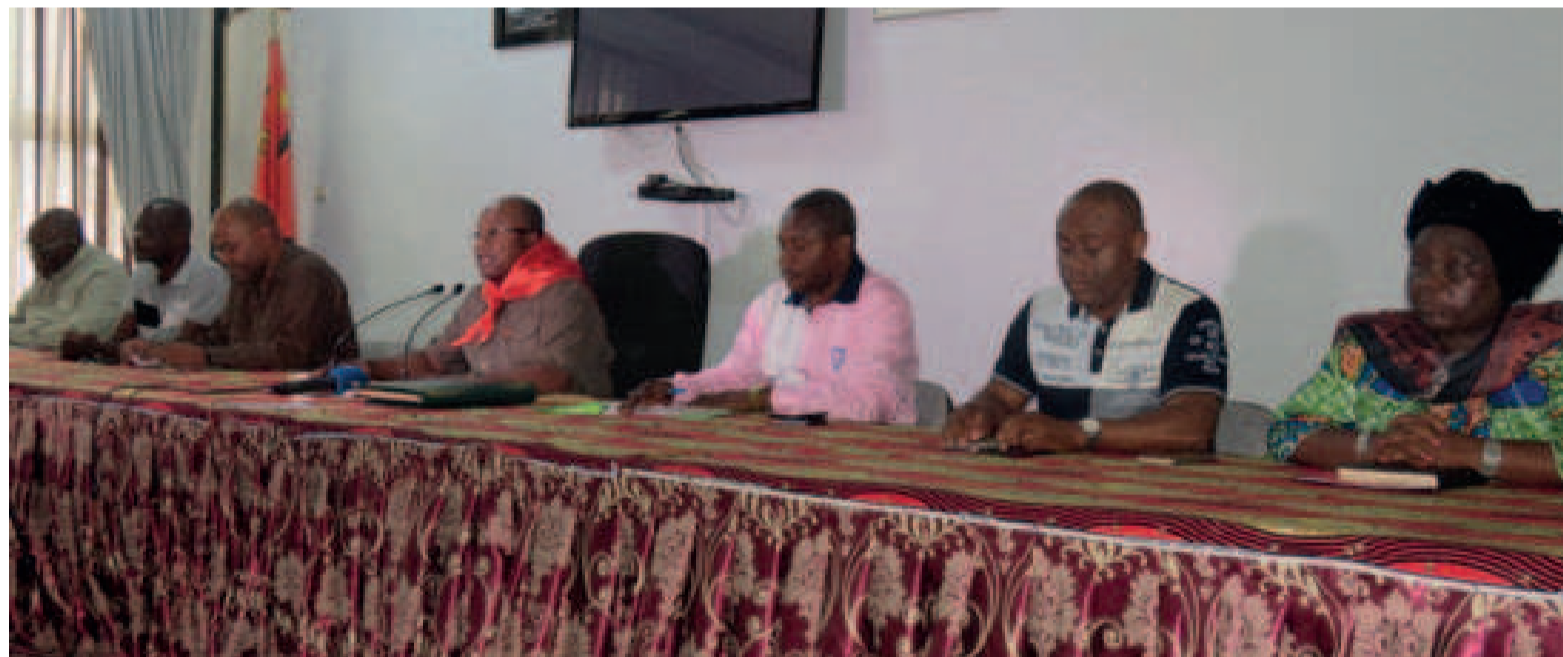
La tribune officielle des travaux