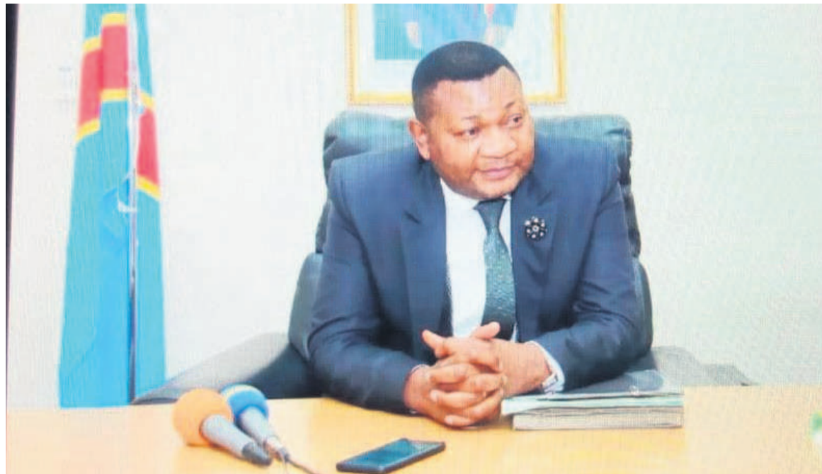
Amos Mbayo, ministre des Sports de la RDC

Aussi a-t-il promis de restaurer l'administration en la rendant efficace et performante, et la pourvoir en matériel informatique et d'un charroi automobile. Il am-