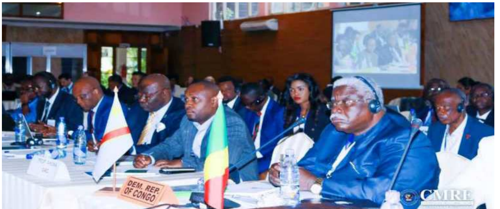
Une vue des participants à la reunion de Goma