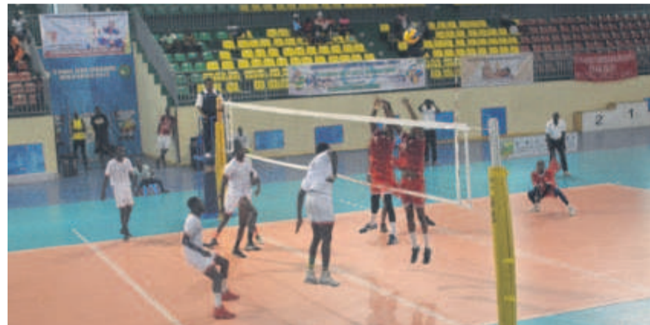
Une séquence du match Interclub-Mwangaza/Adiac

L'équipe championne du Congo (seniors hommes) a difficilement gagné sa rivale de la République démocratique du Congo (RDC), 3 sets à 2, le 21 octobre, au Gymnase Henri-Elendé de Brazzaville, lors des matchs comptant pour la deuxième journée de la compétition.