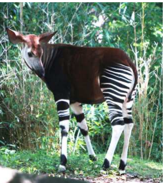
Réserve de faune à okapis

La réserve, située dans le nord-est de la RDC, sera désormais gérée dans le cadre d'un nouvel accord de partenariat de gestion entre la Wildlife conservation Society (WCS) et l'Institut congolais pour la conservation de la nature (ICCN), selon un communiqué de presse de WCS.