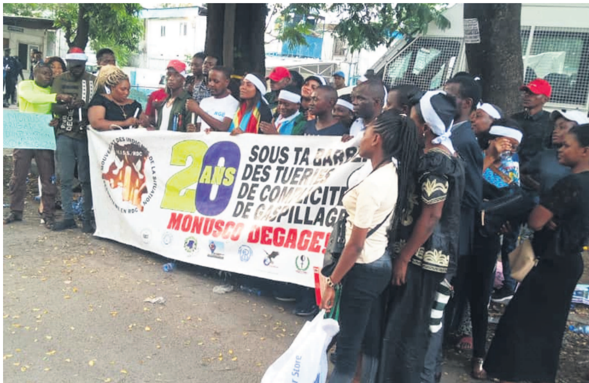
Le sit-in du Mouvement des indignés

Ce mouvement note, en effet, qu'en dépit du sit-in organisé le 16 septembre dernier pour exiger le départ du pays de la Mission onusienne (Monusco), qu'il accuse d'avoir échoué dans ses objectifs, le chef de l'Etat congolais a décidé de la maintenir. « Le Mouvement des indignés de la