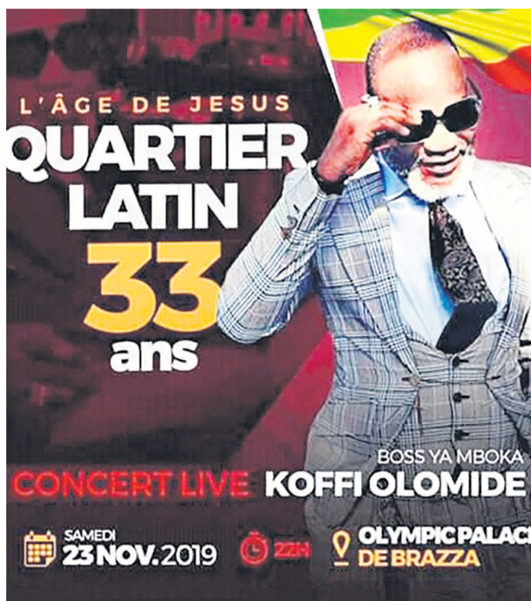
L'affiche du concert de Brazzaville

Depuis son existence, Quartier latin a remporté quatre trophées au Kora Awards et signé sept albums en collaboration avec son patron, le