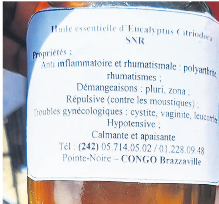
L'huile essentielle d'eucalyptus citriodora fabriquée au Congo

L'ingrédient phare de l'huile essentielle d'eucalyptus citronné reste ses feuilles. Reconnue pour ses propriétés apaisantes insolites, l'huile essentielle d'eucalyptus citronné s'utilise traditionnellement en massage pour le confort articulaire ou les problèmes des sportifs. Elle soulage notamment les douleurs articulaires (arthrite, tendinite, synovite) ou musculaires (crampes, contractures, muscles fatigués). Aussi, elle peut s'avérer efficace contre les inflammations uro-génitales ou thoraciques comme la cystite, péricardite, prostatite, gorge ou bronches enflammées. De par ses actions antifongiques,