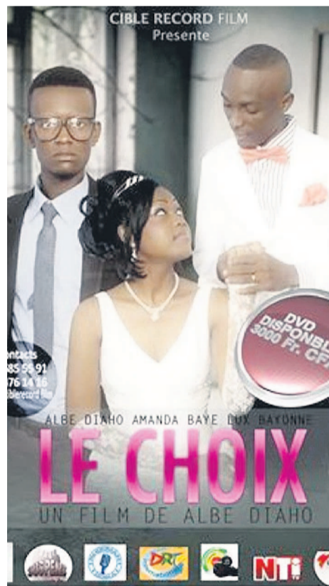
L'affiche du film

Si aux premières minutes du film le spectateur n'est pas vraiment conquis par le scénario, il est rapidement rattrapé par les personnages très attachants et, comme dans une aventure, l'embarquent dans la vie d'un couple où qui fait découvrir d'autres vies et leurs péripéties. En ce sens, "Le choix" est une mosaïque des petits récits du quotidien qui a priori semblent insignifiants mais, dans l'ensemble, sont de véritables leçons de vie.