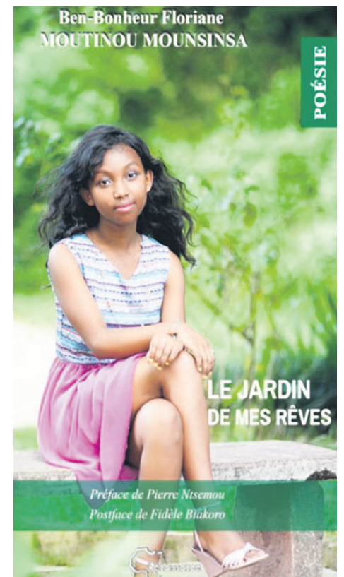
La couverture du livre

bonheur par arabisation–, est un cantique d'amour porteur d'un message profond et dulcifiant transmis dans un style limpide et lyriquement captivant. Comme une sorte de rêverie poétique, cette écriture un tantinet idéaliste présente le portrait de la femme modèle à travers le triptyque : fille sage, épouse fidèle et mère avenante. Une fois de plus, la Congolaise ou l'Africaine nous démontre qu'elle aussi a un mot à dire pour l'harmonisation des mœurs et la défense de la dignité de la vie. Cette vie si précieuse qu'elle transmet joyeusement dans les douleurs assumées, suite à une conjugaison d'amour, un amour mixte.