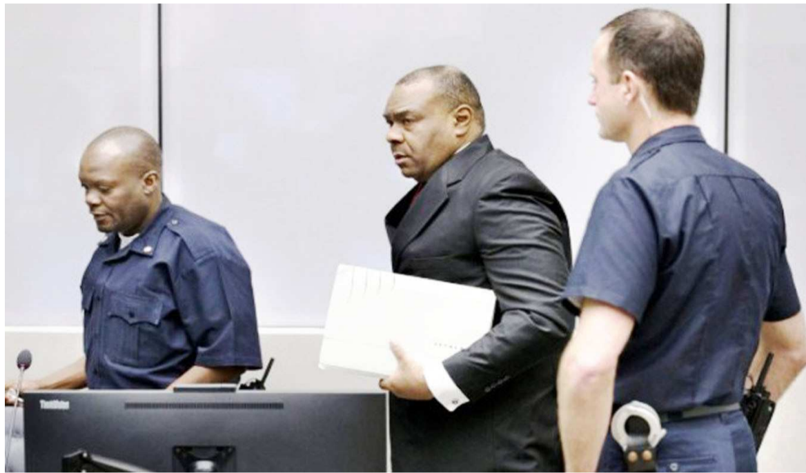
Jean-Pierre Bemba (au milieu) lors de sa dernière comparution

La Chambre d'appel de la juridiction internationale a certifié, le 27 novembre, le jugement condamnant l'ancien vice-président de la République démocratique du Congo à douze mois d'emprisonnement ainsi qu'à une amende de trois-cent mille euros prononcé au premier degré dans l'affaire subornation des témoins.