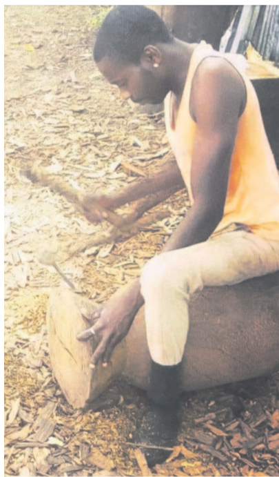
Une capture lors de la balade photographique