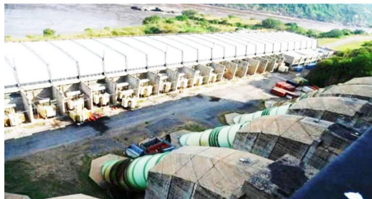
Le Barrage hydroélectrique Inga II

La plate-forme rappelle, en outre, qu'autrefois, elle avait conditionné son appui au projet par des réponses aux préoccupations de la société civile en ce qui concerne l'accès de la population à l'information, l'implication réelle de la société civile et des communautés locales à tout le processus, la réalisation des études d'impacts environnementaux et sociaux, le dédommagement des victimes de Inga I et II ainsi que la révision du quota réel d'énergie à attribuer à la population.