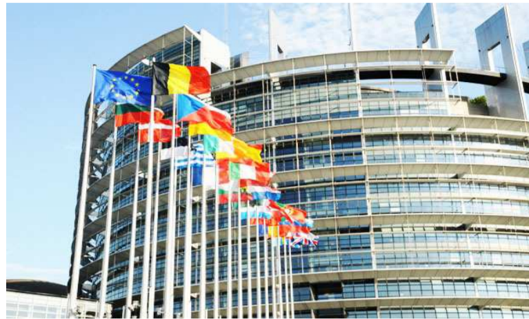
Le siège de l'Union européenne

Débutés le 26 novembre dernier, les travaux du deuxième forum national de la société civile se clôturent ce vendredi. Ce forum, organisé par le Cadre de concertation nationale de la société civile (CCNSC), un regroupement des organisations du secteur mis en place lors des premières assises tenues en 2013, s'est donné l'objectif de redéfinir le statut de la société civile par rapport aux enjeux socioéconomiques actuels. « Repenser le rôle des organisations de la société civile », telle est la thématique sur laquelle se sont cristallisées les réflexions de cette deuxième rencontre qui aura réuni près de deux cent quarante partici-