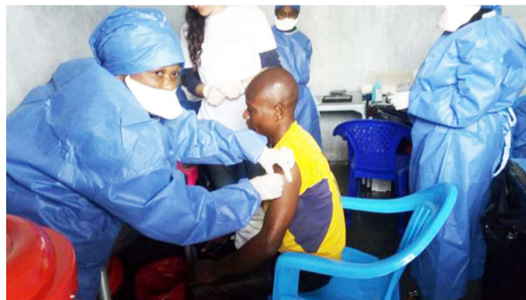
La campagne de vaccination

A ce jour, cent neuf points d'entrée et de contrôle sanitaire ont été mis en place dans les provinces du Nord-Kivu et de l'Ituri afin de protéger les grandes villes du pays et éviter la propagation de l'épidémie dans les pays voisins. La situation épidémiologique du 25 novembre indique que depuis le début de l'épidémie, le cumul des cas est de trois mille trois cent trois dont trois mille cent quatre-vingt-cinq confirmés et cent dix-huit probables. Il y a eu deux mille cent quatre-vingt-dix-neuf décès et mille soixante-dix-sept personnes guéries. Trois cent quatorze