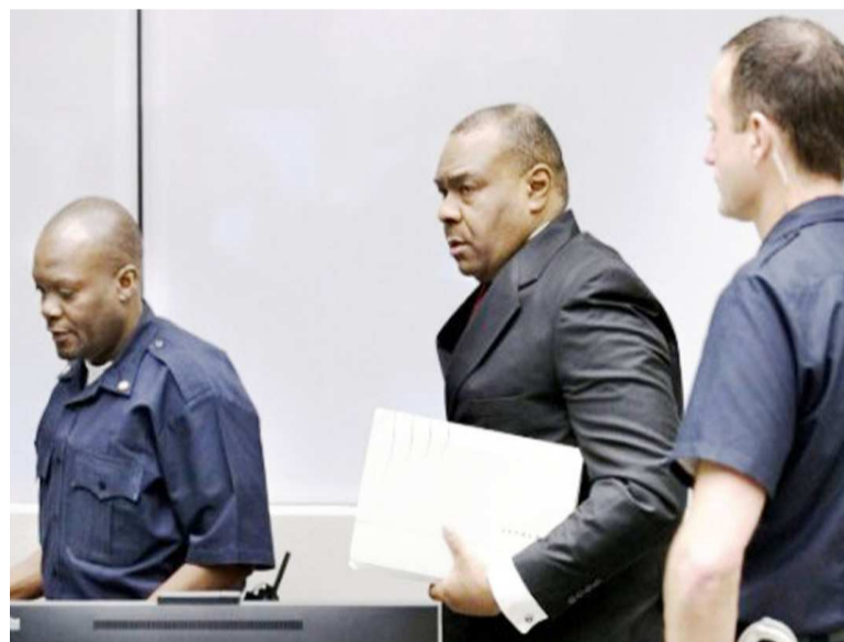
Jean-Pierre Bemba (au milieu) lors de sa dernière comparution