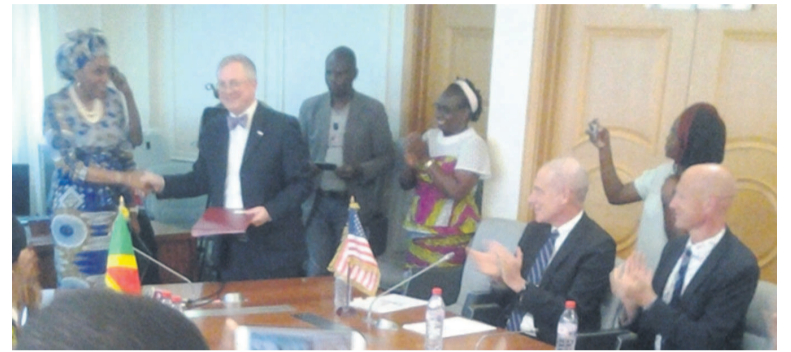
L'échange de parapheurs entre les deux parties

Todd Haskell a ajouté que le gouvernement de son pays était impatient de trouver des moyens de collaborer davantage avec le Congo à l'avenir et continuer d'atteindre les objectifs communs de partenariat accrus. « Nous voulons participer à l'arrêt du travail des enfants, à la déforestation qui détruit les forêts