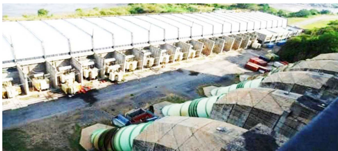
Le Barrage hydroélectrique Inga II

La Coalition réformes action publique (Corap) a adressé, le 25 novembre, une lettre ouverte au président de la République, Félix Tshisekedi, dans laquelle elle fait part de ses inquiétudes par rapport à la mise en œuvre du projet qu'elle considère