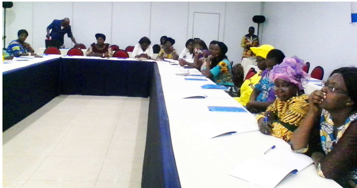
Une vue des femmes lors d'un atelier sur le leadership féminin

On constate, en effet, que le taux de féminisation des postes de responsabilité est un peu plus important dans le secteur public avec 23%, mais encore plus faible dans le secteur parapublic avec 16% et le même pourcentage au niveau du privé. Ces taux de féminisation par secteur, comme