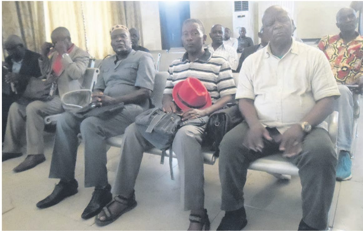
Les chefs de quartier lors de la réunion de rétablissement des allocations

a expliqué que la suspension a été levée suite aux résultats de l'enquête qui a révélé la fraude au niveau de la circonscription d'action sociale où il y avait deux agents impliqués. Au niveau du suivi d'évaluation locale, un agent de Lisungi au sein de l'arrondissement a été également impliqué. Selon lui, le projet a