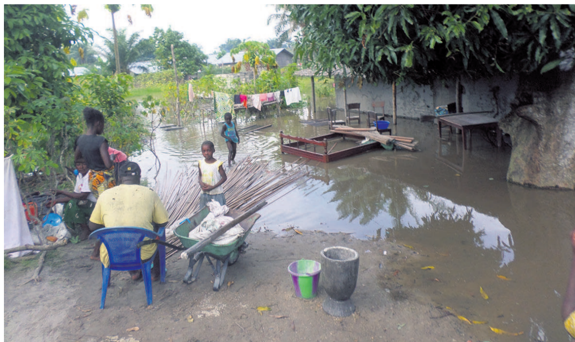
Des membres d'une famille en détresse à Mossaka

Etablissements scolaires et sanitaires engloutis par les eaux, de