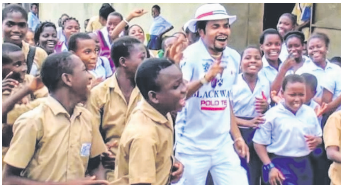
Figaro en compagnie des enfants

Dans son programme, Figaro compte effectuer des descentes dans les milieux scolaires ; se rendre chez les enfants de la rue pour essayer de voir comment peut-il les aider à retrouver le chemin de l'école, convaincu que l'avenir du pays c'est la jeunesse et celle-ci n'a pas sa place dans la rue mais à l'école. Dans cette démarche festive, l'artiste Figaro a prévu également de remercier