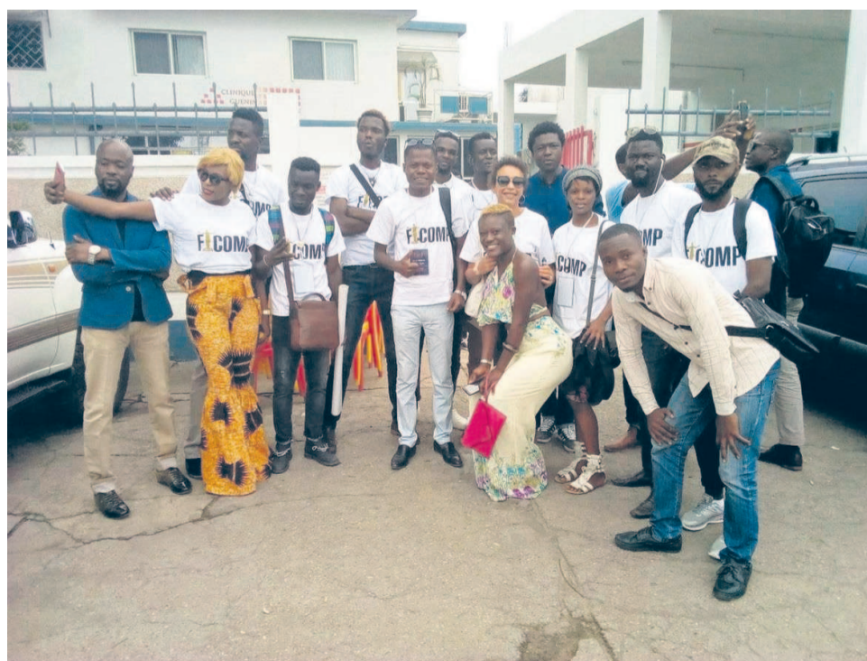
Quelques membres du comité d'organisation du Ficomp lors de la 1ère édition

Outre les projections de films qui vont durer quatre jours, des ateliers seront également organisés, le cas de l'atelier à la réalisation de films en amont du festival (en juillet), l'atelier sur la prise de son au