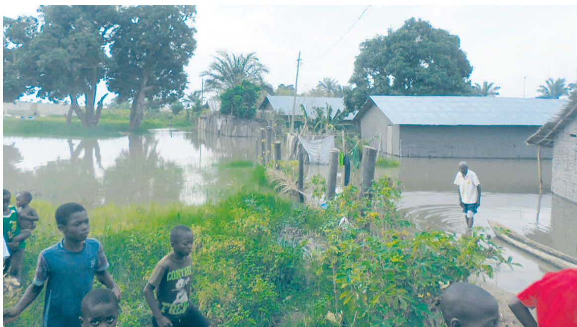
Une vue des habitations inondées à Mossaka

Les pluies qui s'abattent actuellement dans la partie septentrionale du pays font disparaître de la carte nationale, au fur et à mesure, certaines localités situées le long du fleuve-Congo. En effet, à Mossaka, dans la Cuvette, tout comme à Makotimpoko, dans les Plateaux, où la pirogue, le seul moyen de mobilité, a été transformée par certains en dortoir et ou en cuisine. « Moi, pour aller dormir, je prends la pirogue pour monter au lit », a témoigné un habitant de Mossaka. Le Premier ministre, Clément Mouamba, qui a conduit le 4 décembre une mission humanitaire dans cette partie du pays, a mesuré l'ampleur des dégâts, après avoir parcouru quelques kilomètres, bottes aux pieds. « Nous sommes, en effet, à Mossaka, mais avant d'y arriver, nous avons survolé Makotimpoko qui est totalement noyé, donc toutes les maisons sont inondées. Nous venons de voir le spectacle à Mossaka, ce que nous constatons, c'est dramatique. On nous laisse entendre qu'il y aura encore la montée des eaux, donc c'est une situation dramatique que vivent nos compatriotes de cette localité », a indiqué le chef du gouvernement.