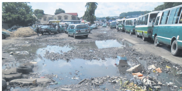
La gare routière du quartier Moukondo-Mazala/Adiac