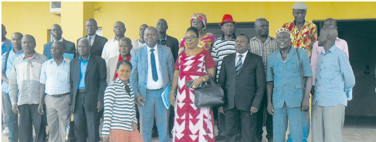
Les participants à la réunion sur le rétablissement des allocations