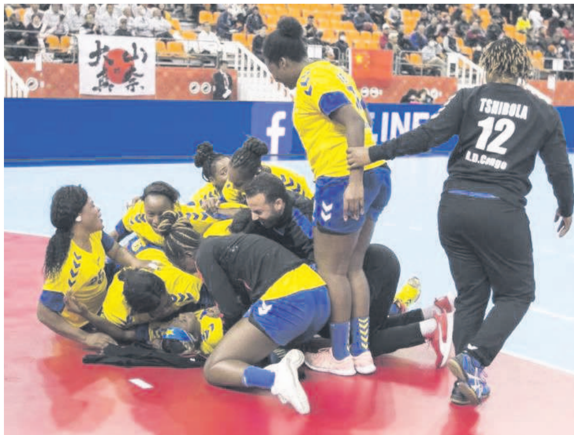
Les Léopards handball dames de la RDC au Mondial 2019, à Tokyo