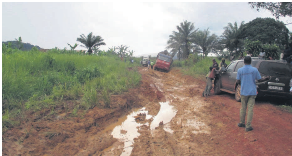
Des véhicules embourbés

Par conséquent, le gouvernement se doit d'assurer le bon niveau de service sur ce linéaire. C'est dans cette optique que les travaux d'aménagement de cette route ont été confiés à la société forestière BTC. « Sur ce chantier, nous allons dans un premier temps dégager la piste, c'est-