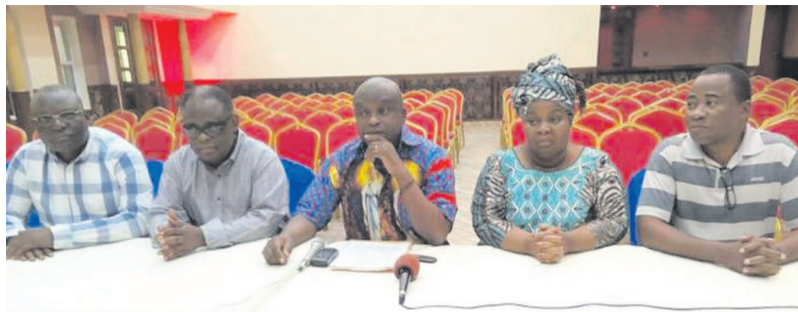
Les membres du CLC en conférence à Kinshasa/DR

Déjà, ce jeudi, un mouvement a été observé en mi-journée aux