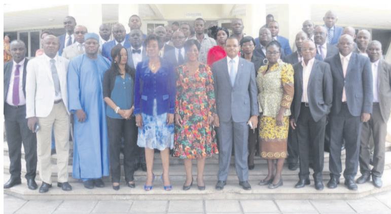
Les participants à la réunion des ministres en septembre

Près de deux ans après le premier sommet sur le Fonds bleu pour le Bassin du Congo, les États parties peaufinent leurs projets à soumettre aux donateurs. Ces initiatives devraient à long terme contribuer au maintien de l'écosystème forestier de la sous-région Afrique centrale.