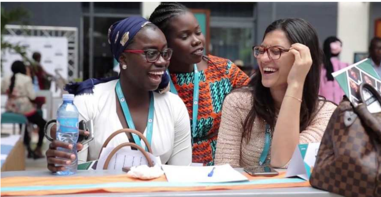
Les Héroïnes ou le rendez-vous du leadership féminin

Pour sa première édition kinoise prévue pour ce 10 décembre au Pullman hôtel, le forum place le changement au cœur de son programme. A l'heure où le digital transforme les manières d'opérer, où les opportunités de croissance se multiplient et que les méthodes de gestion classiques des entreprises deviennent désuètes, les cadres et entrepreneures congolaises sont censées acquérir les atouts nécessaires pour comprendre les défis du continent africain et innover dans leur vie professionnelle. De retour d'Abidjan et Dakar, pour la troisième année consécutive, le forum Les Héroïnes met cette année le cap sur une nouvelle ville africaine : Kinshasa.