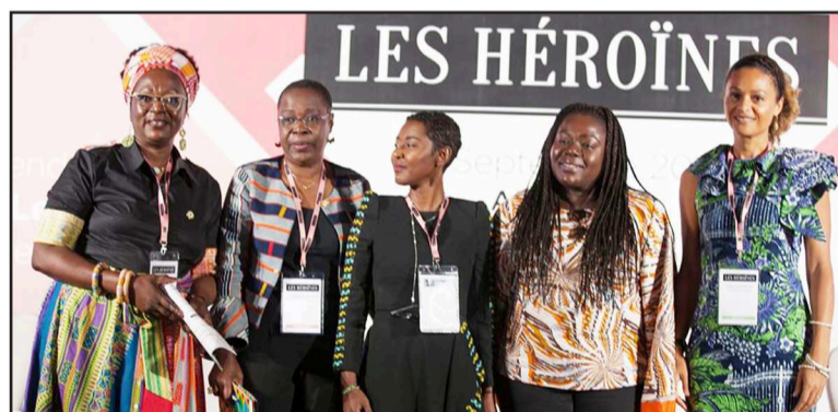
Des Héroïnes posant pour la postérité

Lancé en 2017, le forum « Les Héroïnes » est un événement qui réunit cadres ambitieuses et entrepreneures pour une journée exceptionnelle de formation, conférences, débats et de networking dédiée au leadership féminin. Chaque année, les deux cent cinquante participantes bénéficient d'un accompagnement personnalisé pour booster leur carrière, concrétiser leurs projets et renforcer leur réseau. De retour à Abidjan et Dakar pour la troisième année consécutive, le forum Les Héroïnes mettra cette année le cap sur une nouvelle ville africaine : Kinshasa