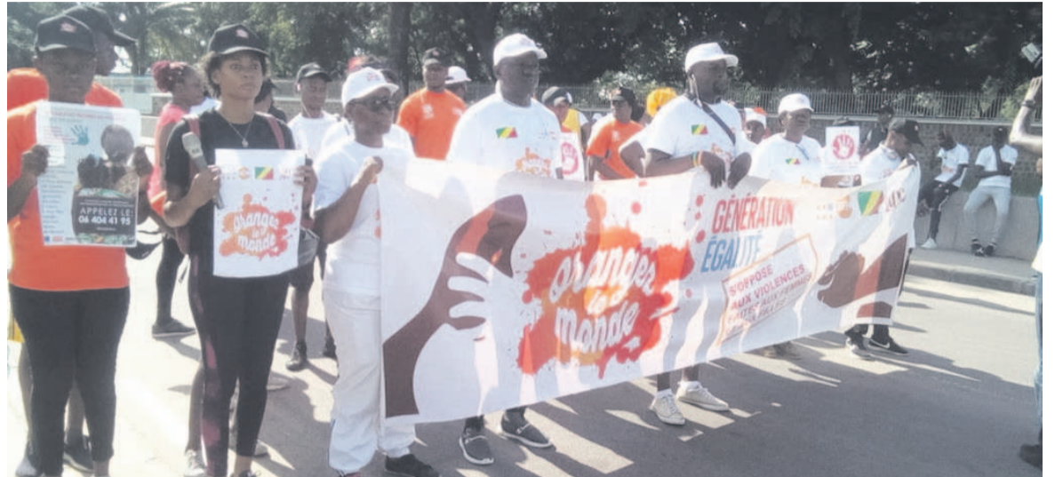
Le premier carré de femmes lors de la marche Adiac