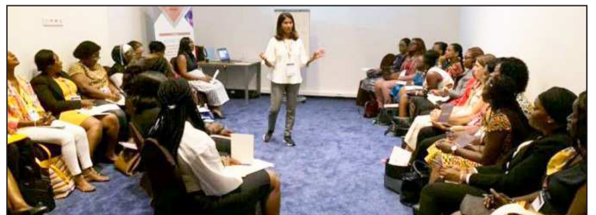
Des Héroïnes en plein atelier (forum de Dakar, sept 2019)