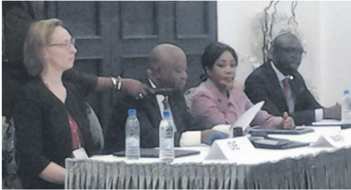
Le présidium des travaux à l'ouverture de l'atelier

« Les services vétérinaires nationaux, en tant que bien public mondial, ont un rôle crucial à jouer dans la gestion des problèmes liés à la faune sauvage. Ils doivent, à cet effet, être capables de prévenir, contrôler et riposter de façon durable face aux agents