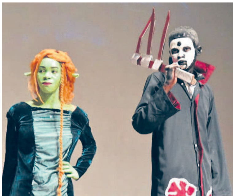
A la clôture du festival, deux cosplayers déguisés, incarnant respectivement Chantal de « Shrek » et Akatsuki du manga « Naruto »