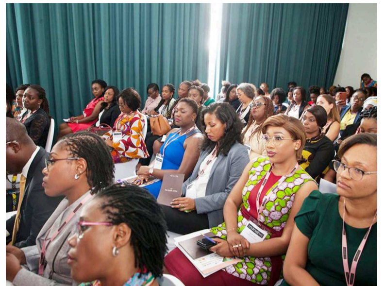
Les participantes au forum «Les Héroïnes» à Dakar, en septembre dernier

Pour sa première édition kinoise, l'événement place le changement au cœur de son programme. A l'heure où le digital transforme les manières d'opérer, où les opportunités de croissance se multiplient et que les méthodes de gestion classiques des entreprises deviennent désuètes, les cadres et entrepreneures congolaises doivent acquérir les atouts nécessaires pour comprendre les défis du continent africain et innover dans leur vie professionnelle. Participer au changement de son entreprise, transformer son leadership ou encore insuffler un élan positif dans son écosystème, des séances en groupes restreints et des prises de parole inspirantes permettront aux participantes d'identifier des leviers d'action concrets pour avoir un impact positif