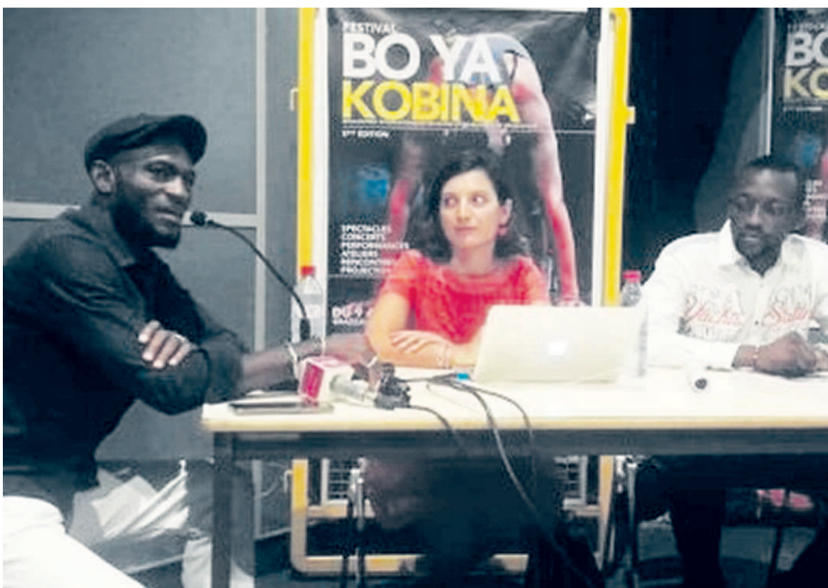
Les organisateurs du festival animant la conférence de presse