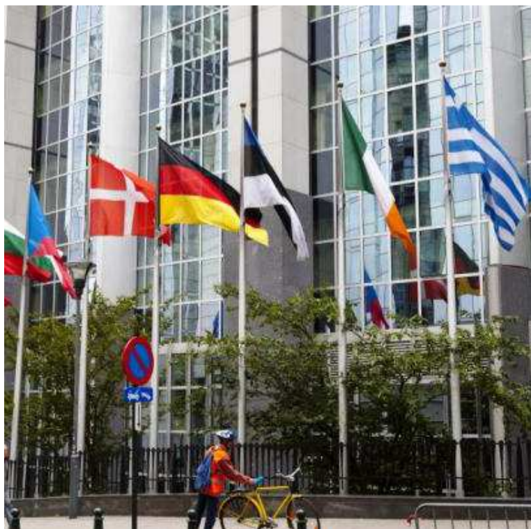
Le siège de l'Union européenne