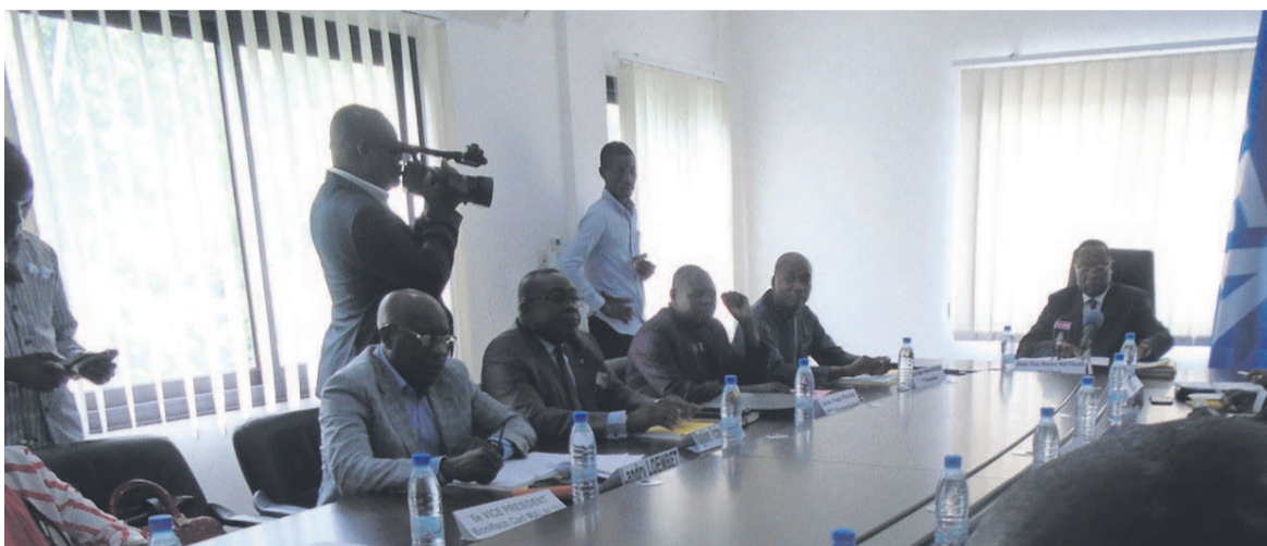
Les membres du comité exécutif de la Fécofoot en pleine session

de préparation des Diabes rouges à cette compétition, lequel a été validé par les membres du comité exécutif. « Le comité exécutif a échan-