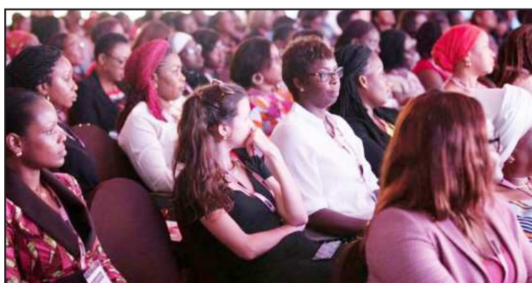
Une vue de l'assistance à l'ouverture du forum de Dakar