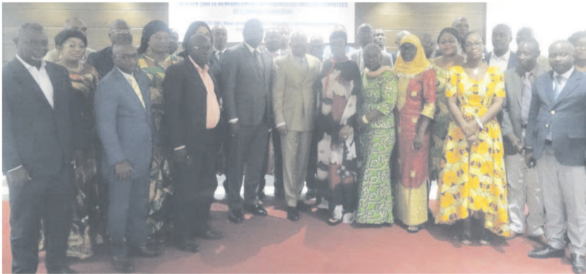
Les participants posant en famille Adiac - Les participants Adiac

Des manquements ont été constatés dans la mise en œuvre des projets que l'institution panafricaine finance dans le pays. D'où l'initiative de former, à Brazzaville, les gestionnaires sur l'acquisition, le décaissement et la gestion financière.