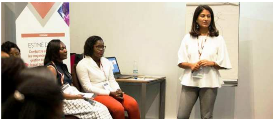
Une séquence d'un atelier du forum «Les Héroïnes» à Dakar, au Sénégal/DR

Des ateliers, il y en aura à profusion dans ce premier forum kinois, quitte aux participantes de choisir les thématiques allant de pair avec leurs préoccupations. Du capital