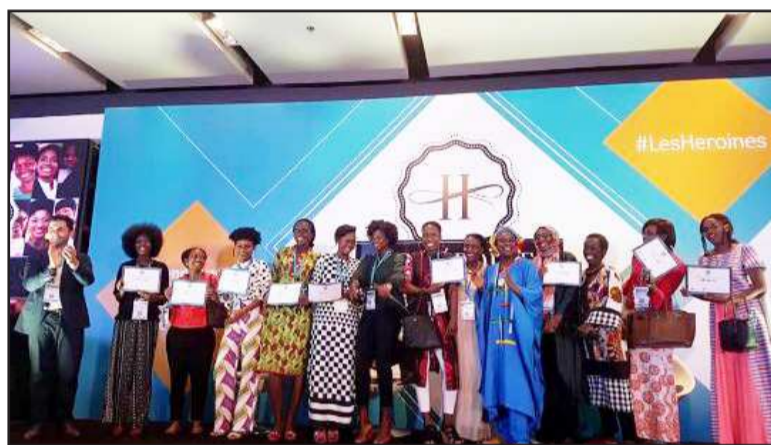
Les participantes à la clôture du forum

La rencontre va réunir ce 10 décembre, dans la capitale congolaise, des cadres d'entreprise ou simplement ambitieuses au regard de leurs potentialités et valeurs intrinsèques pour réfléchir, à intelligible voix, sur les défis qui sont les leur dans un monde en perpétuelle mutation.