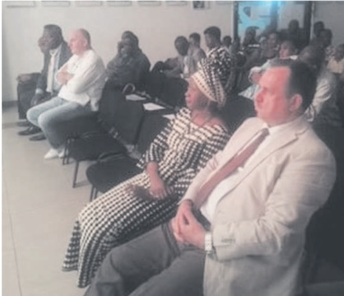
Les spectateurs parmi lesquels la conseillère du chef de l'État congolais et le directeur du CCR/DR