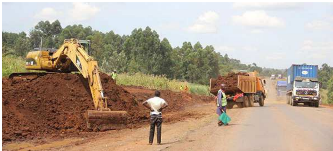
Une route en construction

L'ouvrage consiste en un pont à péage de 1,575 km de long, au-dessus du fleuve Congo. Il comprend une voie ferrée, une route à double ligne, des passages piétons et un poste de contrôle frontalier de chaque côté. Il sera connecté aux infrastructures routières existantes dans chaque pays. Son coût était estimé à quatre cent cinquante-neuf millions de dollars américains en 2017.