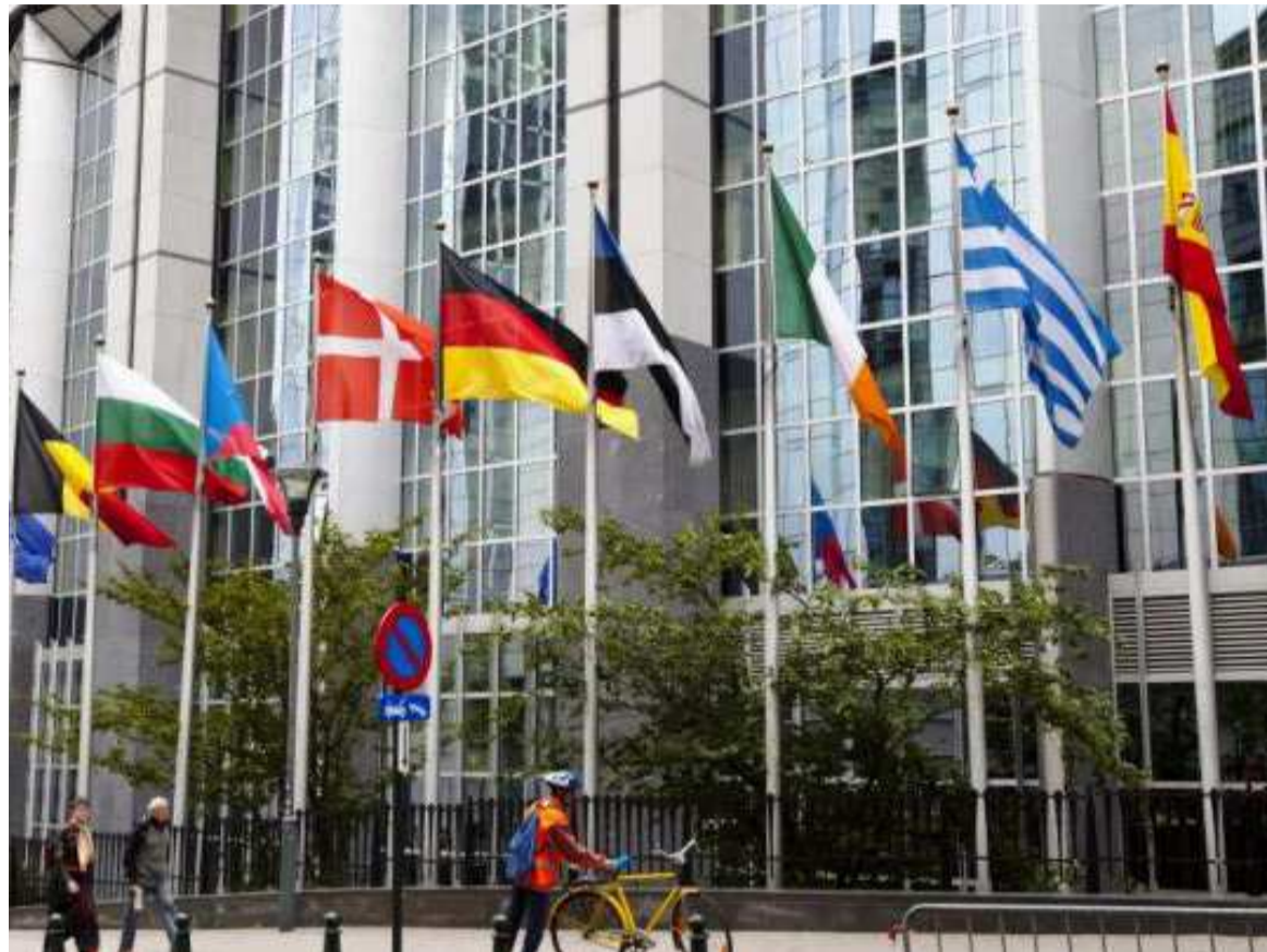
Le siège de l'Union européenne