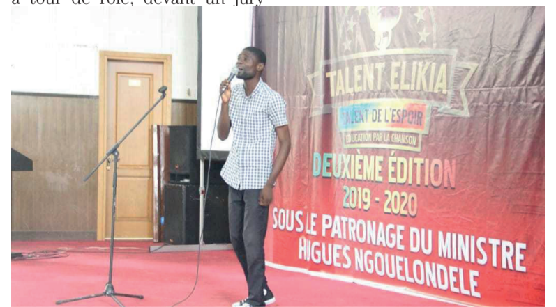
Un jeune artiste musicien en pleine prestation

Le 15 décembre, le même jury fera le déplacement de Pointe-Noire pour présélectionner cinq artistes, quota réservé pour cette ville.