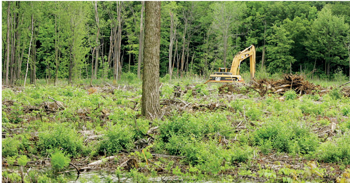
Une vue d'une forêt

2020 est une année cruciale pour les engagements des nations en matière de préservation et de restauration de la biodiversité, la Chine accueillant à Kunming la quinzième réunion de la Conférence des Parties (COP15) à la Convention des Nations unies sur la diversité biologique. L'année prochaine sera également l'occasion d'accélérer la mise en œuvre de la décennie des Nations unies pour la restauration des écosystèmes (2021-2030), qui vise à intensifier massivement la restauration des écosystèmes dégradés et détruits pour lutter