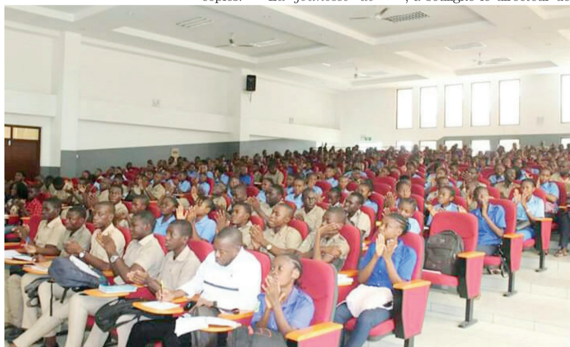
Des élèves prenant part à la causerie-débat

laire, on aura du mal à vous employer. C'est donc important d'avoir des diplômes et il faut bien étudier pour les avoir et les mériter », a-t-il