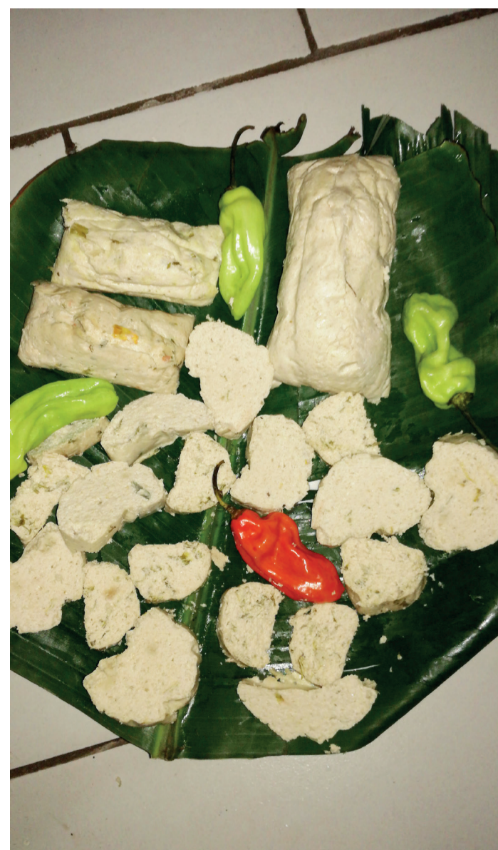
Un plat de courge