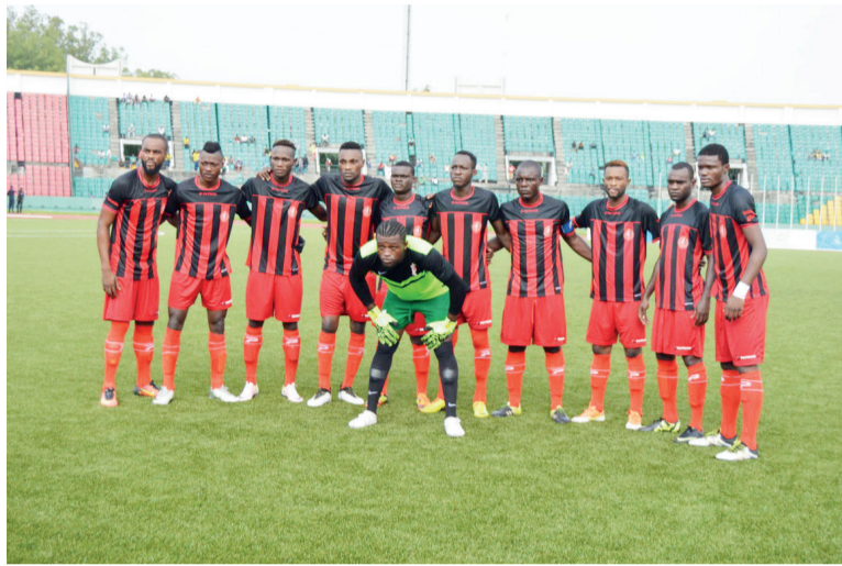
Le Club athlétique renaissance aiglon

Ainsi, Cara est-il aussi appelé Bana Nzambé (les enfants de Dieu) ; Etoile du Congo, Itoumbou l'Okia (le haillon du filet) ; Diables Noirs, Yaka dia mama (le manioc de maman). Ces anciens dont il faut ajouter à la liste Interclub, l'équipe des militaires, sont doréna-