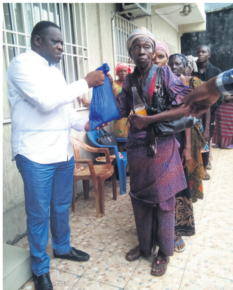
Le député remettant un sac de vivres à une maman

Au terme de la distribution, plusieurs bénéficiaires ont exprimé leur reconnaissance au donateur. « Nous sommes heureuses. En période de fête, veufs, veuves et personnes du 3 e âge de cette circonscription reçoivent tou-