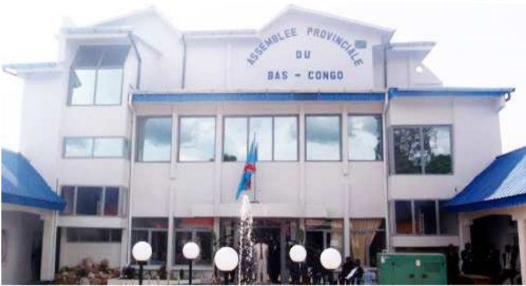
Le siège de l'Assemblée provinciale du Kongo central

Ces quatre autorités provinciales sont convoquées à Kinshasa par le ministre de la Justice et le dossier aurait un rapport direct avec la situation qui prévaut dans leurs entités respectives. Il s'agit principalement des gouverneurs de l'Ituri, du Sankuru, du Haut-Lomami et du Kongo central. Selon le communiqué du ministère de la Justice, elles sont attendues, le 13