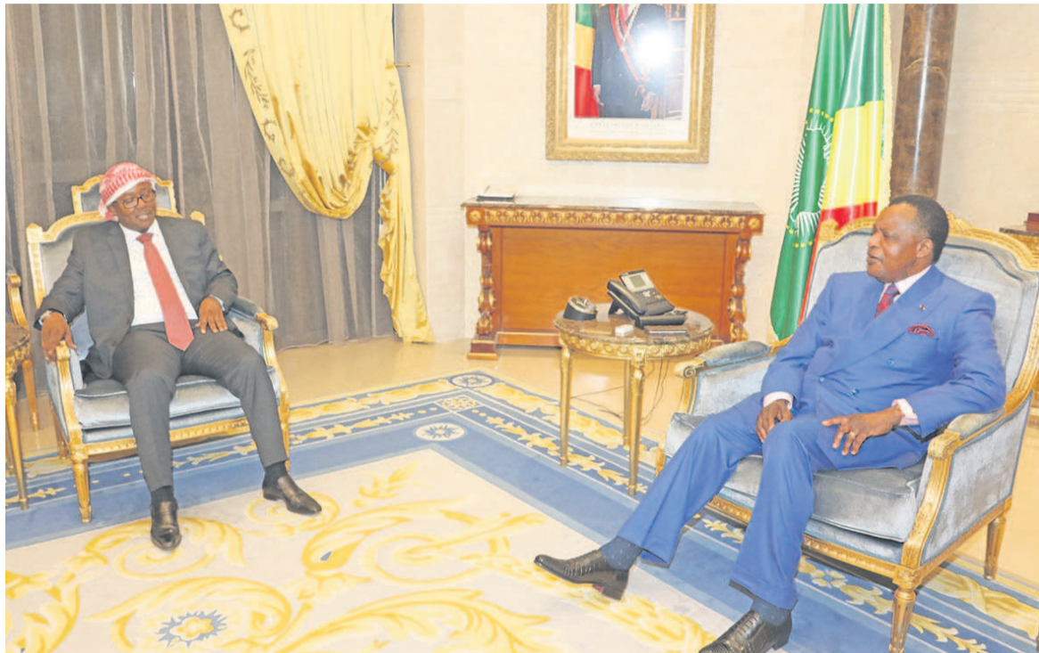
Le président Denis Sassou N'Guesso s'entretenant avec le président Umaro Sissoco Embaló