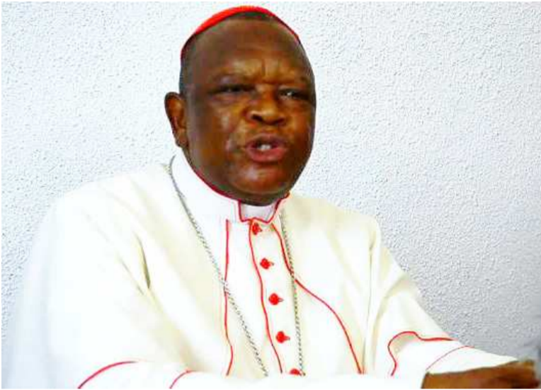
Une attitude du cardinal Fridolin Ambongo lors de la conférence de presse

La communication du cardinal Fridolin Ambongo faite le vendredi 3 janvier dernier à Kinshasa, lors de sa première