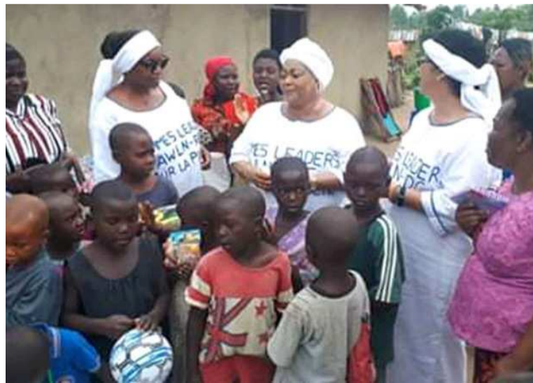
Visite des femmes leaders à l'un des orphelinats

Au cours de leur séjour dans cette partie de la RDC, ces femmes leaders ont visité des endroits forts de la situation que vivent Beni et ses environs. Il s'agit notamment des orphelinats dont ceux de Butsha et de Mabakanga, qui hébergent les