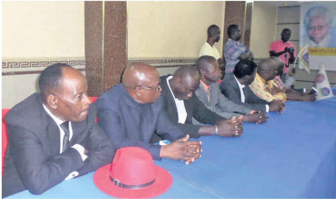
Les membres du comité de crise de l'UFD/Adiac

« Entendu que la base du parti n'a jamais été ni consulté, ni associé à cette décision qui relève en réalité de l'amateur-