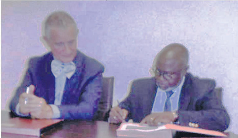
Signature de l'accord par les représentants des deux structures

Le laboratoire de physique-chimie de l'environnement de l'Institut de recherche en sciences naturelles (IRSEN) et la société Green service ont conclu, le 30 décembre à Brazzaville, un accord de partenariat en matière de recherche scientifique.