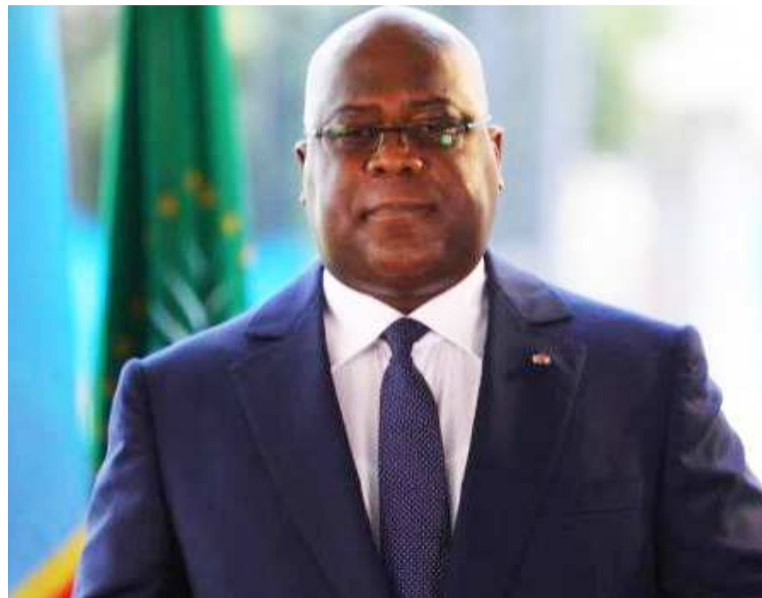
Le président Félix Tshisekedi

Pour son message de vœux à l'entame de 2020 qu'il a qualifié d'année de l'action, Félix-Antoine Tshisekedi Tshilombo a choisi d'allier la sobriété à la solennité pour marquer les esprits.