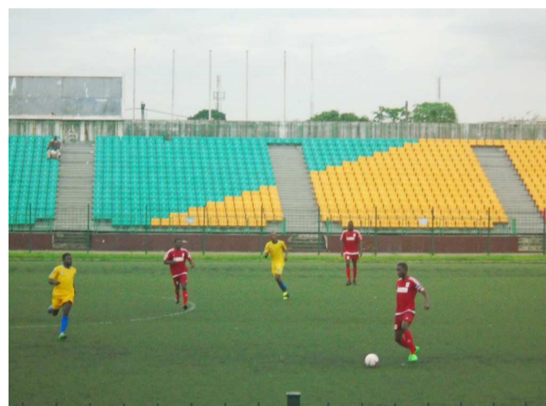
Un extrait du match EF Total-Munisport/Adiac

La première journée du championnat de la Ligue nationale de football Zone B, débutée le 31 décembre, s'est poursuivie respectivement les 2 et 3 janvier au Complexe sportif de la ville océane.