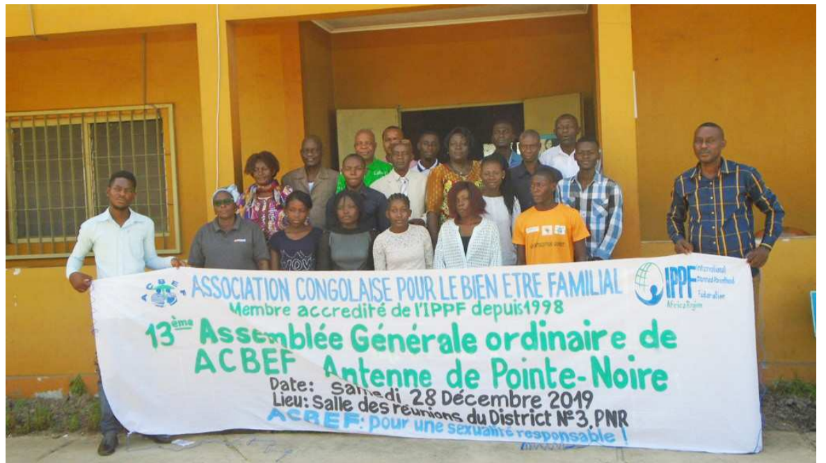
La photo de famille lors de l'assemblée générale

Au cours de ces travaux, le président communal de l'AcbeF a fait le compte-rendu de l'assemblée générale nationale tenue les 20