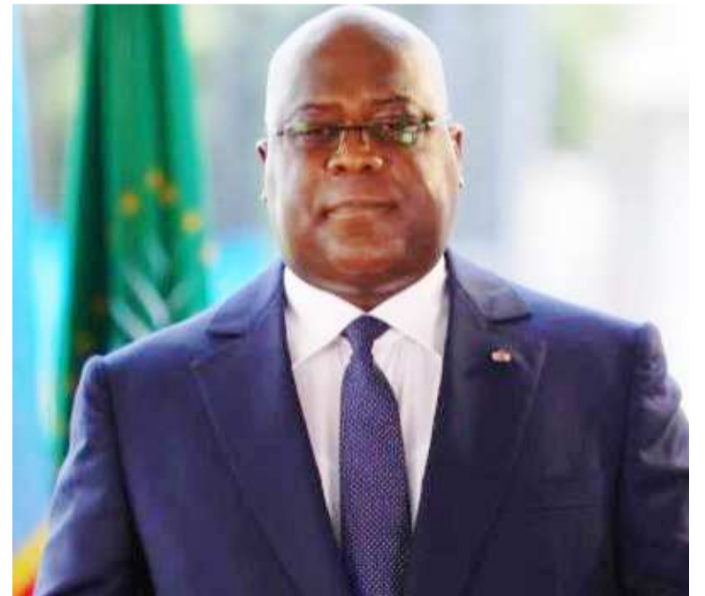
Le chef de l'Etat lisant son message de vœux aux Congolais

Evoquant la gratuité de l'enseignement de base, le chef de l'Etat a indiqué qu'au-delà de cette donne, l'amélioration de la qualité du programme, la formation continue des enseignants et leur prise en charge seront également au cœur