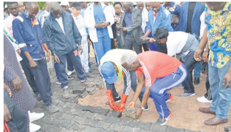
Le Premier ministre place les pavés à la mairie de Moundali en compagnie de Benjamin Loukakou

Le Premier ministre, Clément Mouamba, a procédé, le samedi 4 janvier, à l'application de la circulaire instituant le 1er samedi du mois comme une journée de salubrité publique. Outre le nettoyage, il a planté les gazons afin de prévenir les érosions.