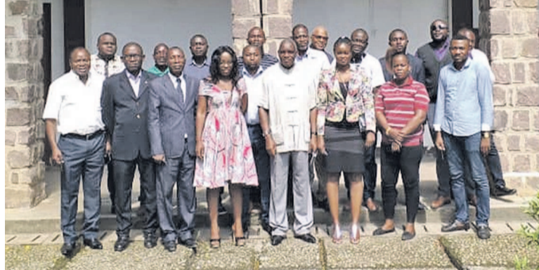
La photo de famille