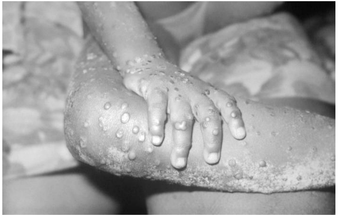
Un patient souffrant de la variole du singe

Par ailleurs, jusqu'au 8 décembre 2019, un total de 619 cas suspects de choléra et 9 décès ont été notifiés dans 60 zones de santé de 13 pro-