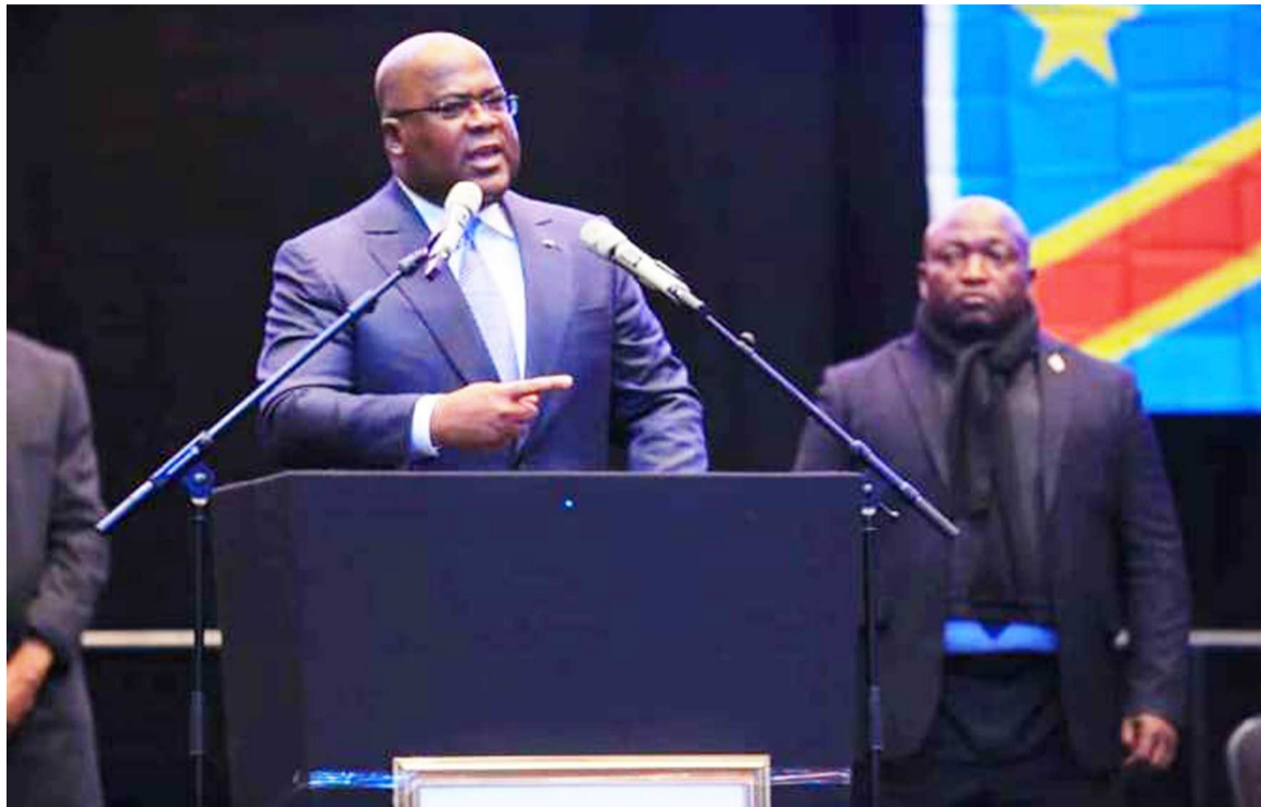
Félix Tshisekedi s'exprimant face aux congolais de Londres

D'un esprit alerte et usant d'un franc-parler quasi inhabituel, Félix Tshisekedi a réaffirmé sa détermination à ne ménager aucun effort pour le retour de la paix sur toute l'étendue de la RDC.