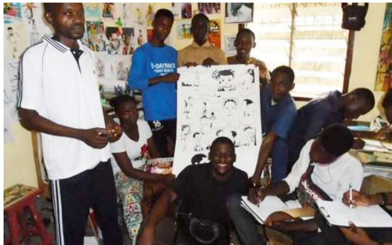
Les jeunes bédéistes et leur formateur

La rencontre itinérante de la bande dessinée Dikouala Bulles a organisé, les 17 et 18 janvier, à Pointe-Noire un atelier de formation sur l'écriture des scénarios à l'endroit des jeunes bédéistes.