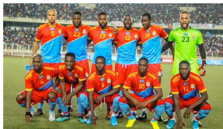
Les Léopards A de la RDC