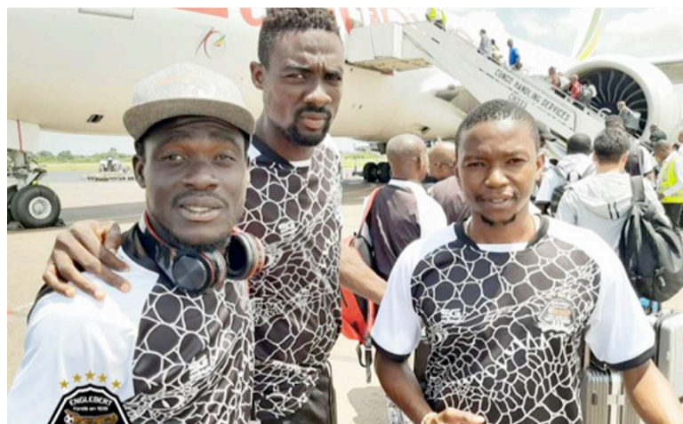
Les joueurs de Mazembe en route pour le Caire