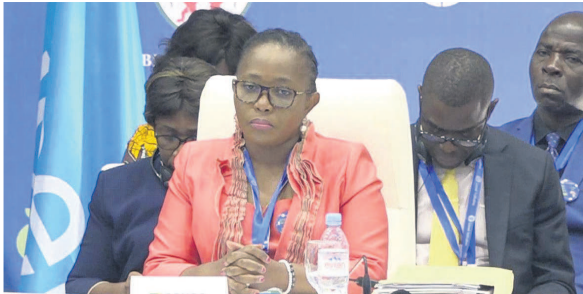
La ministre en charge de la Santé lors du sommet contre le trafic des faux médicaments

Le sommet des chefs d'Etat sur les faux médicaments et les médicaments falsifiés s'est clôturé le 18 janvier à Lomé au Togo. La déclaration ayant sanctionné les travaux résume l'engagement de ces derniers à lutter contre le fléau en trois axes : criminaliser le trafic des produits médicaux en introduisant dans les juridictions nationales respectives des lois et sanctions pénales, mutualiser les efforts pour assurer le respect de ces lois et leur application rigoureuse ainsi que la mise en place des mécanismes de suivi avec comme partenaire, entre autres, la Fondation Brazzaville. « C'est la première fois