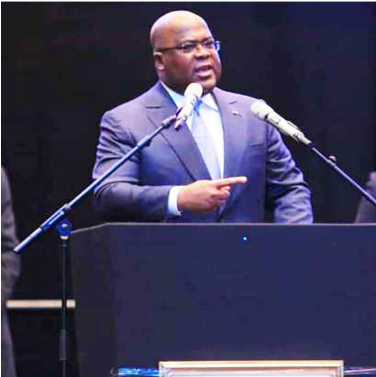
Félix Tshisekedi s'exprimant face aux congolais de Londres