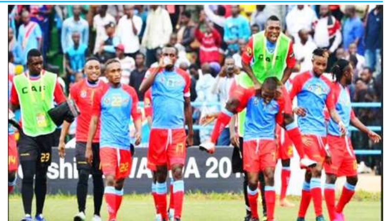
Les léopards Chan 2018