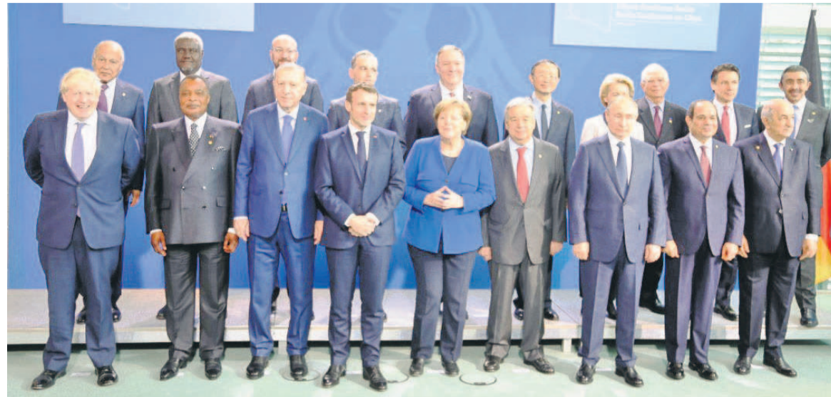
La photo de famille des officiels au sommet de Berlin sur la Libye

Malgré cela, le secrétaire général de l'ONU, Antonio Guterres, s'est félicité de ce qu'à Berlin, les dirigeants de onze pays, à commencer par la Russie et la Turquie qui jouent un rôle-clé en Libye, ont souligné dans une déclaration commune « qu'il