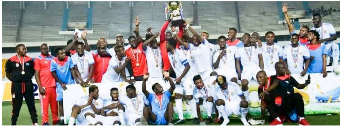
Les Léopards locaux, vainqueurs de la première édition du Tifoco à Kinshasa