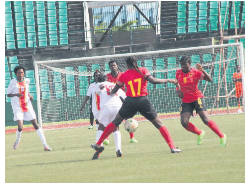
Une séquence du match Congo-Angola

La formation des Diables rouges dames des moins de vingt ans de football a battu, 2-0, les Welwitschia de l'Angola, le 19 janvier au stade Alphonse Massamba-Debat.