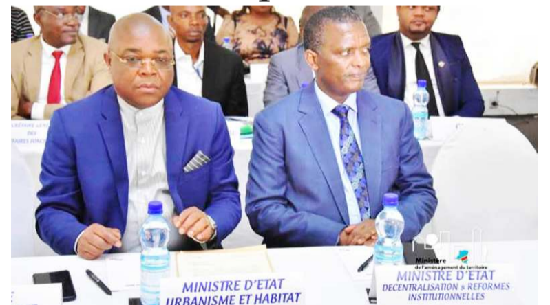
Les membres du gouvernement central ont pris part à cet atelier

Cet important document définit la vision spatiale du pays en matière d'aménagement du territoire d'ici 2050 pour faire de la RDC un pays plus cohérent, attractif, compétitif, développé, fort au cœur de l'Afrique.