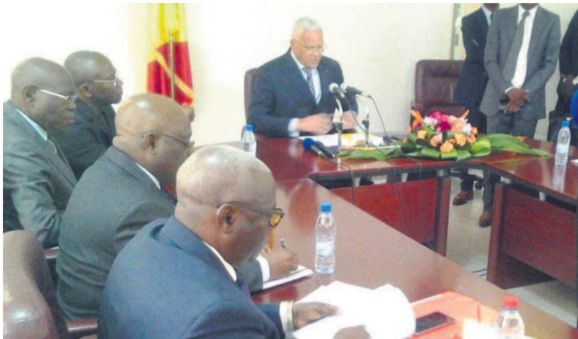
Le ministre des Hydrocarbures au centre, présidant le comité technique

S'agissant des activités menées l'année dernière, le comité a tenu trois séances délibératives assorties des enjeux, à savoir : la conformité et l'évolu-