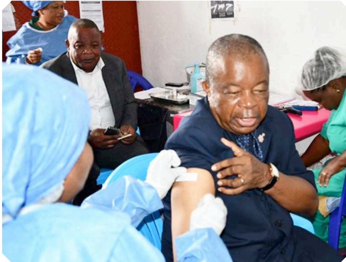
Dr Muyembe se faisant vacciner

« Je viens de prendre ma deuxième dose. Je parle, je marche et je n'ai aucun problème. Je n'ai ni douleurs, ni démangeaisons et je ne ressens aucun effet secondaire. Nous remercions la population qui comprend facilement l'importance de cette vaccination. Je pense que beaucoup de personnes viendront encore se faire vacciner pour se protéger contre la maladie à virus Ebola », a déclaré le Pr Muyembe. Il a, à cette occasion, invité la population de la ville de Goma, particulièrement celle de Majengo et de Kahembe à Karisimbi,