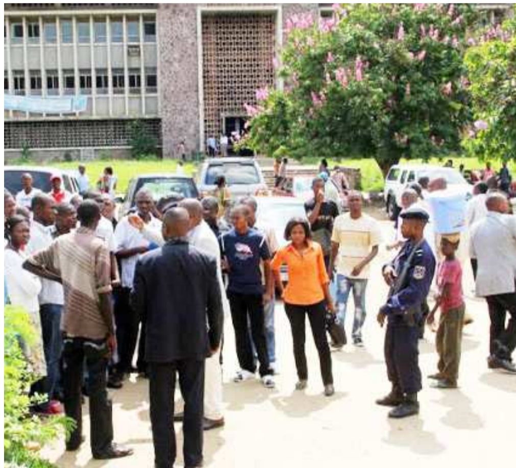
Des étudiants dans l'enceinte de l'Université