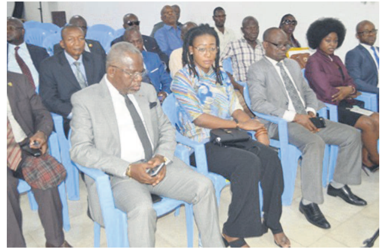
Les nouveaux membres de la CCAS/Adiac

Après plusieurs reports, les membres de la chambre de conciliation et d'arbitrage du sport(CCAS) ont été élus, le 18 janvier, à Brazzaville.