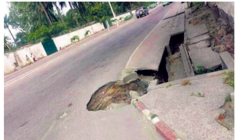
Une vue de la pointe d'érosion

Si rien n'est fait pour empêcher, au plus vite, l'élargissement de cette pointe d'érosion elle pourra prendre de l'ampleur et rendre l'avenue impraticable en cette saison des pluies.