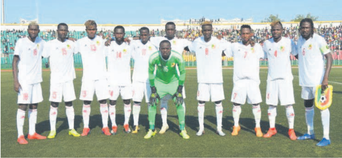
Les joueurs congolais de l'équipe nationale locale

Après avoir participé à la première édition du Tournoi international de football du Congo(Tifoco), du 17 au 19 janvier à Kinshasa, l'équipe congolaise a regagné Brazzaville le 20 janvier afin de poursuivre la préparation du Championnat d'Afrique des nations(Chan).