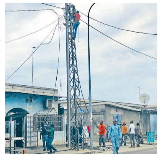
Un technicien en pleine opération

D'après l'un des responsables de la société, ces actions s'inscrivent dans le cadre de la mise en œuvre du Projet eau, électricité et développement urbain (PEEDU), cofinancé par le gouvernement et la Banque mondiale. Il a pour but d'accroître et faciliter l'accès durable des