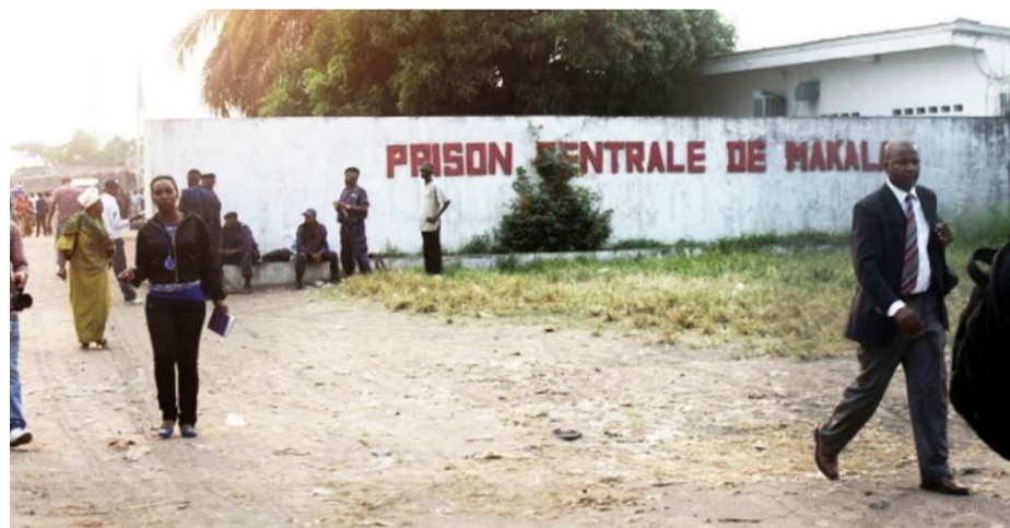
Prison centrale de Makala