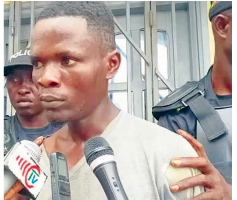
Le présumé assassin explique les faits