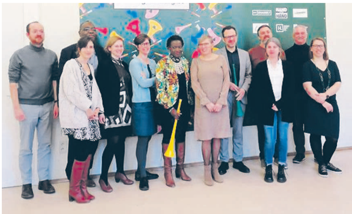
Une vue des organisateurs