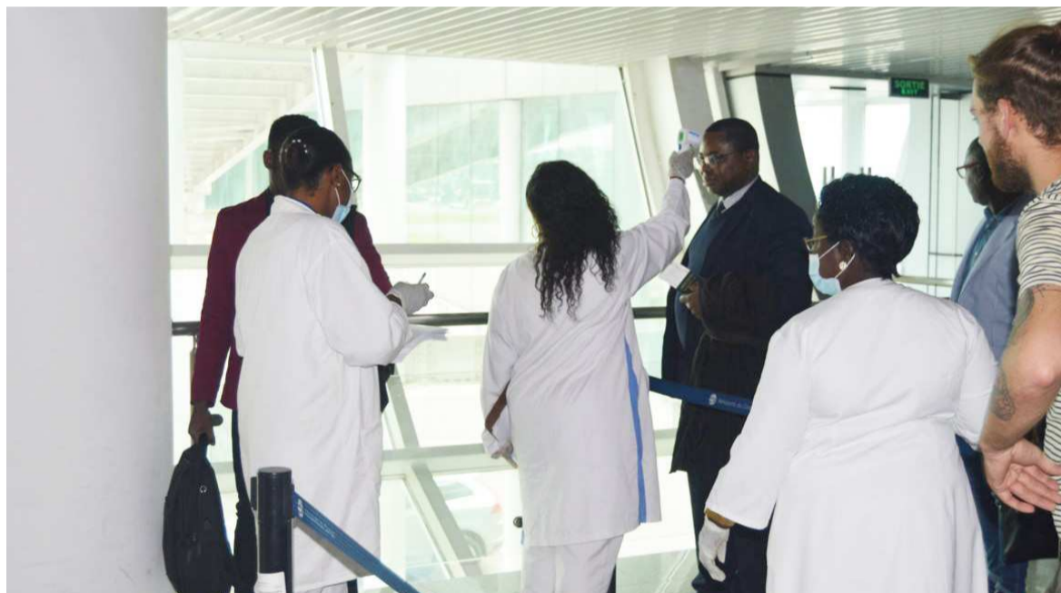
Contrôle sanitaire à l'aéroport Maya-Maya

Pour mieux prévenir l'épidémie du nouveau coronavirus, les autorités sanitaires viennent d'initier au niveau des frontières, notamment les aéroports, le prélèvement systématique des températures à tous les voyageurs en provenance de l'étranger. Par ailleurs, bien qu'aucun cas n'est signalé jusqu'ici