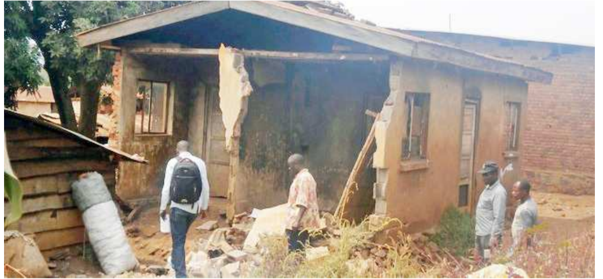
Des maisons endommagées

Les averses, qui se sont abattues récemment à Dilolo Gare, dans la province de Lualaba, ont causé de graves dégâts matériels. Cependant, aucune perte en vie humaine n'a été enregistrée.