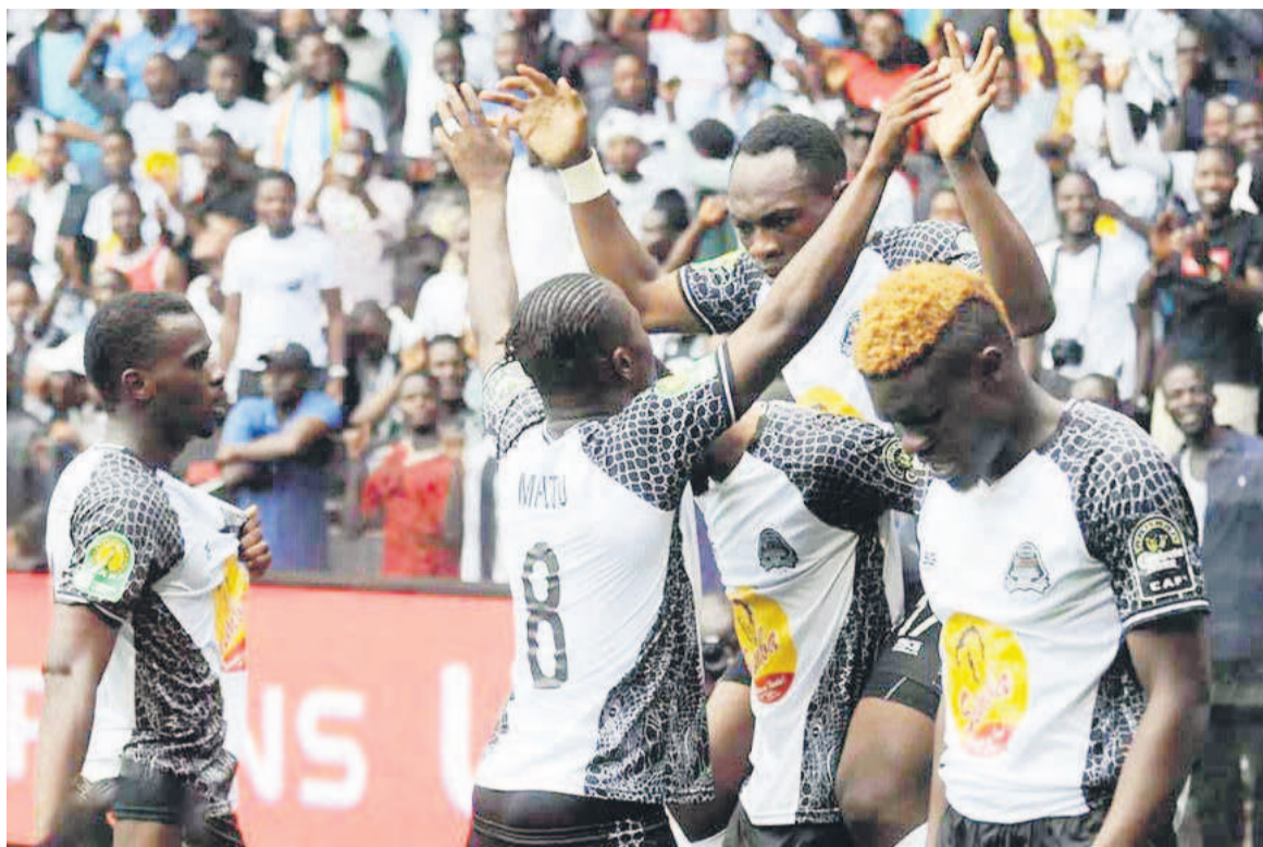
Les joueurs de Mazembe célèbrant un but au stade de Kamalondo à Lubumbashi