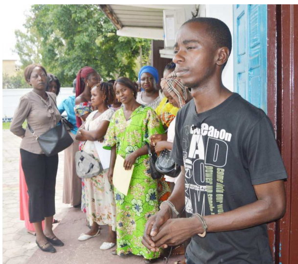
L'inculpé avec un échantillon de femmes escroquées