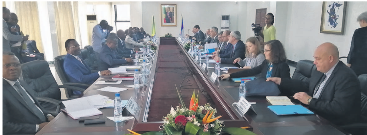
Séance de travail entre les deux délégations.

La cinquième réunion du comité de suivi de l'accord relatif à la gestion des flux migratoires et au co-développement signé le 25 octobre 2007, entre le gouvernement congolais et la France s'est tenue le 27 février à Brazzaville, dans les locaux du ministère des Affaires étrangères, de la Coopération et des Congolais de l'étranger.