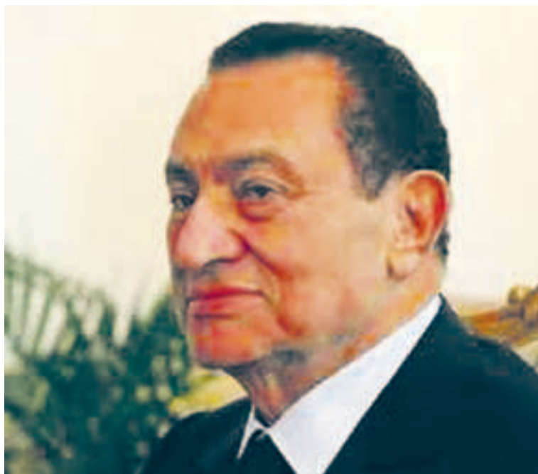
L'ancien président égyptien, Hosni Moubarak

Au cours de son exercice au sommet de l'Etat, Hosni Moubarak bénéficia du soutien des États-Unis, en espèces sonnantes et trébuchantes, une « récompense » indirecte des accords de Camp David, signés en septembre 1978 aux États-Unis, entre Israël et l'Égypte. Ainsi, depuis 1980, l'« ami américain » investit quelque 36 milliards de dollars dans les forces armées égyptiennes, comme le rappelle, en 2008, Margaret Scobey ambassadrice américaine en poste