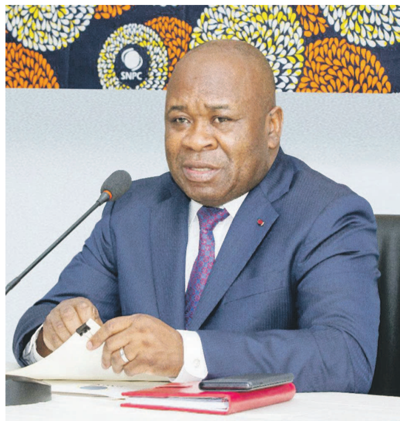
Le directeur général de la SNPC

secteurs pétrolier et gazier. Les panels scientifiques de cette conférence internationale organisée sur le thème « Valoriser les ressources en hydrocarbures en vue de la diversification économique et de l'intégration régionale » ont porté, entre autres, sur la stimulation des investissements étrangers au Congo, les stratégies permettant de s'ap-