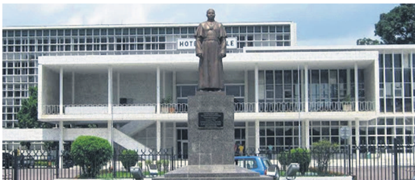
Le siège de la mairie de Brazzaville