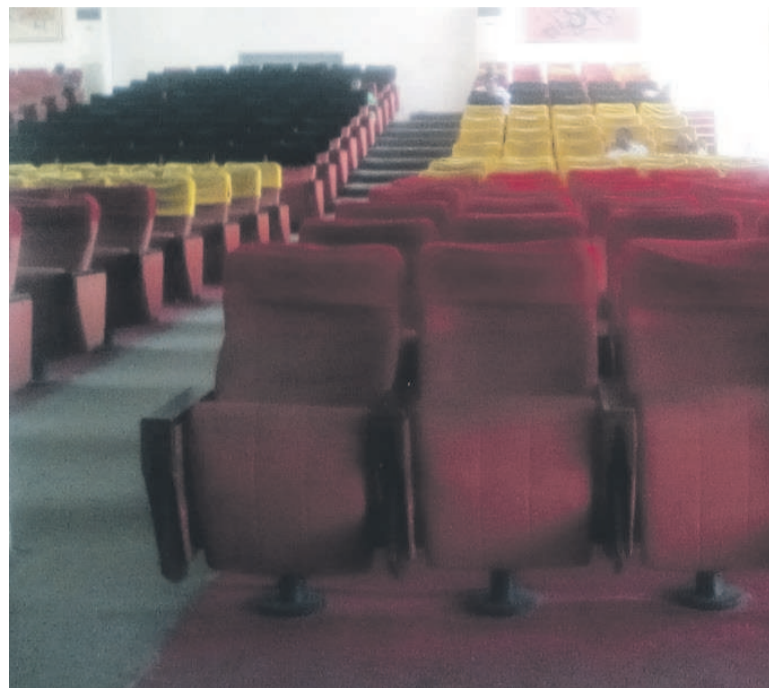
Une vue de la salle de réunion de la mairie de Brazzaville vide, à l'heure de la réunion

« Certains membres du bureau exécutif du conseil départemental et municipal ont déjà désapprouvé la gestion solitaire et non orthodoxe des fonds par le maire. Nous tenons à mettre un terme à cette affaire afin de sauvegarder les intérêts de la collectivité locale. Il est question aussi pour nous de sauver la deuxième moitié de notre mandat qui s'achèvera en 2022, avec un autre président "capable d'assurer une gestion efficace des affaires locales" », ont souligné ces conseillers dans une déclaration. Ces conseillers ont justifié leurs accusations de détournement de fonds par, entre autres, l'échec de l'opération dite « Brazza 100 jours », initiée par