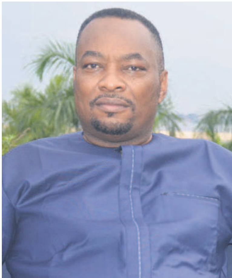
Le ministre en charge de la Santé de la RDC en séjour de travail à Brazzaville

Pour harmoniser les vues à l'échelle continentale, les ministres en charge de la Santé se sont réunis à Addis-Abeba, le 22 février, pour informer les Etats membres de la situation sanitaire actuelle face à la menace du coronavirus. En séjour de travail, le ministre de la Santé de la RDC a échangé avec le bureau ré-