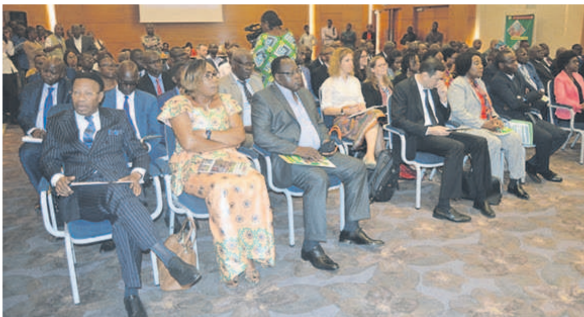
Une vue des acteurs concernés dans la mise en oeuvre du projet

Le projet Lisungi, un programme de soutien social cofinancé par la Banque mondiale et le gouvernement congolais, a lancé la phase d'assistance aux réfugiés basés dans la Likouala, Igné, Kintélé, Brazzaville et Pointe-Noire. Issu d'un accord entre le Congo et l'Association internationale de développement, ce programme vise à améliorer les conditions de vie des réfugiés vivant sur le sol congolais, ainsi que celles des communautés d'accueil.