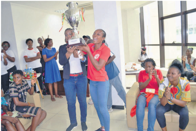
La capitaine de la DGSP reçoit le trophée des mains des organisateurs

Dans le cadre de la célébration de la Journée internationale des droits de la femme, un mini tournoi de volleyball a été organisé à Brazzaville par l'association Sara attaque pour des générations épanouies (Sage), en partenariat avec la ligue de Brazzaville et la Fédération congolaise de volleyball (Fecovo).