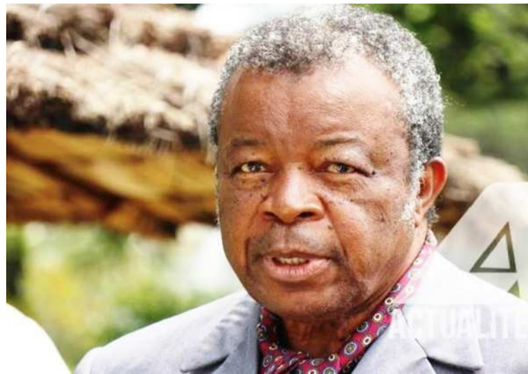
Le Dr Jean Jacques Muyembe