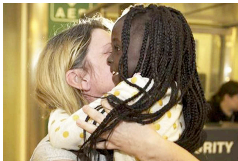
Une mère adoptive et une fillette congolaise. avaient été "libérés par les autorités congolaises".

En 2015, plusieurs enfants ont été pris à Gemena et se sont retrouvés dans un orphelinat de Kinshasa dirigé par la belgo-congolaise Julienne Mpemba, rappelait le journal sudinfo.be. Plusieurs d'entre eux avaient ensuite été adoptés en Belgique. Mais cinq adoptions avaient été suspectées d'être frauduleuses, selon le parquet fédéral belge. L'enquête avait démarré en 2016. Des perquisitions avaient notamment eu lieu dans trois centres d'adoption wallons et des soupçons étaient déjà nés à ce moment sur l'im-