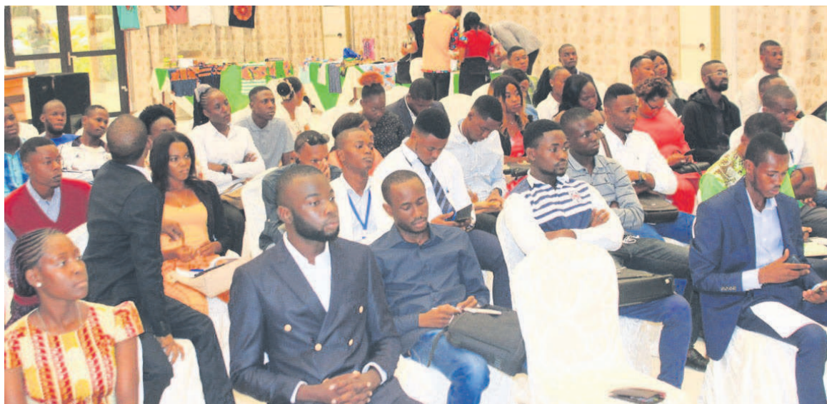
Des jeunes lors du lancement des activités