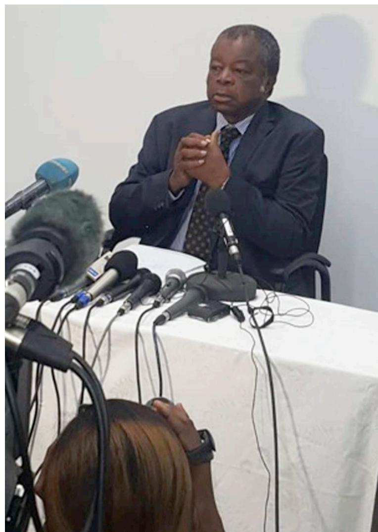
Dr Jean-Jacques Muyembe lors de la conférence de presse

Au cours d'une conférence de presse qu'il a tenue, le lundi 9 mars, à l'amphithéâtre de l'INRB sur l'évolution de la situation épidémiologique de la dixième épidémie de la maladie à virus Ebola, le coordonnateur du secrétariat technique du comité multisectoriel de la riposte contre la maladie à virus Ebola, le Dr Jean-Jacques Muyembe Tamfum, a rassuré que cette épidémie sera bientôt éradiquée au regard de l'évolution positive de la maladie sur le terrain. « Je tiens à déclarer que nous venons de franchir, à ce jour, le cap de vingt et un jours sans nouveau cas confirmé d'Ebola. Les onze dernières personnes qui étaient en contact avec le dernier cas guéri de la maladie à virus Ebola, qui a été affranchi le 3 mars, sortiront du centre de traitement Ebola ce mardi 10 mars. Ils vont finir leur surveillance aujourd'hui à minuit », annonce le Dr Muyembe qui croise les doigts pour qu'il n'y ait pas d'incident sécuritaire, que nos équipes, ajoute-t-il, ne sentent pas la fatigue et qu'elles continuent de travailler pour mettre fin définitivement à cette épidémie qui a été la plus complexe. A en croire le Dr Muyembe, la dernière survivante d'Ebola âgée