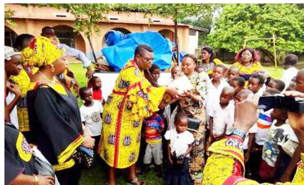
Remise des présents par la Samba

L'Association des anciens du Lycée de Mbanza-Mboma, dans le Kongo central (la Samba) a apporté, le 8 mars, une aide en produits alimentaires pour soutenir la congrégation des sœurs qui gère l'école primaire I Mbanza-Mboma, dans la prise en charge des élèves externes de cet établissement scolaire.