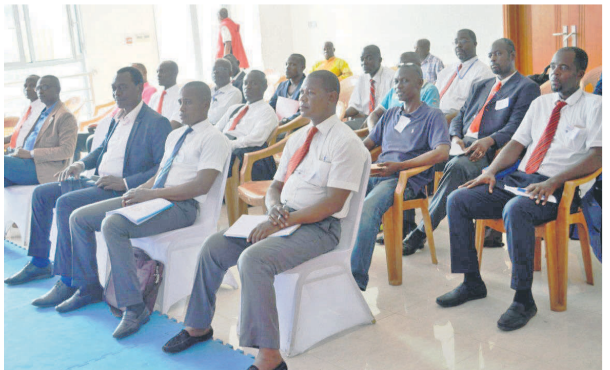
Une vue des séminaristes

Durant ce séminaire qui a été animé par des arbitres internationaux, les participants ont découvert toutes les évolutions liées à l'arbitrage au karaté. Il s'est agi, en effet, du comportement, des agissements ainsi que de l'habillement d'un arbitre. Les notions sur la durée et le déroulement de combats étaient aussi exposées dans ce moment du donner et du recevoir qui a eu lieu au