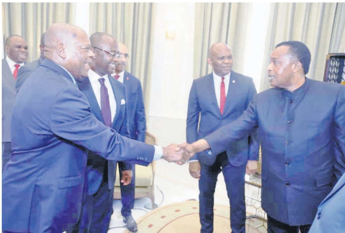
Denis Sassou N'Gusso recevant les banquiers

En tant que créancières du pays, les banques veulent afficher une marque de confiance vis-à-vis