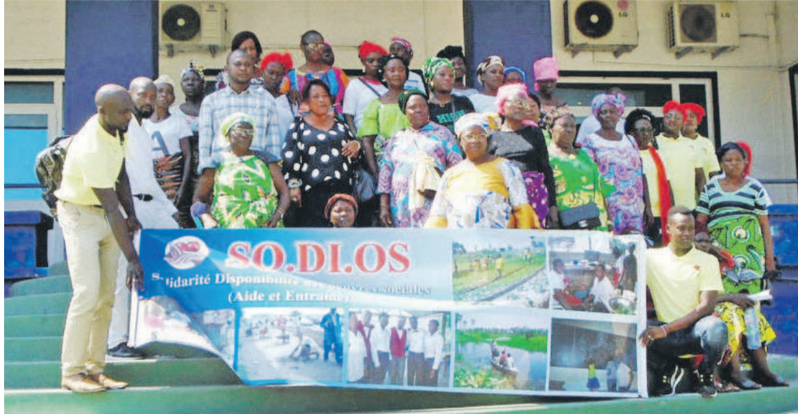
Photo de famille à la fin de l'assemblée générale de l'ONG Sodios

L'association Solidarité, disponibilité des œuvres sociales aide et entraide (Sodios) a tenu son assemblée générale le 5 mars au cours de laquelle elle a présenté le bilan de ses activités réalisées en 2019 et fait la projection de celles à venir.