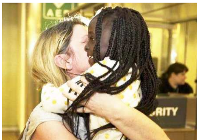
Une mère adoptive et une fillette congolaise

La chambre du conseil du tribunal correctionnel de la ville de Dinant (sud de la Belgique) examinait, le 9 mars, si les huit fonctionnaires inculpés devaient comparaître en justice pour une affaire qui a éclaté en 2015 et où des enfants ont été enlevés à leurs parents en RDC.