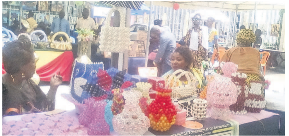
Une vue des stands

Ouvert le 4 mars dernier, le salon de l'artisanat féminin se comporte tant bien que mal, et les produits présentés par les artisanes attirent les visiteurs.