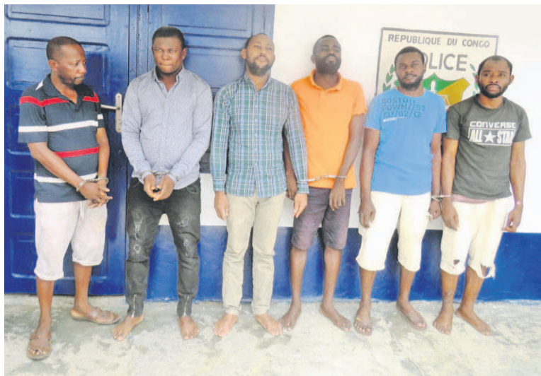
Les présumés braqueurs

Les services départementaux de la police judiciaire au Kouilou et à Pointe-Noire ont présenté le vendredi 6 mars, à la presse, les présumés braqueurs à mains armées du convoi d'argent appartenant à une société.