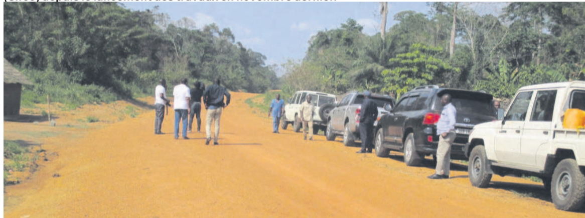
La délégation du ministère de l'Équipement sur la route en chantier.

Sur 112 km de route, 44 km seulement ont été réalisés par la Société industrielle et forestière du Congo (Sifco) depuis le lancement des travaux en novembre dernier.