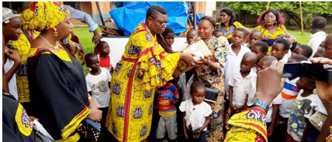
Remise des présents par La Samba

Cette aide apportée par la Samba, rassure sa secrétaire, permettra de soutenir cette action des religieuses