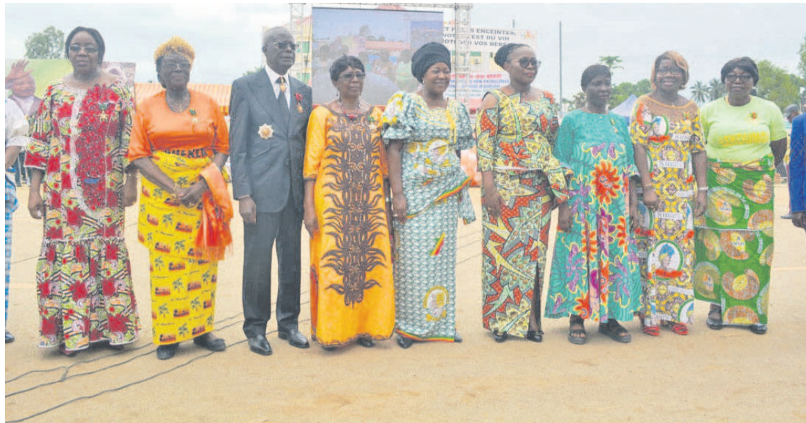
Un échantillon des femmes décorées

La réflexion étant centrée sur le thème qui intègre la campagne de l'ONU femme, Jacqueline Lydia Mikolo pense que ce thème est « révélateur d'un réel besoin de renforcer les actions en vue de mettre fin aux obstacles qui freinent encore l'atteinte de l'égalité des sexes et empêchent aux filles et aux femmes de jouir pleinement de leur droits fondamentaux ». Car, « en dépit des avancées sans précédent réalisées dans plusieurs domaines, aucun pays n'a encore atteint l'égalité des sexes », a fait savoir la