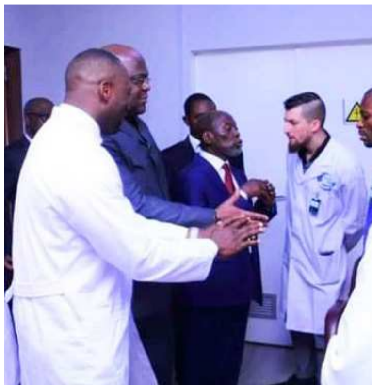
Le chef de l'Etat recevant les explications du corps médical

Le Centre hospitalier Nganda impliqué dans le traitement du cancer vient de se doter d'un centre de radiothérapie. Le chef de l'Etat qui a fait de l'accès gratuit des Congolais aux soins de santé une des priorités de son quinquennat a procédé, le dimanche 8 mars, à l'inauguration de ce joyau, le deuxième du genre en Afrique après celui de Cap-Town en Afrique du Sud.