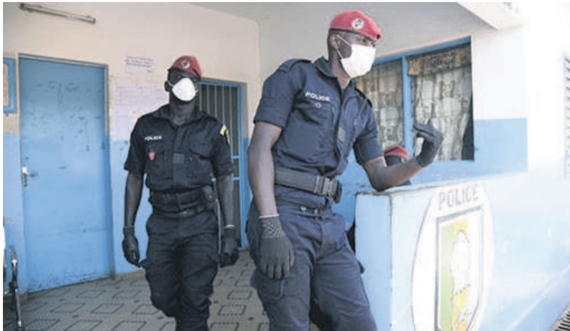
Des policiers sénégalais masqués au marché au poisson de Pikine à Dakar

Aux Etats-Unis où 53.000 cas étaient officiellement déclarés,