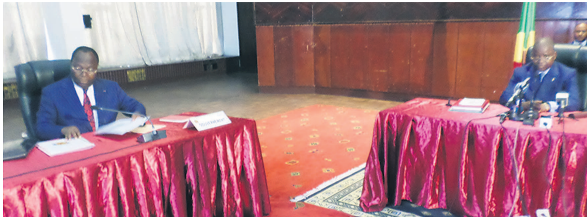
Le gouvernement et le Sénat lors des échanges

La chambre haute du parlement conduite par son président Pierre Ngolo, a échangé le 25 mars à Brazzaville avec le gouvernement sur la pandémie du coronavirus (Covid-19).