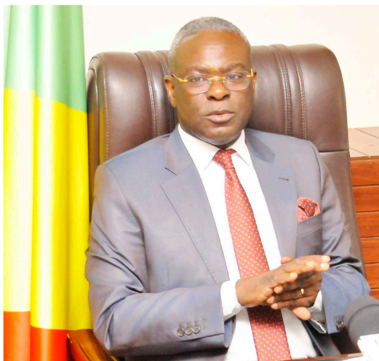
Anatole Collinet Makosso