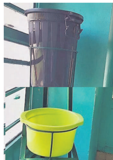
Un dispositif de lavement des mains placé à l'entrée d'une administration publique

Par ailleurs, du côté de la direction générale de la fonction publique, les agents vaquent ordinairement à leurs tâches administratives, tout en redoublant de vigilance face à la pandémie. L'affluence n'est plus la