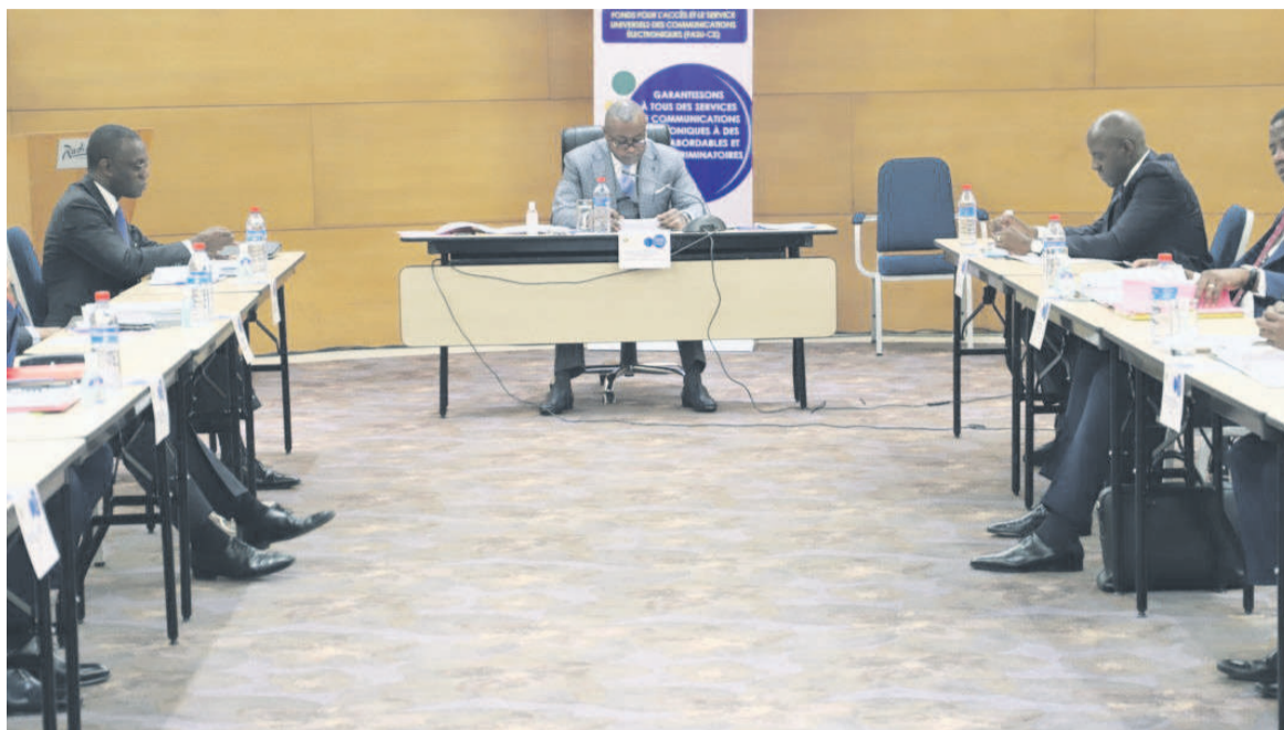
Léon juste Ibombo encadré par Yves Castanou et Yves Ickonga (conseiller à l'économie numérique du Président de la République) à l'ouverture des travaux

Lors de cette première session administrative et budgétaire, plusieurs documents devront permettre d'engager les actions du Fonds ont été examinés. Il s'agit du projet du règlement intérieur, de celui d'orientation stratégique, du plan d'action,