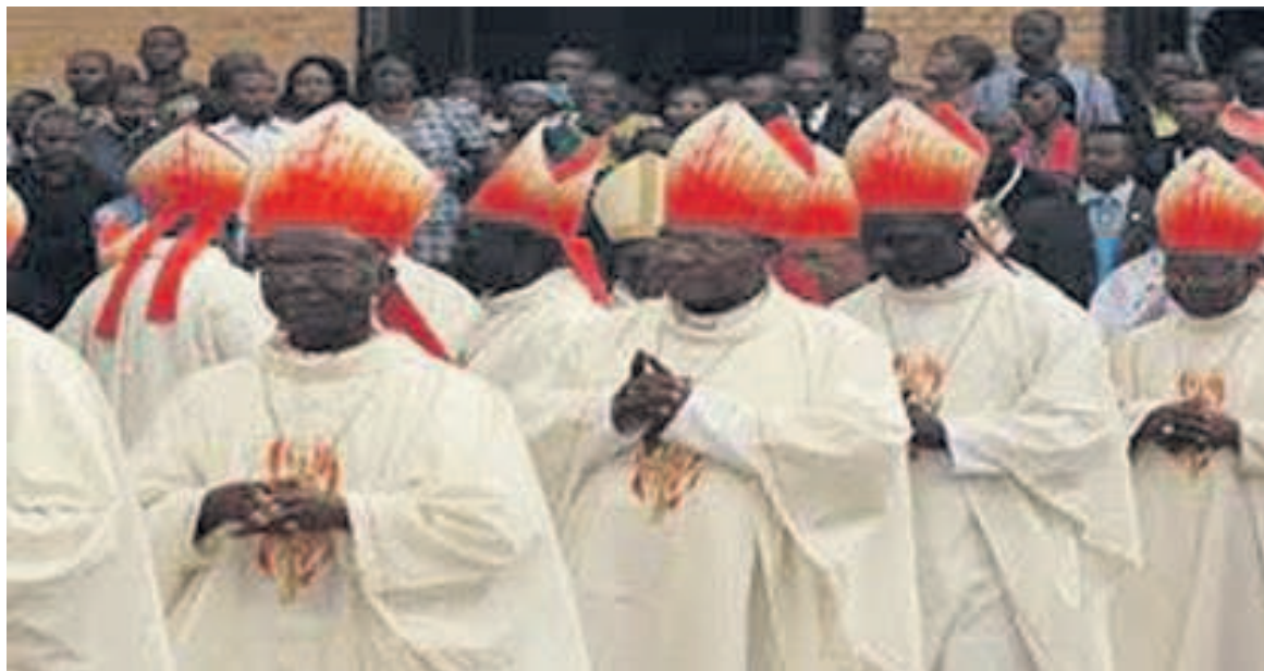
Les évêques de la RDC/UR