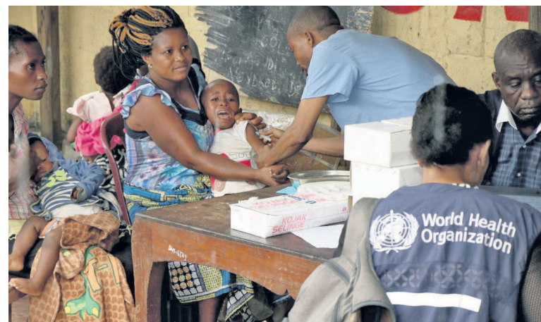
La vaccination prévient la rougeole

Au cours d'une réunion téléphonique ayant eu lieu cette semaine entre le Bureau régional de l'OMS pour l'Afrique, le Bureau Pays et le ministère de la Santé, les autorités sanitaires nationales de la RDC ont confirmé la tenue de la campagne sur la base d'une décision du comité multisectoriel de lutte contre le coronavirus présidé par le Pr Jean-Jacques Muyembe, directeur de l'Institut national de recherche biomédicale.