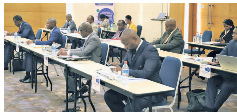
Vue des membres du Fonds et de l'organe de gestion

Pour ce faire, trois axes essentiels ont été privilégiés afin d'atteindre les objectifs assignés. Si promouvoir l'accès des communautés rurales et démunies aux services des communications électroniques de base (voix et données) et aux services nécessitant la large bande en constitue le premier point, encourager le développement des nouveaux services, la création des contenus locaux et des applications spécifiques, favorisant l'inclusion numérique, pointe comme une exigence. A ces deux pivots, le comité du Fonds s'est résolu de renforcer les capacités des différentes parties prenantes en matière d'appropriation des TIC. 75% de ce budget, soit 2 243 900 807 Francs CFA, sont prévus pour l'investissement. Selon le secrétaire du Fonds,