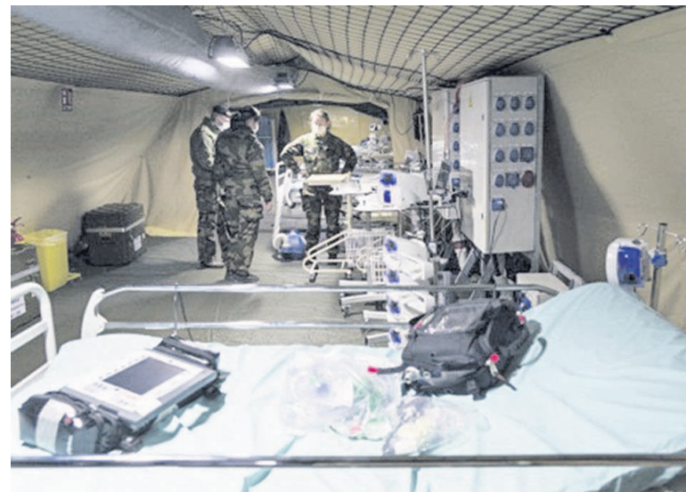
A Mulhouse, l'armée a déployé un hôpital de campagne d'une capacité de 30 lits pour désengorger les services de réanimation du Grand Est

Plus d'une centaine de soldats devaient être envoyés samedi (21 mars) aux frontières slovaque et autrichienne pour « renforcer le verrou frontalier », a indiqué le ministre hongrois de la Défense Tibor Benk sur Hir TV. Elles sont fournies par la 5e