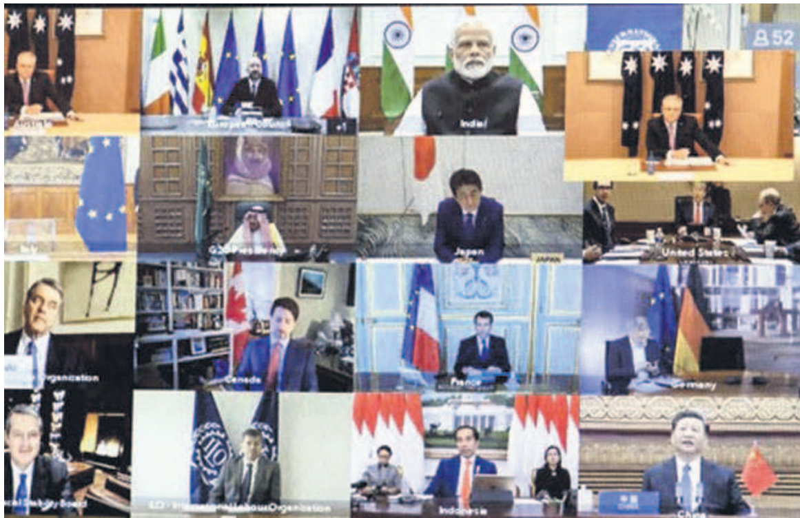
Le G20 a tenu une vidéo-conférence de crise, jeudi

Les 20 plus grandes économies mondiales ont aussi annoncé qu'elles travailleraient avec les organisations internationales « afin de déployer un ensemble de mesures financières solides, cohérentes, coordonnées et rapides ». Et ont appelé ces institutions, dont l'Organisation mondiale de la santé (OMS) et le FMI, à « aider les pays émergents et en développement à faire face aux chocs sanitaires, économiques et sociaux du Covid-19 ». Dès l'issue de la réunion virtuelle du G20, la directrice du FMI, Kristalina Goergieva, a appelé les pays du G20 à doubler les capacités de financement d'urgence de l'institution de Washington. Citée dans un communiqué, elle alerte : « Nous devons agir de pair avec l'ampleur du défi. Pour nous, au FMI, cela signifie travailler avec vous pour renforcer encore notre réponse à