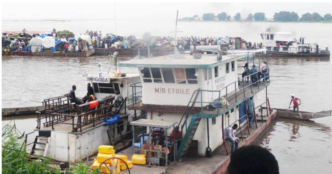
Arrivée de nouvelles embarcations le mercredi

Dans un contexte de crise sanitaire liée à la propagation du coronavirus, le contrôle du trafic et des passagers devient essentiel. En coordination avec les autorités portuaires, une équipe médicale sensibilise les commerçants à la maladie en plus de la prise de la température. Ce contrôle est imposé à tous les passagers, parce qu'à bord des bateaux se trouvent également des commerçants ayant séjourné dans les pays voisins, confie une infirmière. Depuis le 21 mars, les frontières