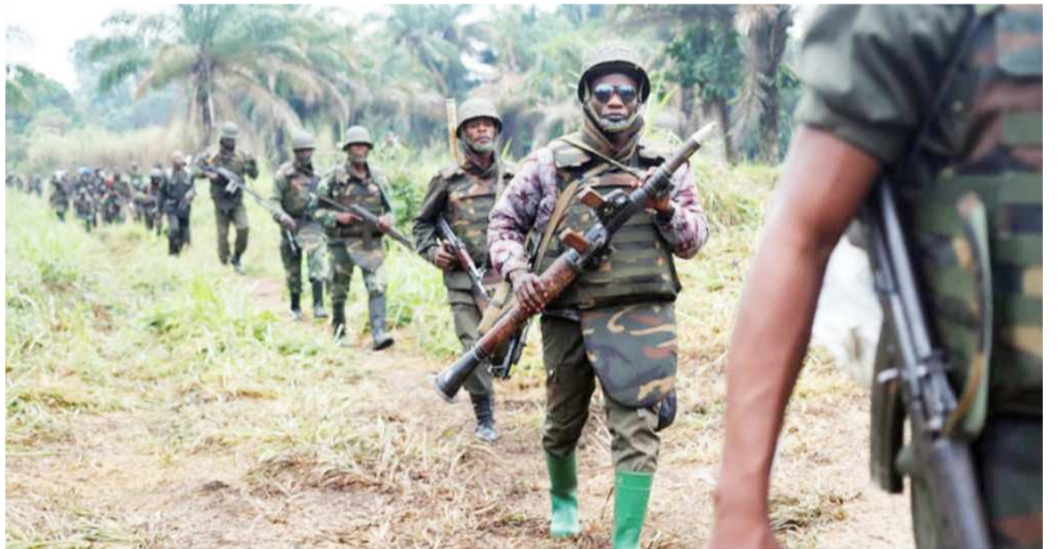
L'armée nationale dans une expédition

Pour le Miss, les autorités du pays doivent appliquer la purge dans l'armée en vue d'assurer une paix véritable dans les parties du pays affectées par la présence des groupes armés. « Le Miss/RDC se doit d'attirer l'attention des autorités congolaises pour que la purge demeure pour toujours un remède efficace pour une armée nationaliste et patriote », insiste ce mouvement. Cette association note, en effet, que depuis les guerres menées par les différents mouvements rebelles dans l'est du pays dont