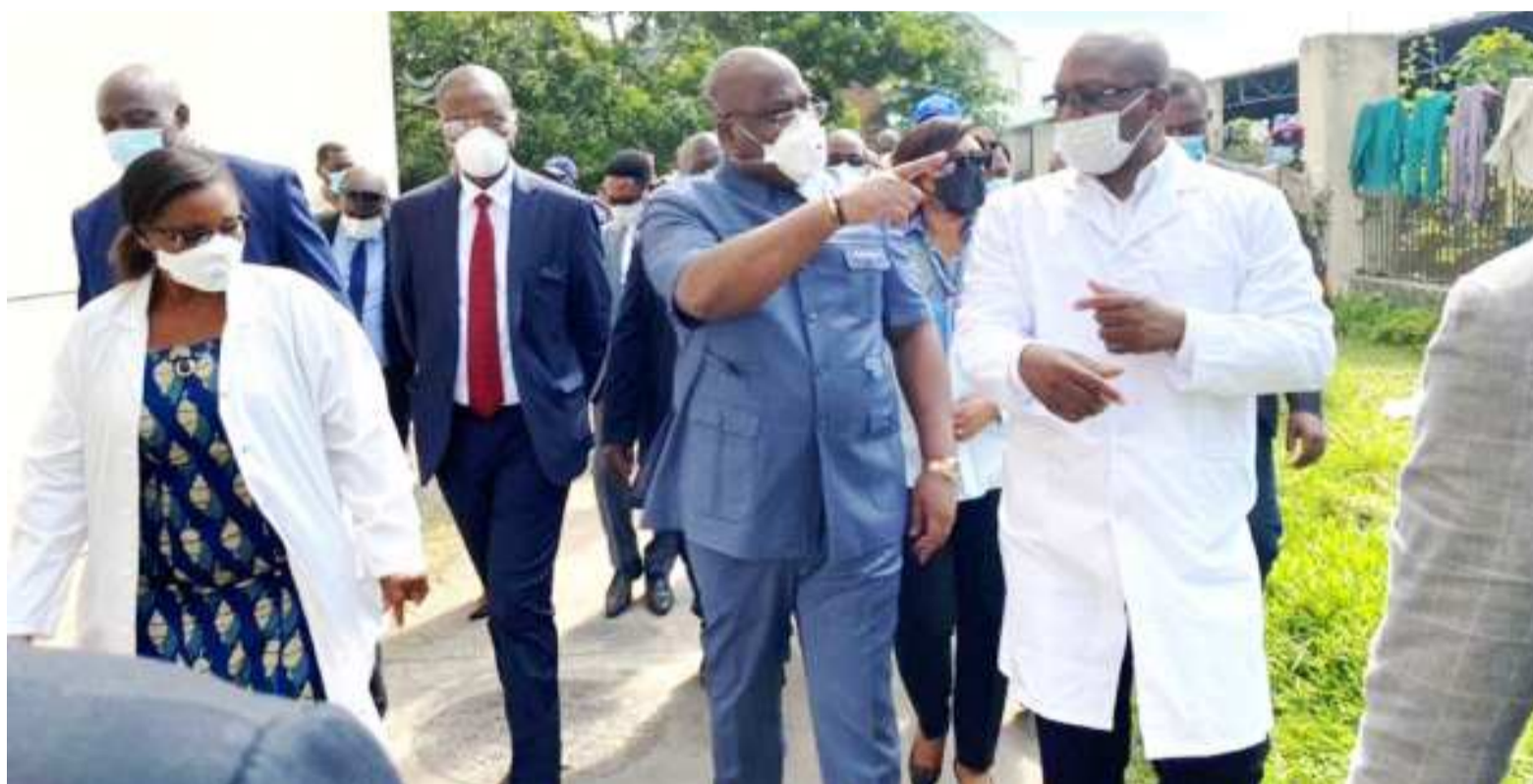
Félix Tshisekedi visitant les hôpitaux chargés de la prise en charge des malades du Covid-19

Après avoir présidé une réunion d'évaluation à mi-parcours de la riposte et de l'évolution de la situation du Covid-19 en République démocratique du Congo, le chef de l'Etat, Félix-Antoine Tshisekedi Tshilombo, a tenu le 7 mai à descendre sur le terrain afin de palper du doigt les réalités relatives à la prise en charge des malades dans quelques formations hospitalières de Kinshasa.