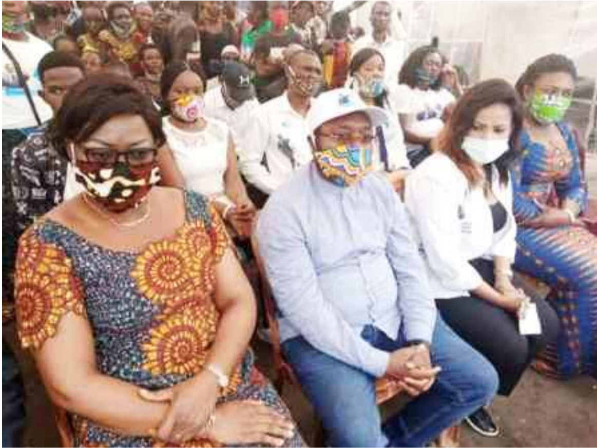
Le RGJK impliqué dans la lutte contre le Covid-19

En cette période de pandémie, la communication de proximité est une stratégie efficace pour amener la population à changer de comportement en adoptant des gestes barrières afin de freiner la propagation du Covid-19 en RDC. Cette maladie a fait à la date du jeudi 7 mai huit cent quatre-vingt-dix-sept cas positifs.