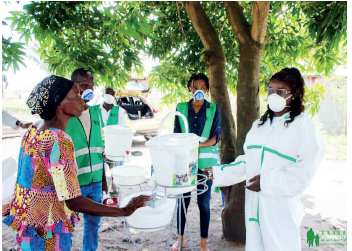
L'équipe de l'ASBL TMM sensibilise au Covid-19 dans un camp militaire

L'ASBL a par la suite remis symboliquement les dispositifs de lavage au commandant second du camp, qui à son tour, est descendu avec l'équipe de TMM pour les placer dans tous les coins stratégiques dudit camp. Les habitants se sont engagés au strict respect des gestes barrières. Cependant, ils ont présenté leurs difficultés, confrontés au crucial problème de manque d'eau, une denrée qui ne coule pas dans ce camp. D'où leur cri d'alarme lancé aux autorités compétentes afin de trouver