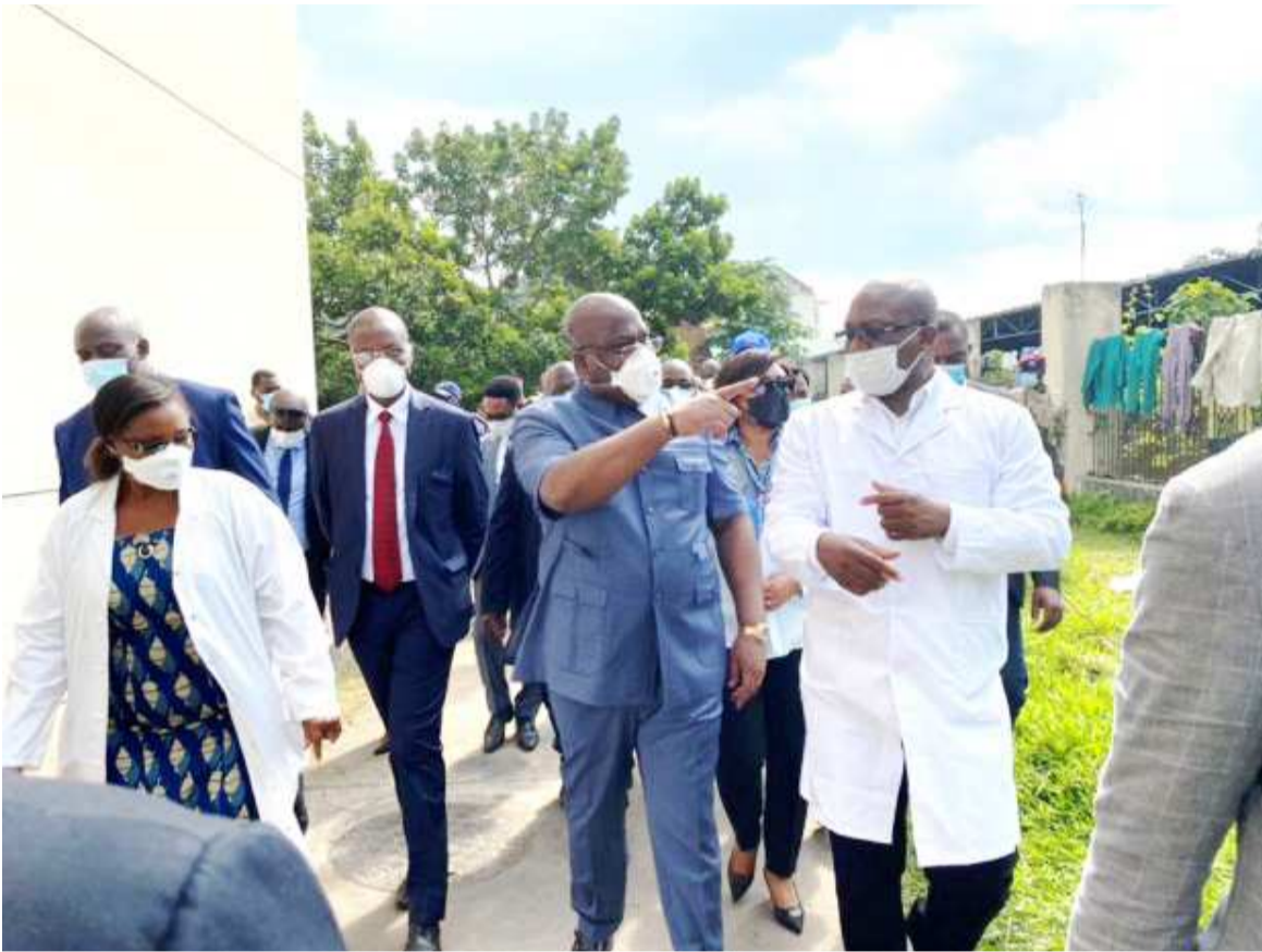
Félix Tshisekedi à l'hôpital du Cinquantenaire

Après avoir présidé une réunion d'évaluation à mi-parcours de la riposte et de l'évolution de la situation du Covid-19 en RDC, le chef de l'Etat, Félix-Antoine Tshisekedi Tshilombo, a tenu à descendre sur le terrain afin de palper du doigt les réalités relatives à la prise en charge médicale des malades dans quelques formations hospitalières de Kinshasa.