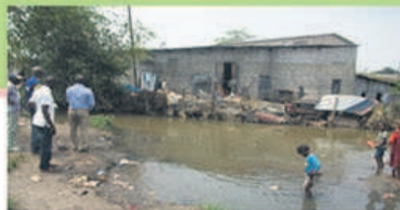
Rivière la Tsiémé