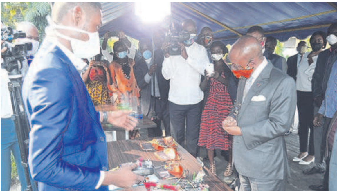
Le ministre Coussoud-Mavoungou s'imprégnant du fonctionnement du drone de livraison de masques

Solutions digitales pour contrôler l'évolution de la pandémie, appareils semi-automatiques de lavage de mains, autant de solutions innovantes conçues par des Congolais pour lutter contre la Covid-19 ont été présentées au ministre de la Recherche scientifique et de l'Innovation technologique, Martin Parfait Aimé Coussoud-Mavoungou, le 25 mai à Brazzaville.