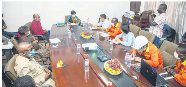
La séance de travail à la cimenterie Forspak

Reconnaissant qu'ils ne sont pas en conformité avec la loi, les responsables de la société Forspak ont présenté des excuses à la ministre, indiquant qu'ils n'avaient pas bien interprété les textes. « A partir de cet instant, nous allons faire ce que vous nous avez demandé. Nous vous prions aussi de nous accompagner », ont-ils déclaré. « Je suis triste de constater que depuis 2013, vous n'êtes pas en règle. Nous apprécions le fait que vous utilisez deux-cent cinquante jeunes congolais, mais cela ne doit pas être au mépris des lois. Je note votre volonté de faire mieux, mais vous devez aussi savoir que chaque pays a ses lois. Vous ne pouvez pas investir soixante-dix millions de dollars sans vous conformer aux lois qui régissent le pays dans lequel vous avez investi. Vous avez sollicité qu'on reparte sur de nouvelles bases, mais trois mois après, si rien n'est fait, je mets votre société en demeure. », a répliqué la