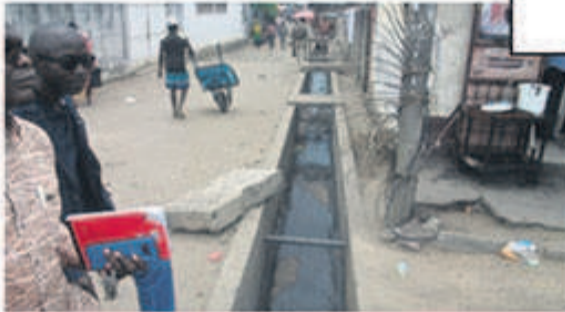
Rue Ignace Moutanda

PROJET DE DEVELOPPEMENT URBAIN ET DE RESTRUCTURATION DES QUARTIERS PRECAIRES (DURQuaP)