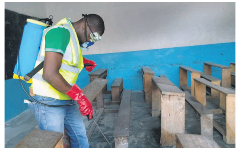
L'équipe de désinfection dans l'une des salles de classe du complexe Emonaya

L'Association solidarité universelle monde (ASU Monde) à travers l'antenne du Congo a effectué, le 25 mai, l'opération de désinfection au complexe scolaire Emonaya, situé dans le neuvième arrondissement Djiri à Nkombo.