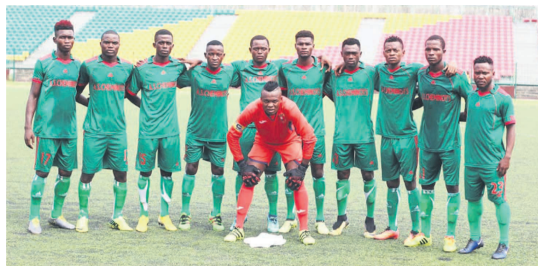
L'AS Cheminots attend les barrages

L'AS Cheminots a perdu en tout dix matches soit neuf sur le terrain. La saison ne pouvait pas bien commencer pour une équipe qui refuse de se rendre à Dolisie pour y livrer son match contre l'Ac Léopards comptant pour la première journée. Elle est battue sur tapis vert 0-3. Après c'est la succession des défaites qui l'attendait. L'AS Cheminots s'incline face à Nico-Nicoyé 0-1 puis face à l'Interclub sur le même score. Les Diables noirs lui infligent encore une autre défaite sur le score identique avant de s'incliner deux fois face à l'AS Otoho (0-2 et 0-3).