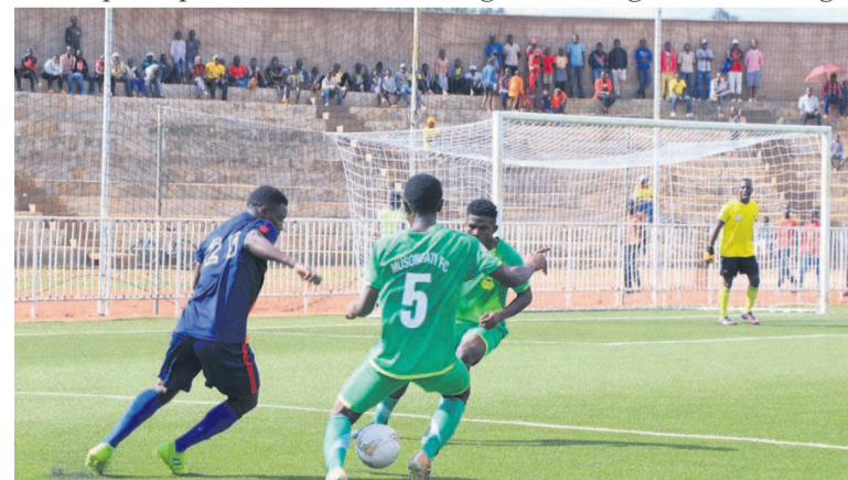
Une vue du match Musongati-athletico Olympic/DR

vid-19, le championnat Burundais a officiellement repris le 21 mai, avec un match décisif au Stade Ingoma à Gitaga entre Musonga-