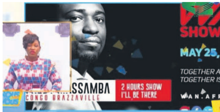
Journée de l'Afrique 2020 avec Fredy Massamba à l'affiche

Lundi 25 mai, sur deux-cents chaînes de télévision du continent et les réseaux sociaux dédiés, l'effervescence était visible autour de la célébration de la Journée de l'Afrique placée, cette année, sous le signe de la solidarité à cause de la pandémie. Cet élan d'engagement a permis aux Africains et Afro-descendants de porter une réflexion collective sur l'après-crise sanitaire du Covid-19. L'artiste congolais Fredy Massamba était présent parmi les artistes du jour. Pour l'initiateur, Amobé Mévégué, animateur et journaliste sur France 24, en partenariat avec l'Unesco, cela a représenté le commencement de la construction d'une nouvelle Afrique : Unie et innovante / Réalisation du hashtags #JeSuisWan et #IamWan. Il se terminera par un Show 2.0 qui sera diffusé gratuitement, en prime time, sur toutes les chaînes nationales africaines et certaines chaînes privées, avec le soutien technique de l'African Union Broadcasting. Tous les acteurs de ce Show 2.0 se sont fixés pour objectif de sensibiliser aux risques d'infection, d'engager une réflexion collective de sortie