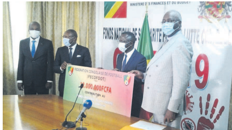
La Fécofoot remet son chèque au ministre délégué au Budget

Outre la Fécofoot, les confessions religieuses du Congo ont, pour leur part, apporté une enveloppe totale de 15 millions de FCFA, soit 10 millions venant de l'église Impact centre chrétien (ICC) et 5 millions des