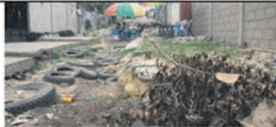
Croisement Rue Voka Avenue Boueta