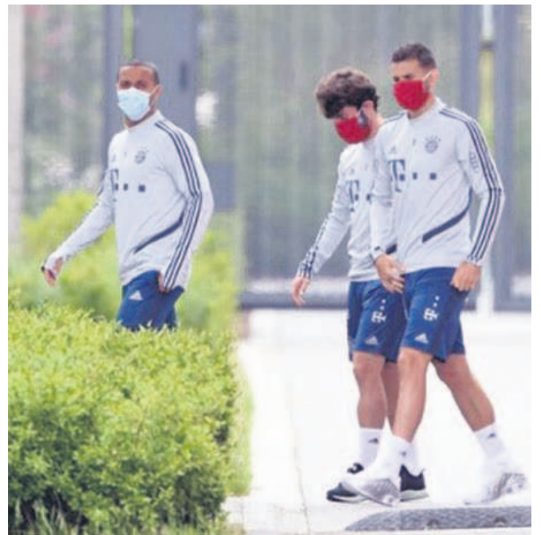
Les joueurs du championnat allemand, la Bundesliga ont repris avec les matchs

La Confédération africaine de football (Caf) a, par le biais de son secrétaire général, Abdel Bah, déclaré que les dates prévues pour le déroulement de la Coupe d'Afrique des nations (Can), Cameroun 2021 sont jusqu'à présent prioritaires. Lors d'une interview accordée à la Radio Sport Info, le patron de l'administration de la Caf a