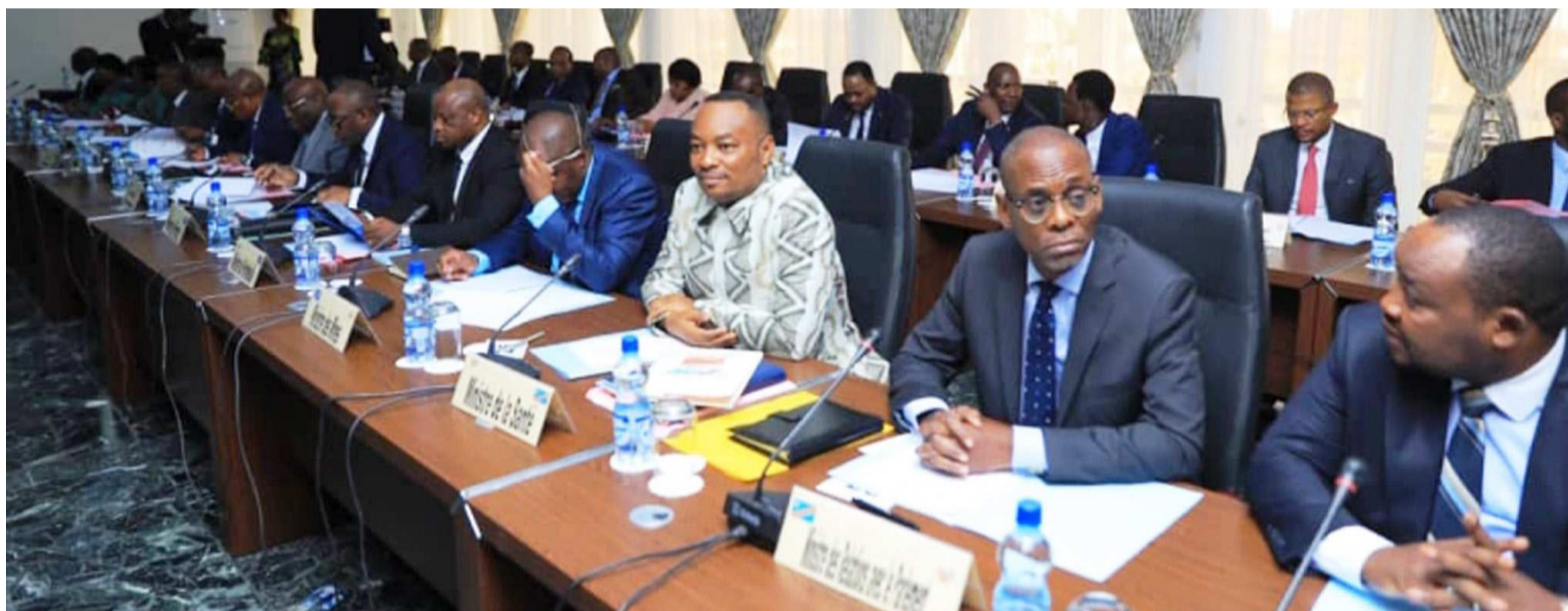
Les membres du gouvernement lors du premier Conseil des ministres