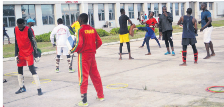
Les Diables rouges Taekwondo

Le programme d'activités de la fédération congolaise de taekwondo (Fecotae) va connaître des modifications consécutives à la pandémie de Covid-19.