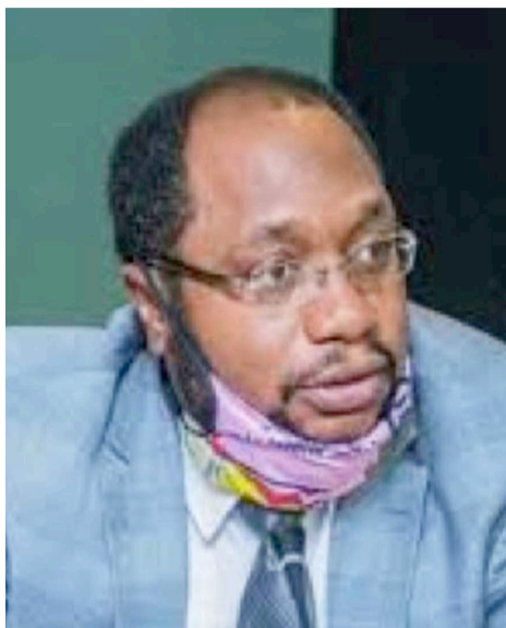
Le député Félix Kabange Numbi Mukwampa

Pour le président de ladite commission, le député national, Félix Kabange Numbi, la commission a la mission de pouvoir évaluer toutes les mesures qui ont été prises par le gouvernement, notamment celles reprises dans l'ordonnance du 24 mars instituant l'État d'urgence et toutes les autres mesures prises depuis le 10 mars jusqu'à ce jour. « Nous allons évaluer l'impact dans les différents sec-