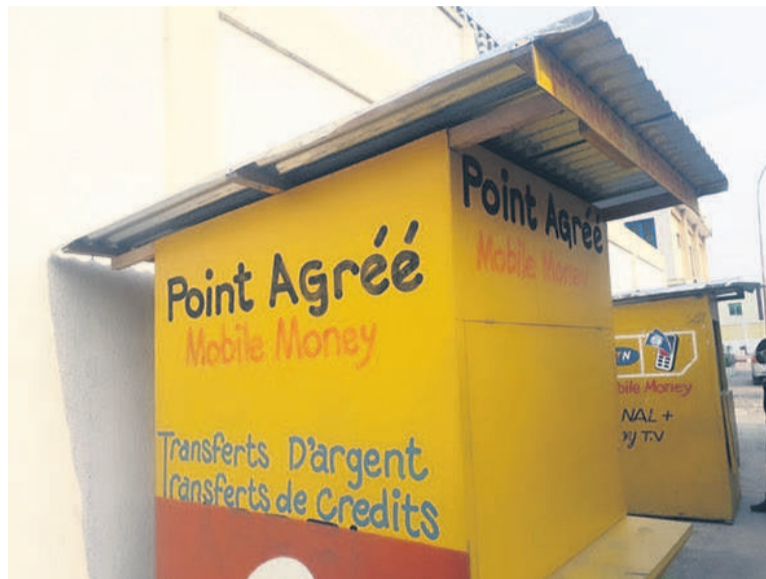
Une vue des points agréés de mobile money au centre-ville

« Depuis le début de ce mois de juin, le retrait est passé de 1% à 0,8% tandis que le dépôt de 0,5% à 0,4%. Donc pour un dépôt de 10.000FCFA, 40F nous reviennent et pour un retrait du même montant 80F nous reviennent », a expliqué un marchand de mobile money, tenancier d'un kiosque à Makélékélé, premier arrondissement de Brazzaville. Dès lors, des caprices ou refus systématiques de faire des dépôts ou retraits de faibles montants se font constater. Aux usagers voulant retirer 1000FCFA notamment, certains tenanciers de kiosque de mobile money refusent de leur servir