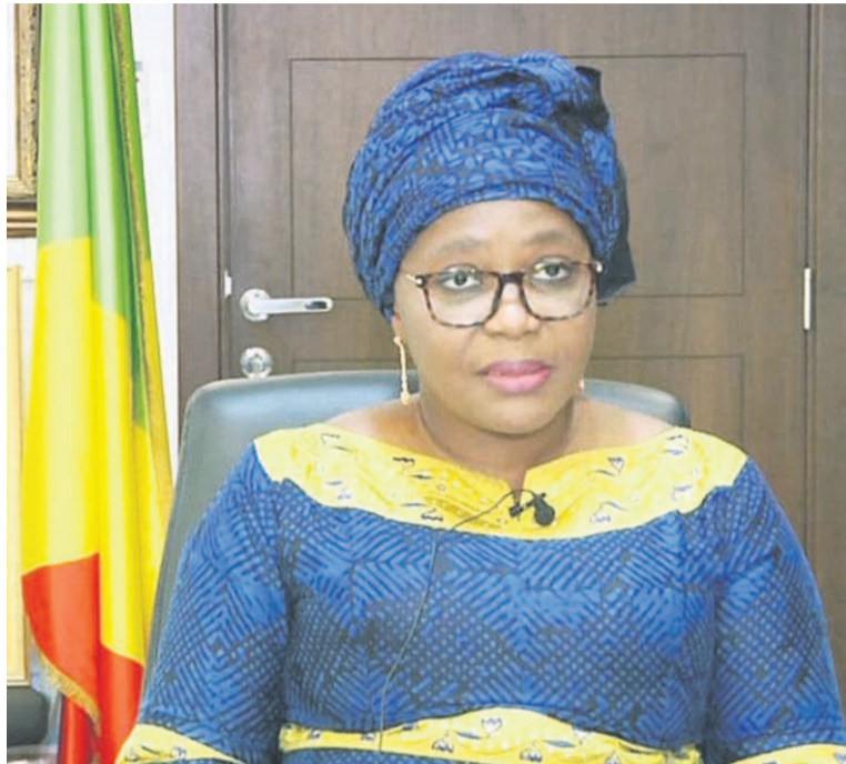
La ministre en charge de la Santé délivrant le message du gouvernement sur la Journée mondiale du don de sang

«...Pour améliorer la santé de nos compatriotes, le besoin de sang sécurisé est plus crucial »,