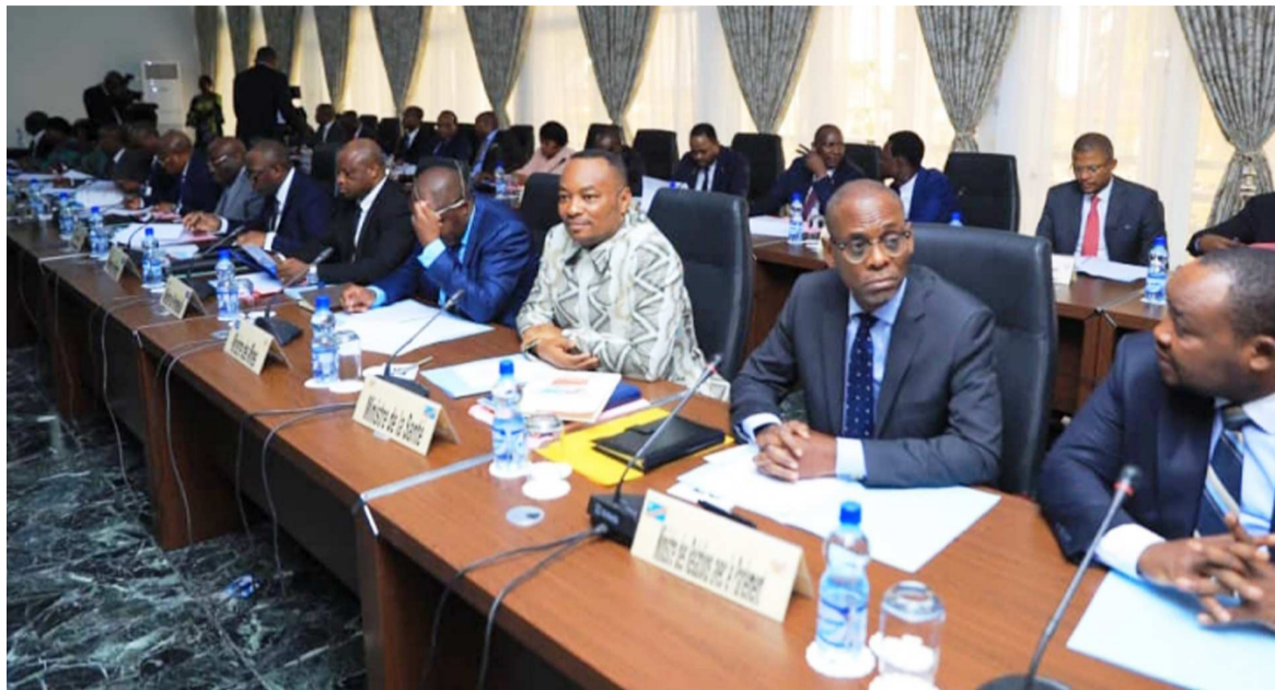
Les membres du Gouvernement lors du premier Conseil des ministres

Explicitant le sens de cette mesure étroitement liée aux circonstances particulières qu'impose la covid-19 sur la vie des institutions, le chef de l'Etat a instruit l'exécutif national d'affecter le budget y afférent à d'autres fins utiles. Il en découle que ledit budget sera réservé aux personnels soignants au front dans le cadre de la riposte à la covid-19 ainsi qu'aux forces armées en guise de prime pour leurs actes de bravoure et d'héroïsme. Des dispositions idoines devront être prises au niveau des ministères sectoriels en vue de s'assurer de l'exécution de cette mesure. Autre annonce ayant sous-tendu la communication du chef de l'Etat porte sur la mise en vente de la résidence de l'artiste-musicien Jules Shungu Wembadio, dit Papa Wemba, pour laquelle le gouvernement a été chargé, via le ministre de la Culture, d'examiner la possibilité de son rachat pour le compte de l'Etat pour en faire un musée où sera installé un studio d'enregistrement.