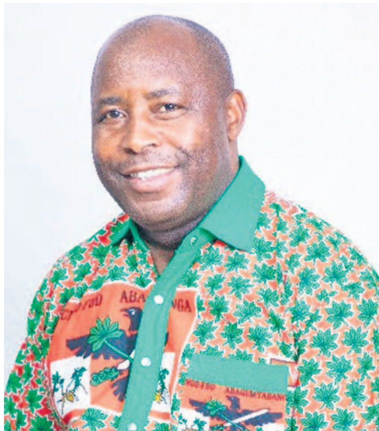
Le président élu, Évariste Ndayishimiye

La mort inopinée de Pierre Nkurunziza, au pouvoir depuis 15 ans, a ouvert une période d'incertitude pour son pays, dont l'histoire est marquée par des crises politiques meurtrières et une longue guerre ci-