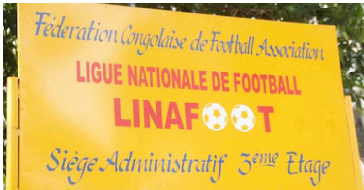
Pancarte indicatif du siège de la Linafoot

Par ailleurs, fait savoir l'instance sub-déléguée de la Fédération congolaise de football association (Fécofa), les clubs engagés sont contraints de remplir les formalités administratives dans l'intervalle du 1er au 31 juillet 2020. Avant ces dates, le calendrier d'activités prévoit deux réunions d'évaluation de la saison sportive 2019-2020. Il s'agit de la réunion du 4 juillet entre la Linafoot et les