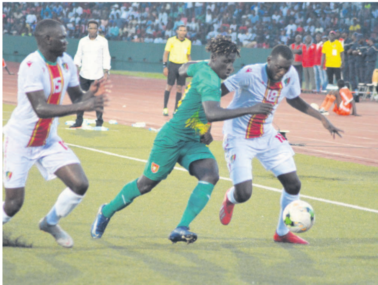
Les Diabes rouges lors de leur dernière rencontre des éliminatoires de la Coupe d'Afrique face à la Guinée-Bissau

Après le Sénégal, le top 10 africain est composé de la Tunisie (27 e ), du Nigeria (31 e ), de l'Algérie (35 e ), du Maroc (43 e ), du Ghana (46 e ), de l'Égypte (51 e ), du Cameroun (53 e ),