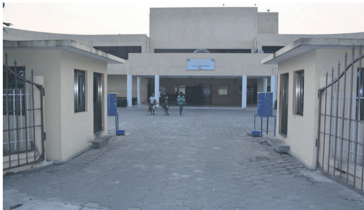
Façade principale du centre

« Depuis l'ouverture du Centre national de référence de la drépanocytose (CNRD), aucun décès n'a été enregistré. Tout cela grâce à la Fondation Congo Assistance qui nous fournit des dons de sang. La banque de sang