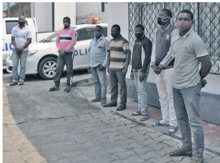
Des transporteurs arrêtés par la Police définies par les autorités compétentes.

Une dizaine de conducteurs des véhicules transportant les passagers de Brazzaville vers d'autres localités du pays ont été arrêtés par la police et présentés au public le 17 juin à Brazzaville. En annonçant le déconfinement progressif, le 16 mai dernier, le gouvernement avait subdivisé le pays en deux zones de circulation. Brazzaville et Pointe-Noire constituaient la première zone du fait de la forte prévalence de contamination à la Covid-19. Sur la base des données épidémiologiques et de l'appréciation des facteurs de risque de propagation de la pandémie, la circu-