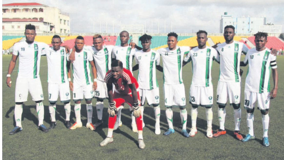
Les Léopards de Dolisie / Kwamy

journée. Comparée aux deux dernières saisons, celle-ci a été la plus faible en termes de matches gagnés par cette équipe qui a fait le bonheur du football congolais. Lors de la saison 2018-2019 en effet, le club avait remporté neuf