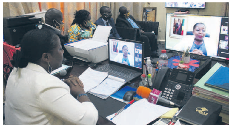
Une vue de la ministre de la jeunesse et de l'éducation civique en pleine séance