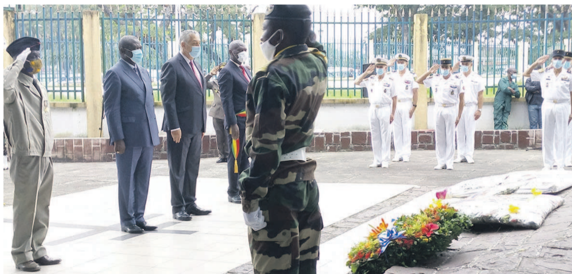
Le ministre de la Défense nationale entouré de l'ambassadeur de France, du représentant d'Allemagne et du maire de Brazzaville

A l'occasion du 80e anniversaire de l'appel du 18 juin 1940 marquant la résistance de la France aux nazis, l'ambassade de France au Congo en partenariat avec le ministère congolais de la Défense a organisé une cérémonie commémorative au cours de laquelle ont été rappelés les points forts du discours fondateur du général de Gaulle prononcé pour la circonstance. « Devenue le sanctuaire de la France Libre, l'Afrique équatoriale française fut la matrice de son effort de guerre et de la reconquête. Pleinement mobilisée, elle offrit à la cause