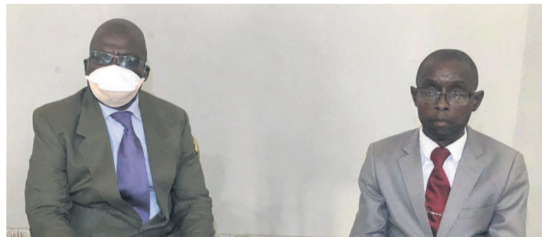
Le présidium lors de la conférence de presse

L'Association pour le développement de la réadaptation et du bien-être (Adrbe) a dressé, le 17 juin à Brazzaville, un bilan positif sur la prise en charge des enfants nés avec la maladie pied-bot qui est une malformation congénitale touchant ce membre inférieur.