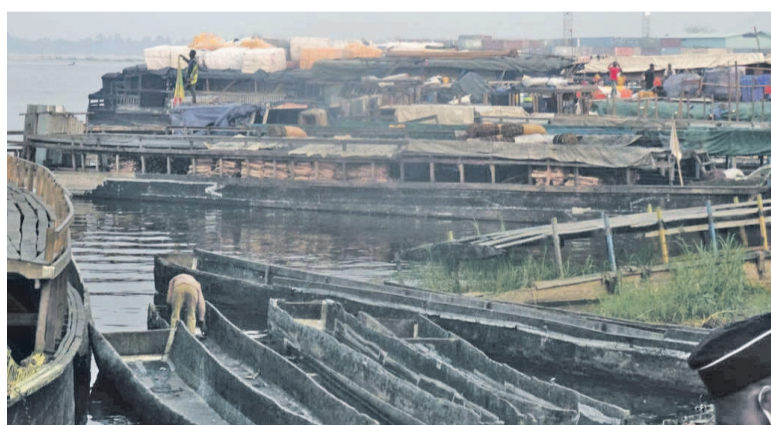
Des balinières stationnées au port de Yoro

L'absence régulière d'opérations de balisage et de dragage des eaux intérieures et transfrontalières rendent difficile, depuis quelques temps, la fluidité du trafic sur les 4300 km que représente le réseau fluvial national. Selon l'organe technique de l'Etat chargé de coordonner les navigations sur l'axe Oubangui-Sangha, Alima et Pool-Malebo, le manque d'appui à ce secteur risque d'entraîner l'arrêt du trafic sur ce réseau faute d'équipements nécessaires.