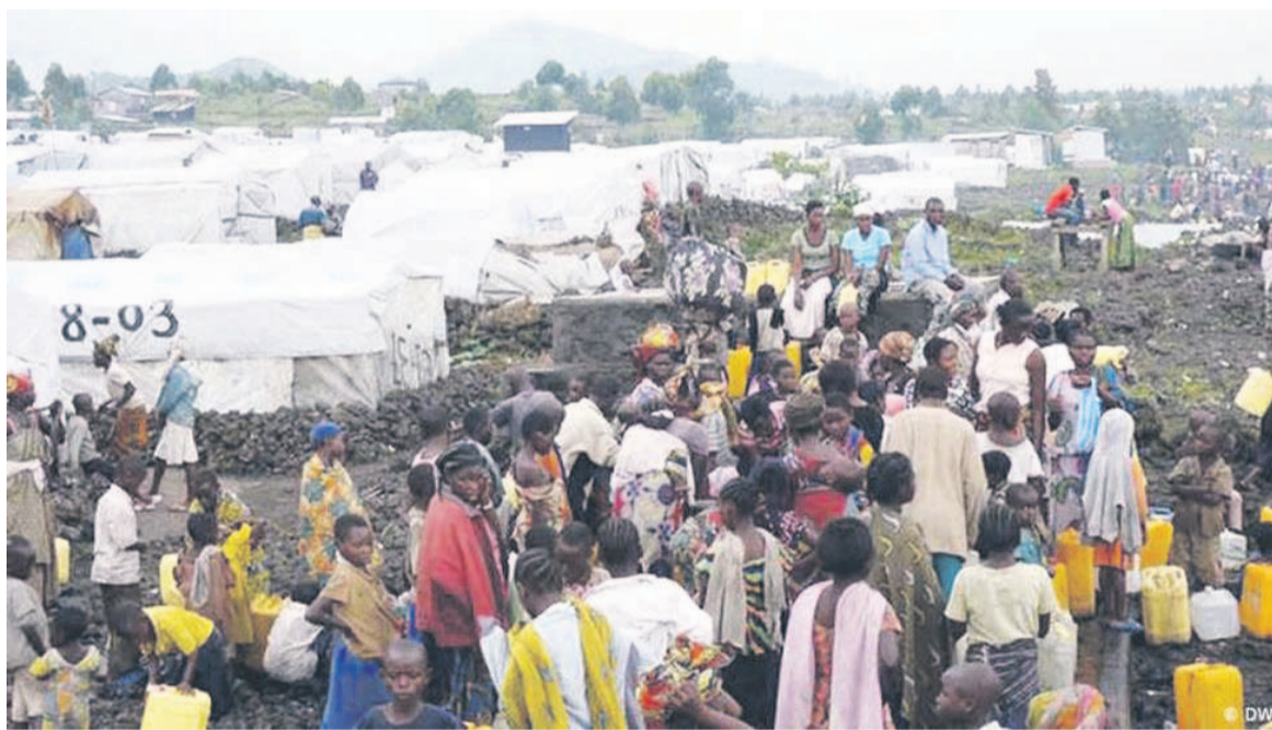
Un camp des réfugiés

Mais, au-delà de la pandémie sus évoquée, ce collectif d'ONG estime qu'il serait plus utile de réfléchir ensemble sur la problématique des réfugiés, les demandeurs d'asile et autres déplacés internes qui abondent sur le territoire national. Cette réflexion aura comme visée, selon ce regroupement, de proposer des pistes de solutions, en termes des résolutions, « dans l'objectif de parvenir à la réduction de ce phénomène qui prend, au fil des années, de l'ampleur à cause de l'instabilité politique et des conflits armés en Afrique, en général et en Afrique centrale, en particulier ».