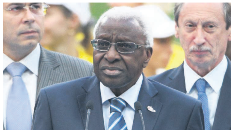
L'ancien président de l'IAAF, Lamine Diack

Pour corruption sur le fond de dopage russe, l'ancien président de la Fédération mondiale d'athlétisme a payé le prix. Le parquet national financier a requis le 17 juin, quatre ans de prison et 500 000 euros d'amende plus une interdiction d'exercer des responsabilités dans le sport à son encontre.