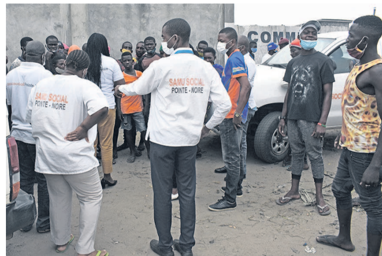
Lieu de la scène de l'accident

Près de cent enfants vivant dans la rue à Pointe-Noire ont bénéficié d'une aide du Samu social, le 16 juin, dans le cadre de la célébration de la journée de l'enfant africain. Peu avant leur maraude dans les différents points de la ville où sont souvent visibles ces enfants, l'équipe du Samu social a aidé un enfant sourd-muet vivant dans la rue qui s'est fait écraser le bras par un train.