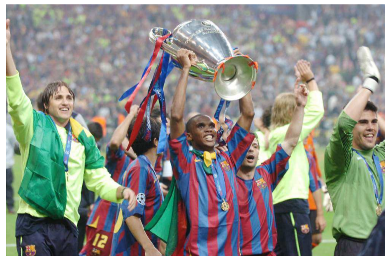
Samuel Eto'o, l'africain le plus titré en ligue européenne des champions

De tous les internationaux africains, le Camerounais Samuel Eto'o est le plus titré de la ligue européenne des champions. Il a remporté trois Ligues des champions avec deux clubs différents et marqué à deux reprises lors des trois finales qu'il a disputées. L'Egyptien Mohamed Sa-