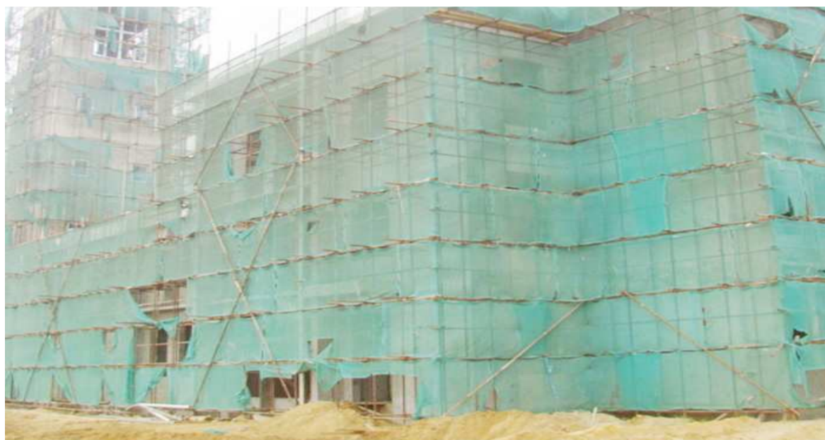
Le chantier du nouveau siège du parlement à Brazzaville

Les mesures drastiques édictées par le gouvernement pour stopper la propagation du coronavirus, entre avril et mai, ont entraîné l'arrêt de nombreux chantiers à Brazzaville et Pointe-Noire impactant de ce fait l'activité des entre-