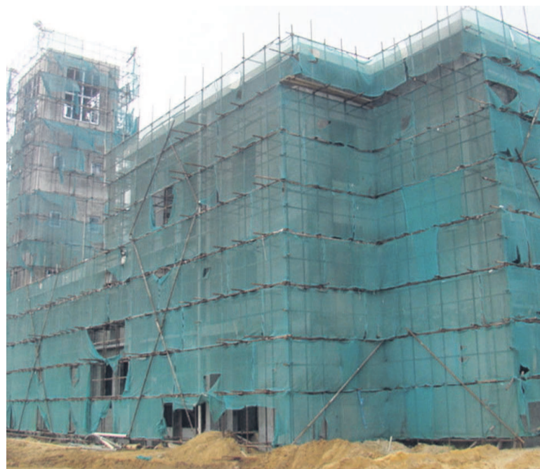
Le chantier du nouveau siège du Parlement à Brazzaville

Il a indiqué qu'une partie du Fonds national de solidarité de 100 milliards francs CFA sera débloquée à cette fin. Les