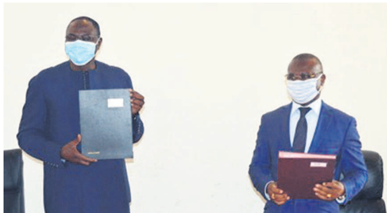
Signature de l'accord entre le PNUD et la CNDH/Adiac

La Commission nationale des droits de l'homme (CNDH) et le Programme des Nations unies pour le développement (PNUD) ont signé, le 19 juin à Brazzaville, la lettre d'accord sur la promotion et la protection des droits de l'homme.