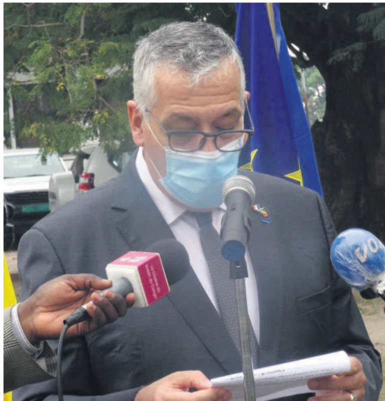
L'ambassadeur François Barateau

La délégation de l'Union européenne au Congo, à travers le projet WeCAPS, a fait le 19 juin un don de divers matériels de protection contre le coronavirus (Covid-19) au port autonome de Brazzaville, d'une valeur de vingt-cinq millions francs CFA. Prenant la parole à cet effet, l'ambassadeur de France au Congo, François Barateau, a insisté sur la nécessité de protéger les acteurs portuaires contre le coronavirus. Voici l'intégralité de son discours.