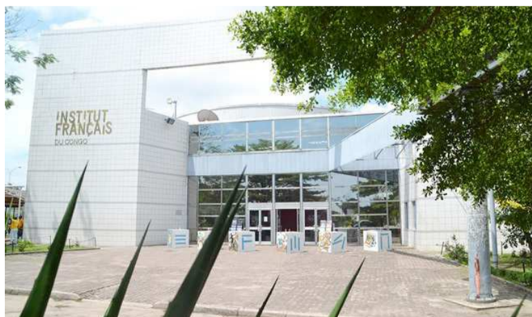
La façade de l'Institut français du Congo de Brazzaville

La mesure de déconfinement progressif et par palier prise par le gouvernement épargne les espaces culturels qui restent encore fermés, privant ainsi les artistes et amoureux du spectacle de la joie que procurent les salles de cinéma et autres lieux d'exposition.