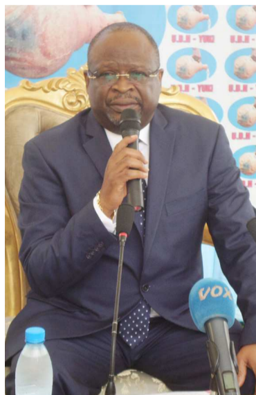
Guy Brice Parfait Kolélas

Parmi les candidats déjà en lice, il y a le président national de l'Union des démocrates humanistes-Yuki (UDH-Yuki), Guy Brice Parfait Kolélas. Ar-