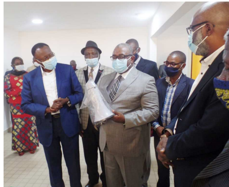
Remise d'un mégaphone par le secrétaire permanent CCSC ONG

La remise de ce lot de matériel indispensable à la sensibilisation a eu lieu le 30 juin au siège du conseil.