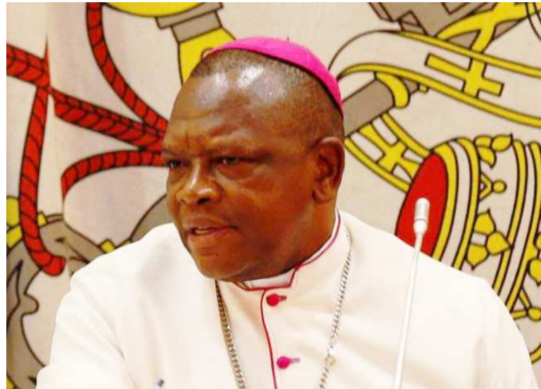
Mgr Fridolin Ambongo

Au plan politique, l'ancien évêque de Mbandaka-Bikoro, dans le Grand Équateur, a mis l'accent sur l'actuelle guéguerre entre les partenaires de la coalition au pouvoir autour des propositions de loi visant la réforme de la justice. Cette controverse est, d'après lui, symptomatique de la fin de la coalition FCC-Cach qui a montré ses limites. Il plaide pour sa disparition pure et simple. « Il n'y a de coalition au pouvoir que de nom. De part et d'autre, c'est le désamour; le cœur n'est plus à l'ouvrage. Au lieu de travailler ensemble autour d'un programme commun de gouvernement, les coalisés ne se font plus confiance. Ils ont développé un rapport dangereux de rivalité qui risque d'entraîner tout le pays dans le chaos dé-