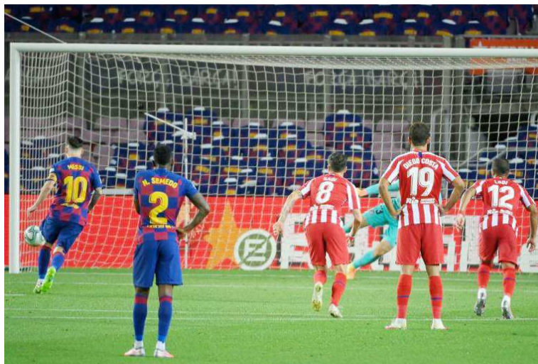
Lionel Messi marque sur penalty et franchit la barre de 700 buts

Tous avaient des yeux braqués sur Lionel Messi. Le meilleur joueur du monde a offert à ses fans un joli cadeau d'autant plus qu'il a transformé la faute en but par un beau geste technique : la panenka pour ainsi rejoindre le cercle fermé des joueurs