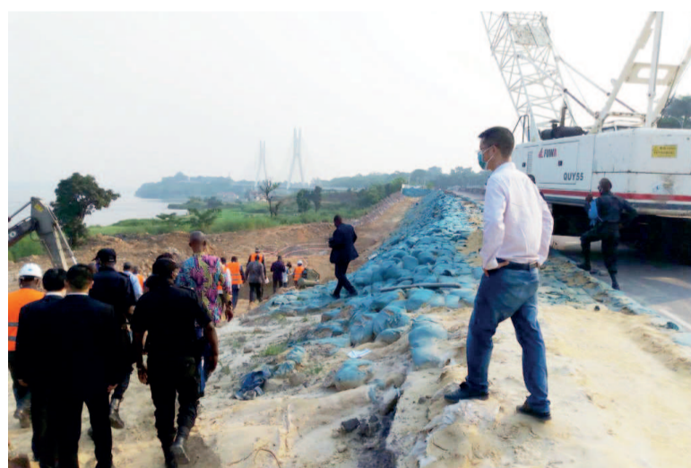
Visite du chantier de la corniche