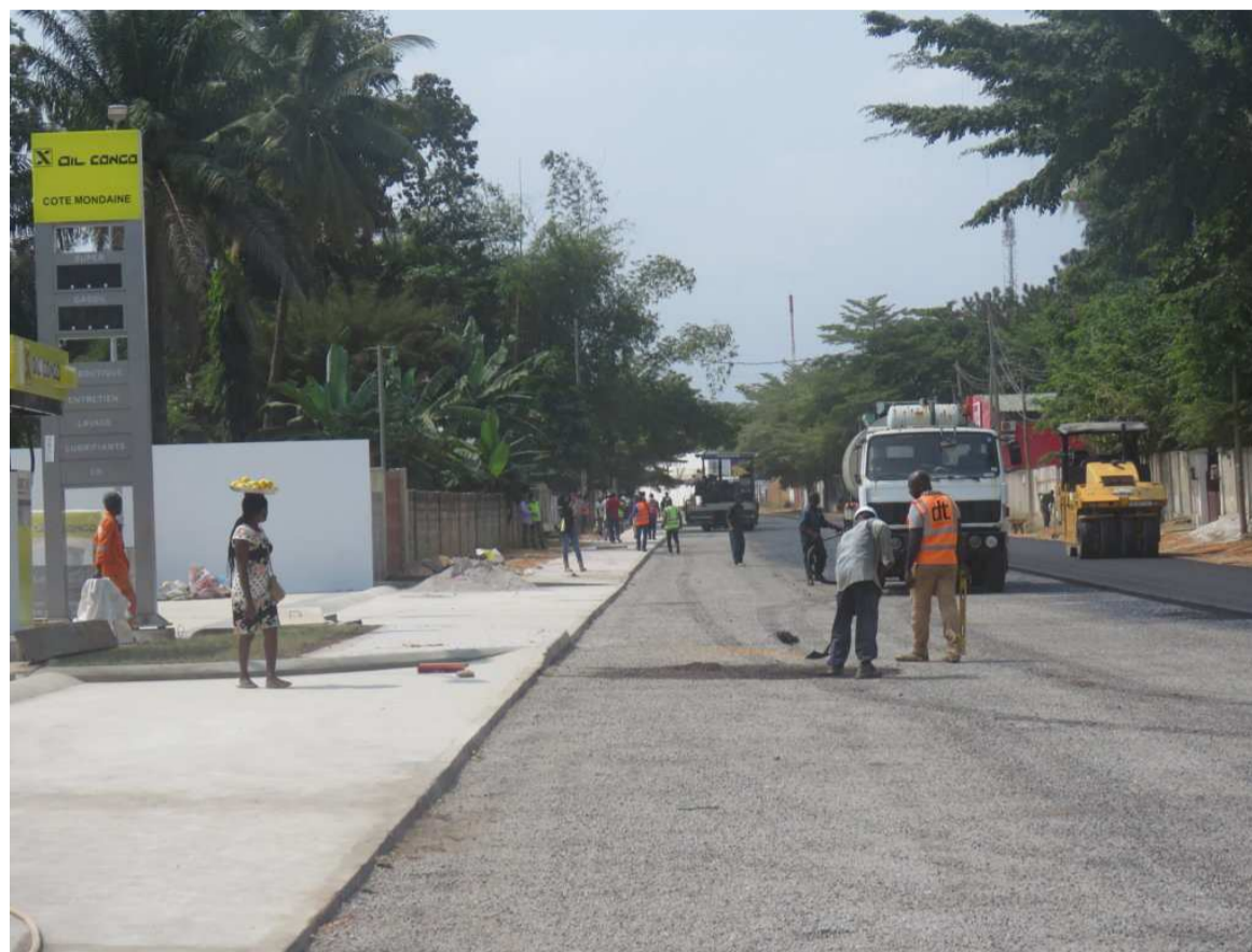
Le tronçon routier réhabilité

La même situation est observée sur l'avenue qui va de l'entrée du portail de la CNSS du centre-ville vers la direction départementale des Impôts de Pointe-Noire. A