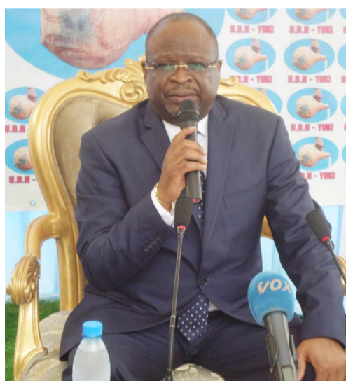
Guy-Brice Parfait Kolélas