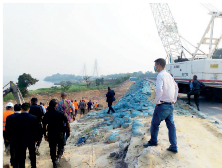
Visite du chantier de la corniche