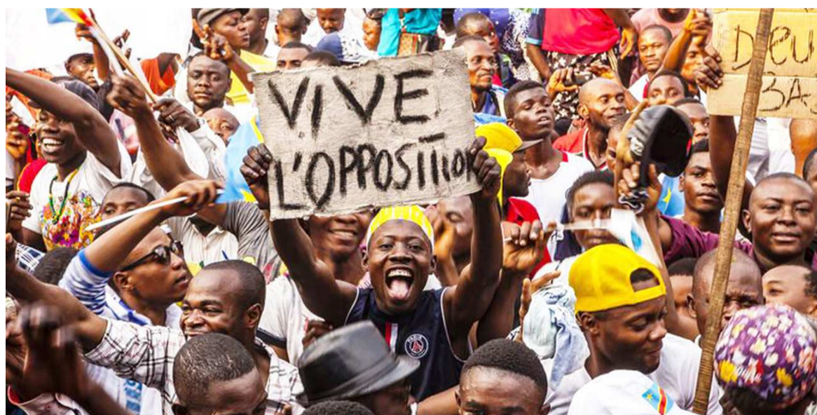
Une manifestation de l'opposition à Kinshasa

Dans une note du 7 juillet 2020 adressée aux exécutifs provinciaux, le ministre national chargé des Droits humains leur exige de rapporter sans délai leurs « mesures attentatoires des libertés individuelles et collectives ». Le ministre André Lite qui dit avoir été instruit par le chef de l'Etat, brandit des poursuites judiciaires comme sanctions pour les ré-