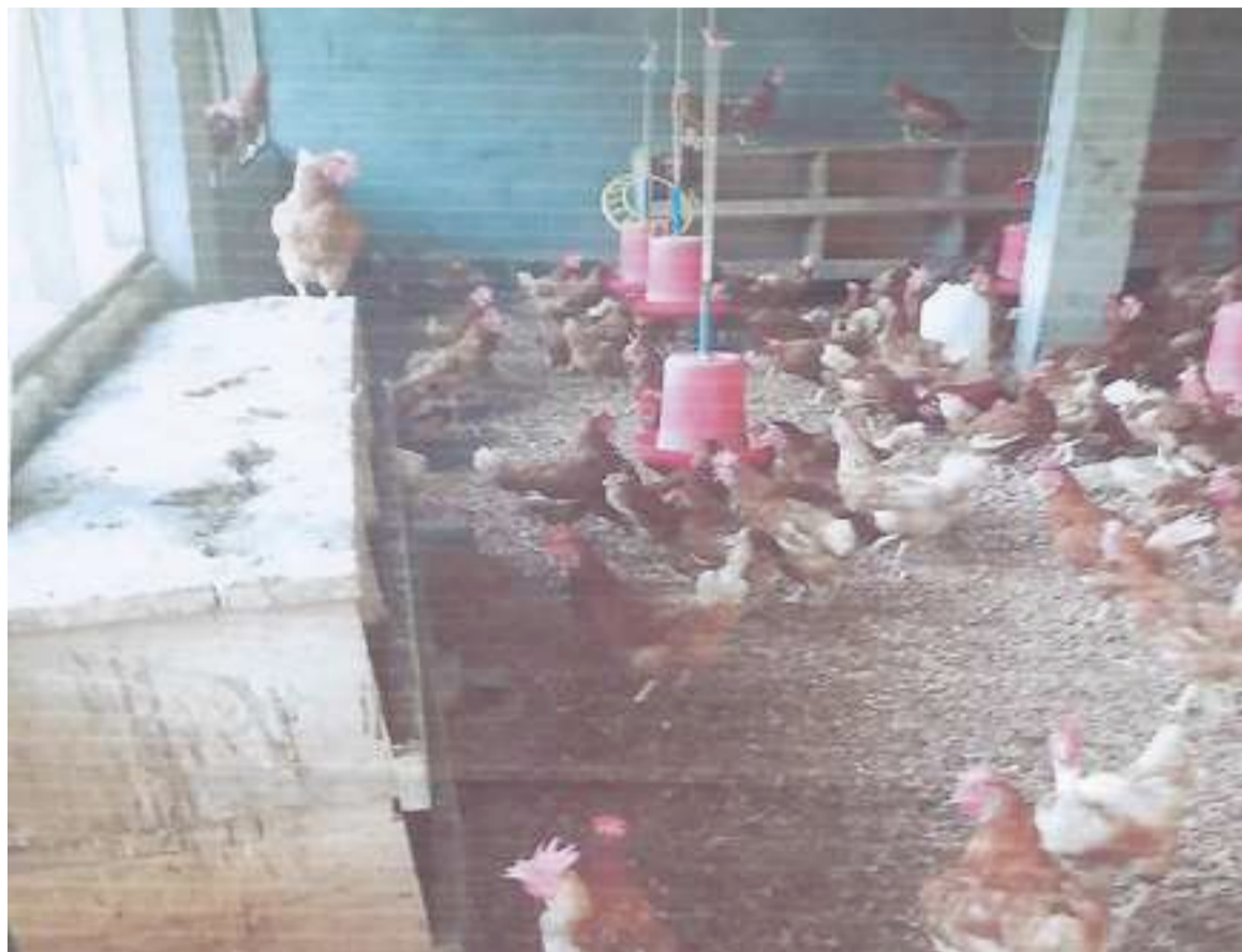
Un élevage de poulets dans une unité des FAC

Dans la Cuvette-Ouest, par exemple, en zone militaire de défense n°7 sous la conduite du colonel Komiena, de petites exploitations agricoles d'élevage de poulet de chair ou de pondeuses ont vu le jour