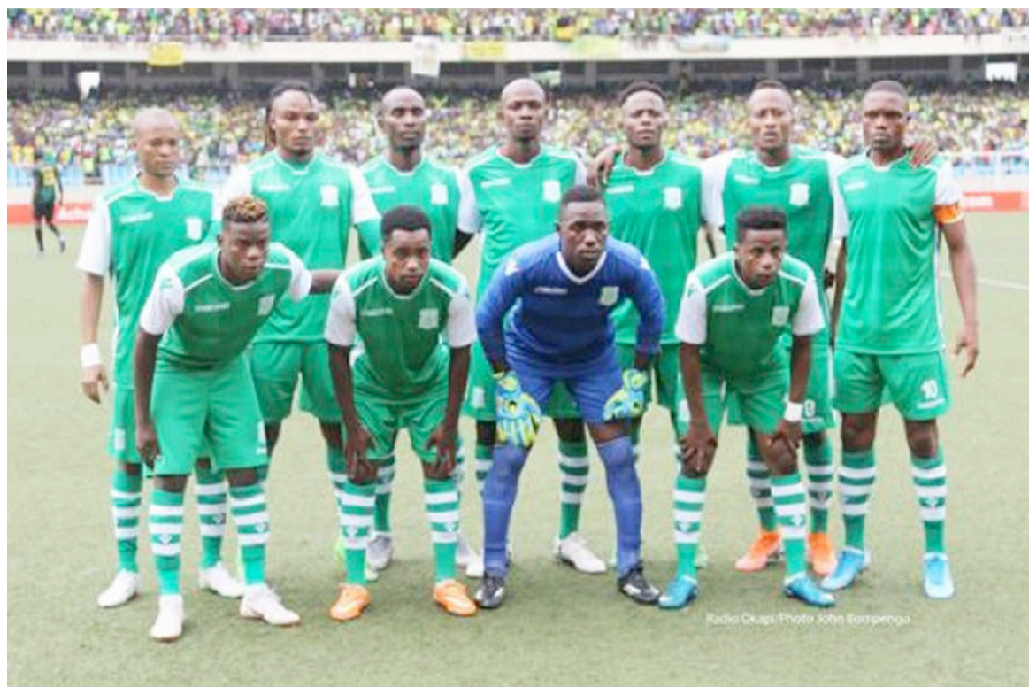
DCMP de Kinshasa

Et de faire voir : « Vous ne pouvez pas, en huit mois avec 4 millions de dollars, avoir un problème de salaires des athlètes de cinq mois... Les rémunérations sont les premiers besoins, les premières contraintes du club », en notant que l'enveloppe salariale du DCMP