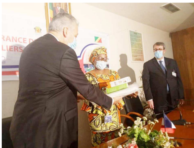
L'ambassadeur de France au Congo recevant le don des mains de la ministre

le personnel soignant (masques FFP2, combinaisons de protection, surblouses, surchaussures, etc.) et des consommables médicaux de première nécessité (thermo flashes, stéthoscopes, tensiomètres, glucomètres).