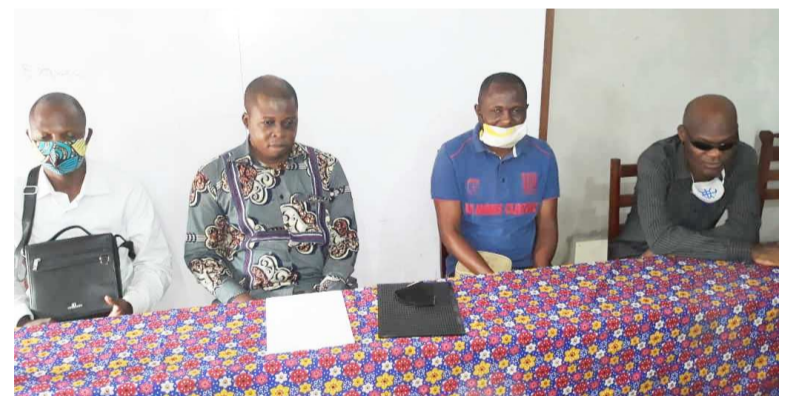
Les responsables des associations lors de l'annonce de la fédération

Les organisations œuvrant dans le domaine du handicap visuel au Congo se sont constituées en Fédération des aveugles du Congo (FAC) afin de faciliter l'insertion de cette catégorie de personnes vulnérables vivant au pays comme à l'étranger.