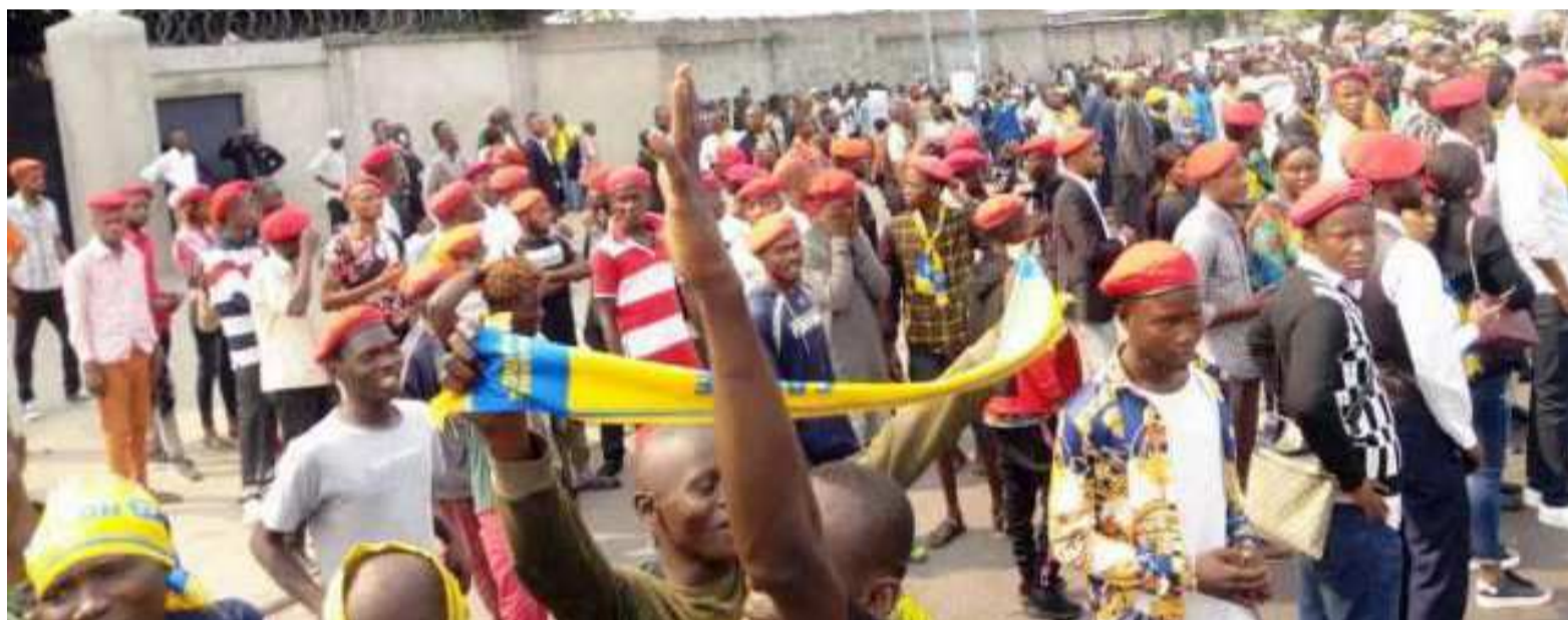
Les militants du PPRD lors d'une manifestation devant le Palais du peuple

Le gouverneur Gentiny Ngobila Mbaka n'a pas donné son avis favorable pour les deux manifestations d'expression populaire prévues dans la capitale entre le 9 et le 10 juillet pour bloquer le choix de Ronsard Malonda à la tête de la centrale électorale et pour exiger la stabilité des institutions de la République.