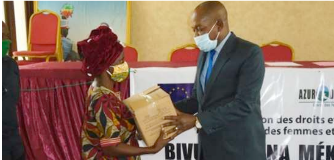
Le secrétaire général de la mairie de Tié-Tié remettant un kit d'installation à une bénéficiaire.

Depuis 2017, Azur développement a mené des activités de sensibilisation, de formation et de promotion des services