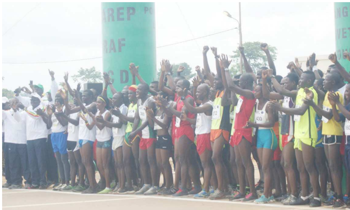
Les athlètes attendant le coup d'envoi de la course Adiac

Selon les dernières informations, le programme d'organiser la compétition qui rassemble chaque année plusieurs centaines d'athlètes