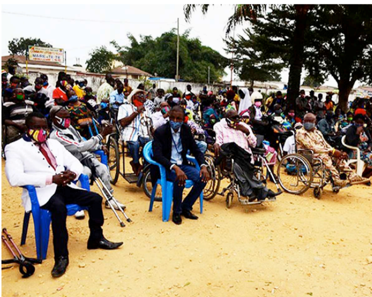
Des personnes vivant avec handicap