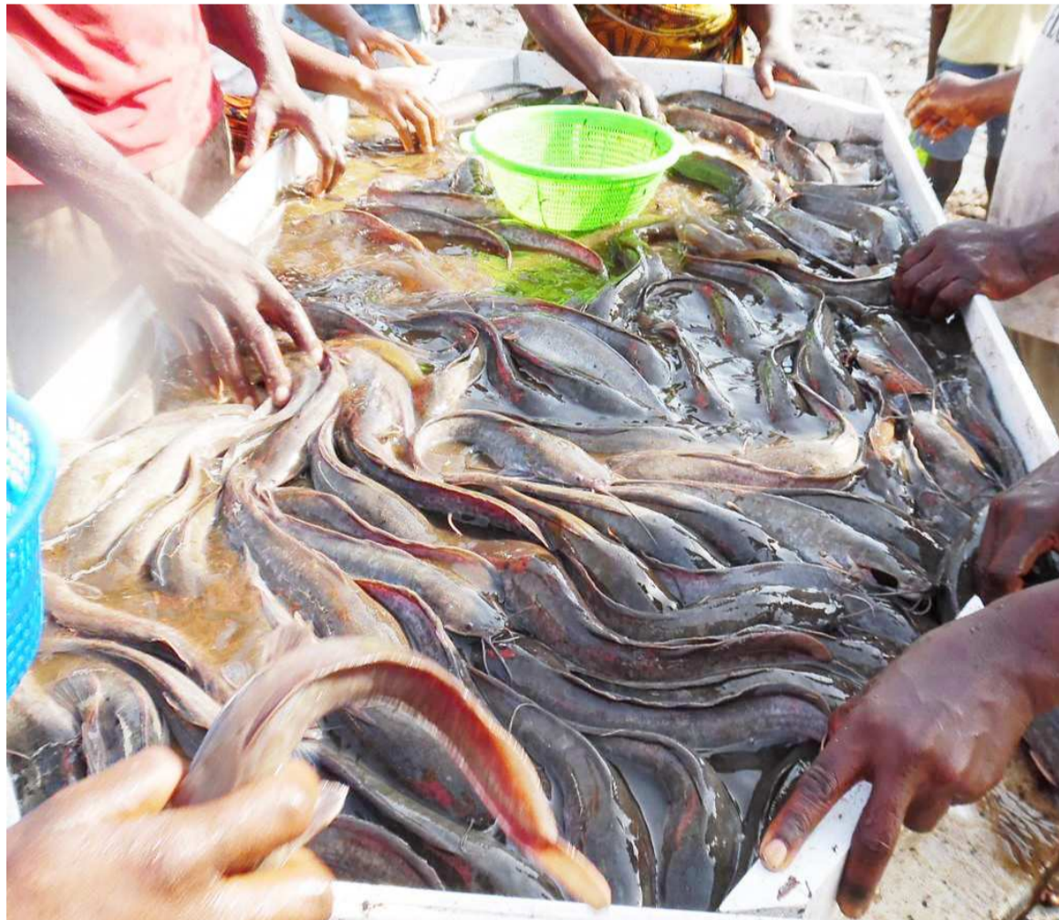
Du poisson d'eau douce

Ces résultats suscitent de l'engouement des habitants qui expriment de plus en plus l'intérêt d'être enrôlés parmi les nouveaux bénéficiaires du projet. C'est justement l'objectif du projet