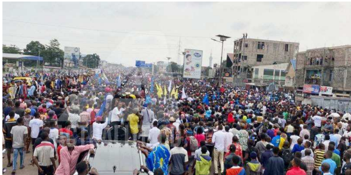
Une foule immense pendant la marche de ce 13 juillet à Kinshasa

ment, provoquant plusieurs ralliements à une cause désormais partagée. Il en a profité pour haranguer la foule et improviser une procession qui s'est révélée comme un baromètre pour évaluer son niveau de popularité. Dans d'autres coins de la capitale où les manifestants devraient se rassembler, d'autres cadres de Lamuka étaient là pour assurer leur encadrement. Jean Pierre Bemba, qui entendait porter haut les revendications de son peuple, a été obligé d'entrer dans sa jeep au niveau du Pont Matete à la suite des gaz lacrymogène lancés par la police pour disperser la foule immense et hystérique. Une incompréhension entre les policiers et les manifestants, qui tenaient à passer par Limete où se trouve le siège de l'UDPS, a donné lieu à des échauf-