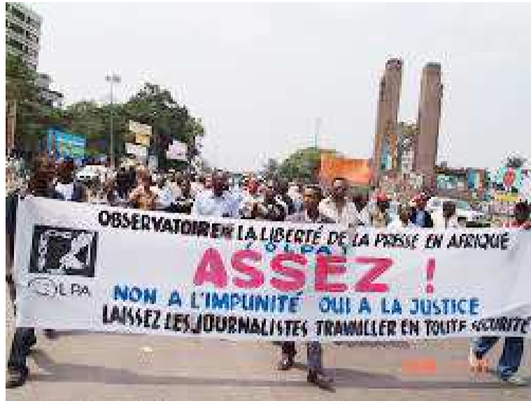
Une marche organisée par l'Olpa congolaise de presse /Mbandaka, n'a pas été aussi épargnée par cette brutalité policière», a souligné cette organisation.