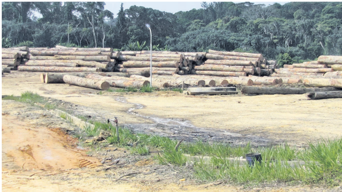
Le bois exploité par la société Dejia Wood Industry