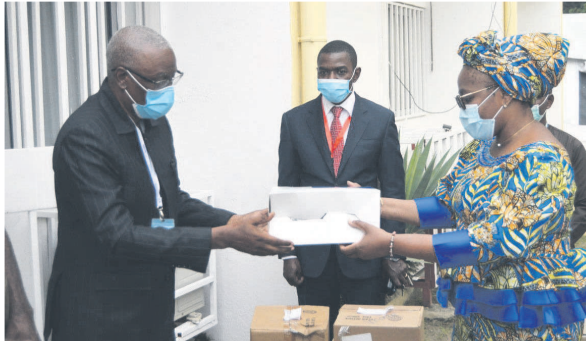
Remise symbolique d'équipements après la signature du protocole

« Face à la Covid-19, la mutualisation des efforts entre les secteurs public et privé de la santé permet d'élargir l'offre de soins en qualité et en qualité »