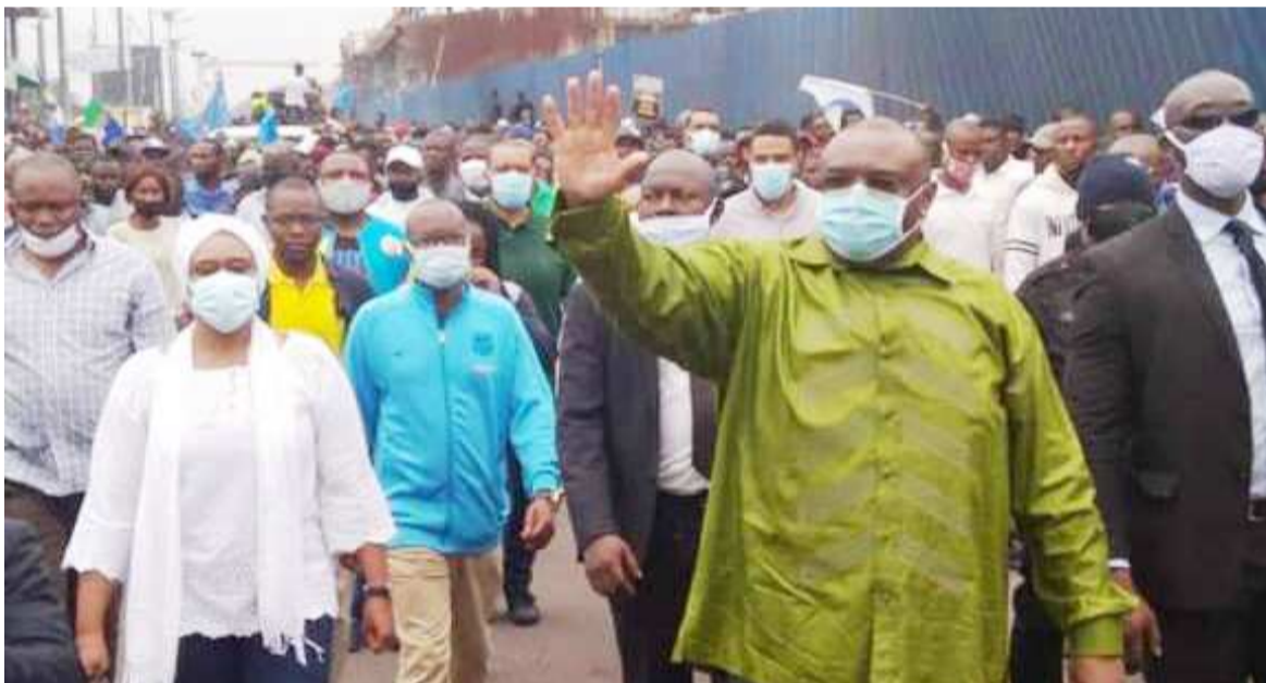
Jean Pierre Bemba, en avant-plan, pendant la marche

À la suite des militants de l'Union pour la démocratie et le progrès social et leurs alliés qui ont manifesté dernièrement pour protester contre l'entérinement de Ronsard Malonda à la tête de la Céni, mais aussi contre les propo-