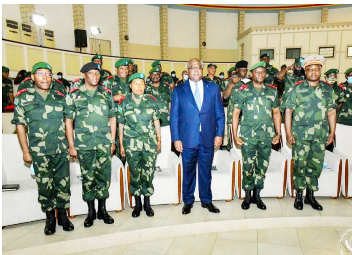
Félix Tshisekedi avec le haut commandement de l'armée

Au cours de la réunion stratégique du 11 juillet, le haut commandement militaire a réitéré sa loyauté envers le chef de l'Etat en tant qu'autorité suprême ainsi que son indéfectible attachement à sa personne pour accomplir sa vision de faire des Fardc une armée réellement nationale, professionnelle et moderne. Dans leur acte d'engagement, les hauts gradés de l'armée ont assuré le chef de l'Etat d'être totalement dévoués au service du peuple congolais et à la cause de la République démocratique du Congo pour laquelle ils se sont engagés à ne jamais trahir parce qu'étant le ciment de l'unité nationale.