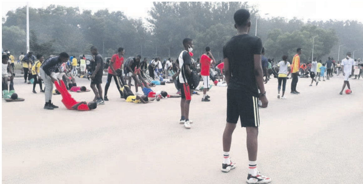
Des sportifs rassemblés devant le stade Alphonse-Massamba-Débat