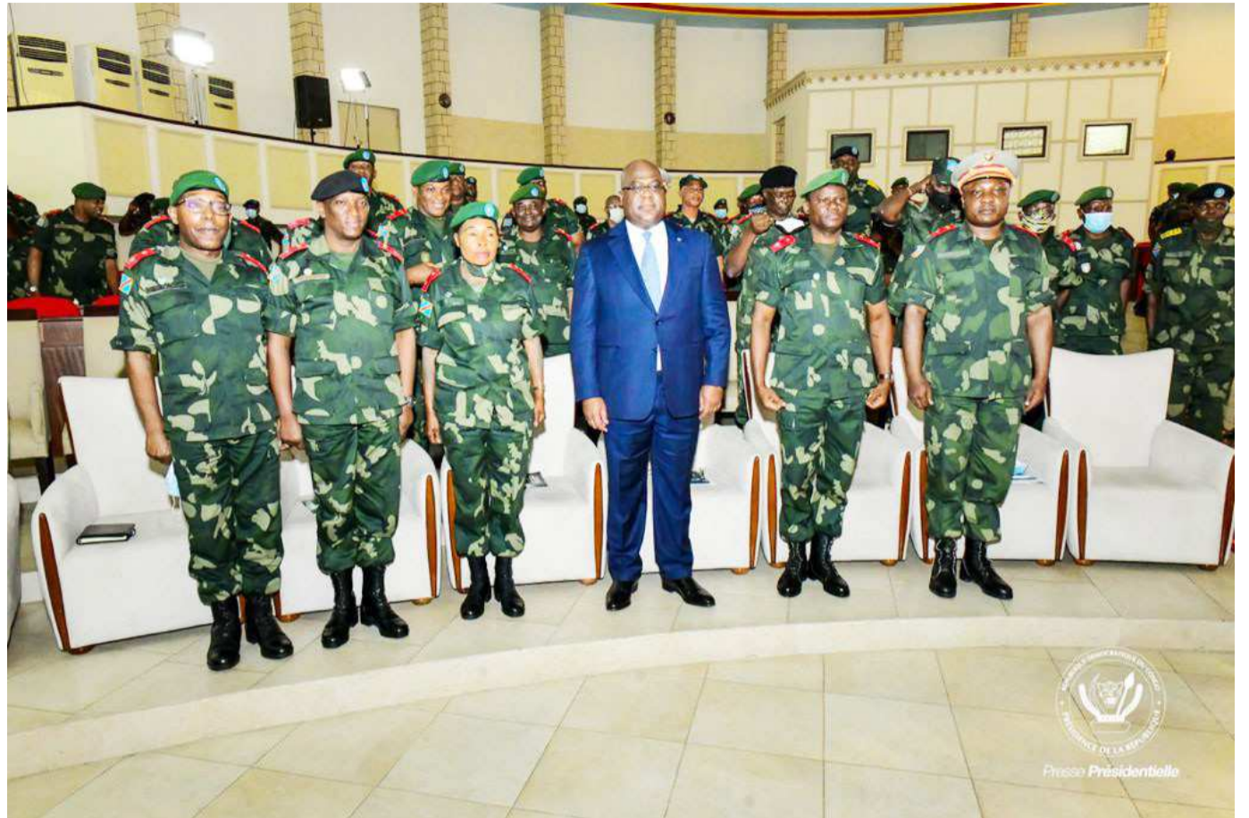
Félix Tshisekedi avec le haut commandement de l'armée