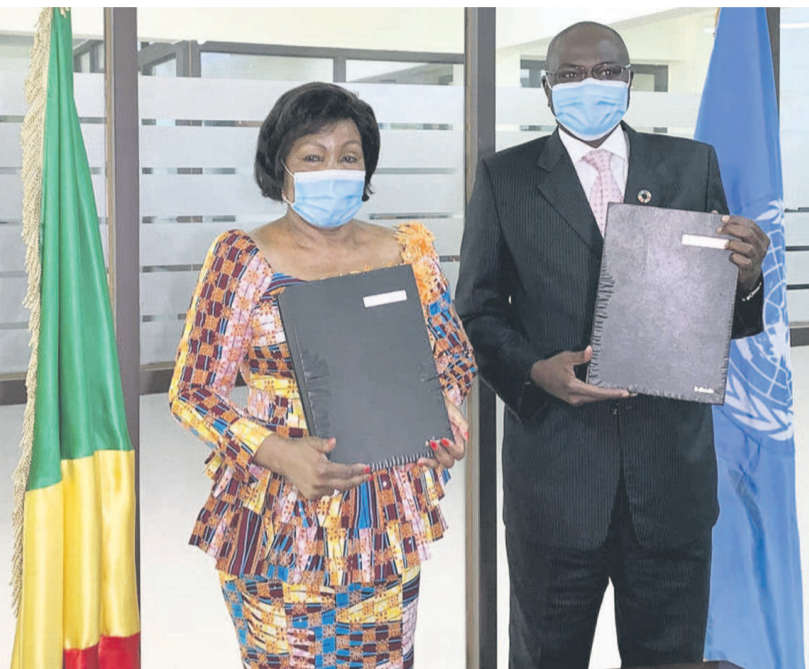
Les deux parties après la signature de l'accord

Ces micro-subventions visent, en effet, à renforcer les capacités des petits acteurs du secteur informel plus particulièrement ceux évoluant dans les secteurs d'activités économiques déclarées non essentielles ayant été à l'arrêt pendant la période du confinement. L'identification des acteurs s'est faite en étroite