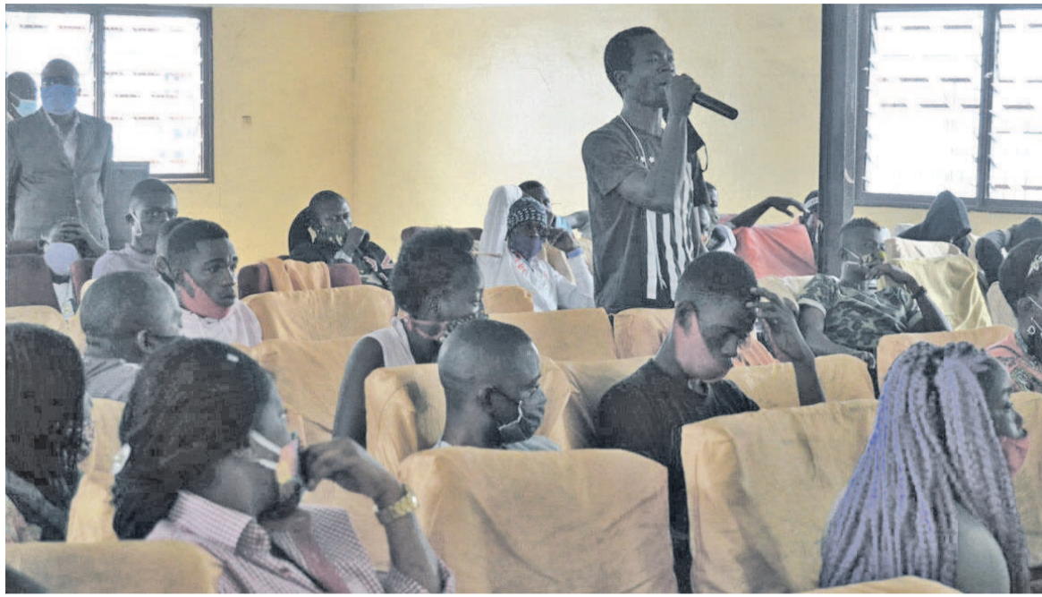
Un bébé noir faisant part des doléances