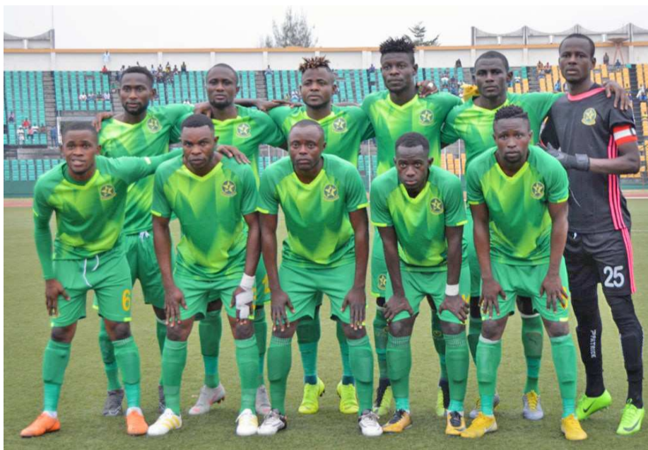
L'Etoile du Congo, le club le plus titré du championnat

Le point gagné contre les Aiglons n'a servi que pour payer le point qui leur a été retranché par anticipation. C'est au cours de la 4e journée que les vert et jaune ont lancé leur compétition. L'Etoile du Congo obtient