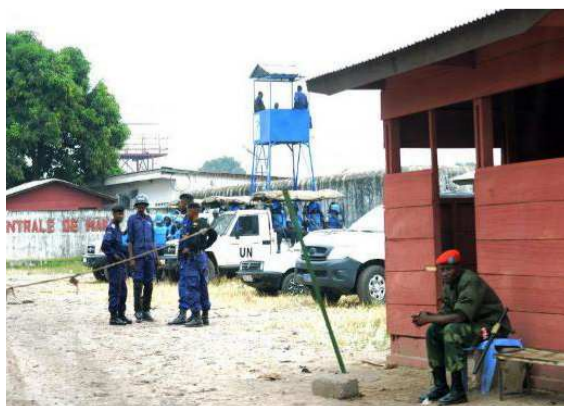
L'ex-prison centrale de Makala