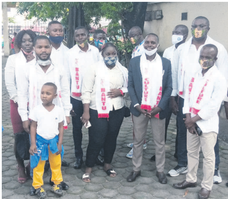
Les membres de Bantu culture

Créée le 8 décembre 2019 dans le souci d'accompagner l'État congolais dans le domaine culturel, l'association Bantu culture est un cadre institutionnel qui a pour base la création et l'expression artistique, la lutte pour la récupération des jeunes en vue de leur intégration sociale. Elle vise à promouvoir les potentialités de la culture bantoue au niveau national et international ; faire un pont entre la culture ancestrale et la culture contemporaine ; aider les artistes à se faire connaître et à vivre à travers leur art ; participer au développement personnel des jeunes talents ; organiser des activités de réflexion et éducatives entre les couches juvéniles ; conserver et promouvoir le patrimoine matériel et immatériel des peuples bantous ; promou-