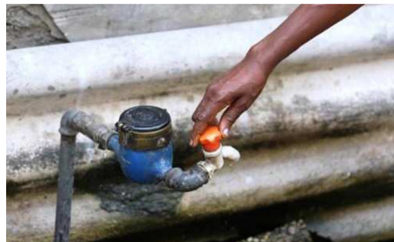
La pénurie d'eau potable, une triste réalité à Kinshasa

L'Association africaine de défense des droits de l'Homme (Asadho) reproche à ces deux sociétés la majoration exagérée des prix de fourniture d'eau et d'électricité à la fin de la période de deux mois de desserte gratuite offerte par le gouvernement en rapport avec la riposte à la pandémie de coronavirus. Il est reproché aux deux entreprises publiques « d'abuser