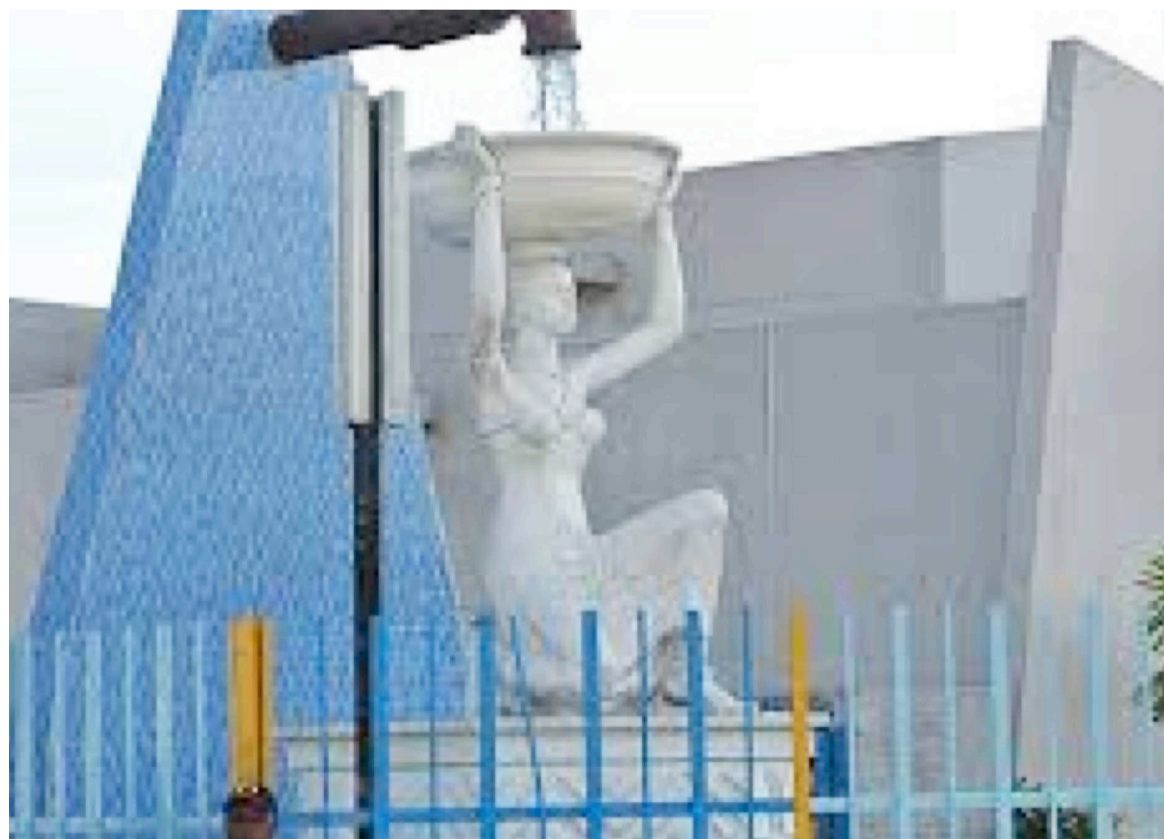
Le monument symbole de la Régideso.