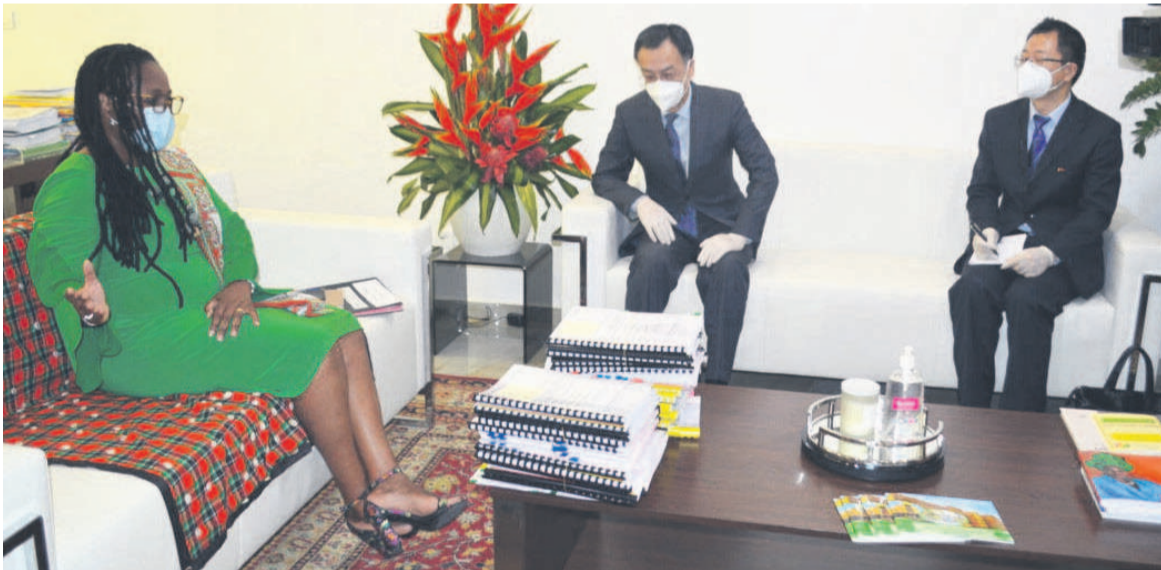
La ministre en charge de la Santé avec l'ambassadeur de Chine au Congo

Le processus de jumelage débutera à partir du mois d'août entre l'hôpital d'amitié sino-congolaise de Mfilou et celui de Beijing, en Chine, dans le contexte de lutte contre la Covid-19.