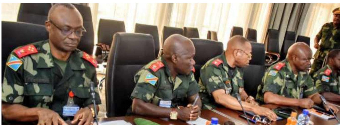
Quelques hauts officiers de l'armée lors d'une séance de travail.