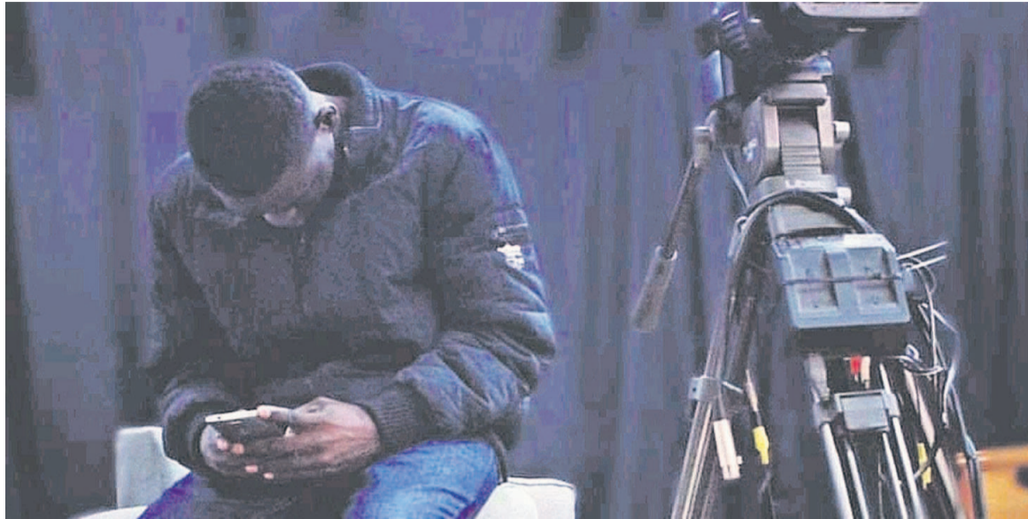
Un jeune réalisateur occupé par le téléphone, en attente de reprendre son poste derrière la caméra DR

Toutes les activités ont été interrompues : séances de tournage, projection, master-class, conférence-débat, festival. Evidemment, les dommages de cet arrêt sont estimés à plusieurs centaines de millions de FCFA et le manque à gagner est d'autant plus ahurissant que la fréquentation des salles et la production cinématographique au Congo avaient connu une hausse l'année dernière, à en croire les acteurs de ce secteur.