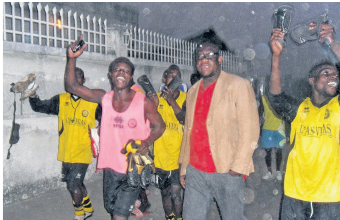
Les joueurs de l'AS Vegas et son président en joie après la victoire