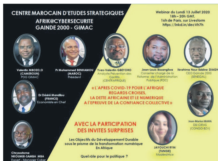
Affiche du Webinar : «L'après Covid-19 pour l'Afrique regards croisés, la dette africaine et le numérique à l'épreuve de la confiance collective»

Selon une note interne du Quai d'Orsay, les « économie de survies » pourraient être un facteur de déstabilisation économique, puis de déstabilisation sociale, de l'Afrique de