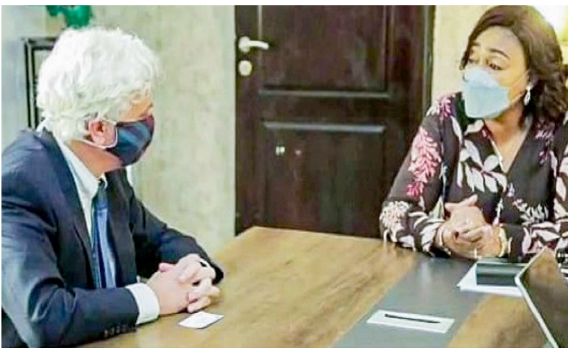
La première dame a reçu en audience le représentant de l'Unicef

Les deux personnalités se sont engagées à apporter leur soutien aux enfants congolais des familles défavorisées, afin de leur permettre d'aller à l'école dès la rentrée des classes en septembre prochain. Aussi voudraient-elles que les perturbations liées à la crise sanitaire de la covid-19 dont plusieurs familles subissent les effets néfastes ne