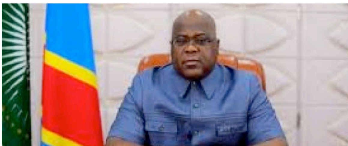
Le chef de l'Etat, Félix Tshisekedi