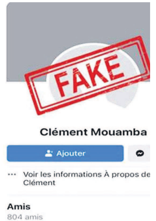
Le compte piraté du porte-parole du gouvernement

et la protection des données à caractère personnel. Un fondement juridique qui vise à renforcer la lutte contre les crimes commis sur Internet. « Au niveau du pays, nous avons déjà une législation qui permet d'assurer la protection du cyber espace », a rappelé le ministre des Postes, des Télécommunications et de l'Economie numérique, Léon Juste Ibombo, en soulignant que le texte adopté renforcera la coopération entre les Etats