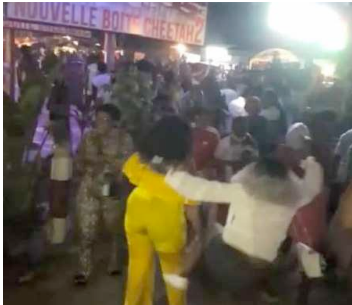
La liesse populaire à Kinshasa après la levée d'état d'urgence

Au total, cent quatre-vingt-dix-sept décès ont été rapportés et quatre mille sept cent quatre-vingt-dix personnes guéries sont sorties des centres de traitement. Il y a lieu d'indiquer que la levée d'état d'urgence ne signifie pas la fin de la pandémie. La liesse observée dans la population kinoise ne doit pas céder la place à la non-observance des gestes barrières au risque d'augmenter la propagation de la Covid-19. Il faut que la population soit sensibilisée au respect strict des mesures de protection telles que le port du masque, la distanciation physique, le lavage des mains.