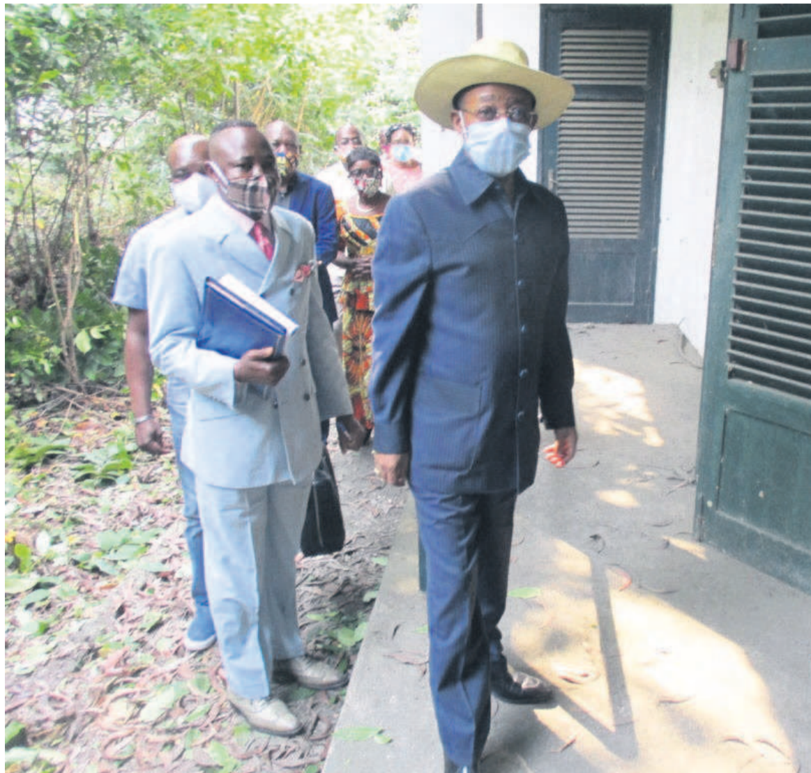
Le ministre de la Recherche scientifique lors de sa descente de travail à Pointe-Noire

scientifique a, par ailleurs, visité les locaux dans la Villa Dello Jean qui abriteront le laboratoire de biologie moléculaire de l'Institut de recherche en science de la santé, y compris ceux qui ser-