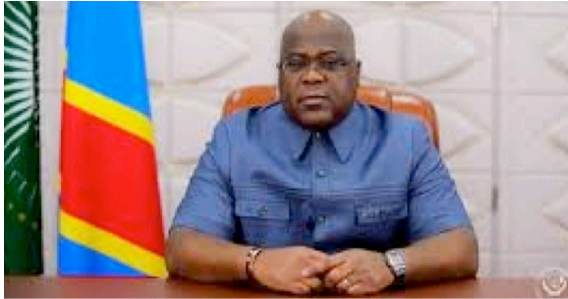
Le président Félix Antoine Tshisekedi.

Pour le président de la République, la fin de l'état d'urgence ne veut pas dire la fin de l'épidémie de covid-19 en RDC. Ce qui l'a amené