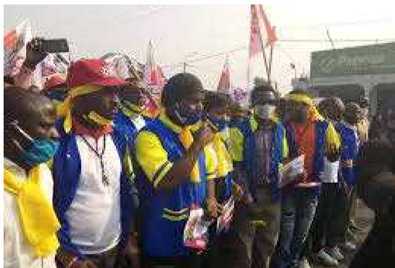
Les partisans de Vital Kamerhe lors de la précédente marche de soutien à leur leader

L'activité, dans le cadre du soutien à leur leader et de l'exigence de sa libération, initialement prévue pour le 21 août, est repoussée au 24 août.