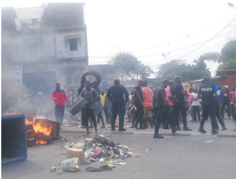
Les éléments de la police tentant de contenir les manifestants

Des jeunes du quartier Kanga-Mbanzi ont organisé, le 18 août, une manifestation devant l'hôpital de base de Talangai, dans le sixième arrondissement de Brazzaville, pour protester contre une décision de la municipalité de Kintélé, visant à déloger certains occupants du site de « mille logements ».