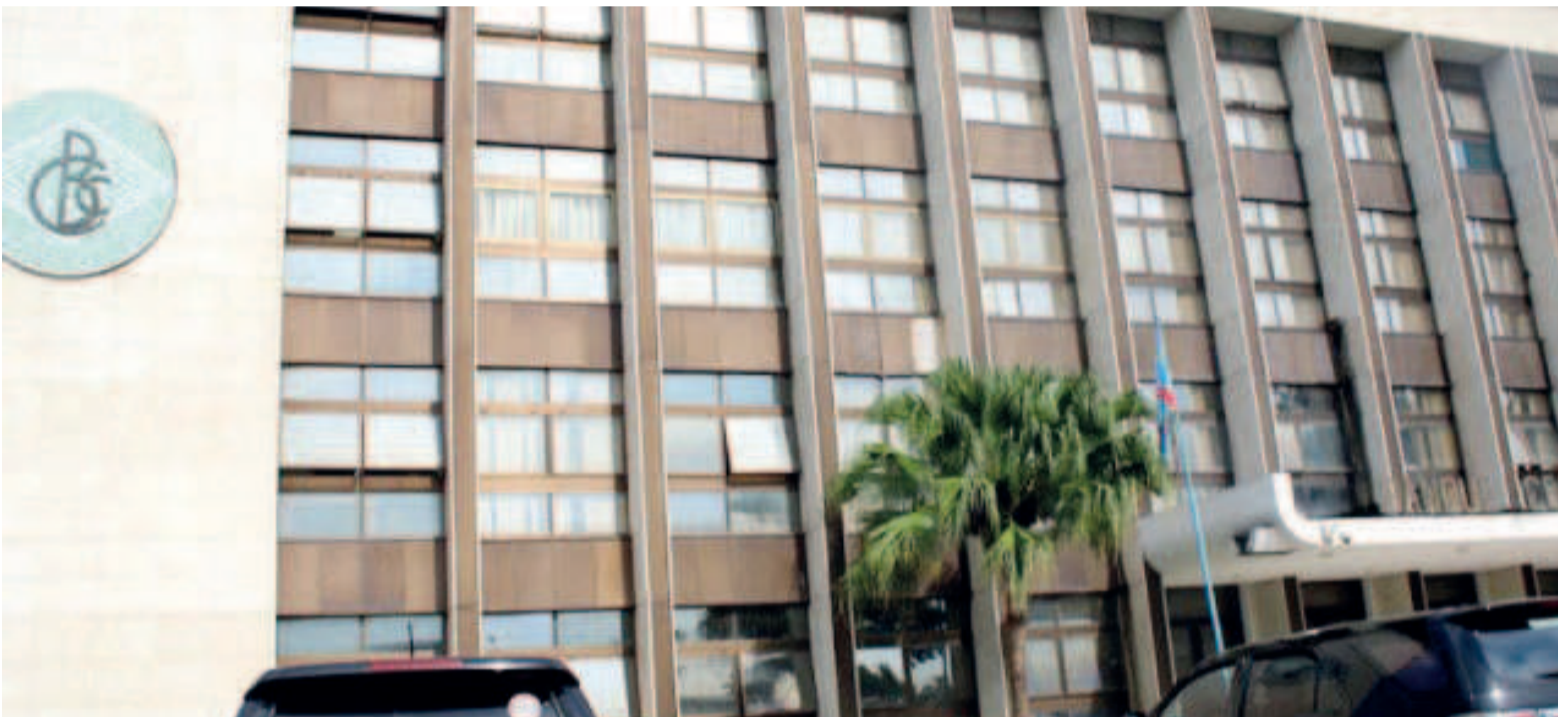
Le siège de la BCC à Kinshasa

Les enquêtes menées par l'Inspection générale des finances (IGF) ont abouti à des conclusions attestant de la « mégestion notamment à la Banque centrale du Congo (BCC) caractérisée par des prélèvements injustifiés sur certaines opérations de paiement de l'état, mais aussi par des cautions versées au profit de l'Etat sans aucune traçabilité. Face à la presse dernièrement, le nouveau patron de l'IGF, Jules Alingete, a affirmé avoir transmis ce dossier à la justice. Des interpellations des personnes impliquées pourraient intervenir incessamment, l'objectif de la démarche étant de décourager tous ceux qui empêchent la maximisation des recettes publiques.