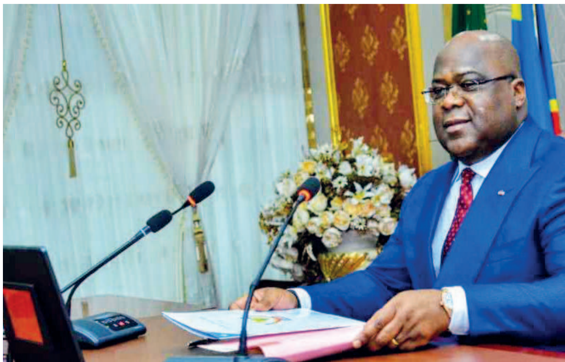
Le président Félix Tshisekedi participe par visionconférence au 40 e sommet ordinaire des Etats de la SADC

Outre la séquence symbolique de la présidence tournante de la Sadc, quelques allocutions ont meublé cette séance inaugurale dont celle du président du Malawi et du Premier ministre du Royaume de Lesotho. Bien avant le début des assises, il a été procédé à la présentation ainsi qu'à l'accueil des nouveaux chefs d'État et de gou-