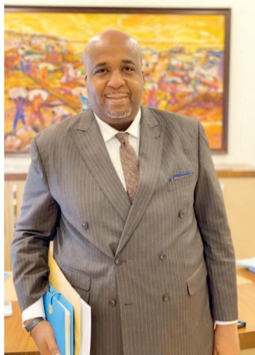
Le ministre des Affaires foncières de la RDC, Sakombi Molendo

Ce projet vient corriger des années des décisions urbanistiques fâcheuses qui ont privé les populations à l'accès au Fleuve Congo et à des espaces verts aménagés. La ville de Kinshasa s'est, par conséquent, repliée sur elle-même tournant ainsi les dos aux innombrables avantages touristiques qu'elle pouvait offrir avec cet atout indéniable qu'est le Fleuve Congo. C'est dire que ce projet est un tournant vers l'avenir qui va impacter un nou-