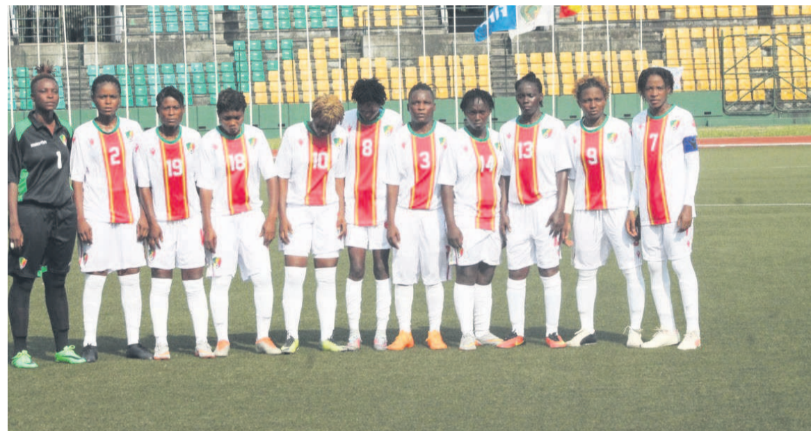
Les Diabes rouges dames U-20/Adiac

La Confédération africaine de football (CAF) a annoncé, le week-end, le report des matchs comptant pour le second tour des éliminatoires de la Coupe du monde féminine des moins de 20 ans prévue du 20 janvier au 6 février 2021 au Costa Rica et au Panama.