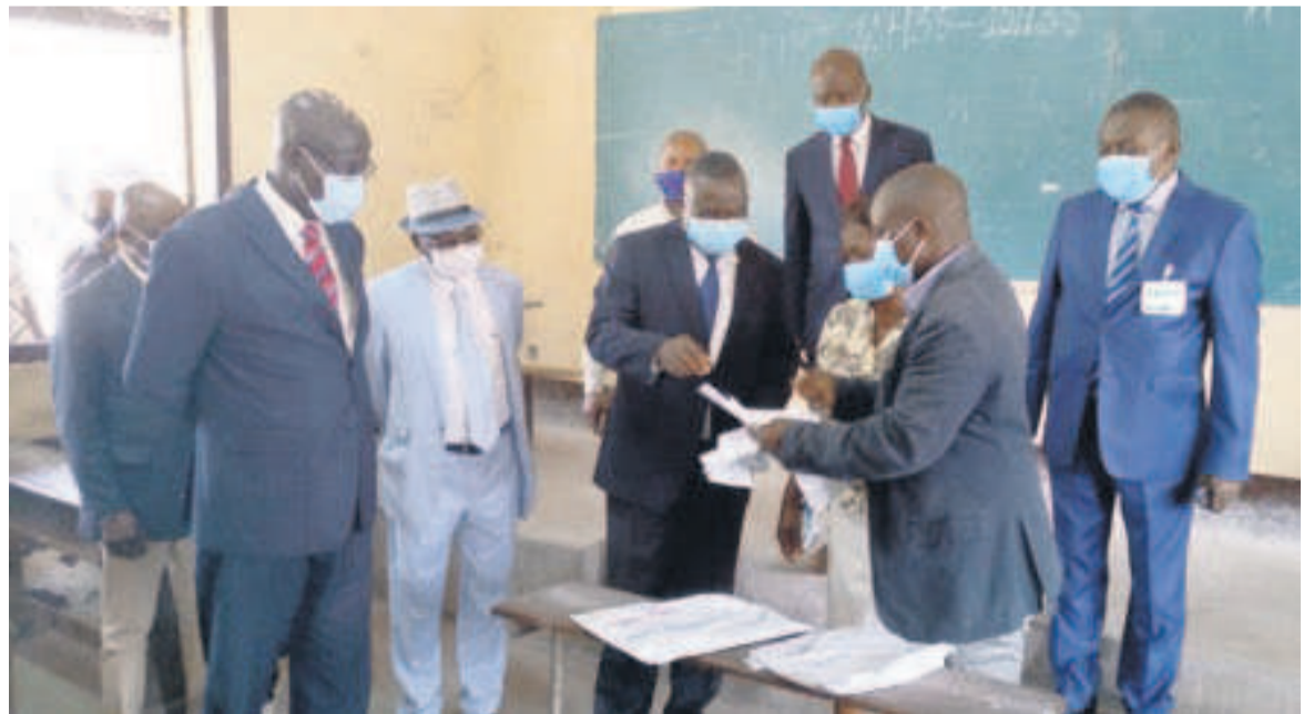
Au centre, le préfet du département de Brazzaville, procédant au lancement des épreuves

Les épreuves ont été lancées le 18 août au même moment que les examens de sortie des écoles de formation professionnelle.