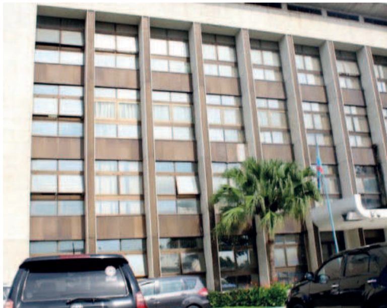
Le siège de la BCC à Kinshasa

Des actes de mauvaise gestion ont été identifiés lors des enquêtes menées par les services de l'IGF à la BCC et au ministère de la Santé.