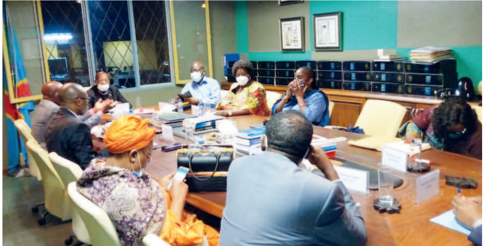
Le bureau politique du Palu en session

de secrétaire général adjoint a.i. et simultanément celle de porte parole du parti en entendant la désignation des animateurs