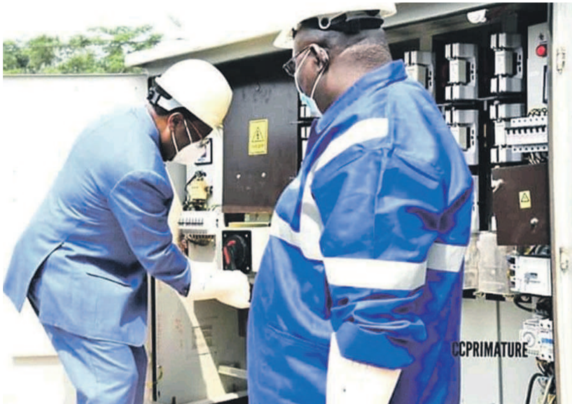
Lancement de la connexion électrique d'Ongogni par le Premier ministre

« Le réseau est fait d'une ligne 33 KV érigée sur 43 km avec deux types de supports pour l'alignement de 567 poteaux électriques avec des dérivations sur deux postes de transformateurs de 630 KW et d'un éclairage public de 6 km »,