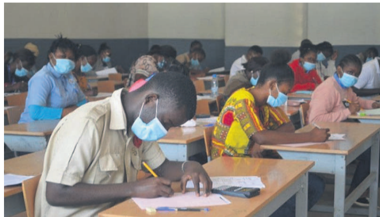
Les élèves lors des épreuves du bac

Quatre jours après l'annonce du premier cas de contamination de Covid-19 dans le pays, les écoles sont fermées sur l'ensemble du territoire national pour éviter la propagation de la pandémie. Le