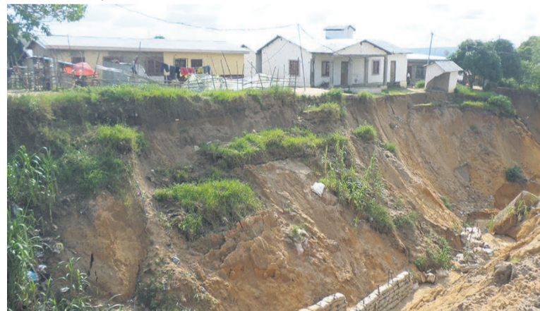
Une pointe d'érosion au quartier Domaine Adiac

systèmes de drainage des eaux pluviales et à la caducité du plan de développement urbain. Une situation qui pourrait s'aggraver à la prochaine saison de pluies d'autant plus que les dernières averses ont laissé un goût amer auprès de nom-