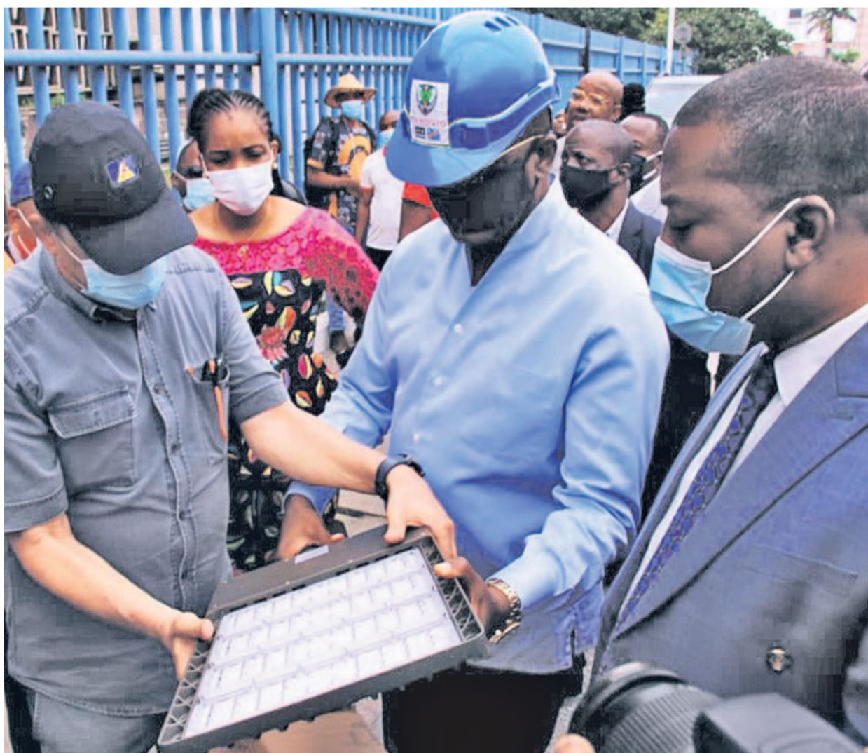
Le gouverneur et le DDK de la Snél, inspectant les lampes à poser.

Le Directeur du département de distribution de Kinshasa (DDK) de la So-