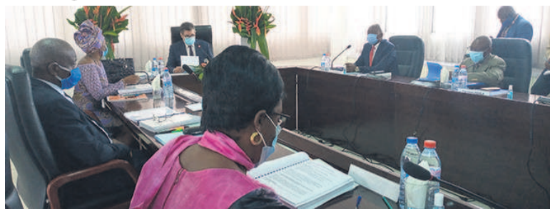
Les membres du Conseil d'administration

La Caisse nationale de sécurité sociale (CNSS) réunie en session bilancielle, le 26 août, a éclairé les membres du Conseil d'administration sur la dette de l'Etat congolais vis-à-vis de cette structure sociale.