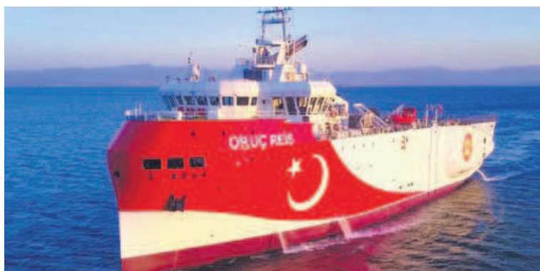
Navire turc d'exploration d'hydrocarbures en Méditerranée orientale

La situation entre les parties concernées a empiré après la signature le 6 août par l'Egypte et la Grèce d'un accord délimitant leurs frontières maritimes. Ankara qui avait signé