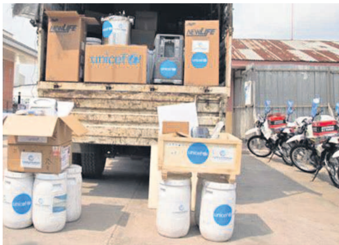
Quelques matériels et équipements de l'Unicef

La signature de cet accord de partenariat, le 25 août, permettra ainsi au Fonds des Nations unies pour l'enfance (l'Unicef) d'assurer la continuité des services d'approvisionnement et de faire en sorte que les produits vitaux pour améliorer la santé, l'éducation, la sécurité et le bien-être des enfants soient réceptionnés, entreposés et expédiés dans les provinces ciblées en toute sécurité. Conformément aux clauses de cet accord, l'Unicef s'engage à renforcer les capacités du PEV en matière de gestion des approvisionnements et de la logistique et d'assurer la gestion du stock, des inventaires semestriels et les opérations de vérifications régulières. Pour sa part, le PEV met à la disposition de l'Unicef