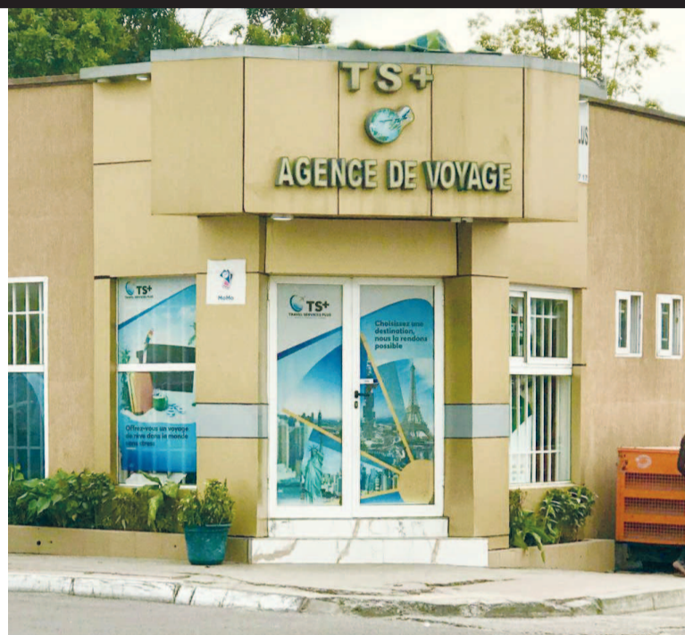
Une agence de la place Adiac

après cinq mois d'inactivité, ce qui a fortement impacté négativement sur nos actions parce qu'au plan social nombreux de nos collaborateurs ont dû être mis au chômage technique », a indiqué Armel Bantsimba, qui évolue dans une agence de voyage. Page 3