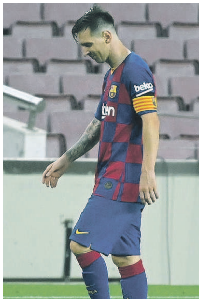
Messi veut quitter le FC Barcelone

Si son départ venait d'être acté, la Pulga aurait écrit en vingt ans les plus belles pages de l'histoire du Barça. Lionel Messi (33 ans) a, en effet, rejoint le centre de formation du FC Barcelone lors qu'il avait treize ans. Il a remporté de nombreux trophées collectifs et individuels avec son club de cœur, notamment quatre Ligues des