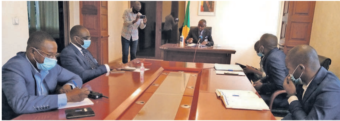
Les initiateurs du E-journalisme lors d'un échange avec le ministre

Le ministre a rappelé aux jeunes d'avoir de bons objectifs et ambitions pour une cartographie des médias en ligne. Il poursuit que ces objectifs et ambitions bien cernés permettront de bénéficier de l'accompagnement des pouvoirs publics. « Le ministère est disposé à accompagner la plate-forme dans le cadre du renforcement des capacités dès que les thèmes de référence de la 2 e édition seront déposés. Vous devez avoir un site web pour devenir un site de référence afin d'avoir l'interférence du gouvernement », a-t-il déclaré.