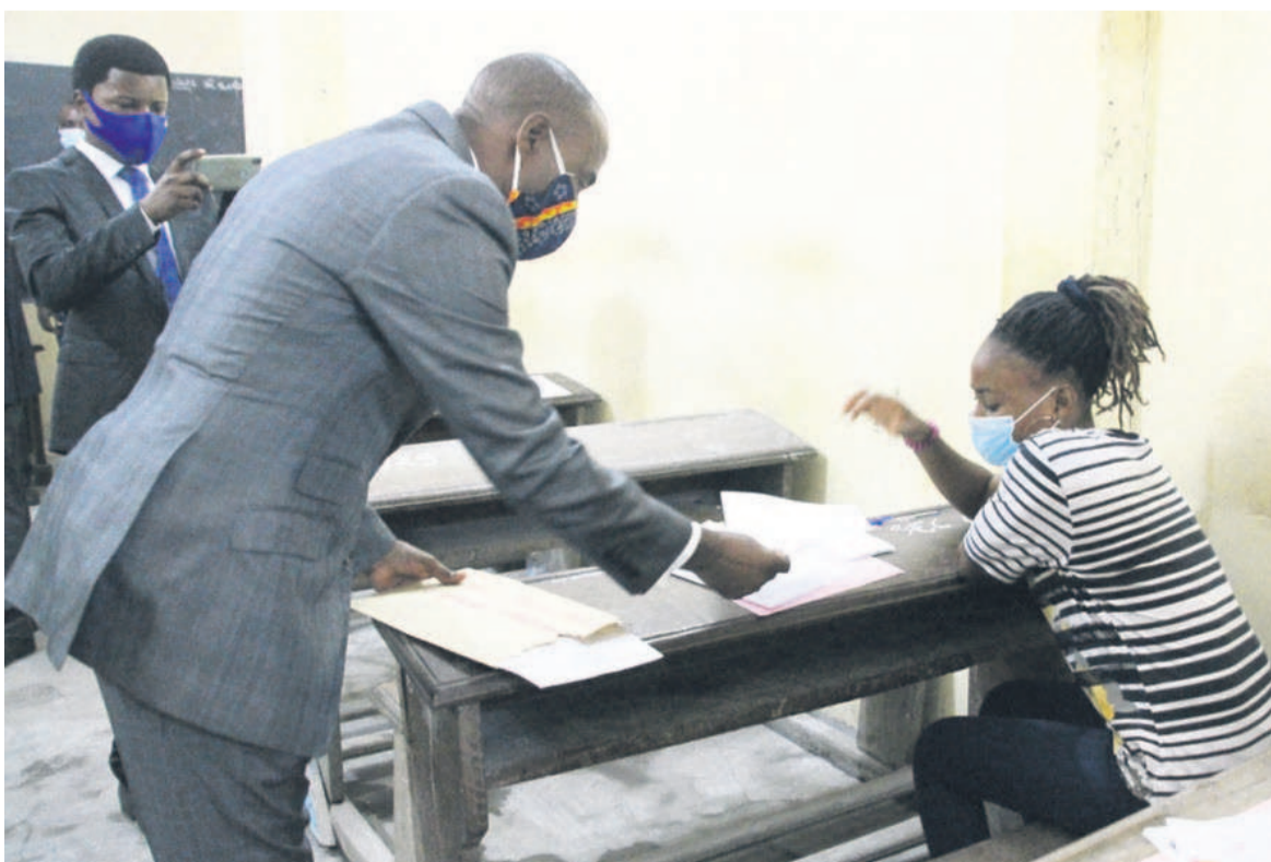
Une candidate recevant la copie des mains du directeur de cabinet du maire de Baongo