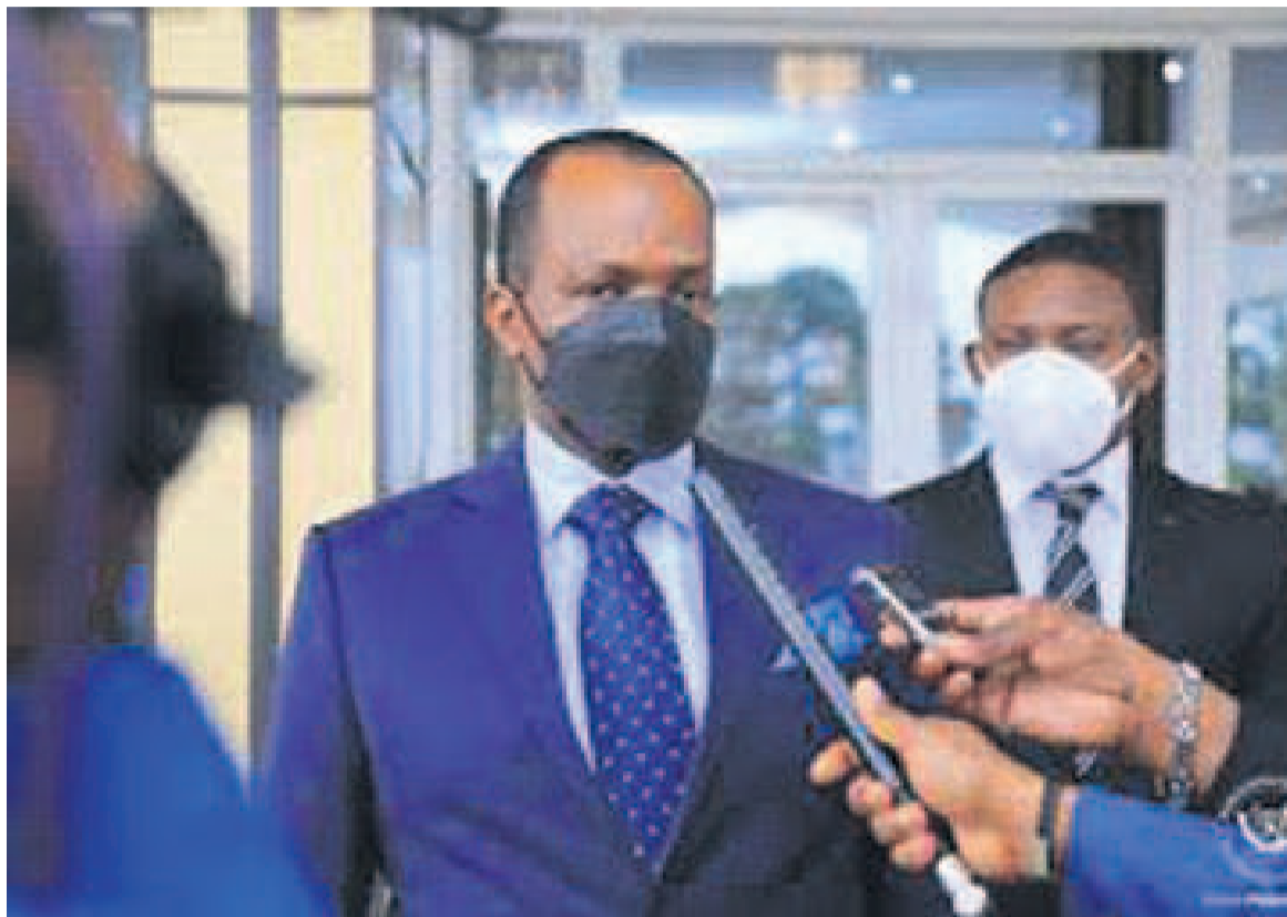
L'ambassadeur rwandais en RDC, Vincent Garega

S'exprimant devant la presse au sortir de l'audience, le diplomate rwandais s'est félicité de l'implication personnelle du président de la République, Félix-Antoine Tshisekedi Tshilombo, dans le processus de pacification et de développement de la région des Grands lacs avec, à la clé, une volonté sans cesse renouvelée de démanteler toutes les forces négatives actives dans cet espace régional parmi lesquelles les