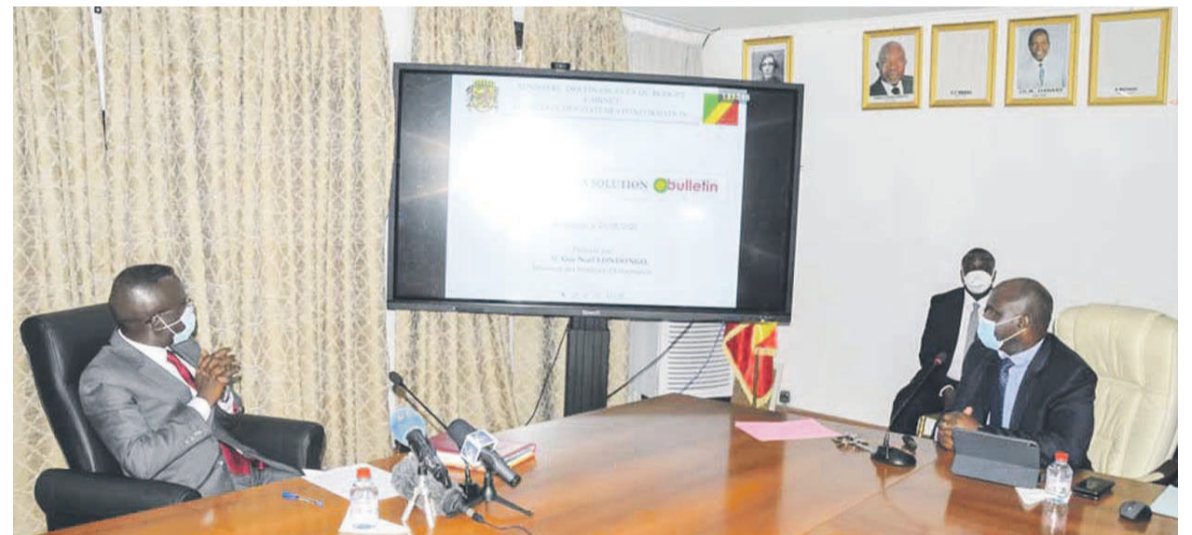
Une vue de la salle au lancement du projet Adiac

Le ministre délégué au Budget, Ludovic Ngatsé, a lancé, le 25 août à Brazzaville, l'application e-bulletin qui consiste à la numérisation du bulletin de paie.