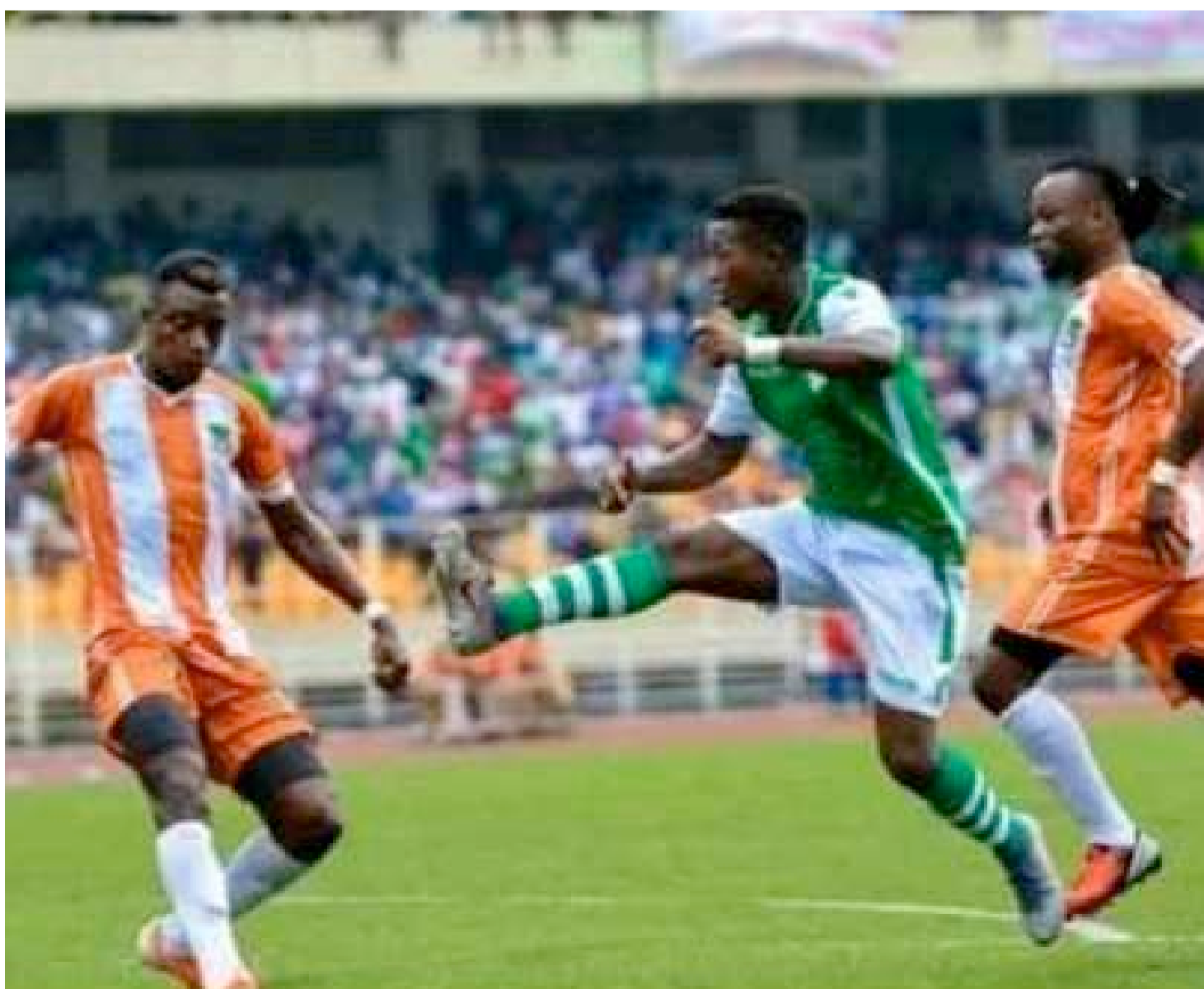
Vue d'un match entre DCMP et Renaissance du Congo (archives)