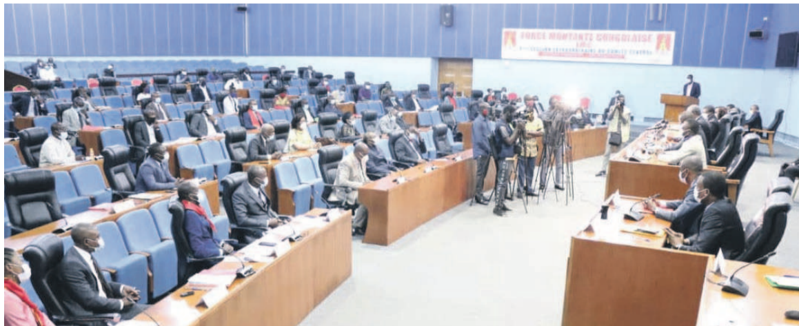
Les participants à la cérémonie d'ouverture de la 3e session extraordinaire de la FMC/DR

Conformément aux recommandations du dernier congrès ordinaire du PCT, tenu du 27 au 30 décembre 2019, son organisation de jeunesse, la FMC, a changé de statut. En effet, organisation affiliée au PCT dès sa naissance en 2013, la FMC se devrait de migrer vers une union catégorielle. « Le 5 e congrès ordinaire du PCT a été un haut moment de bouillonnement créatif qui a engendré nombre de recommandations innovantes dont celle relative à la transformation des organisations affiliées en unions catégorielles. C'est ainsi que, prenant immédiatement en compte cette orientation, les statuts du parti ont créé, entre autres, une union catégorielle de jeunesse, la FMC », a déclaré Pierre Moussa. Selon lui, un parti sans une jeunesse organisée et responsable est un parti sans avenir. Pour représenter l'avenir du PCT, la jeunesse doit cultiver, a-t-il indiqué, les va-