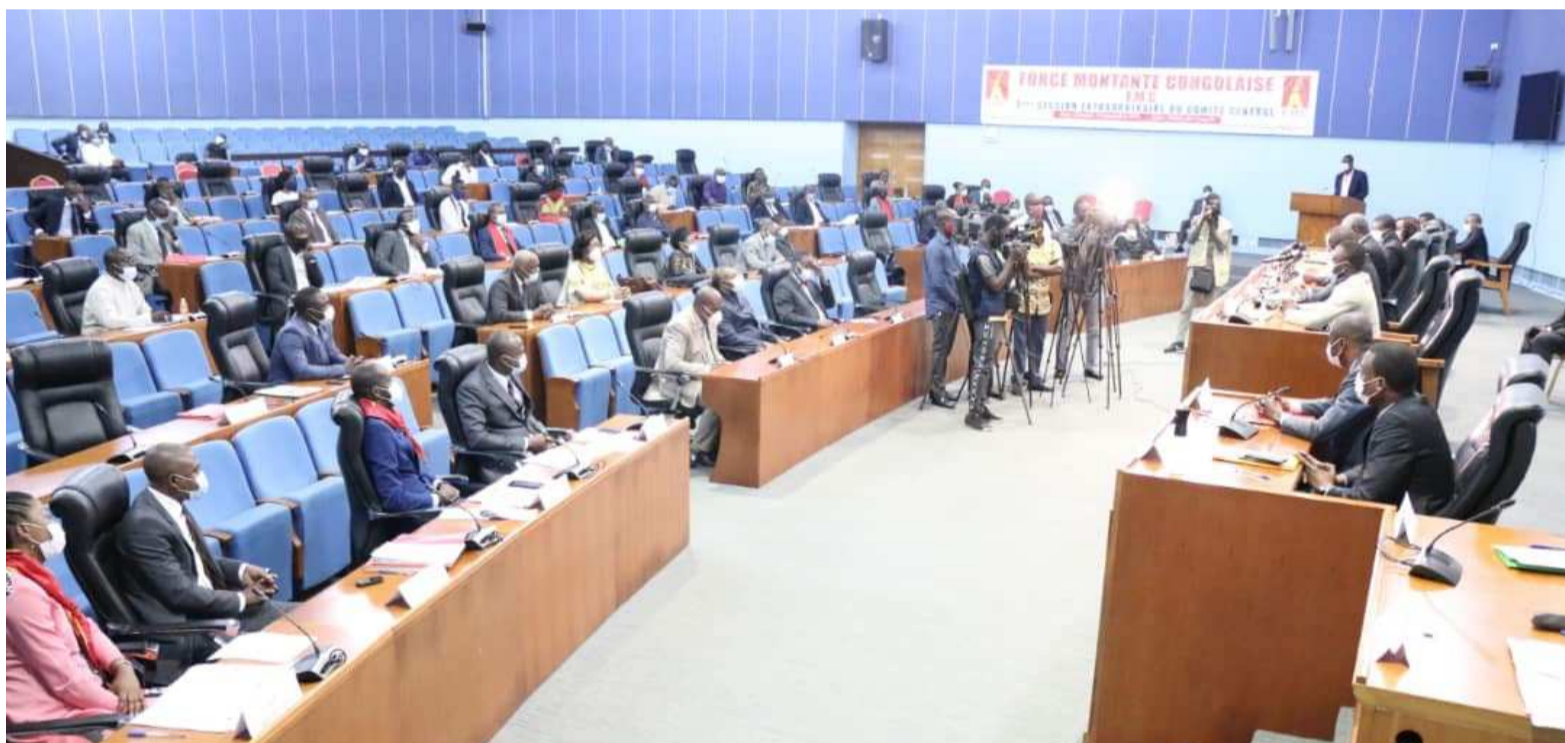
Une vue de l'assistance à l'ouverture du forum sur la gouvernance au Fleuve Congo hôtel