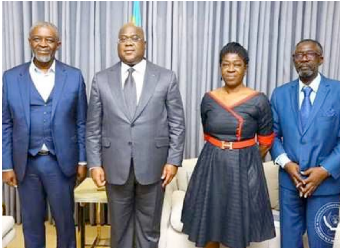
Félix Tshisekedi et les enfants Lumumba.

Le chef de l'État congolais s'est imprégné des avancées réalisées pour le retour des reliques du héros national au pays.