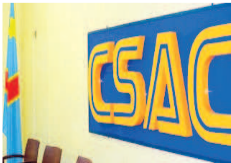
Le logo du Conseil supérieur de l'audiovisuel et de la communication

Dans un communiqué officiel publié le 21 septembre 2020, le Conseil supérieur de l'audiovisuel et de la communication (Csac) a dénoncé des messages de haine tribale véhiculés dans les médias depuis un certain temps. L'autorité de régulation des médias en République démocratique du Congo (RDC) a dit « constater depuis quelques jours les acteurs politiques se servir des radios et télévisions pour distiller dans l'opinion des messages de haine tribale ». Le Csac prévient sur des mesures conservatoires qui seront d'application en cas de récidive à l'encontre de toute personne qui tombera sous le coup de la loi, en véhiculant dans les médias les messages de haine tribale.