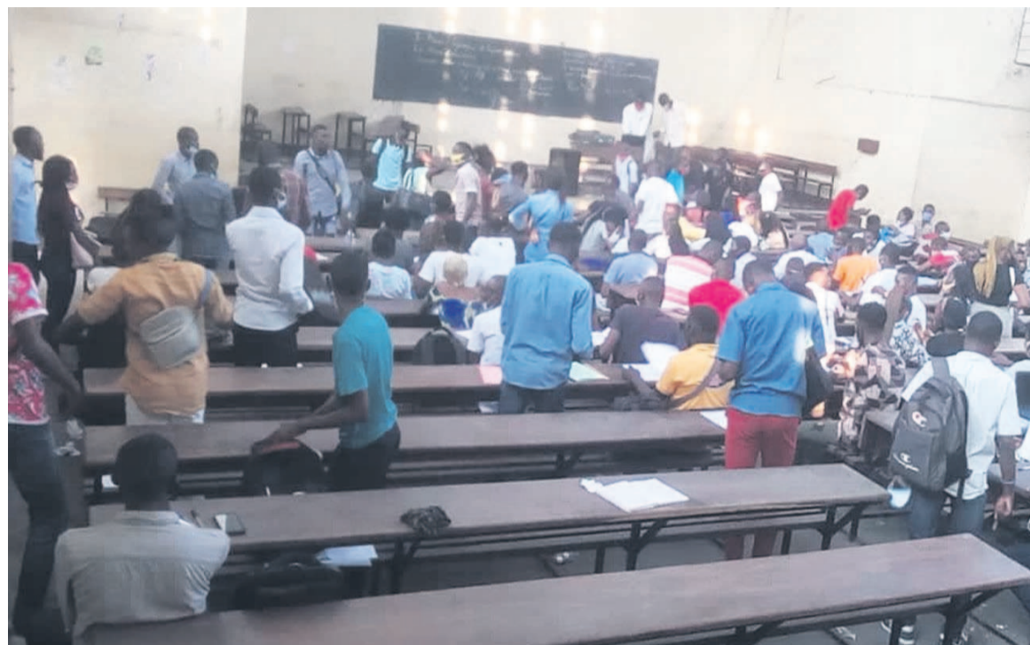
La reprise des cours à la Faculté des sciences et techniques

« Chaque établissement devra s'adapter en fonction des enseignements qu'il dispense, des locaux dont il dispose. Aussi, les plages horaires étendues et décalées doivent être mises en place pour éviter les attroupements », souligne le plan de reprise des activités d'enseignement-apprentissage à