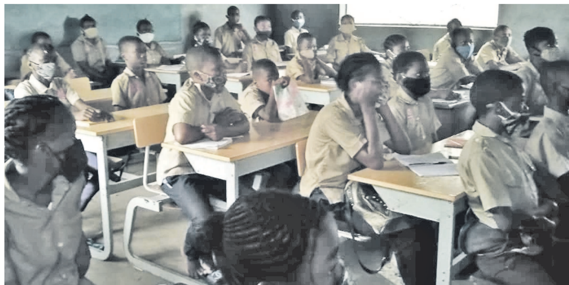
Les élèves du complexe Révolution