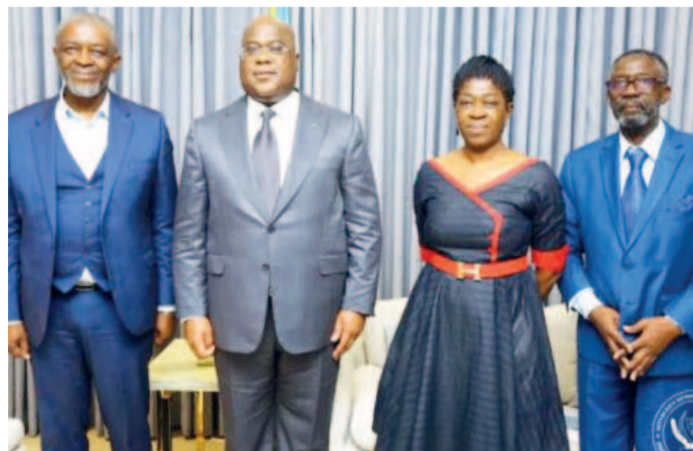
Le Président de la République posant avec les enfants Lumumba

L'audience accordée, le 21 septembre 2020, par le chef de l'État, Félix-Tshisekedi Tshilombo, à la famille du héros de la République démocratique du Congo, Patrice Emery Lumumba, lui a permis de s'imprégner de l'avancement des démarches pour la restitution, par le Royaume de Belgique, des reliques du premier Premier mi-