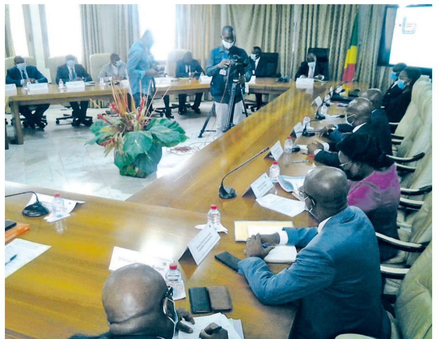
La vue des participants à la réunion

Saluant l'initiative du Congo de rentrer à nouveau dans le processus de notation financière avec une agence panafricaine, le PDG de Bloomfield a signifié que « la notation faite en monnaie locale