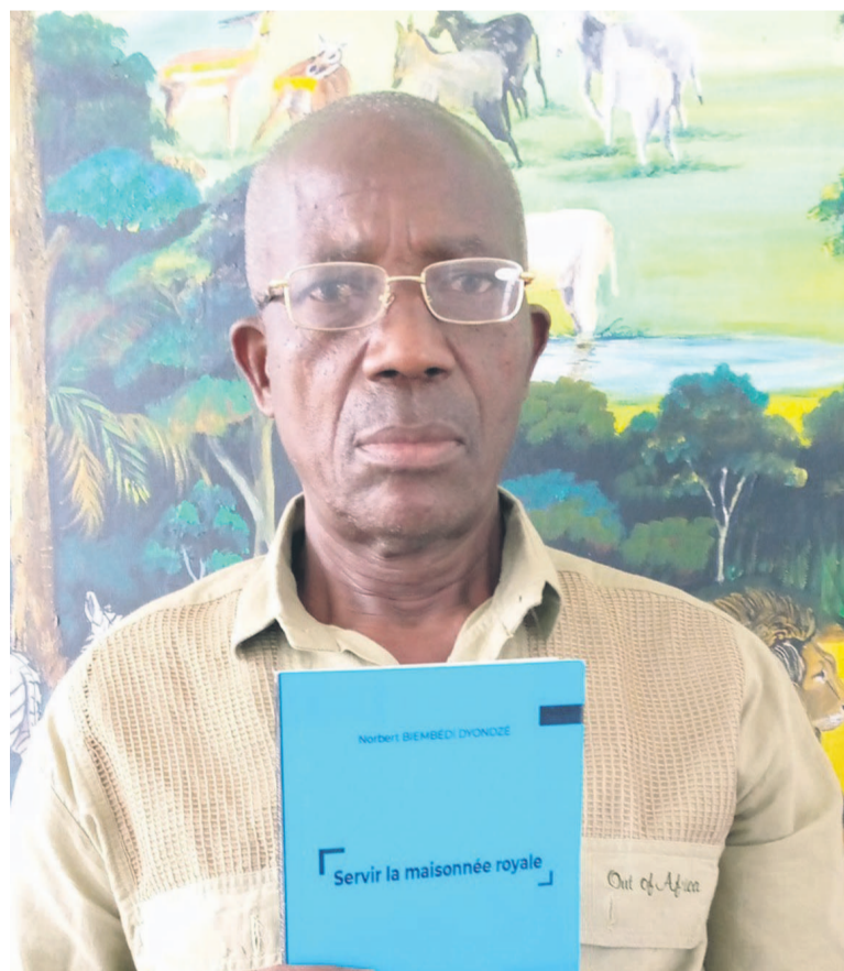
L'auteur de Servir la maisonnée royale

Quand un général d'armée ou même un commandant de troupes n'est pas à son poste