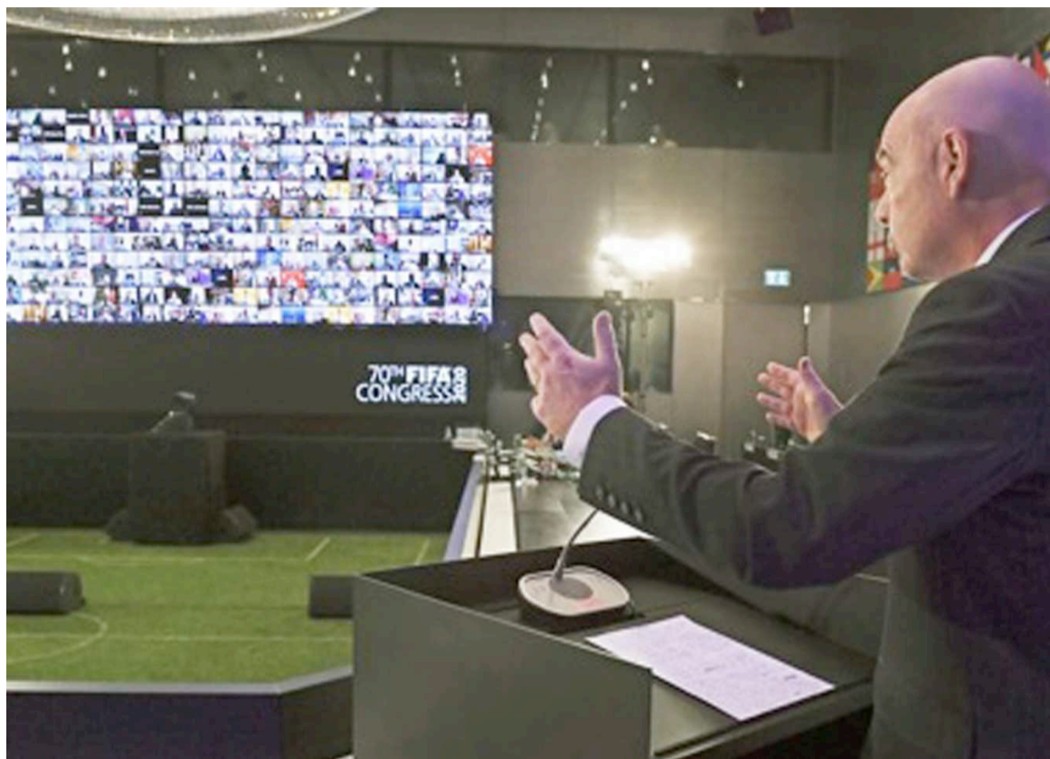
Gianni Infantino, président de la Fifa lors de la 70e congrès tenu en visioconférence

Par rapport aux finances de la Fifa, a-t-on indiqué, elles n'ont véritablement pas été touchées suite à la pandémie, en dehors du fait que 200 millions Usd n'ont pas été encaissés à cause de la non-organisation de certaines compétitions, notamment la nouvelle formule de la Coupe du monde des clubs. Et la Fifa dispose même d'une réserve de 1,5 milliard Usd. Le budget 2019-2022