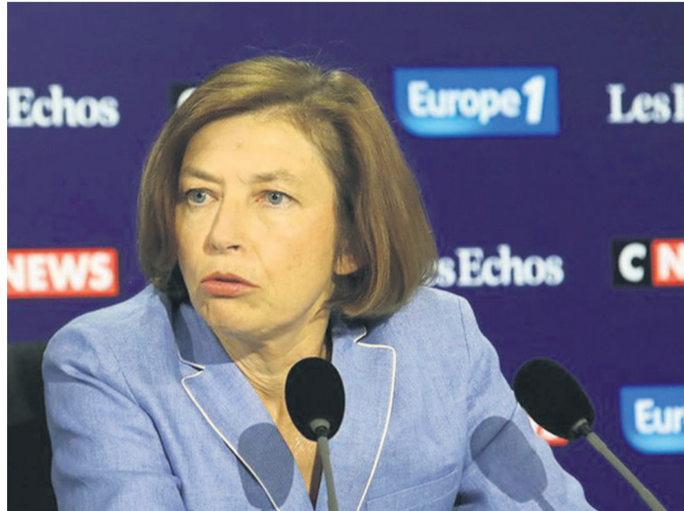
La ministre française des Armées Florence Parly

centre de réflexion américain Rand, il relève que le coup d'Etat intervenu au Mali est « un revers pour la France », qui a lourdement investi depuis sept ans, pour tenter d'aider ce pays à sortir de l'ornière. Devant toutes ces préoccupations, le président Emmanuel Macron, qui entend maintenir la présence militaire française au Sahel, estime que « la lutte contre les groupes terroristes et la défense de la démocratie et de l'Etat de droit sont indissociables ». « En sortir, c'est provoquer l'instabilité et affaiblir notre combat. Ce n'est pas acceptable », poursuit-il.