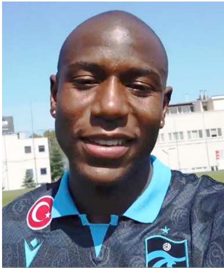
Benik Afobe Tunani

L'on apprend que l'attaquant international Benik Afobe Tunani est prêté à Trabzonspor (D1 Turquie) par son club, Stoke City (D2 Angleterre). Le joueur formé à Arsenal (D1 Angleterre) revenait d'un prêt la saison passée à Bristol City (D2 Angleterre) où il s'était gravement blessé à l'entraînement en septembre 2019 après trois matchs seulement. Mais avant de se blesser, il avait marqué trois buts. Eloigné des terrains presque six mois, il avait déjà été instable depuis deux saisons. En concurrence avec le Néerlandais Alexander Sorloth, meilleur buteur du club la saison dernière, Benik Afobe Tunani doit travailler et s'imposer dans le onze de départ du Trabzonspor.