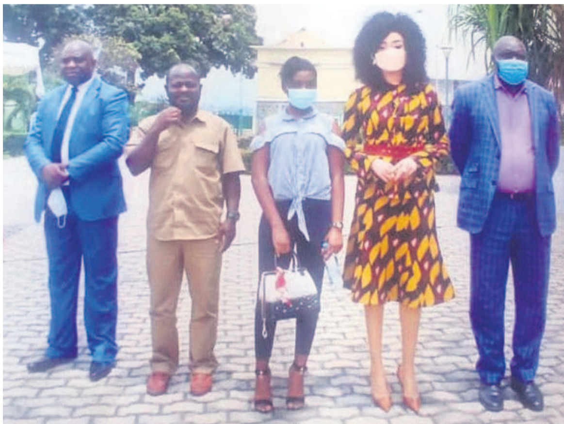
Les professeurs conférenciers posant avec la directrice générale du Mémorial Pierre Savorgnan De Brazza

« Notre analyse critique et prospective du code épistémologique