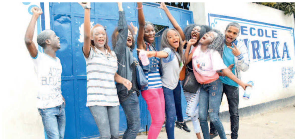
Des lauréats en train de jubiler

C'est depuis le dimanche 27 septembre 2020 que les résultats de l'examen d'État (édition 2019-2020) sont disponibles dans la ville de Kinshasa où le taux de réussite est, cette année, en hausse avec 78% contre 72% l'an dernier. En attendant la publication des résultats pour les options techniques et dans les provinces, Kinshasa a enregistré