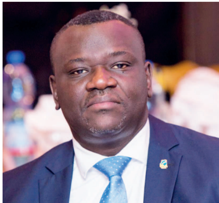
Le ministre des PTNTIC, Augustin Kibassa