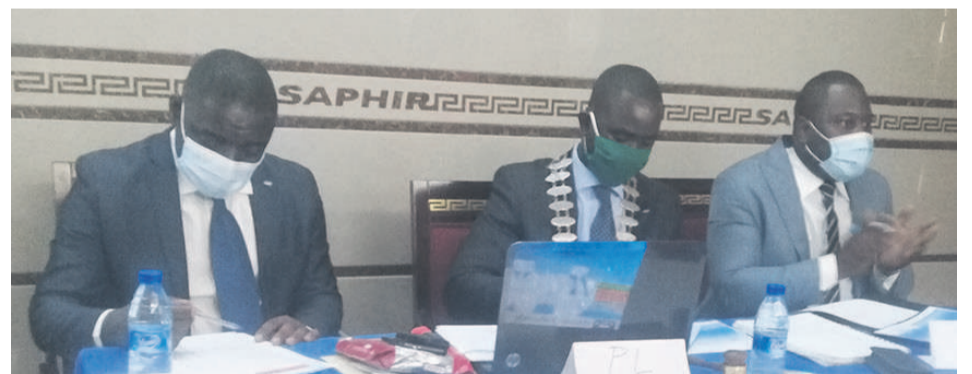
Des membres de JCI-Congo lors de la réunionPhoto

La Jeune chambre internationale (JCI) antenne Congo s'est réjouie, lors de sa 10ème convention tenue le 27 septembre à Brazzaville de son bilan à mi-parcours des activités réalisées courant cette année.