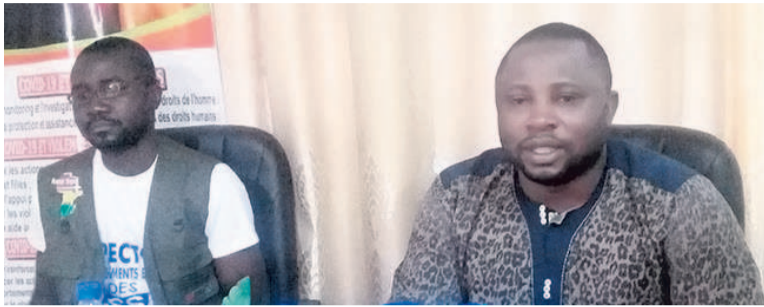
Les animateurs de la conférence

Dans le cadre de la célébration, le 28 septembre, de la journée internationale de l'avortement sécurisé et légal, l'ONG Avenir Nepad a animé, en prélude, une conférence de presse pour édifier l'opinion sur l'ampleur et les dangers du phénomène au Congo. Elle a ainsi plaidé pour un avortement légal et sans risque dans le pays.