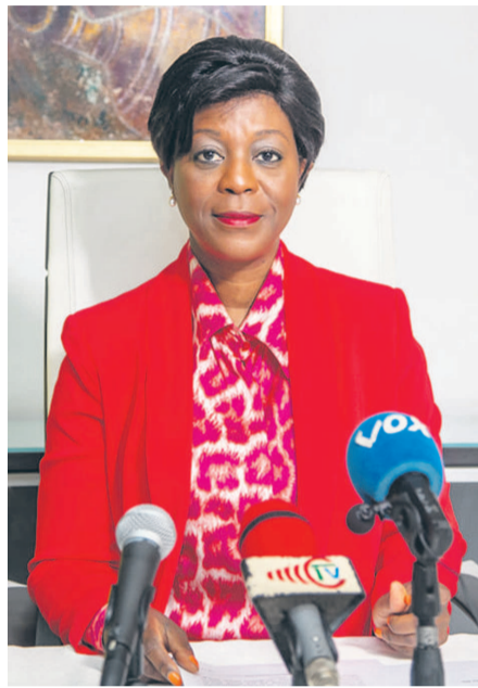
Arlette Soudan-Nonault, ministre du Tourisme et de l'Environnement

La ministre s'est également interrogée sur comment les paysans peuvent s'intégrer dans le développement de ce tourisme ; comment les accompagner dans cette démarche. A propos, elle pense que le gouvernement de la République, dans le cadre de la mise en œuvre de la Stratégie nationale de développement durable du tourisme et du plan national de développement 2018-2022, fait une place de choix au développement de l'écotourisme et du tourisme communautaire. C'est dans ce contexte qu'il ne cesse de multiplier des initiatives avec les partenaires au développement afin de soutenir la création des entreprises touristiques en milieu urbain et rural. « Notre activité touristique est actuellement axée sur le tourisme d'affaires et de congrès. Au vu de la prise d'ampleur de ces formes de tourisme et de la méconnaissance du tourisme rural par un grand public, il apparaît donc nécessaire d'une part de sensibiliser l'opinion publique à l'importance du tourisme rural et de soutenir les différentes initiatives des communautés locales d'autre part. Cette approche ne peut que bénéficier à la population rurale