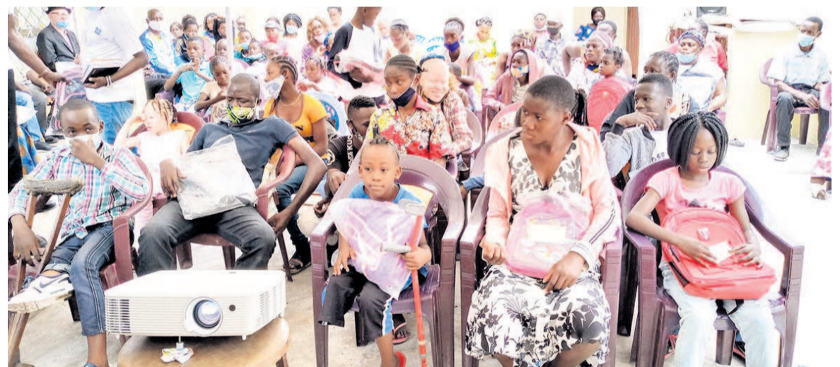
Les récipiendaires (Adiac)

L'Union pour la promotion et le développement des femmes handicapées du Congo (UPDFHC) a remis le 26 septembre, des fournitures scolaires aux apprenants handicapés du cycle primaire et secondaire à deux semaines de la rentrée scolaire.