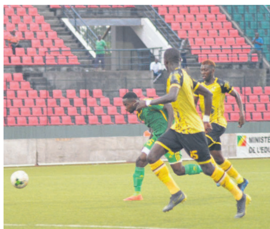
Un match de football