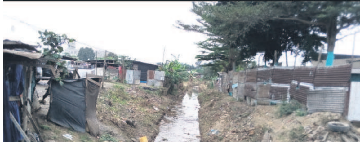
Une vue des collecteurs avant et après les travaux

« Les riverains se rendent compte que le travail qui a été fait est à leur profit, et qu'ils arrêtent de jeter les ordures dans les collecteurs naturels. La société Averda a placé des bacs pour recevoir les ordures ménagères »