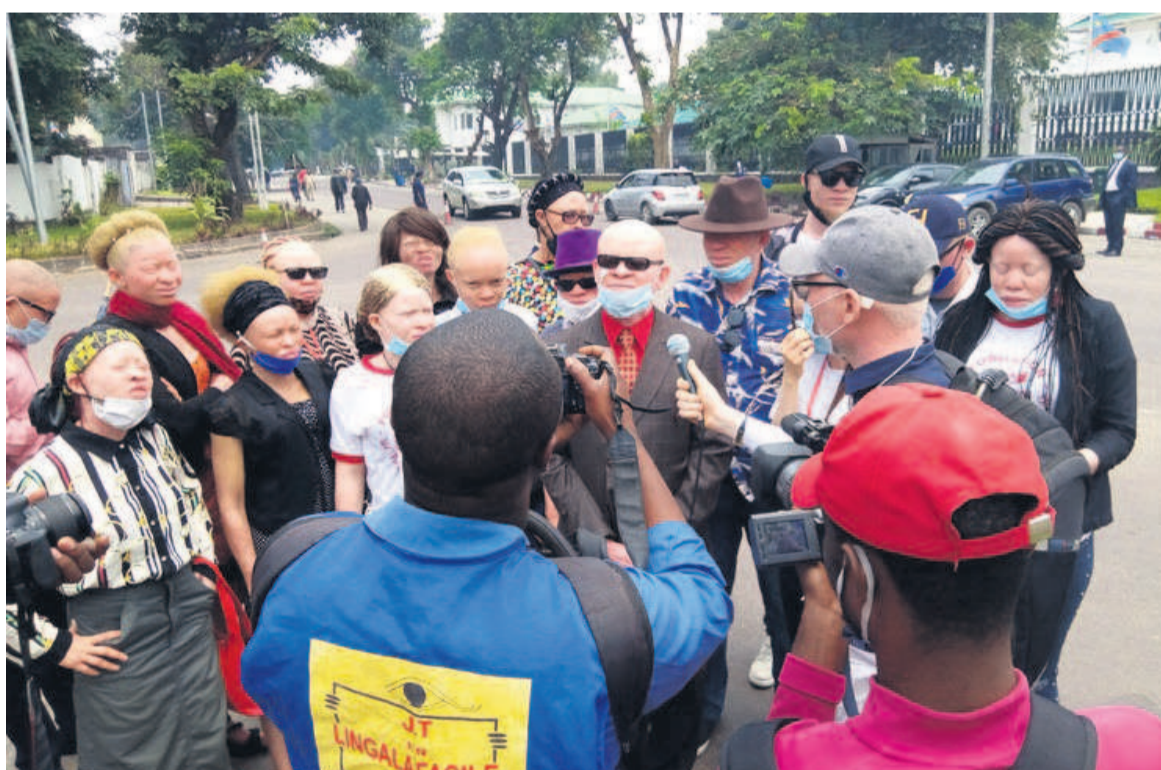
Des albinos de la Fondation Mwimba Texas, devant la Primature

Ces trois composantes regrettent, en effet, que malgré l'engagement volontaire pris par le gouvernement de prendre