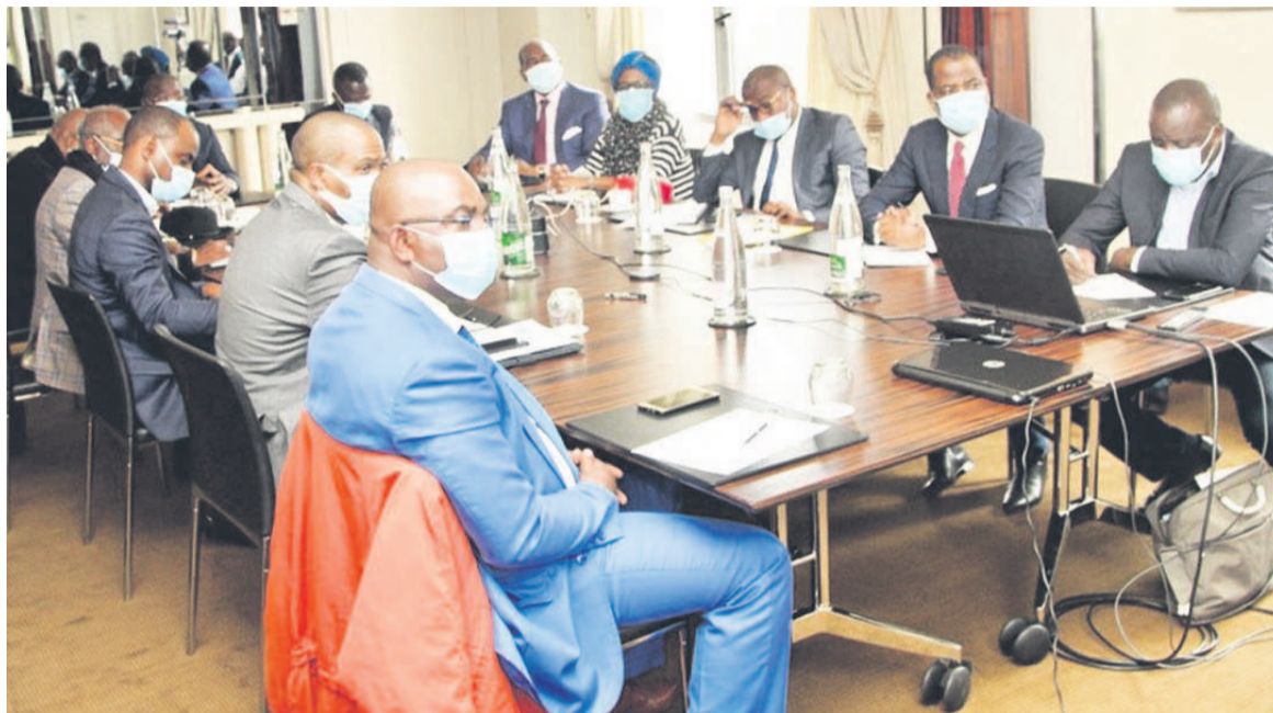
Délégation congolaise conduite par le ministre d'État en charge de l'économie, Gilbert Ondongo aux 13 es assises PPP 2020.

La délégation congolaise ayant opté pour le présentiel limité, elle a eu en ligne de mire de cette participation le lancement de l'Infraweek et autres rencontres avec les décideurs publics, partenaires techniques et investisseurs, la préparation du Symposium de Brazzaville, tel qu'il ressort de la Convention de partenariat liant le CEPROD et le Club des partenariats publics – privés (Club PPP) de France, établie en 2019 et formalisée en janvier 2020.