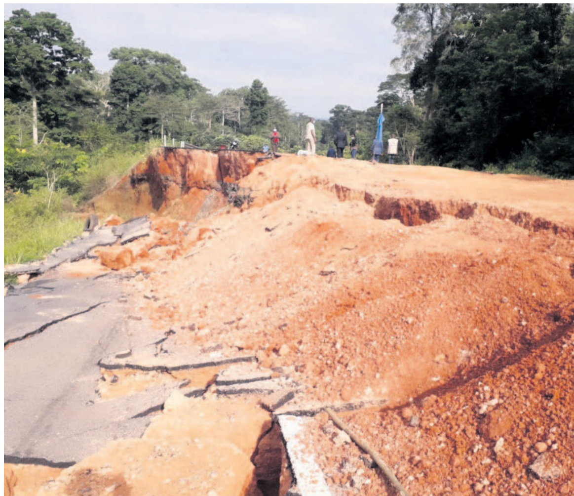
Une des parties effondrées du tronçon

Actuellement, à l'extrême droite du tronçon effondré, les équipes sont à pied d'œuvre pour aménager une déviation qui permet à la circulation de reprendre comme d'habitude à la grande satisfaction des commerçants et des populations des localités environnantes. Le temps d'attendre que la solution soit trouvée. La ministre des Affaires sociales et de l'Action humanitaire, Antoinette Dinga-Dzondo, de passage sur cette route,