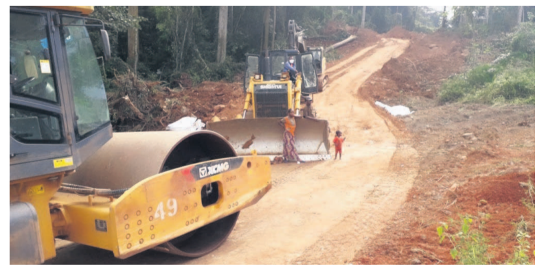
La déviation en cours d'aménagement

En attendant les travaux proprement dits de réhabilitation de la route Ketta-Ntam sur son tronçon Ketta-Sembé qui s'est effondré sur près de 50 mètres, une déviation est en cours d'aménagement afin de faciliter la circulation des personnes et des biens sur ce corridor d'intégration sous-régionale et transfrontalier reliant le Congo avec le Cameroun.