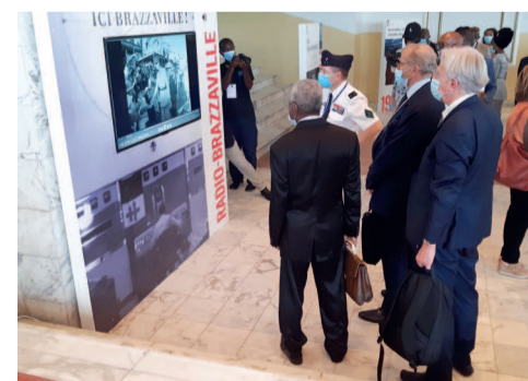
Des visiteurs à l'exposition photos sur De Gaulle