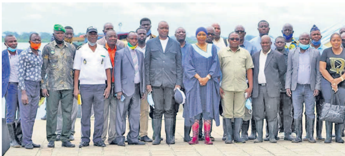
La ministre des Transports et les agents du port de Mossaka

C'est le même constat au niveau du débarcadère de Yoro et du port autonome de Brazzaville, où les agents de police et de la douane imposent des taxes aux usagers. À l'entrée comme à la sortie de ces ports, les commerçants sont obligés de payer des tickets en plus