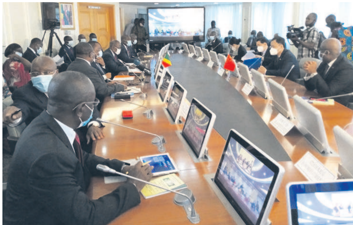
Le déroulement des travaux par visioconférence

A l'ouverture des travaux, l'ambassadeur de Chine au Congo, Ma Fulin a fait le point de la coopération entre les deux pays, « soutenue fortement par le Forum sur la coopération Chine-Afrique », qui, selon lui, a contribué à « la transformation qualitative » du Congo, à travers la construction des infrastructures dans divers