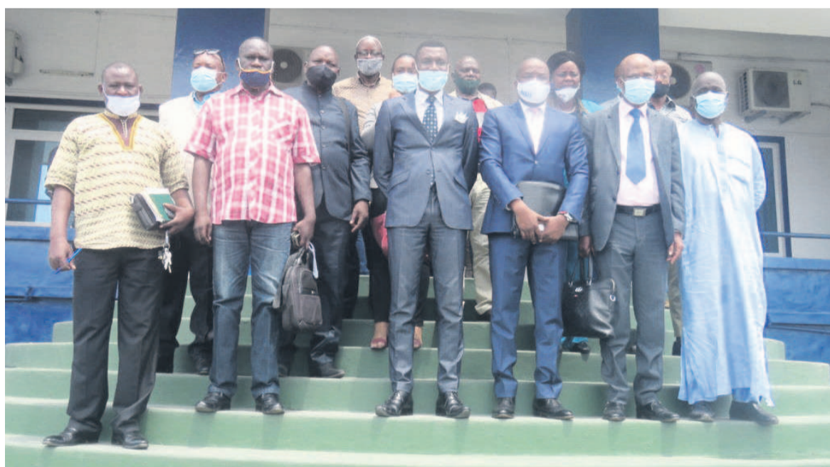
Photo de famille de la rencontre