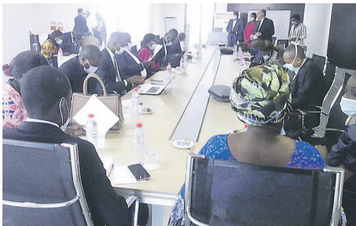
Réunion préparatoire du comité pharmaceutique et thérapeutique du CHU/Adiac

Parmi les principaux problèmes d'inefficacité ainsi que d'utilisation incorrecte des médicaments on peut citer entre autre