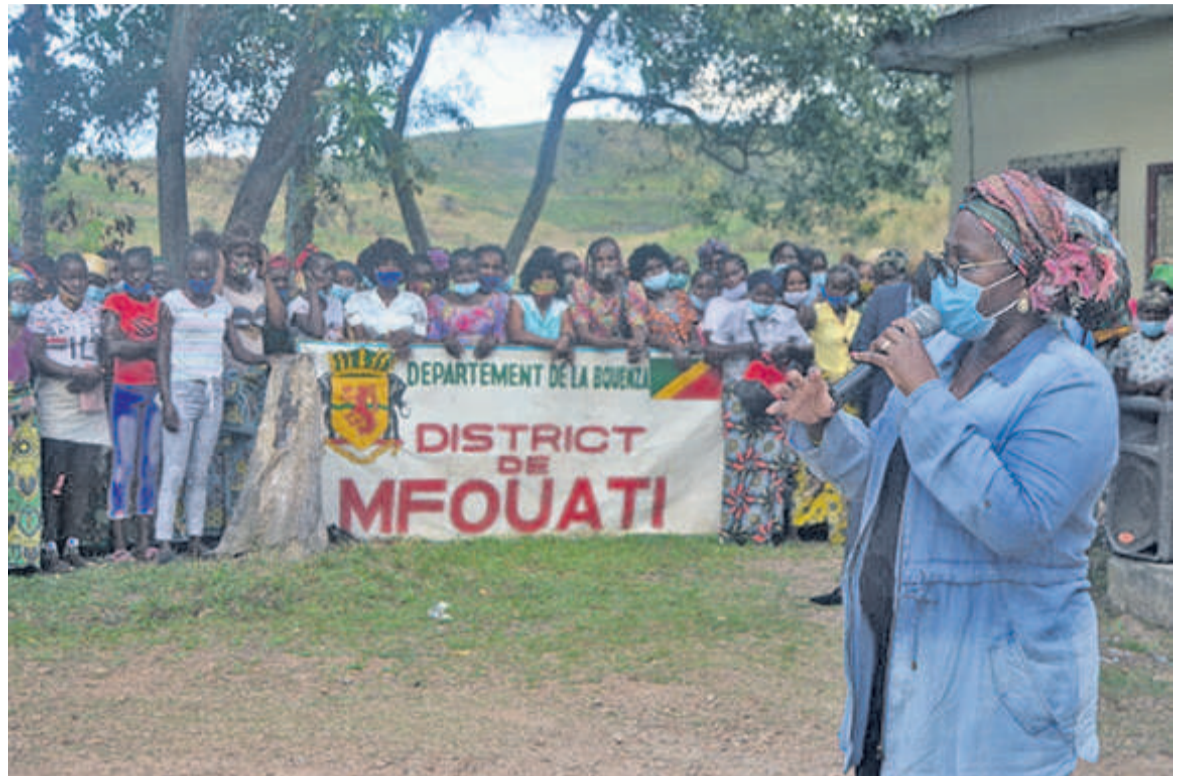
La ministre en charge de la Promotion de la femme exhortant à la diversification des groupements