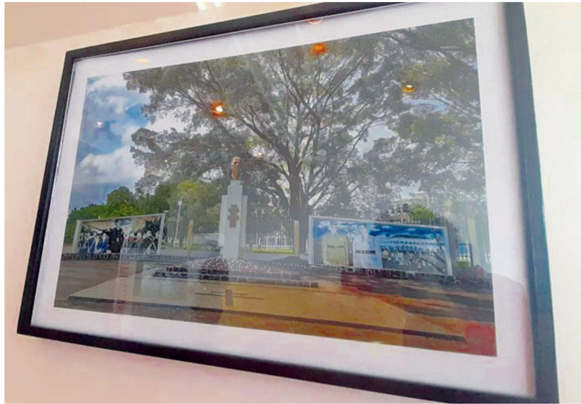
Un cliché du square De Gaulle/Adiac

Outre les clichés d'époques géants et autres documents d'archives évoquant le rôle joué par Radio Brazzaville en 1940, cette exposition dévoile les photos des différents lieux emplis d'une empreinte du passage du général de Gaulle à Brazzaville. Elles relèvent de l'époque ancienne et sont en noir et blanc. Parmi elles, on