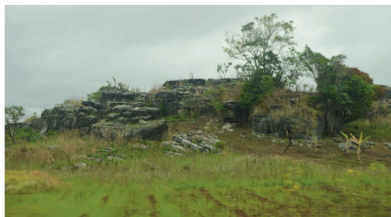
Une montagne couverte de calcaire dans la Bouenza

La Société agricole de raffinage du sucre du Congo implantée à Nkayi, dans la Bouenza, s'est dotée, il y a quelques années, d'une