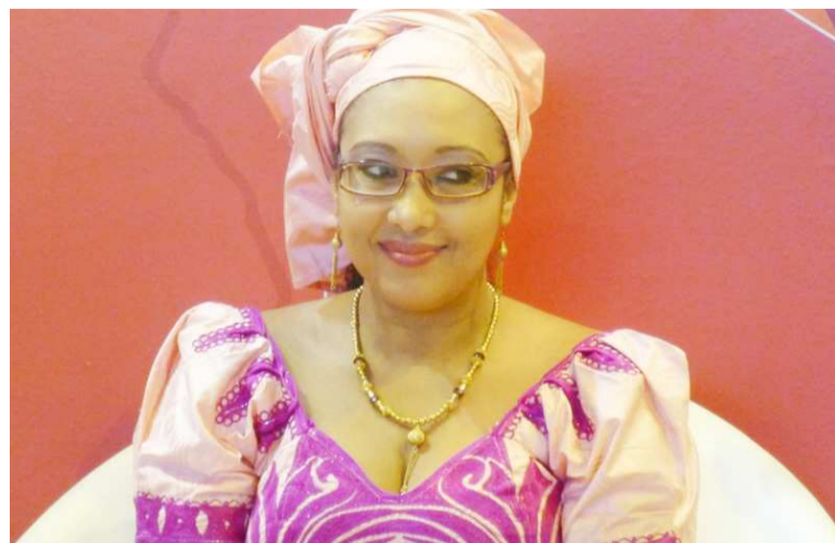
Djaïli Amadou Amal

Pour le Prix Goncourt des lycéens 2020 sous le haut patronage de l'Académie Goncourt, organisé par le ministère chargé de l'Éducation nationale en partenariat avec la Fnac et le Réseau Canopé, la plume trempée aux «vertus peules» de Djaïli Amadou Amal a été distinguée. Cette «voix forte, sincère, révoltée», s'est exprimée une nouvelle fois encore