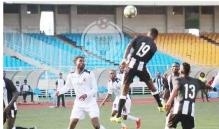
RCK a favorablement piégé Don Bosco au stade des Martyrs