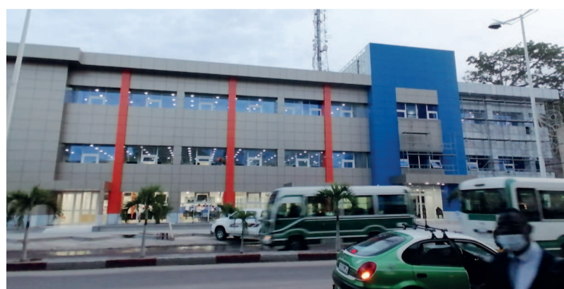
Le siège de Congo Télécom en cours de réhabilitation