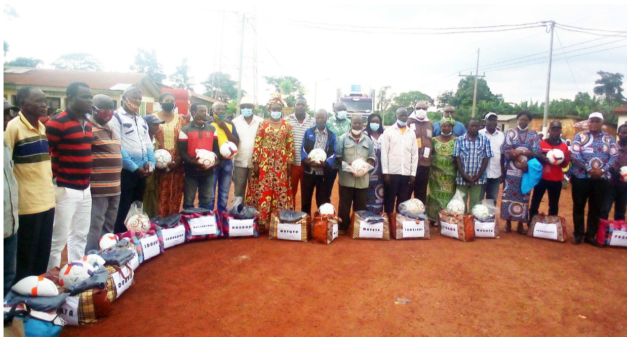
Les membres de la délégation du MAR posant avec les représentants des équipes

Le Mouvement action et renouveau (MAR) a récemment offert des équipements sportifs à la sous-ligue et aux dix-sept équipes de la sous-préfecture de Mayéyé, dans le département de la Lékoumou.