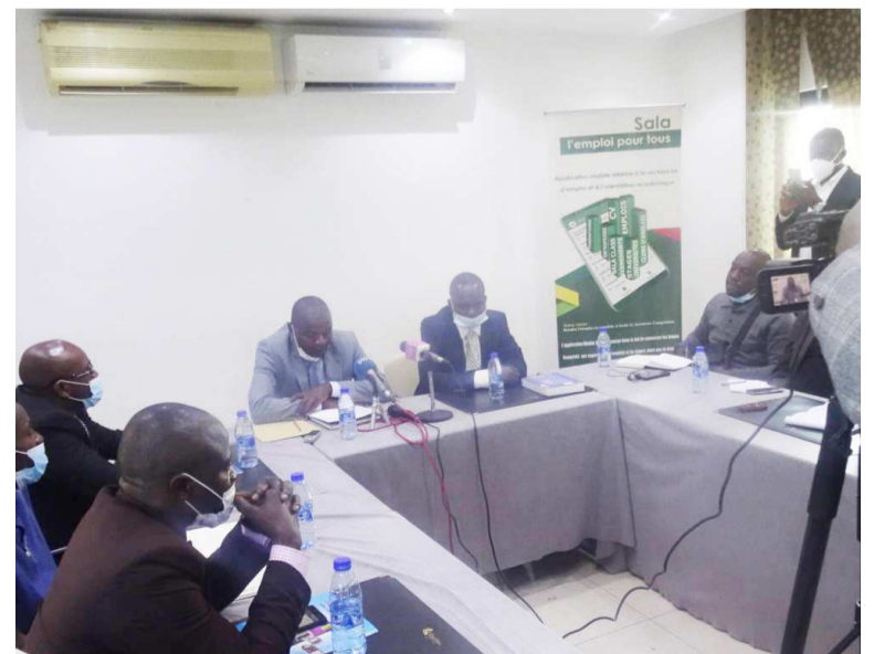
Les deux plateformes face à la presse

À noter qu'à partir de 2004, le chef d'État congolais a initié le programme de municipalisation accélérée qui a permis de doter le pays d'infrastructures modernes. L'objectif est non seulement d'interconnecter les chefs-lieux à leurs sous-préfectures, mais aussi d'améliorer les conditions de vie des populations. Ces chantiers, d'après l'auteur Jean-Jacques Bouya, ont conduit à une transfiguration profonde du pays et à un bond en avant au point de corriger le déficit infrastructurel qui