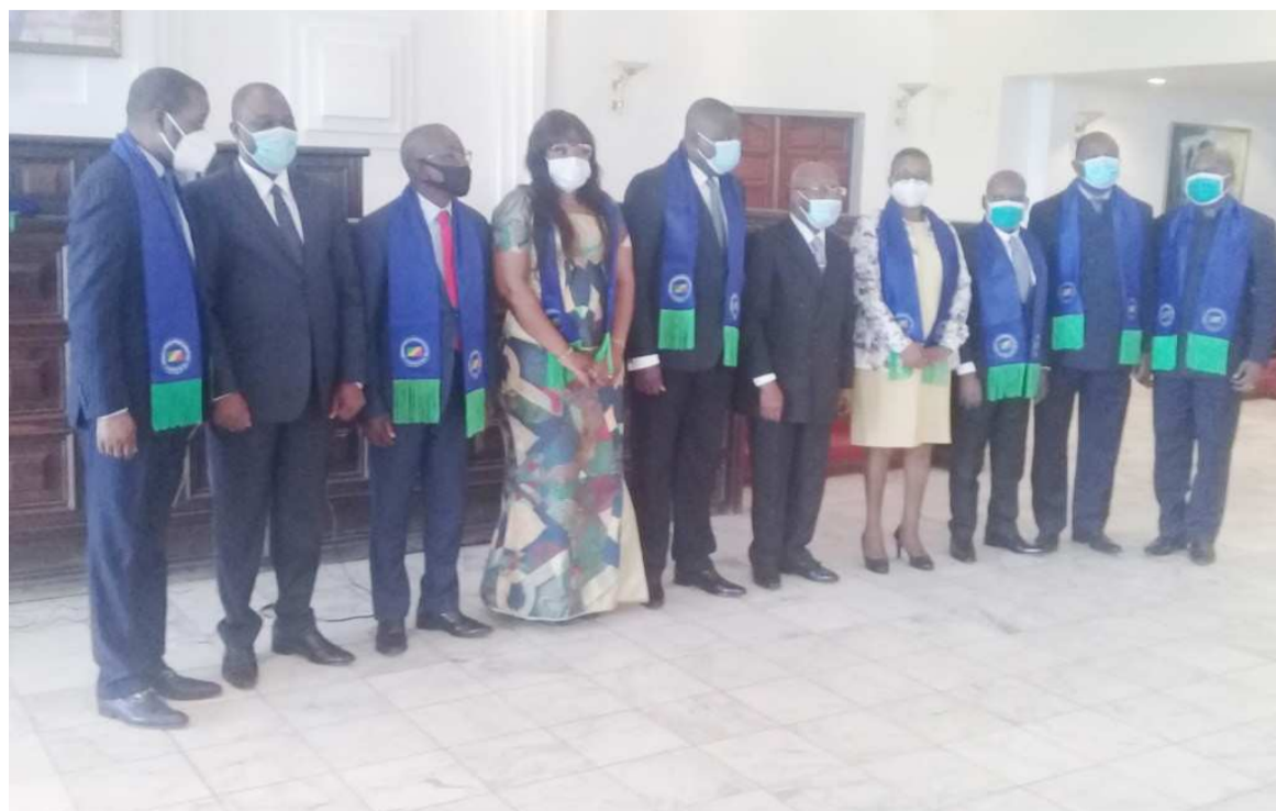
Les administrateurs maires des arrondissements, membres du comité d'honneur des comités d'alerte

Le Conseil consultatif de sages et des notabilités traditionnelles a lancé, le 8 décembre à Brazzaville, le projet d'interconnexion de ses réseaux. Un cadre d'éveil dans les quartiers pour prévenir les conflits à l'approche des élections.