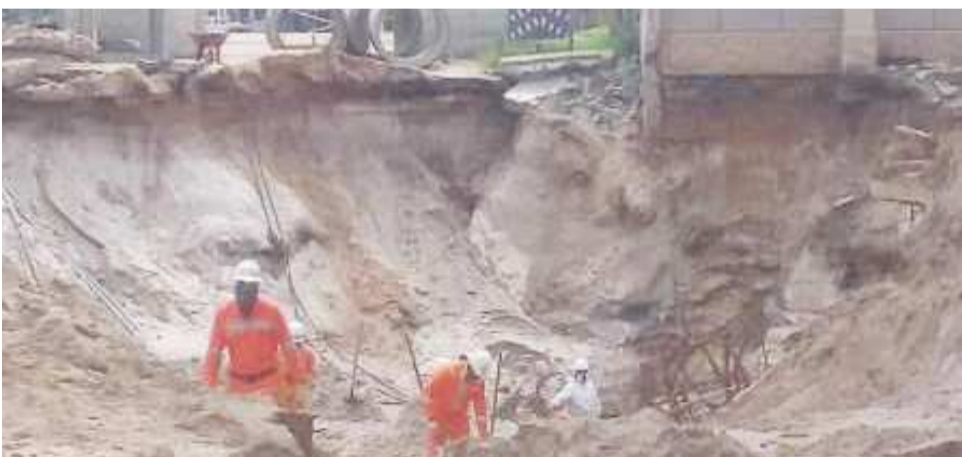
Une vue des travaux

Dans la ville de Pointe-Noire, pendant la pluie, les canaux d'évacuation des eaux sont saturés et les habitations inondées.