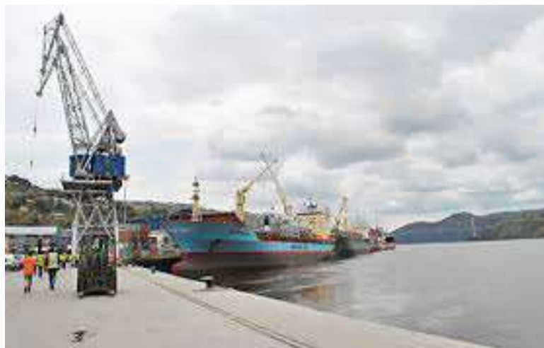
Une vue du port de l'ex-Onatra à Matadi

seulement un manque à gagner considérable pour la SCPT et le Trésor public, mais aussi le danger sécuritaire au pays. « Les navires sont déviés vers les ports privés. Ces navires