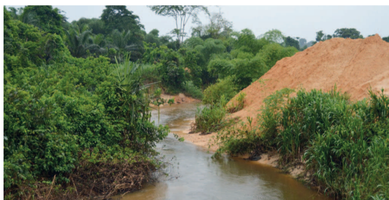
Une montagne de sable se déversant dans une rivière

Le développement de l'activité minière dans le département du Kouilou inquiète les populations riveraines, notamment celles du district de Kakamoeka confrontées aux inondations causées par des coulées de boue et de sable provenant des chantiers miniers.