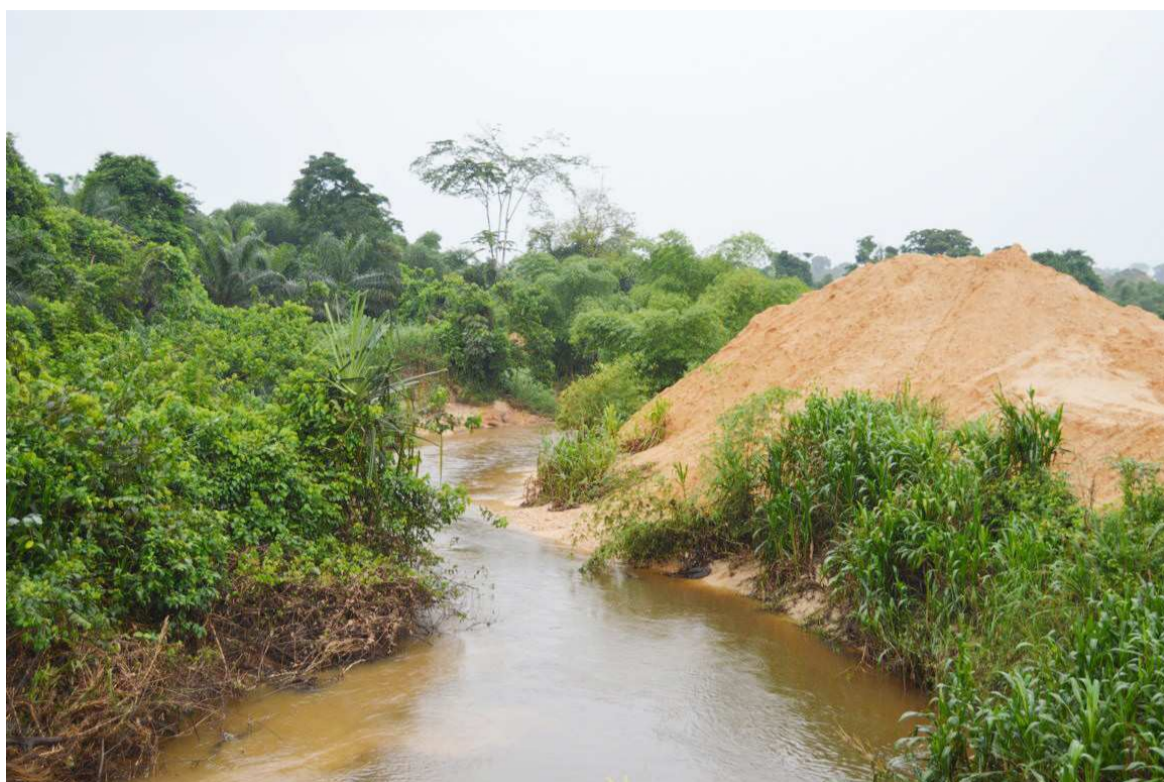
Une montagne de sable se déversant dans une rivière

fet, les carrières d'exploitation des matières premières sont installées non loin des rivières. Les montagnes sont percées, la terre creusée et le sable déversé dans les cours d'eau. Lorsqu'il pleut, les grandes rivières bouchées ne peuvent plus recevoir les eaux venant des petits ruisseaux. Les villages se trouvent ainsi inondés. Les populations sinistrées tournent leur regard vers les pouvoirs publics pour demander l'aide humanitaire. Pour Alexandre Mabila, il y a nécessité d'y remettre de l'ordre. Avec les temps qui courent au lieu que les pouvoirs publics dépensent des sommes colossales pour secourir les sinistrés à chaque pluie, il est mieux de demander aux sociétés minières de curer les lits des rivières tout en exerçant leurs activités. Dans le district de Mvouti, les