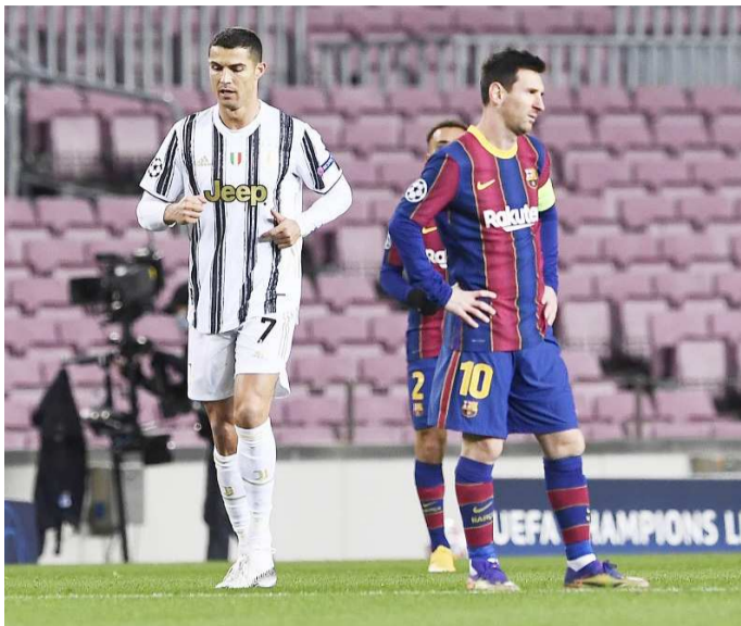
Cristiano Ronaldo et Messi ne s'étaient plus croisés sur un terrain depuis le départ en Italie du Portugais

L'accolade entre les deux légendes vivantes du football mondial, juste avant le coup d'envoi, était trompeuse : c'est un vrai duel à distance que se sont livrés les deux stars. Messi aussi, de quelques frappes en dehors de la surface (23e, 47e) a alerté l'éternel gardien de la «Vieille dame», Gianluigi Buffon (43 ans