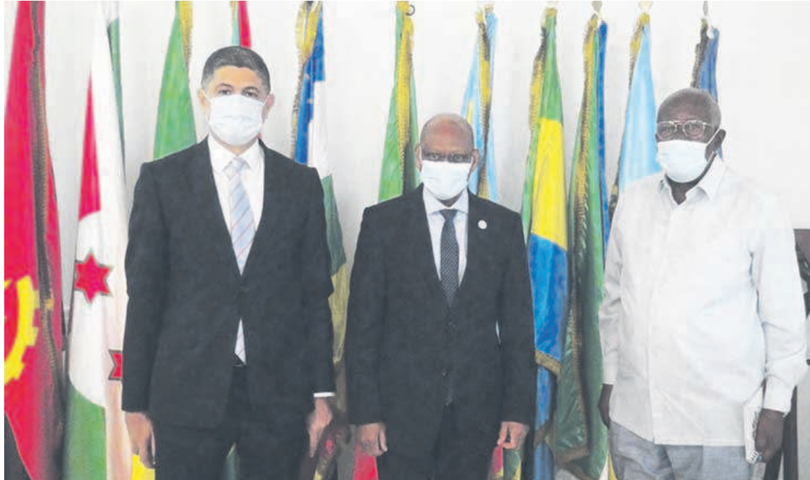
La photo de famille immortalisant la rencontre

Les deux diplomates ont échangé sur les questions qui préoccupent la région d'Afrique centrale, notamment celles liées à la paix et la sécurité, gage de développement de l'espace CEEAC. En ligne de mire, la République centrafricaine avec la prolifération des groupes armés qui écument les villes et villages avec le cortège des pillages des richesses de ce pays et des milliers des déplacés qui ont trouvé refuge dans des pays voisins. Gilberto Da Piédade Verissimo et Seif Kandeel ont également évoqué la situation à l'Est de la République démocratique du Congo où les bandes armées font la loi. Sans oublier les velléités sécessionnistes dans la partie anglophone du Cameroun qui menacent l'intégrité territoriale du pays et les agressions répétées de la nébuleuse de Boko Haram contre le Cameroun et