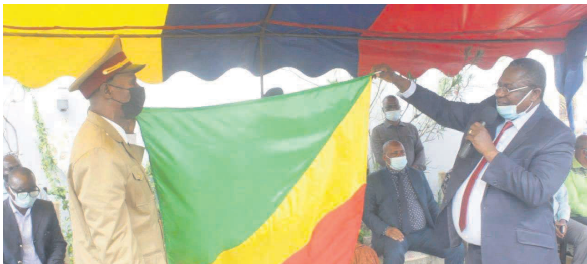
Le maire de Mongo-Mpoukou, remettant le drapeau national, symbole de commandement au chef de quartier

kou, n'a pas hésité de rappeler à ces deux impétrants les missions assignées à un chef de quartier, celles de relayer l'action de l'administrateur maire dans toutes ses composantes à la base, effectuer le recensement administratif de la population chaque année, veiller au bon ordre et à la sécurité des personnes et des biens, à la tranquillité et la salubrité de l'espace public, procéder aux règlements à l'amiable des différends, procéder à la restructuration des zones et blocs dans les meilleurs délais.