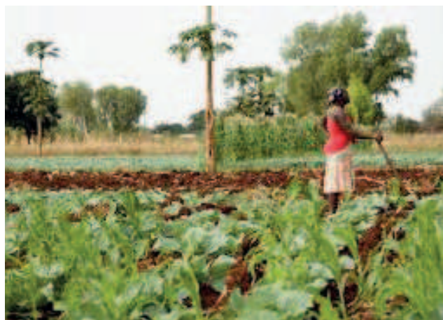
Un site de maraîchage au sud de Brazzaville

L'Organisation des Nations unies pour l'alimentation et l'agriculture (FAO) a sensibilisé le 25 janvier à Kintélé, dans la banlieue nord de Brazzaville, 1407 élèves des établissements scolaires publics (primaire et secondaire), de Brazzaville, du Pool, du Kouilou, de la Bouenza et de la Lékoumou à la résolution des problèmes liés à l'insécurité alimentaire et nutritionnelle.