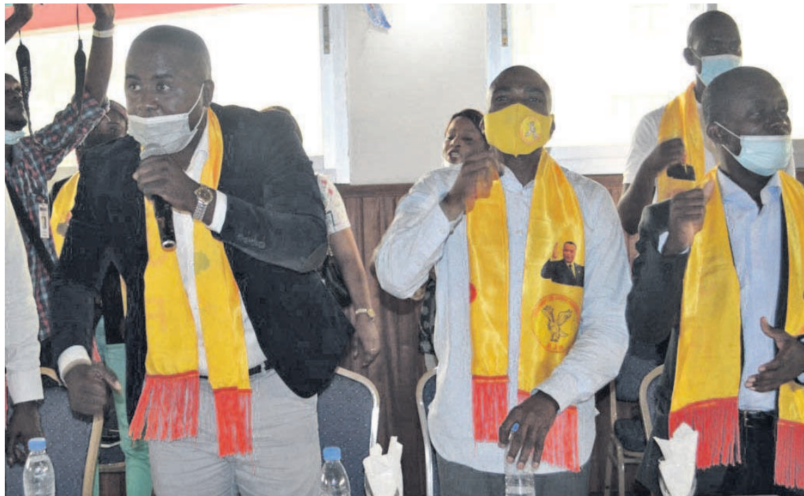
Les membres du bureau du MJP Brazzaville/Adiac

« Chers camarades, ce moment nous permet de vous rassurer notre confiance car vous êtes notre force et nous al-