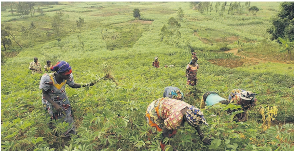
Un site de maraîchage au sud de Brazzaville