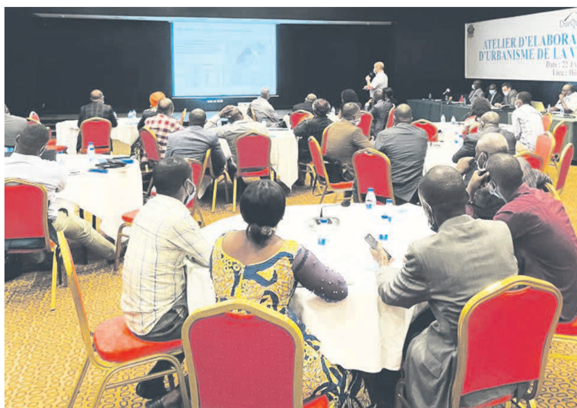
Les participants lors de la présentation du rapport

Pour ce qui est du scénario « étalement urbain », sa probabilité d'occurrence résulterait de grandes difficultés de la part des autorités à contrôler l'occupation du sol et la production de nouveaux lotissements avec un étalement urbain important